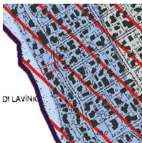
Stralcio della tav. B del PTPR