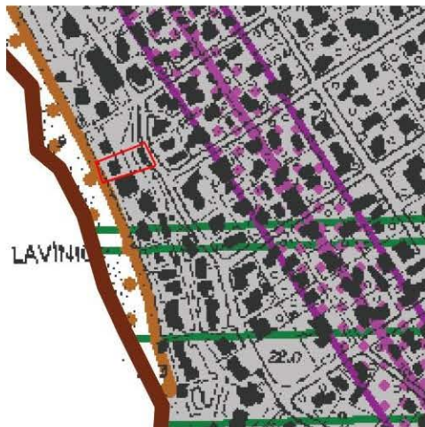
Stralcio della tav. C del PTPR

L'area su cui sorge l'edificio di cui è parte l'immobile pignorato rientra in area vincolata, ovvero nella casistica prevista dagli articoli del D.lgs. N. 42/04 (codice paesaggistico).