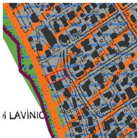
Stralcio della tav. A del PTPR