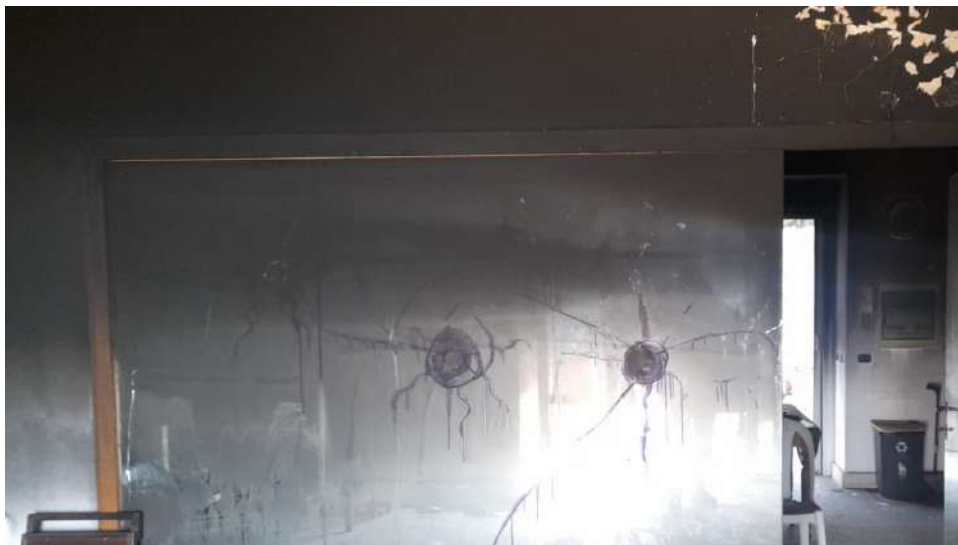
Foto 10 – Altra vista interna fabbricato oggetto di esecuzione (post-incendio).