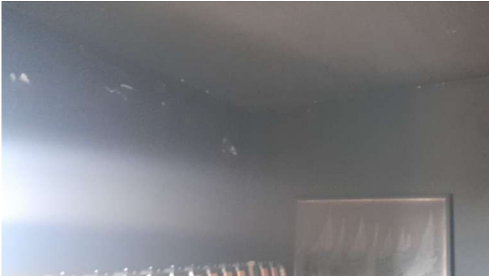
Foto 21 – Altra vista interna fabbricato oggetto di esecuzione (post-incendio).