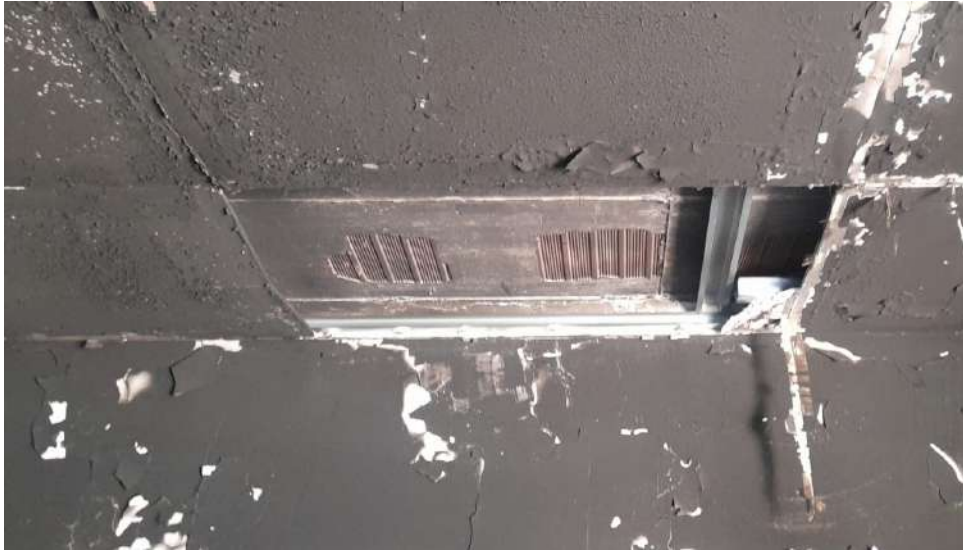
Foto 25 – Altra vista interna fabbricato oggetto di esecuzione (post-incendio).