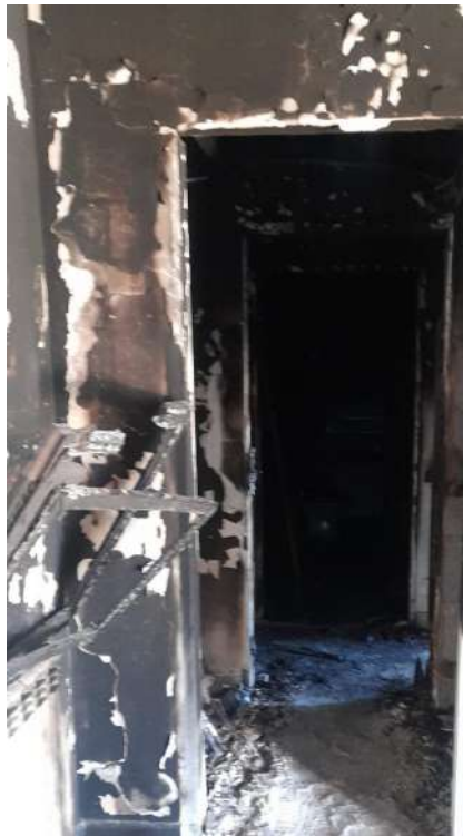
Foto 16 – Altra vista interna fabbricato oggetto di esecuzione (post-incendio).