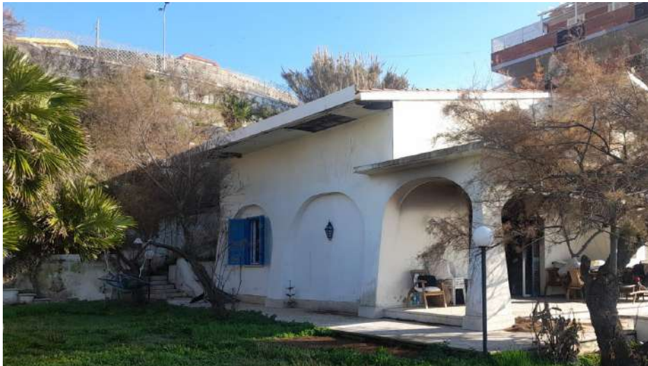
Foto 4 – Altra Vista esterna fabbricato oggetto di esecuzione (post-incendio).