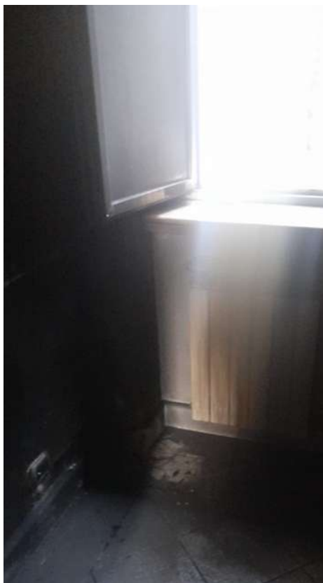
Foto 22 – Altra vista interna fabbricato oggetto di esecuzione (post-incendio).