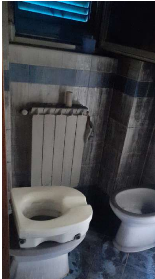
Foto 12 – Altra vista interna fabbricato oggetto di esecuzione (post-incendio).