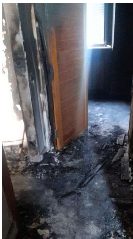
Foto 20 – Altra vista interna fabbricato oggetto di esecuzione (post-incendio).