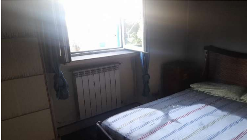
Foto 11 – Altra vista interna fabbricato oggetto di esecuzione (post-incendio).