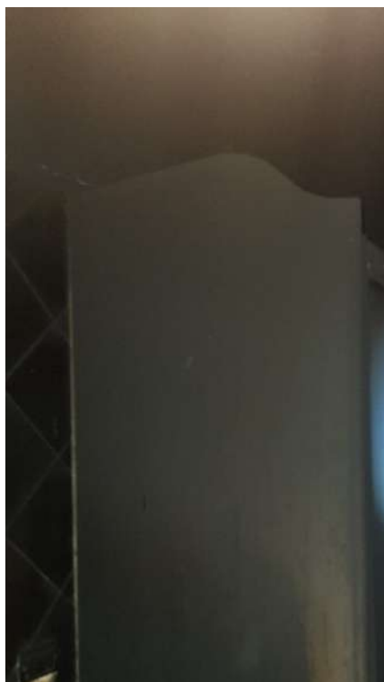
Foto 19 – Altra vista interna fabbricato oggetto di esecuzione (post-incendio).