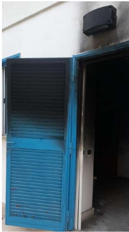
Foto 5 – Altra Vista esterna fabbricato oggetto di esecuzione (post-incendio).