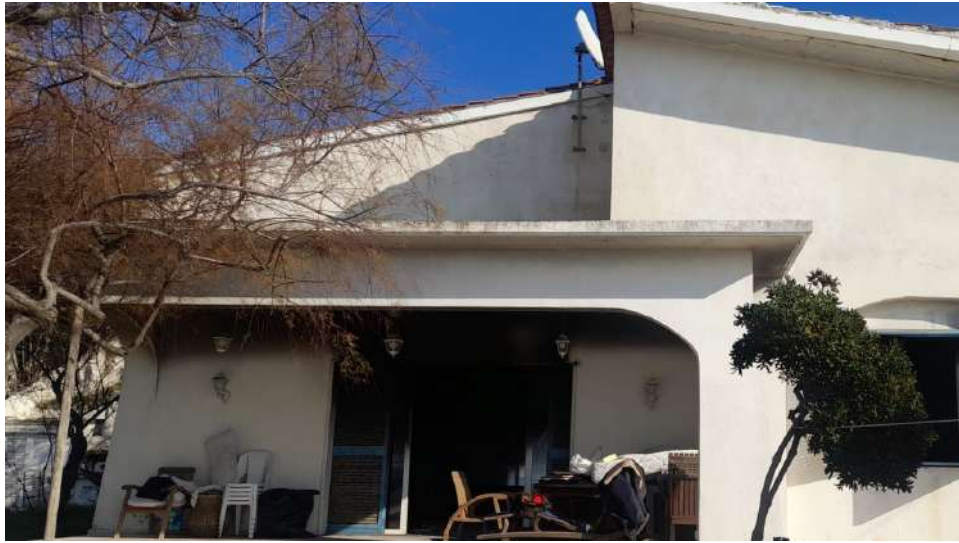
Foto 1 – Vista esterna fabbricato oggetto di esecuzione (post-incendio).