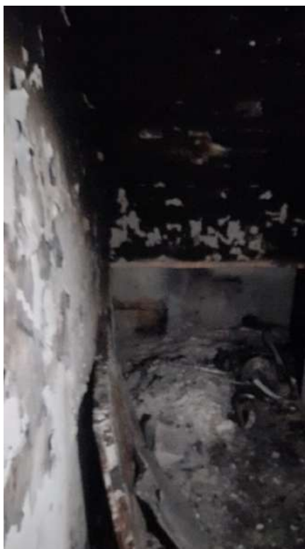
Foto 17 – Altra vista interna fabbricato oggetto di esecuzione (post-incendio).