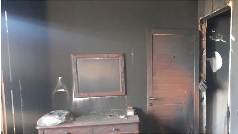
Foto 23 – Altra vista interna fabbricato oggetto di esecuzione (post-incendio).