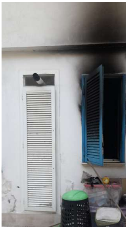
Foto 6 – Altra Vista esterna fabbricato oggetto di esecuzione (post-incendio).