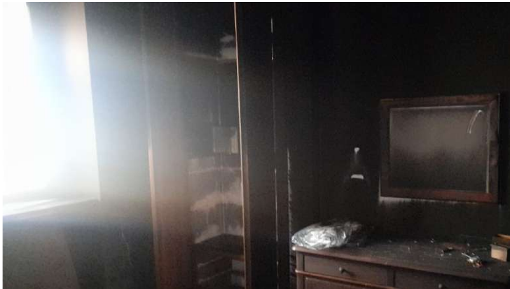
Foto 24 – Altra vista interna fabbricato oggetto di esecuzione (post-incendio).