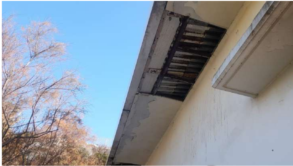
Foto 2 – Altra Vista esterna fabbricato oggetto di esecuzione (post-incendio).