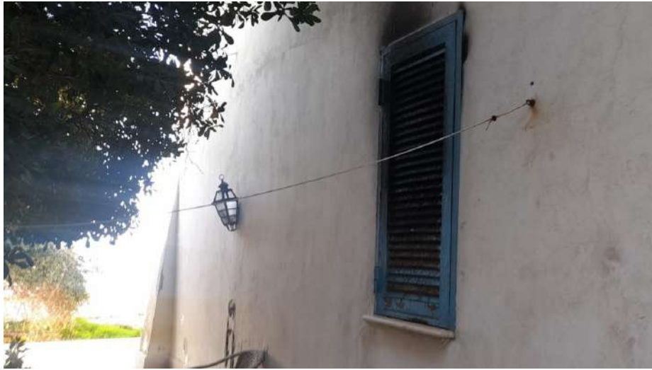
Foto 3 – Altra Vista esterna fabbricato oggetto di esecuzione (post-incendio).