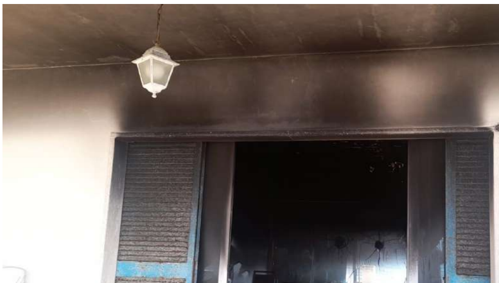
Foto 7 – Altra Vista esterna fabbricato oggetto di esecuzione (post-incendio).