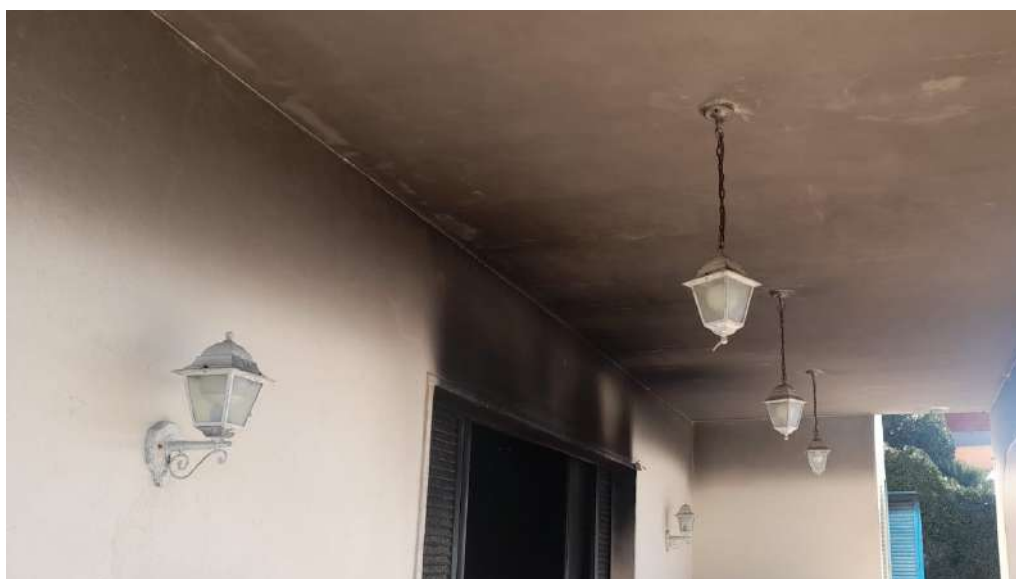
Foto 8 – Altra Vista esterna fabbricato oggetto di esecuzione (post-incendio).