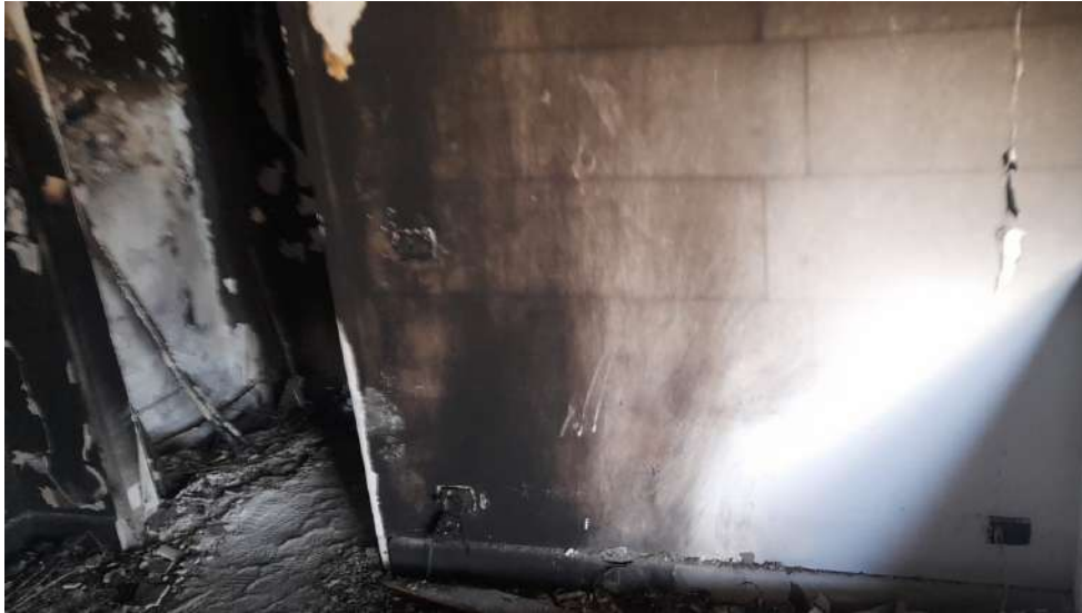
Foto 15 – Altra vista interna fabbricato oggetto di esecuzione (post-incendio).