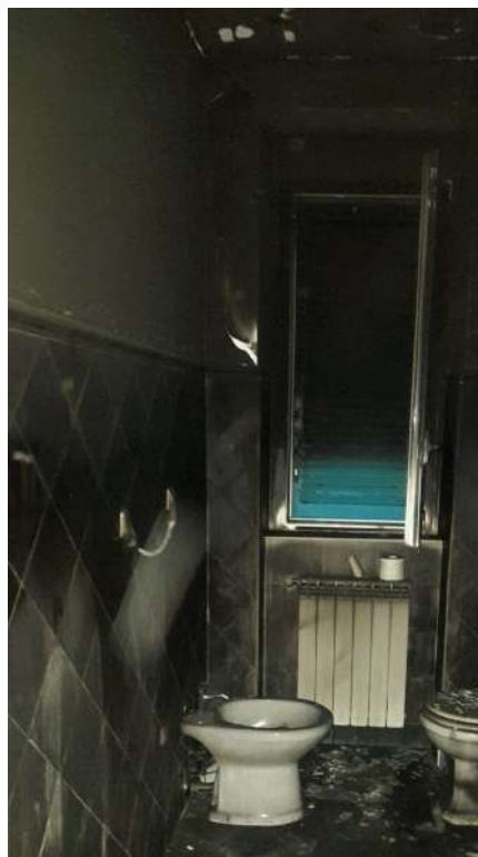
Foto 18 – Altra vista interna fabbricato oggetto di esecuzione (post-incendio).