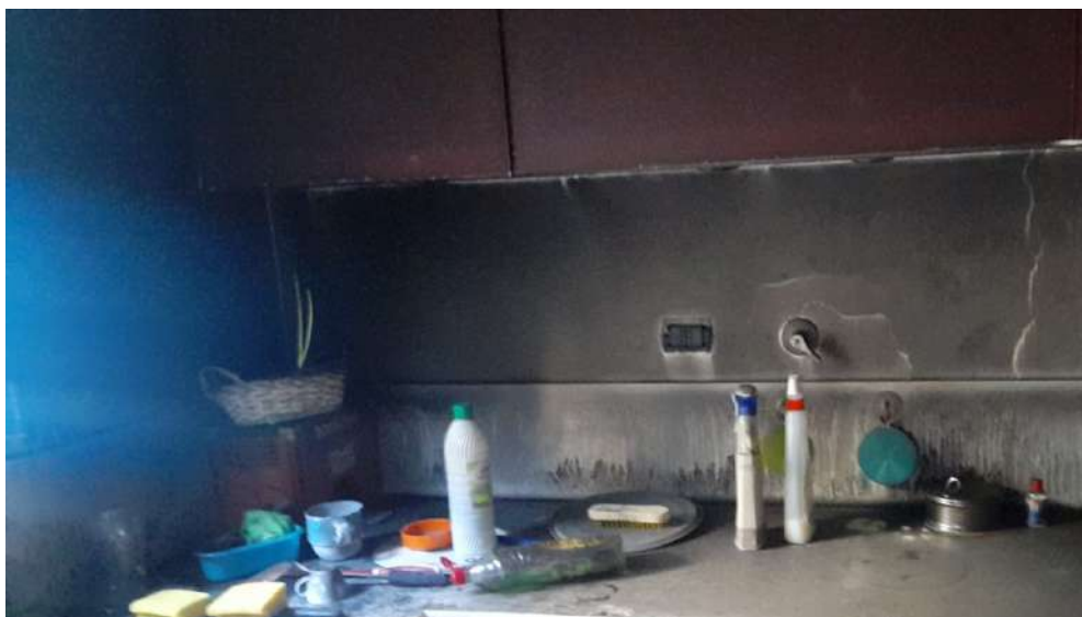
Foto 13 – Altra vista interna fabbricato oggetto di esecuzione (post-incendio).