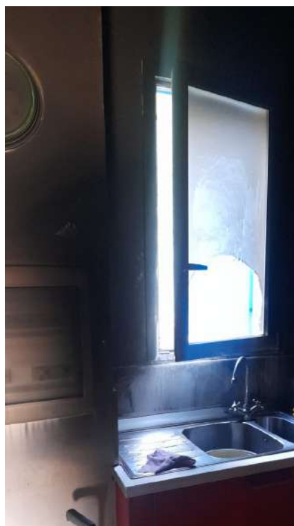
Foto 14 – Altra vista interna fabbricato oggetto di esecuzione (post-incendio).