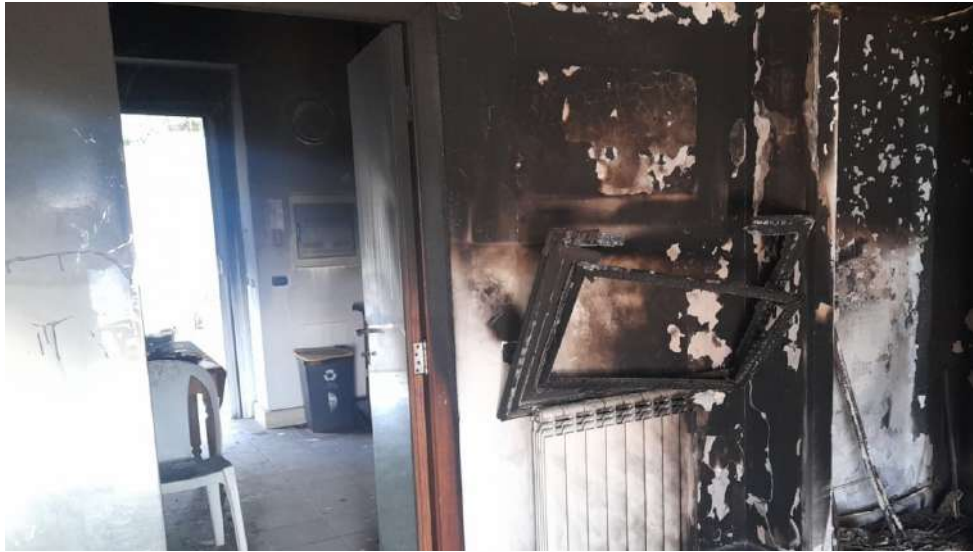
Foto 9 – Altra vista interna fabbricato oggetto di esecuzione (post-incendio).