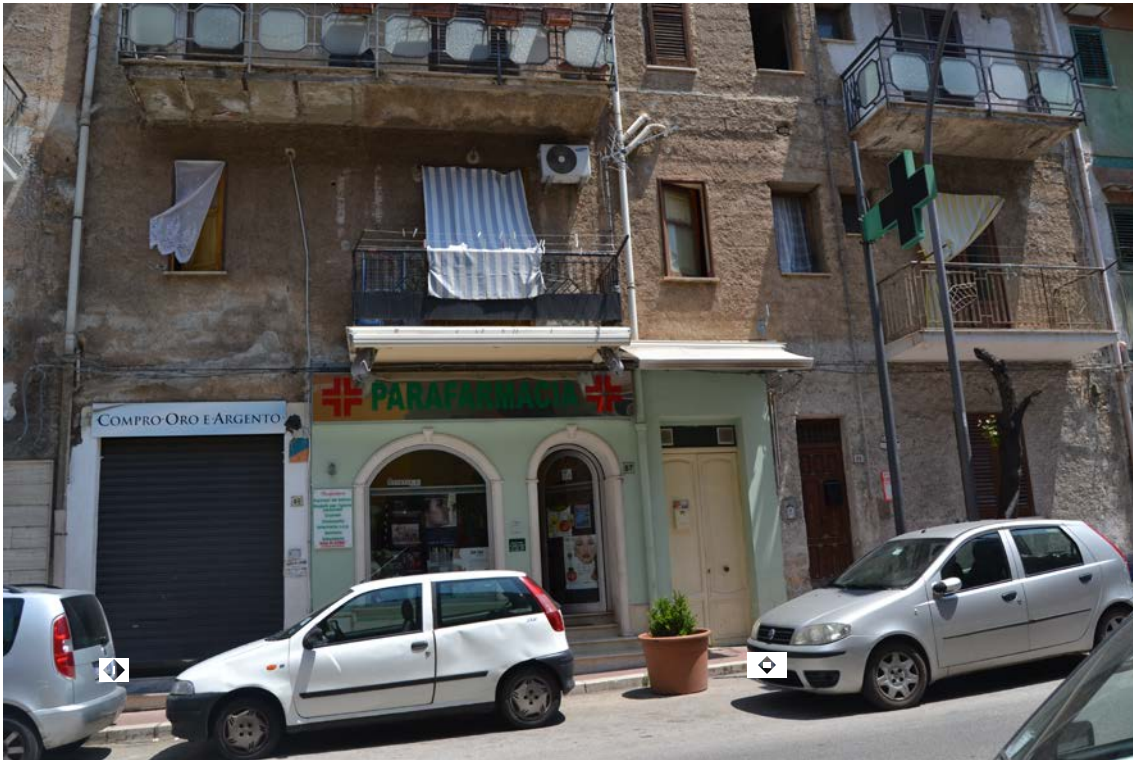
Fotografia 3 - Fabbricato identificato al N.C.E.U del Comune di Belmonte Mezzagno (PA), fg. 6, part.IIa 1400, sub. 5

Vista: Prospetto principale , via J. F. Kennedy n.89