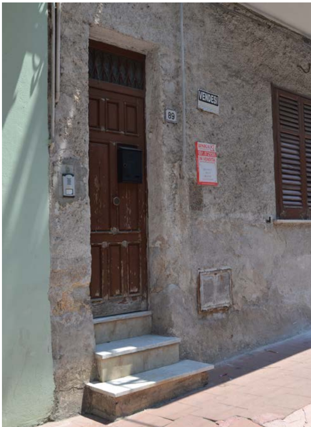
Fotografia 4 - Fabbricato identificato al N.C.E.U del Comune di Belmonte Mezzagno (PA), fg. 6, part.IIa 1400, sub. 5

Vista: Prospetto principale , via J. F. Kennedy n.89