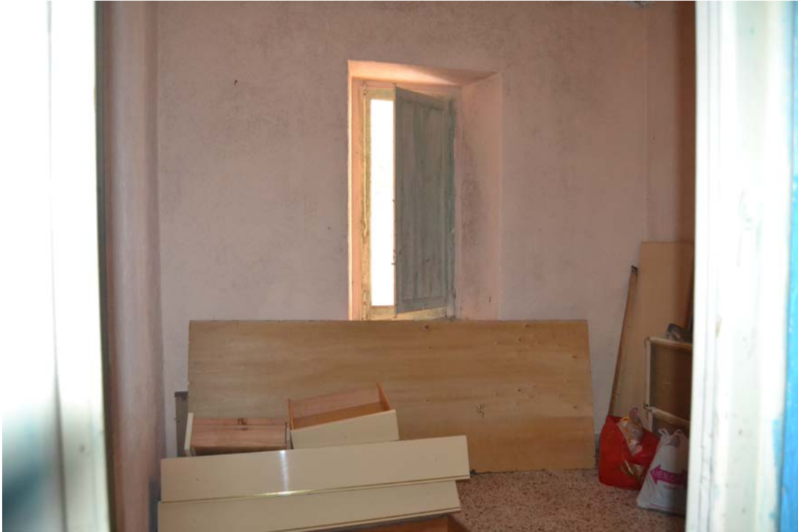
Fotografia 9 - Fabbricato identificato al N.C.E.U del Comune di Belmonte Mezzagno (PA), fg. 6, part.IIa 1400, sub. 5