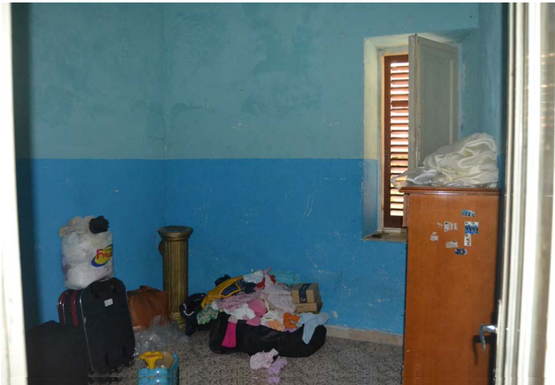
Fotografia 8 - Fabbricato identificato al N.C.E.U del Comune di Belmonte Mezzagno (PA), fg. 6, part.IIa 1400, sub. 5