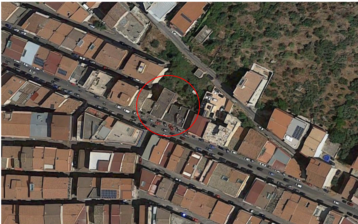
Fotografia 2 - Inquadramento territoriale Belmonte Mezzagno (PA) - Lotto Unico - Immobile oggetto del procedimento esecutivo, identificato al N.C.E.U del Comune di Belmonte Mezzagno (PA), fg. n.6, part.IIa n. 1400, sub.n.5