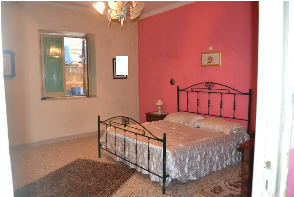
Fotografia 7 - Fabbricato identificato al N.C.E.U del Comune di Belmonte Mezzagno (PA), fg. 6, part.IIa 1400, sub. 5