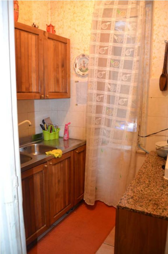
Fotografia 11 - Fabbricato identificato al N.C.E.U del Comune di Belmonte Mezzagno (PA), fg. 6, part.IIa 1400, sub. 5