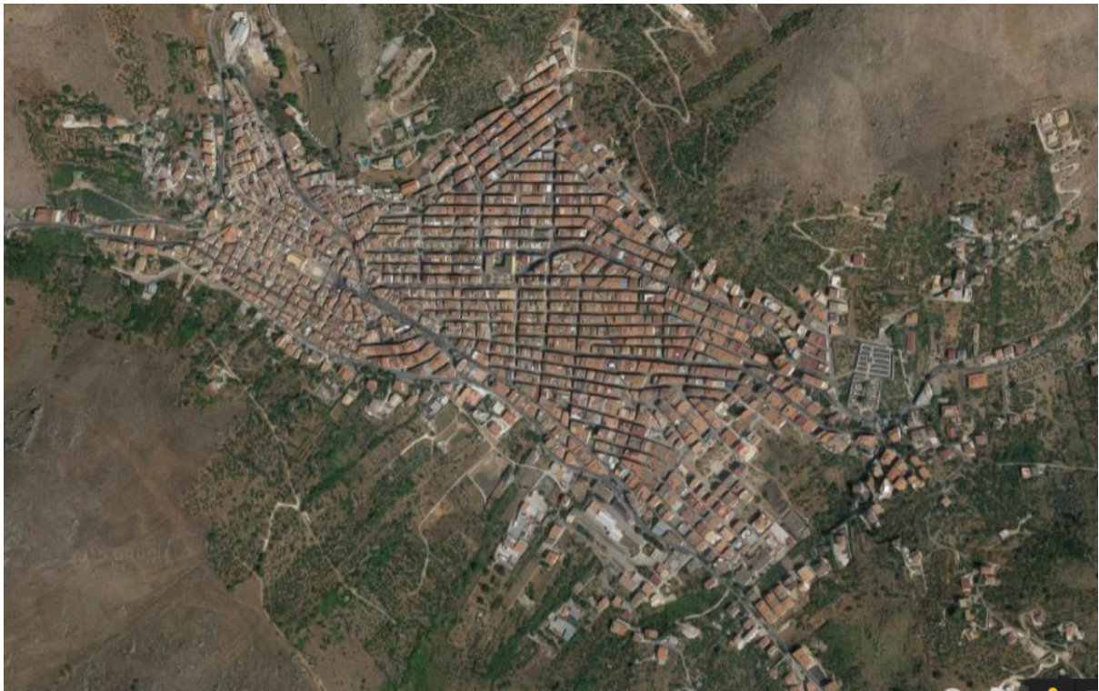
Fotografia 1- Inquadramento territoriale Belmonte Mezzagno (PA) - Centro Urbano - (Immagine di Google Earth)