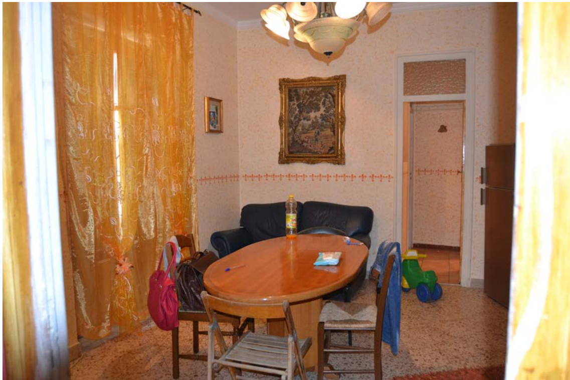
Fotografia 10 - Fabbricato identificato al N.C.E.U del Comune di Belmonte Mezzagno (PA), fg. 6, part.IIa 1400, sub. 5