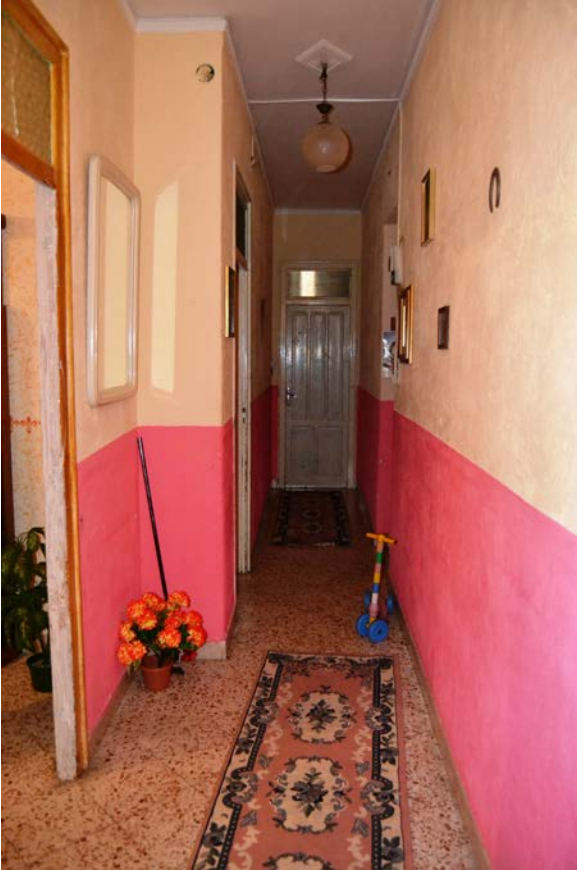
Fotografia 5 - Fabbricato identificato al N.C.E.U del Comune di Belmonte Mezzagno (PA), fg. 6, part.IIa 1400, sub. 5