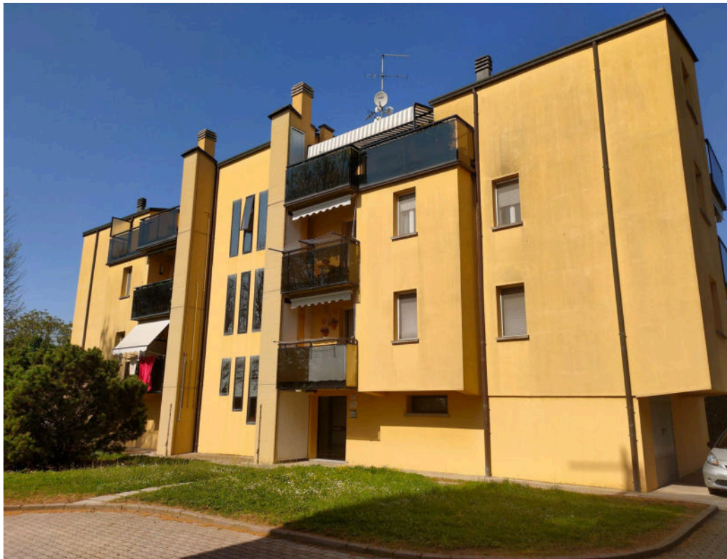
Prospetto su accesso condominiale