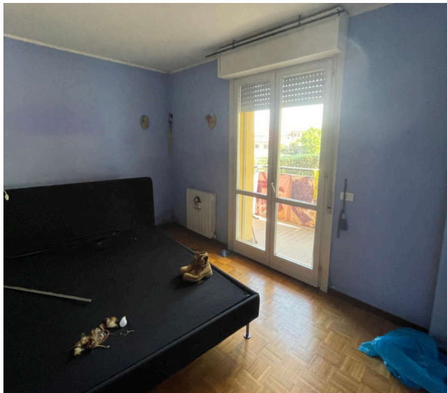
camera con accesso a balcone (con parapetto in vetro danneggiato)