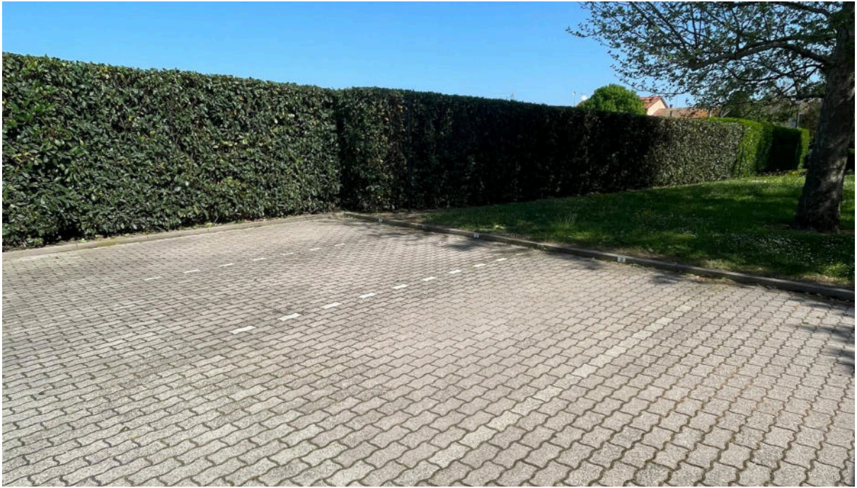
posto auto esterno