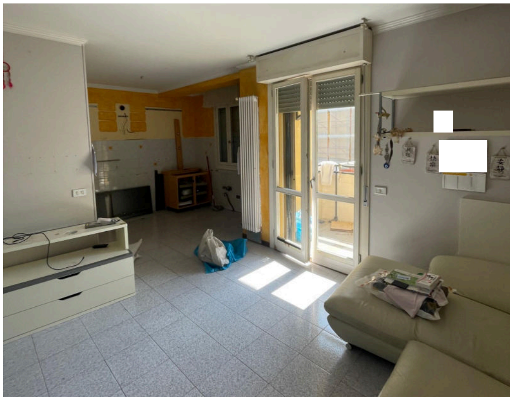
zona giorno con angolo cottura e accesso a loggia