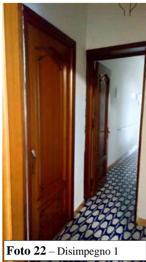
Foto 22 - Disimpegno 1