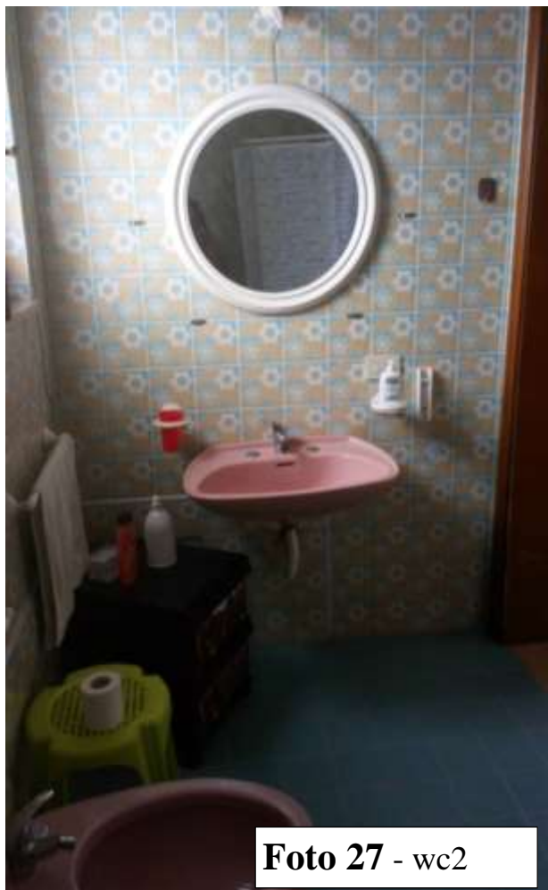
Foto 27 - wc2