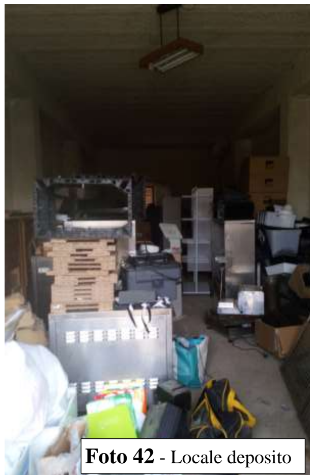
Foto 42 - Locale deposito