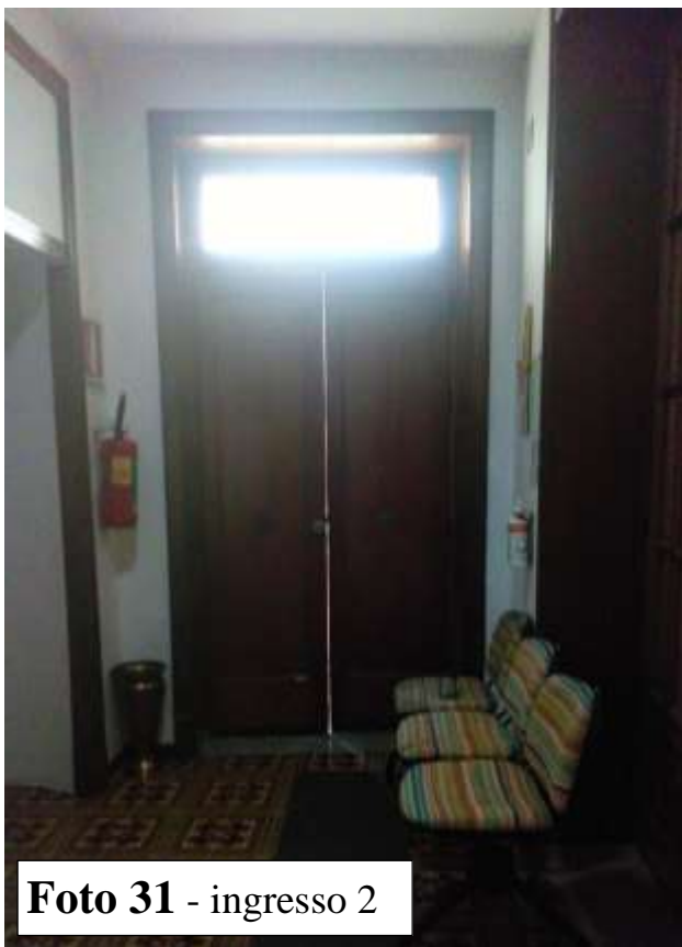
Foto 31 - ingresso 2