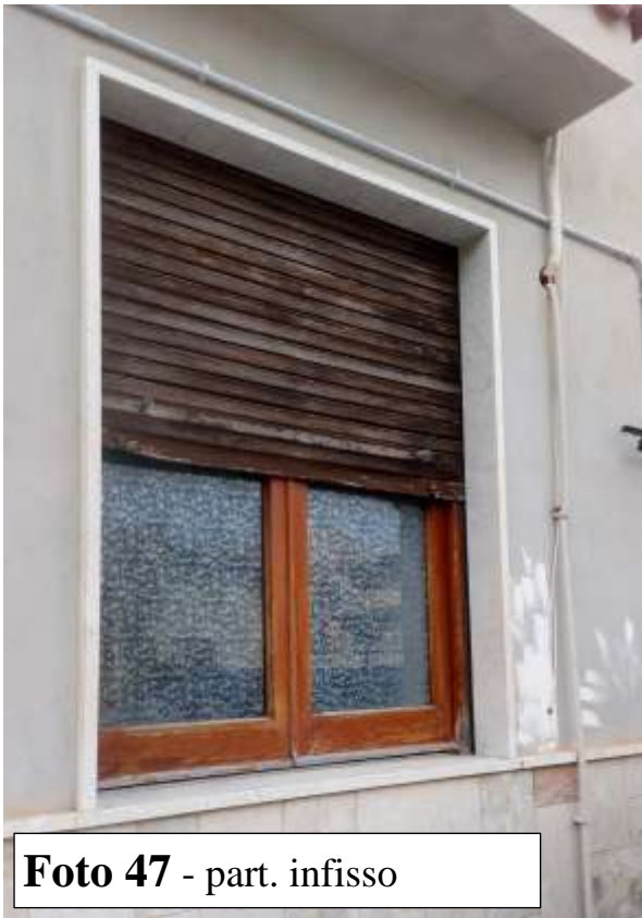
Foto 47 - part. infisso