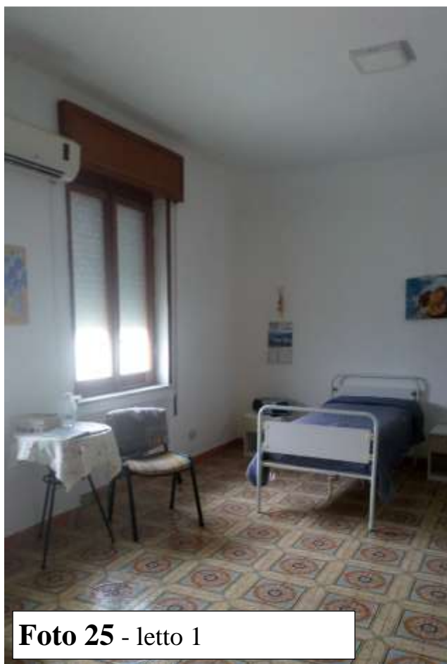
Foto 25 - letto 1