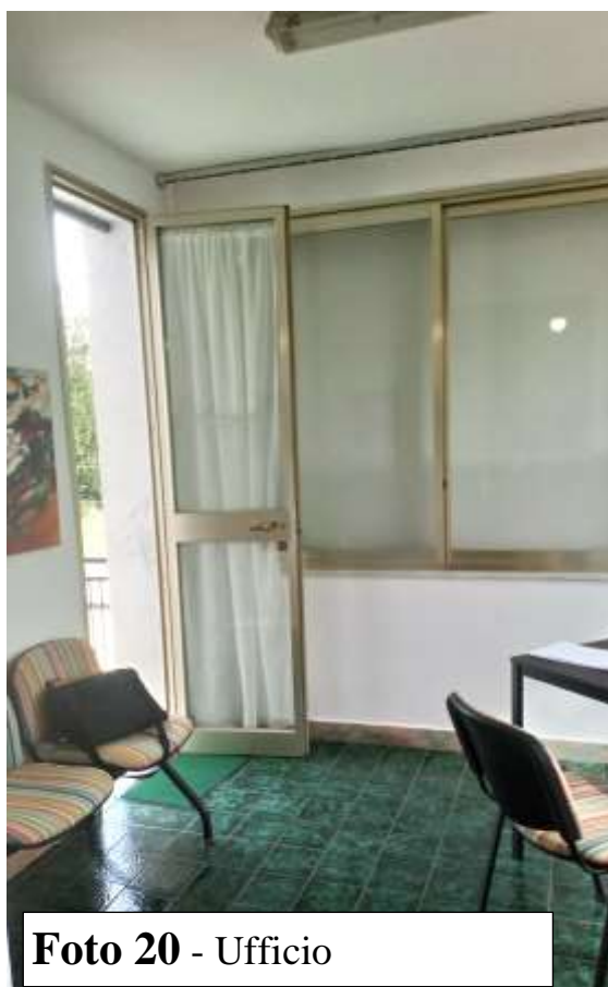
Foto 20 - Ufficio