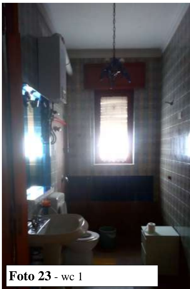
Foto 23 - wc 1