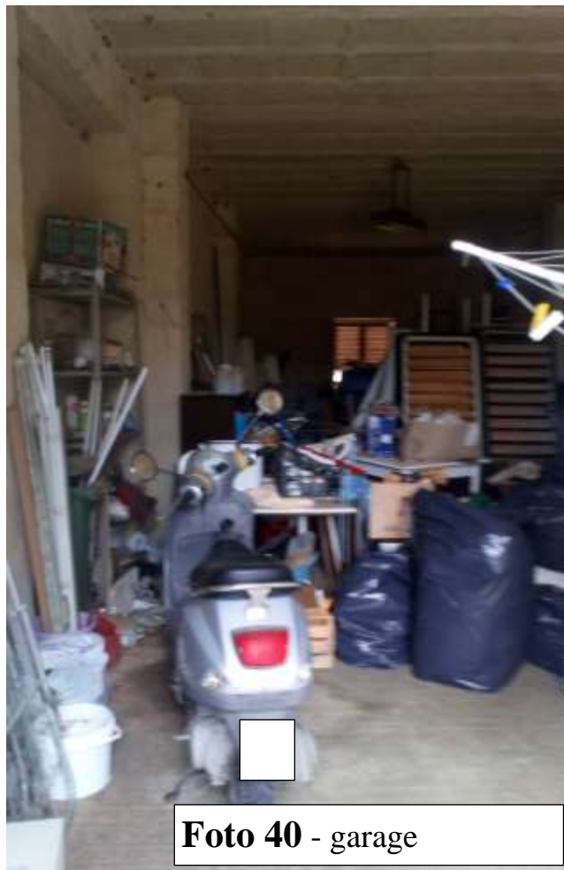
Foto 40 - garage