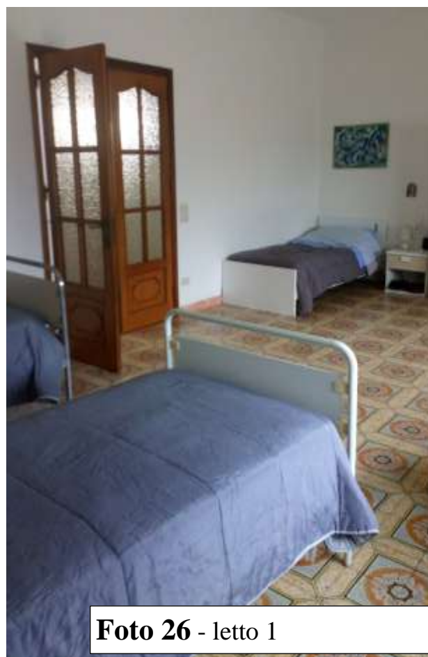
Foto 26 - letto 1