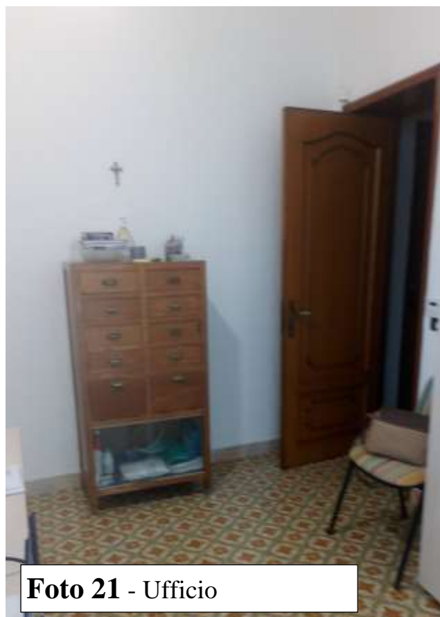
Foto 21 - Ufficio