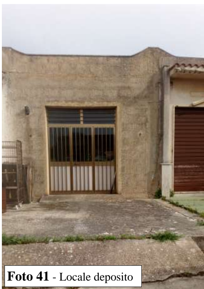
Foto 41 - Locale deposito