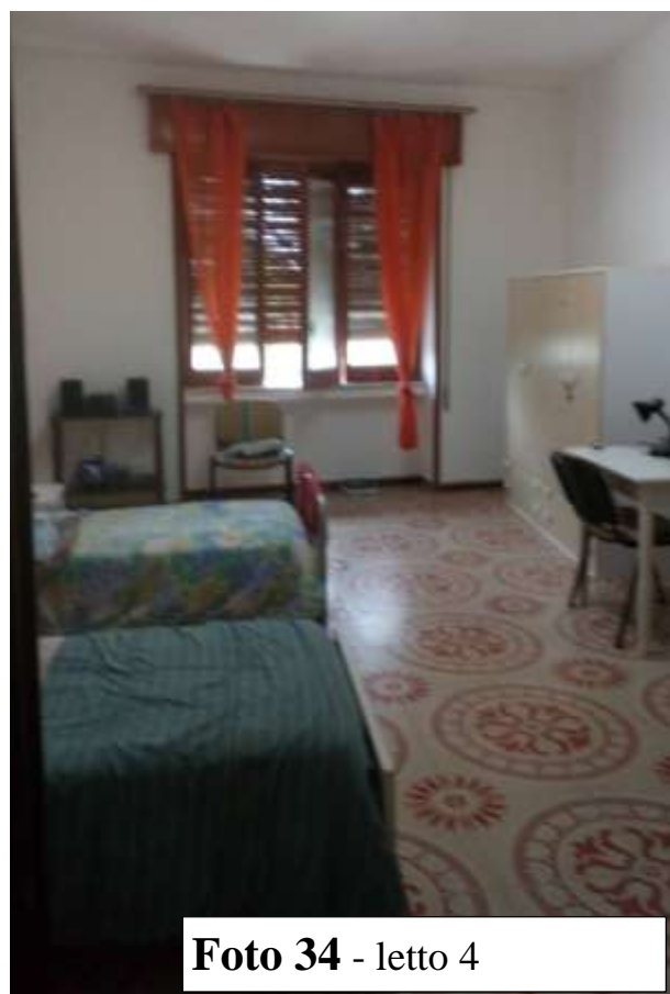
Foto 34 - letto 4