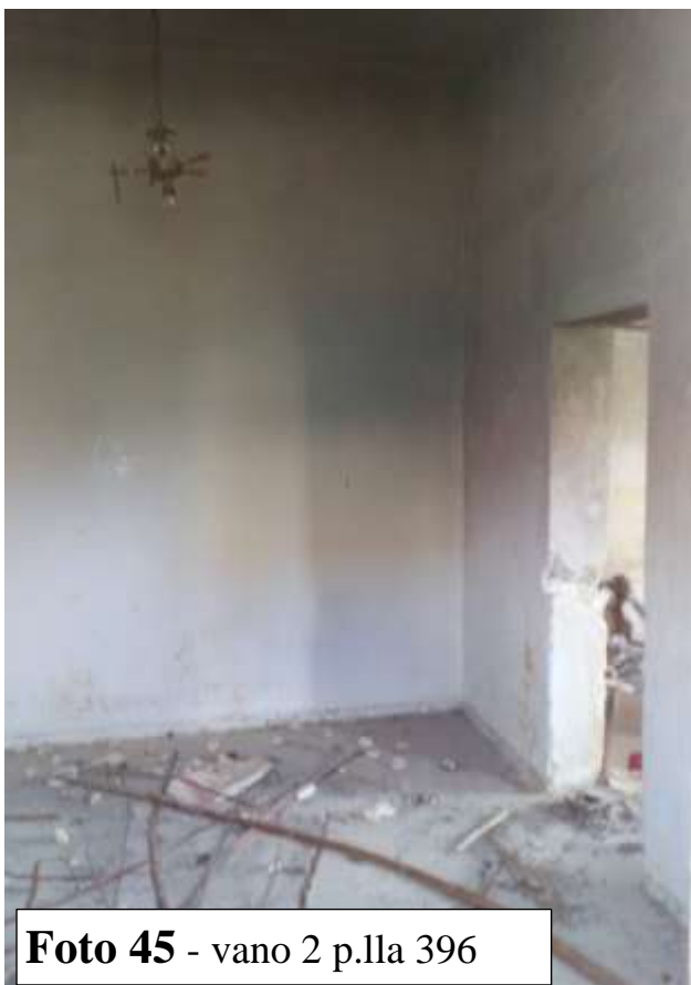
Foto 45 - vano 2 p.la 396