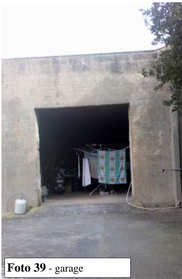
Foto 39 - garage