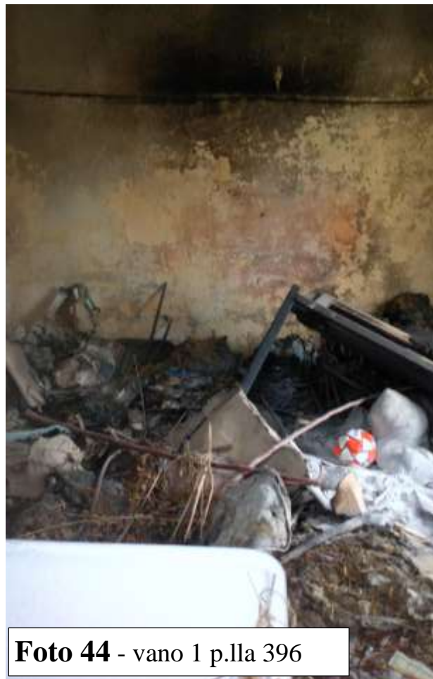
Foto 44 - vano 1 p.la 396