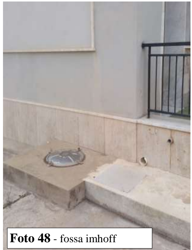
Foto 48 - fossa imhoff