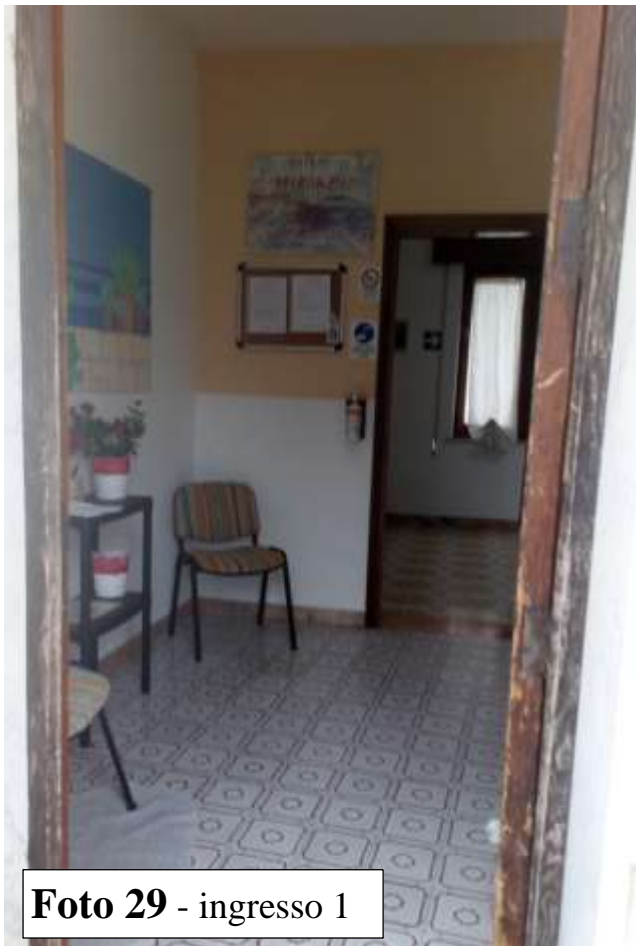
Foto 29 - ingresso 1