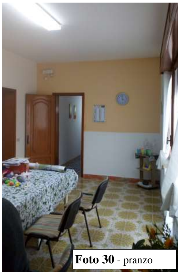
Foto 30 - pranzo