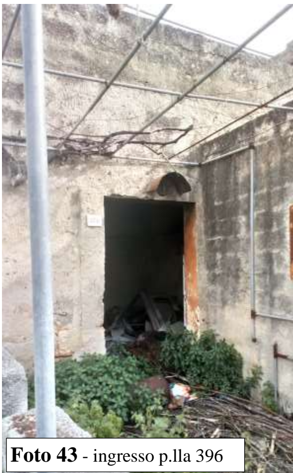
Foto 43 - ingresso p.la 396