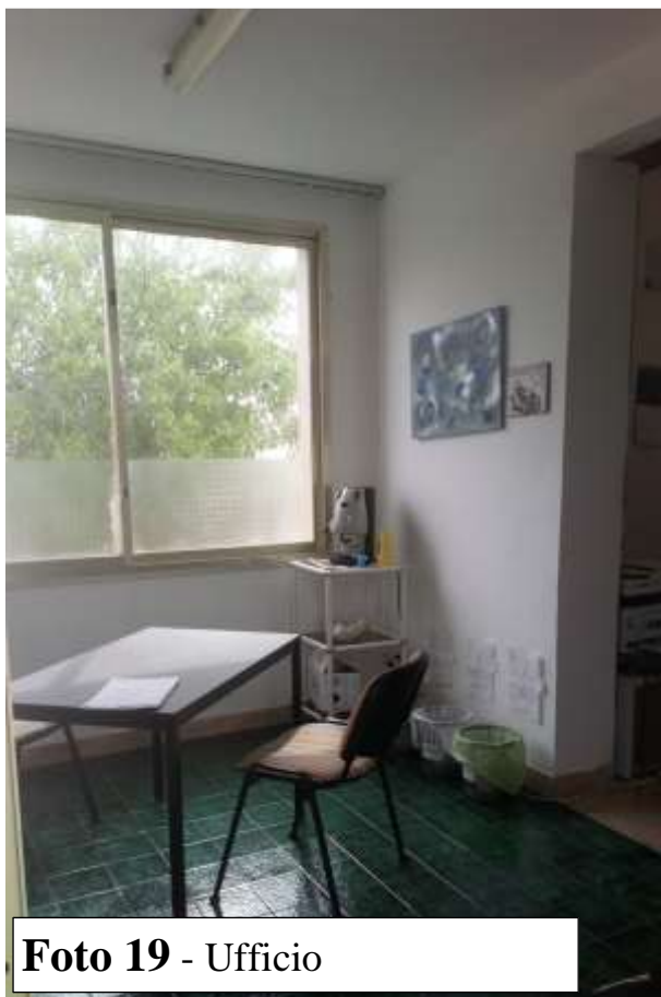
Foto 19 - Ufficio