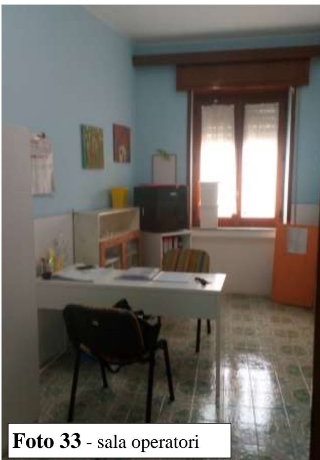
Foto 33 - sala operatori