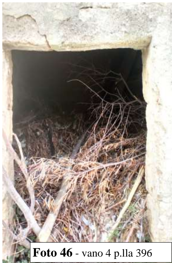
Foto 46 - vano 4 p.la 396