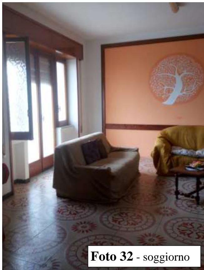
Foto 32 - soggiorno