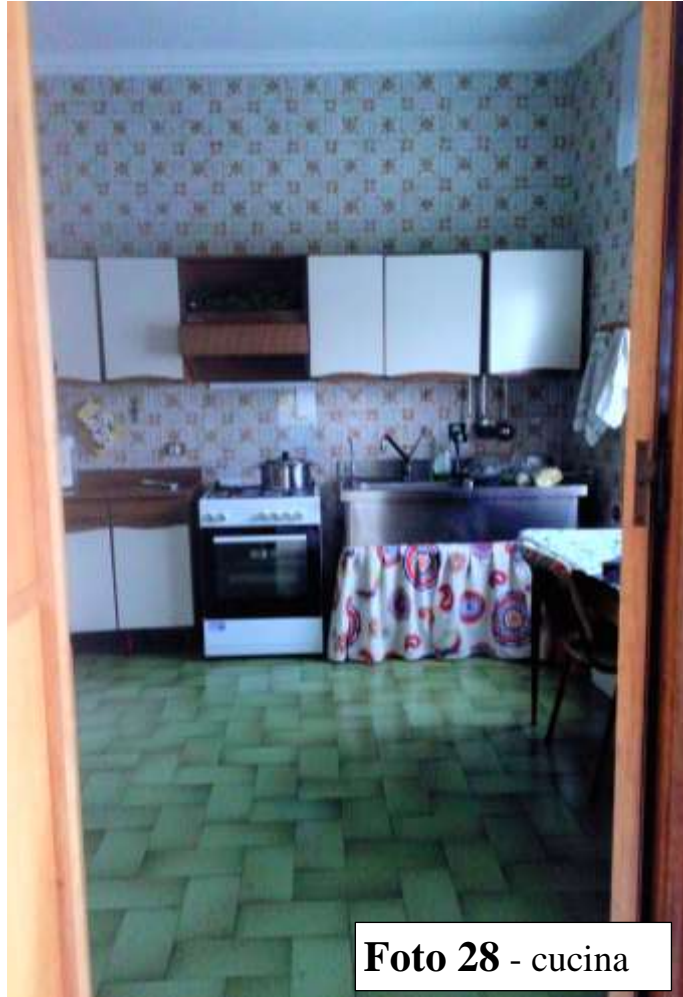
Foto 28 - cucina