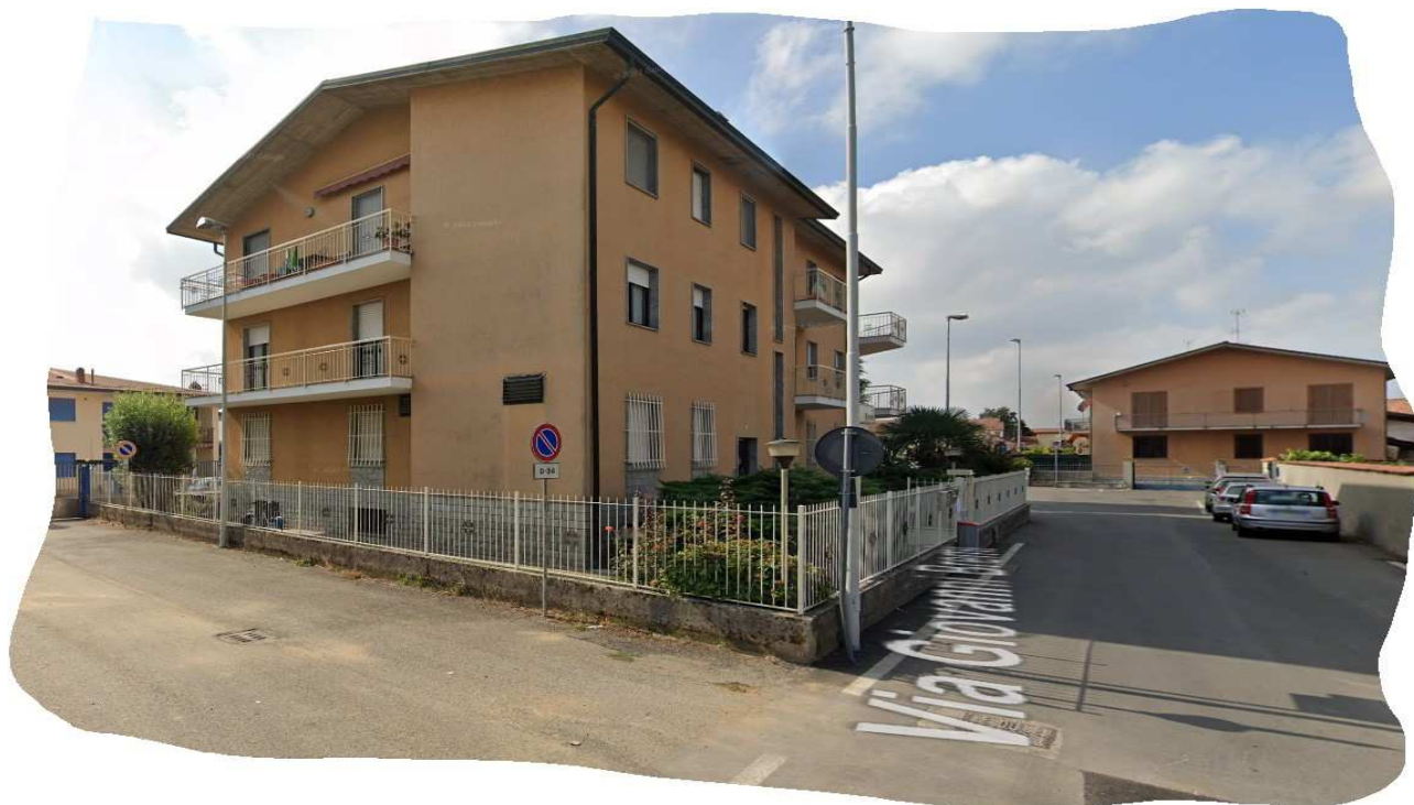
FOTO INTERO COMPLESSO