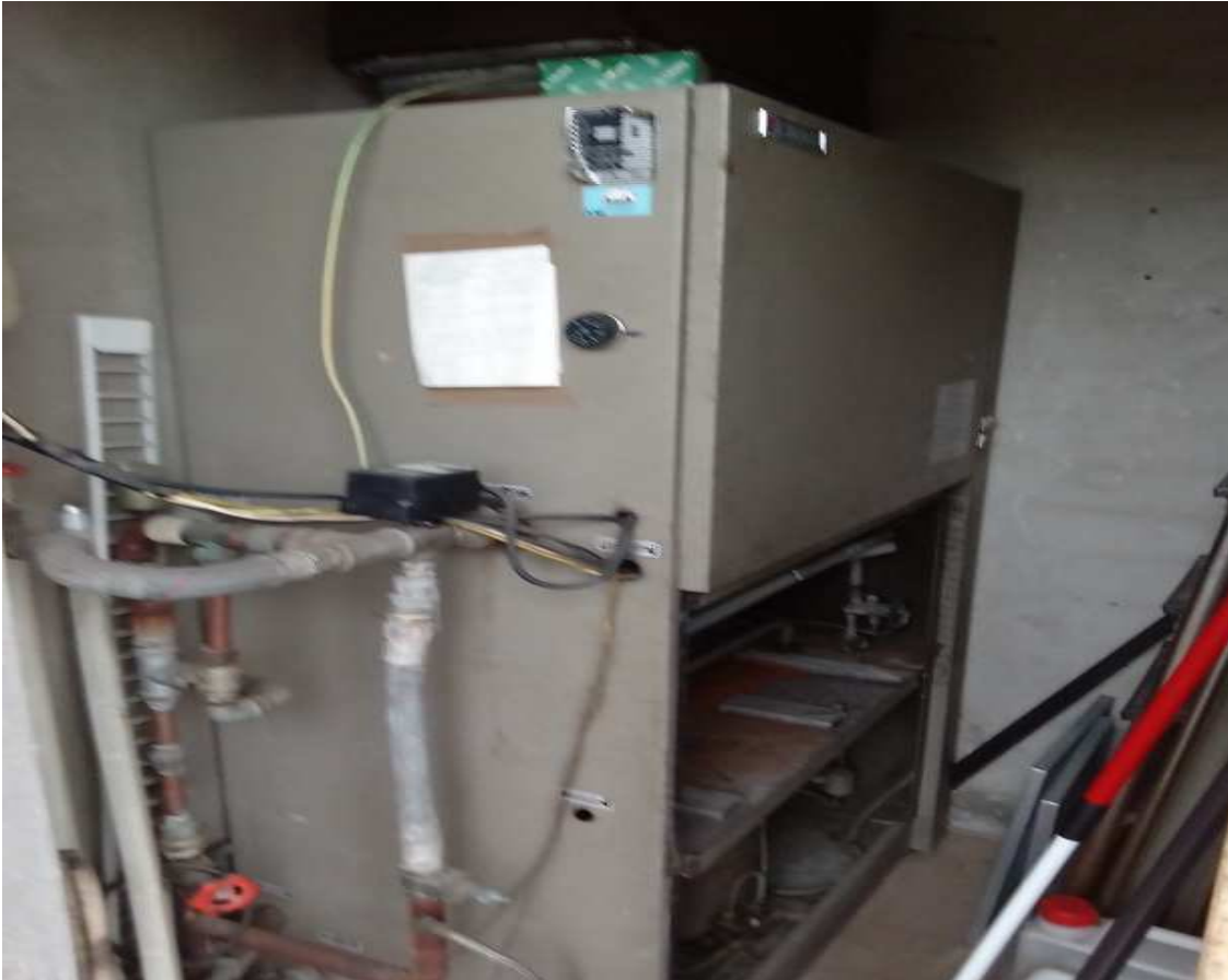
FOTO LOCALE TECNICO