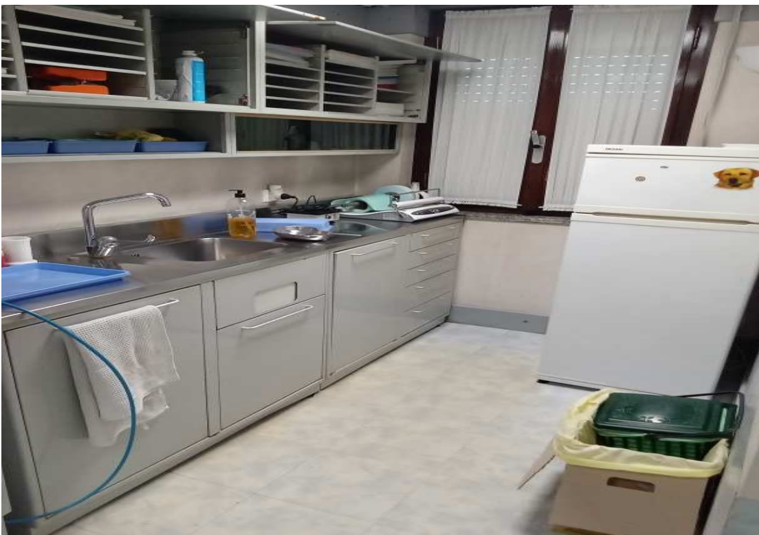
FOTO SALA RIORDINO