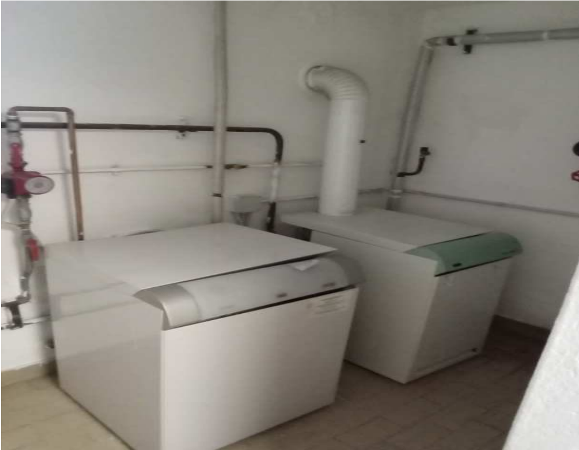
FOTO CENTRALE TERMICA