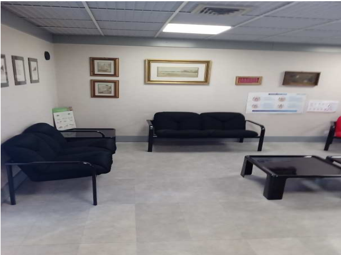
FOTO SALA D'ATTESA