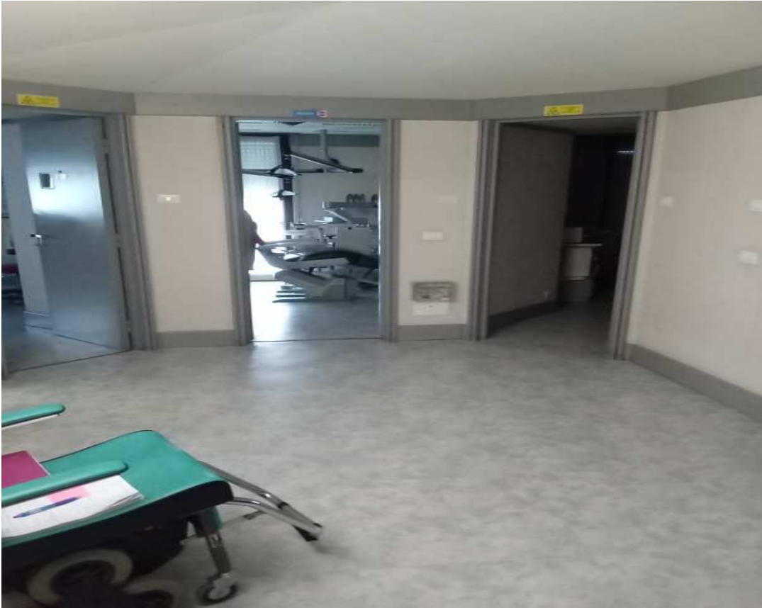
FOTO DISIMPEGNO AMBULATORI