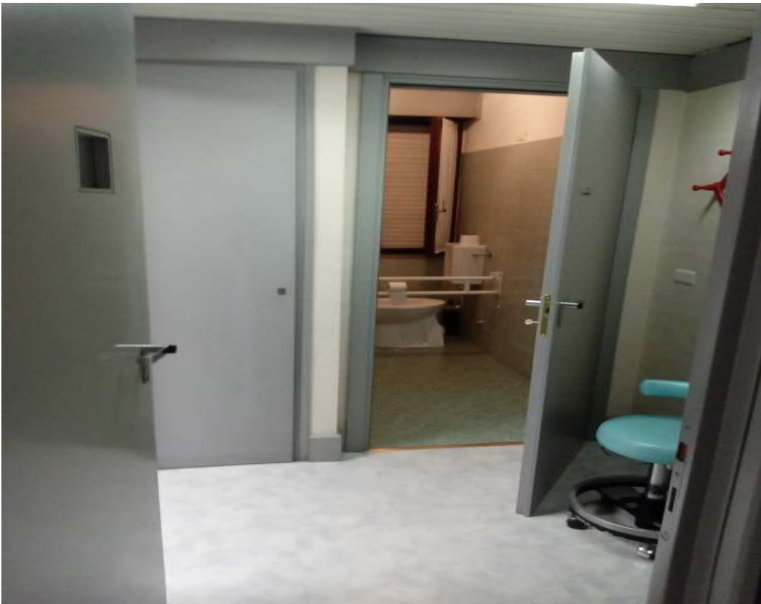
FOTO DISIMPEGNO/BAGNO DISABILI