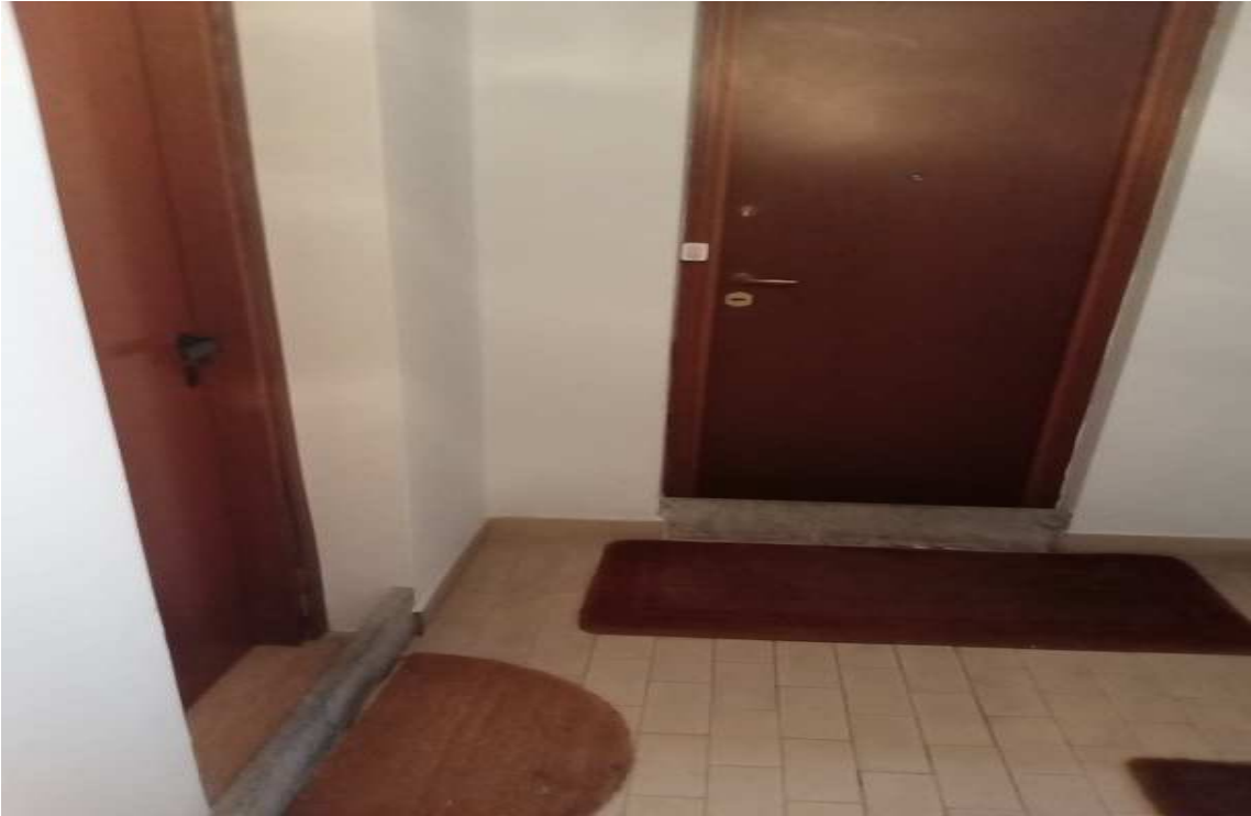
FOTO INGRESSO CANTINATO