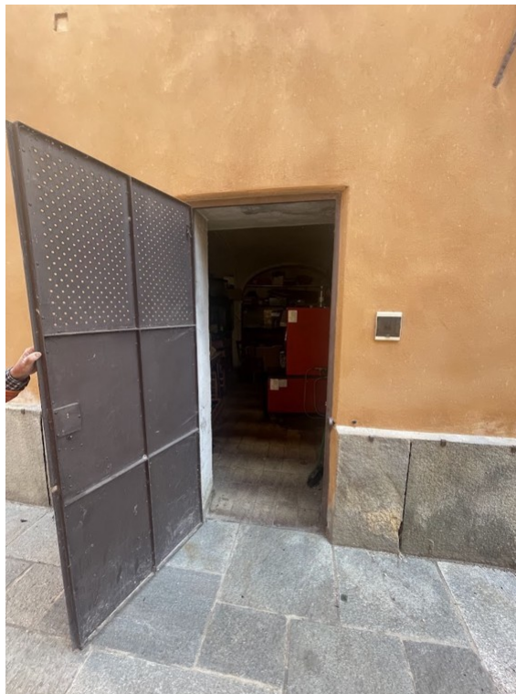
Fotografia A.46 - FOTO CENTRALE TERMICA / DEPOSITO PIANO TERRA (SUB. 17 - LOTTO 1) - EX SUB. 1/parte