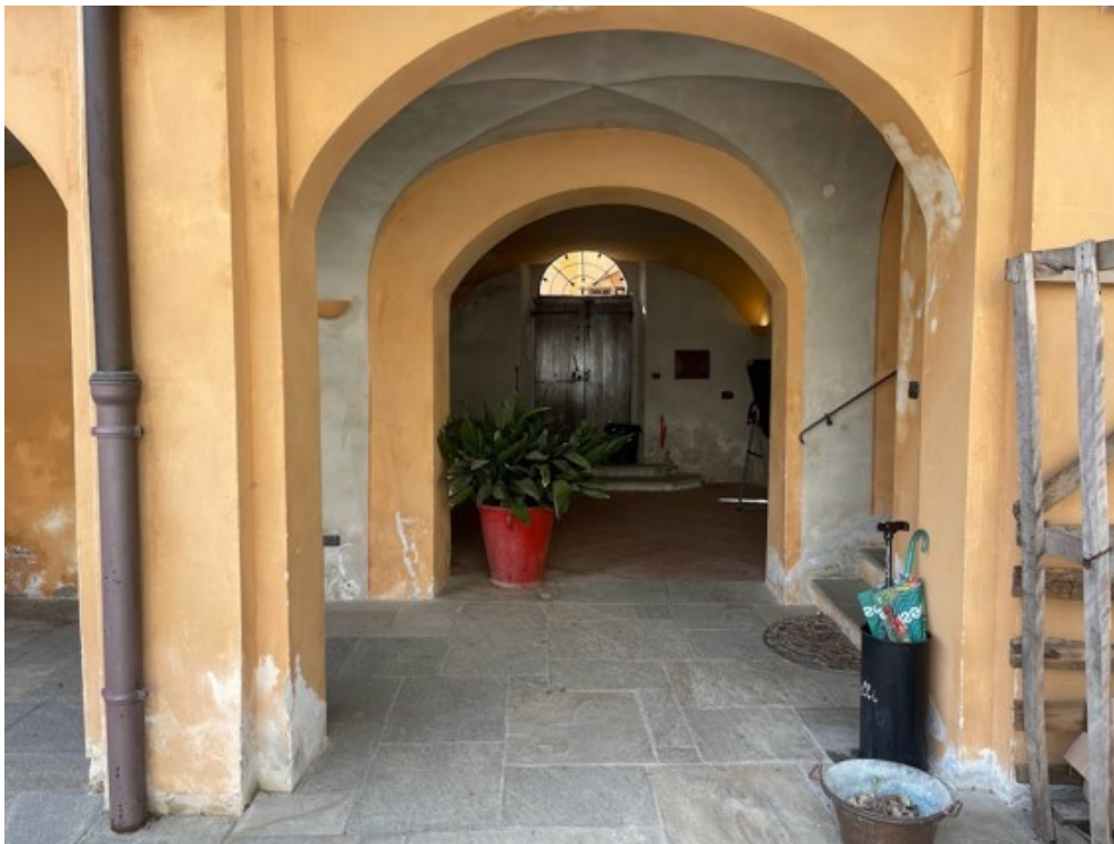
Fotografia A.40 - FOTO LOCALE DEPOSITO E ANDRONE PIANO TERRA (SUB. 5 - LOTTO 1)