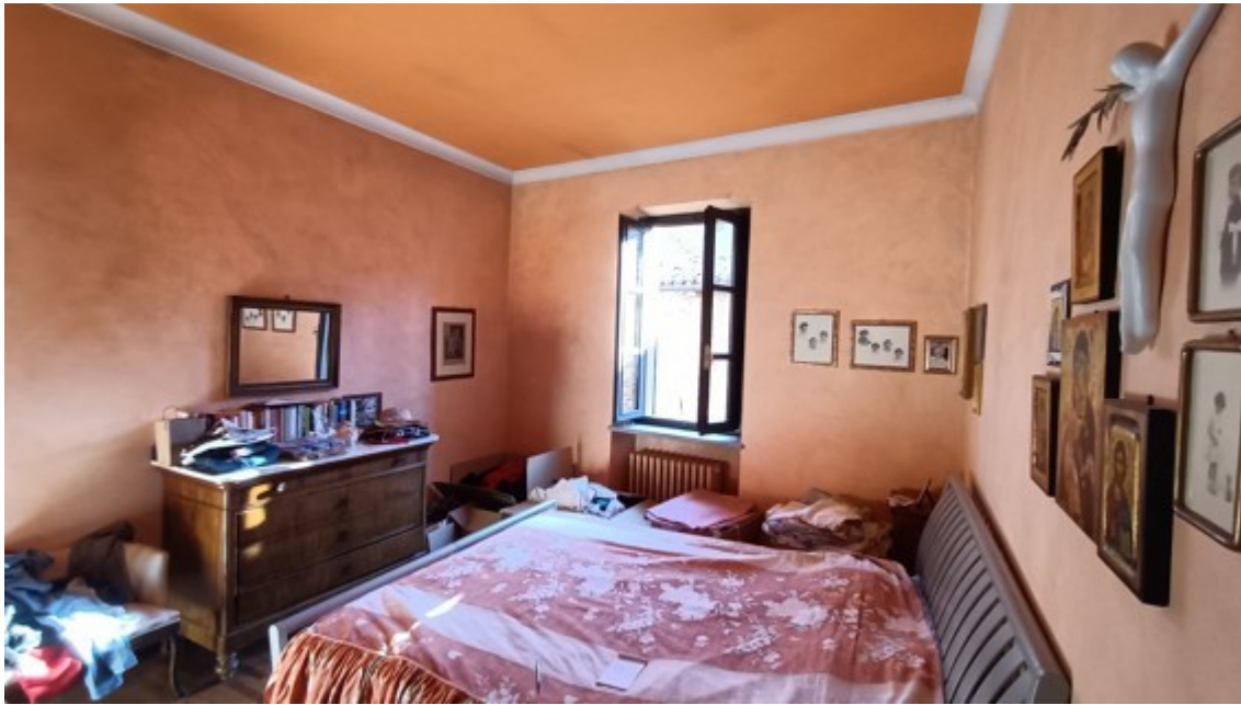
Fotografia A.19 - FOTO APPARTAMENTO PIANO SECONDO (SUB. 3 - LOTTO 1)