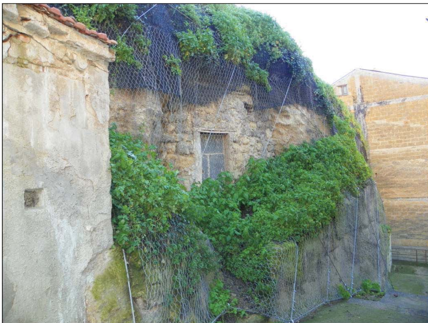
VISTA ESTERNA DELL'AGGROTTATO DESTINATO A MAGAZZINO-DEPOSITO