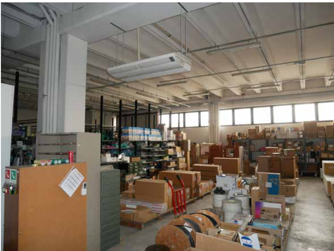
foto 08 - vista interna negozio