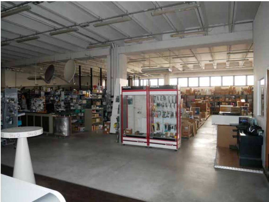
foto 07 - vista interna negozio