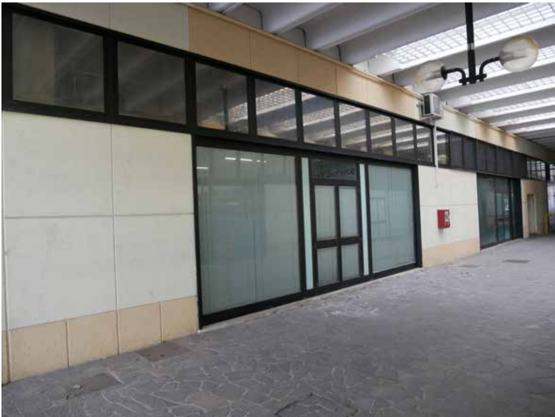
foto 01 - vista esterna negozio