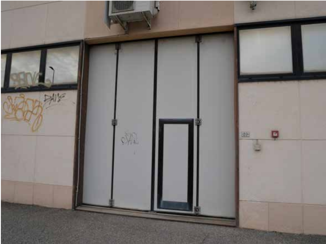
foto 03 - vista esterna negozio