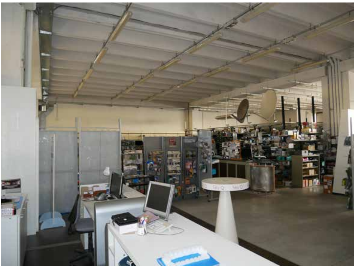
foto 06 - vista interna negozio