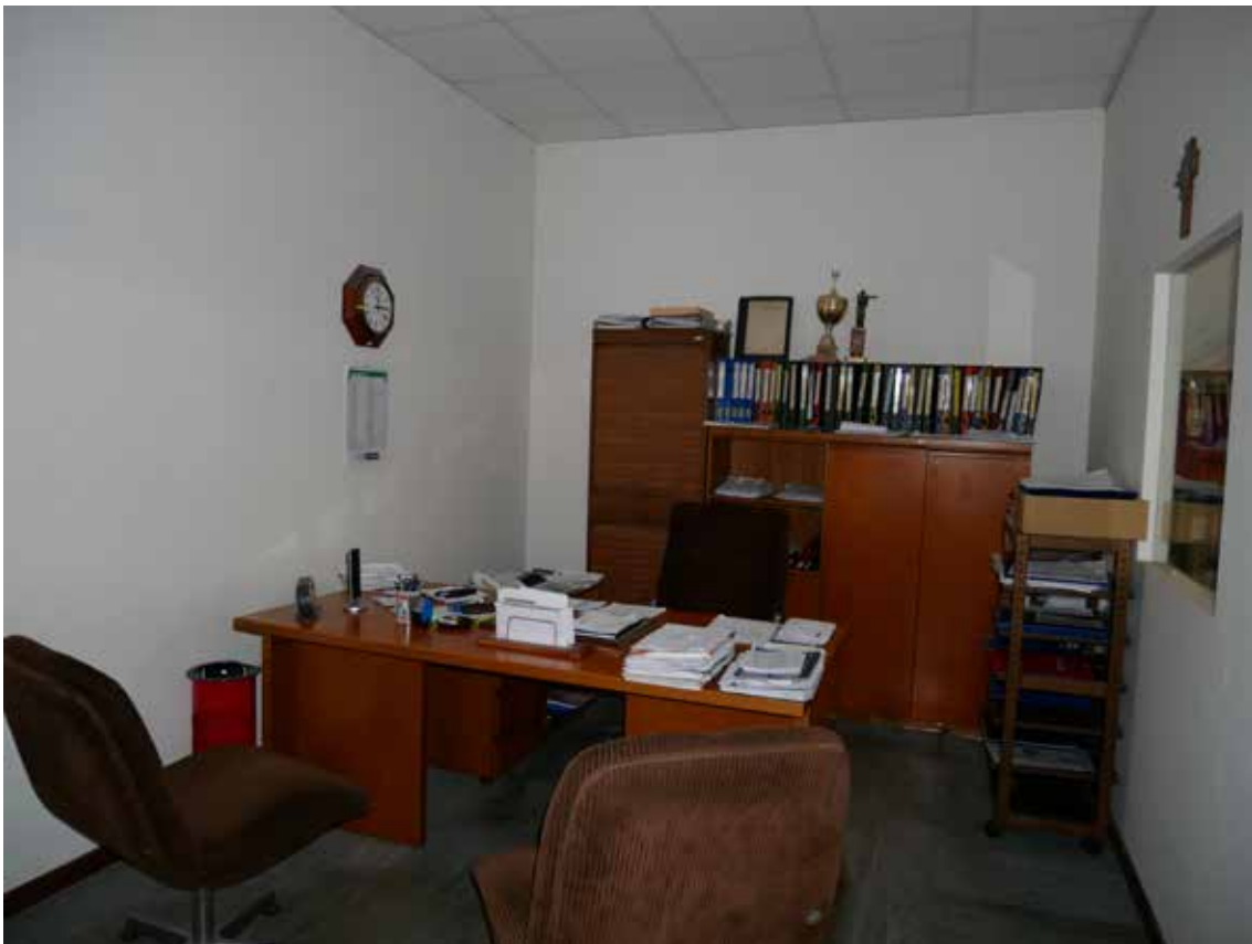
foto 19 - vista interna negozio