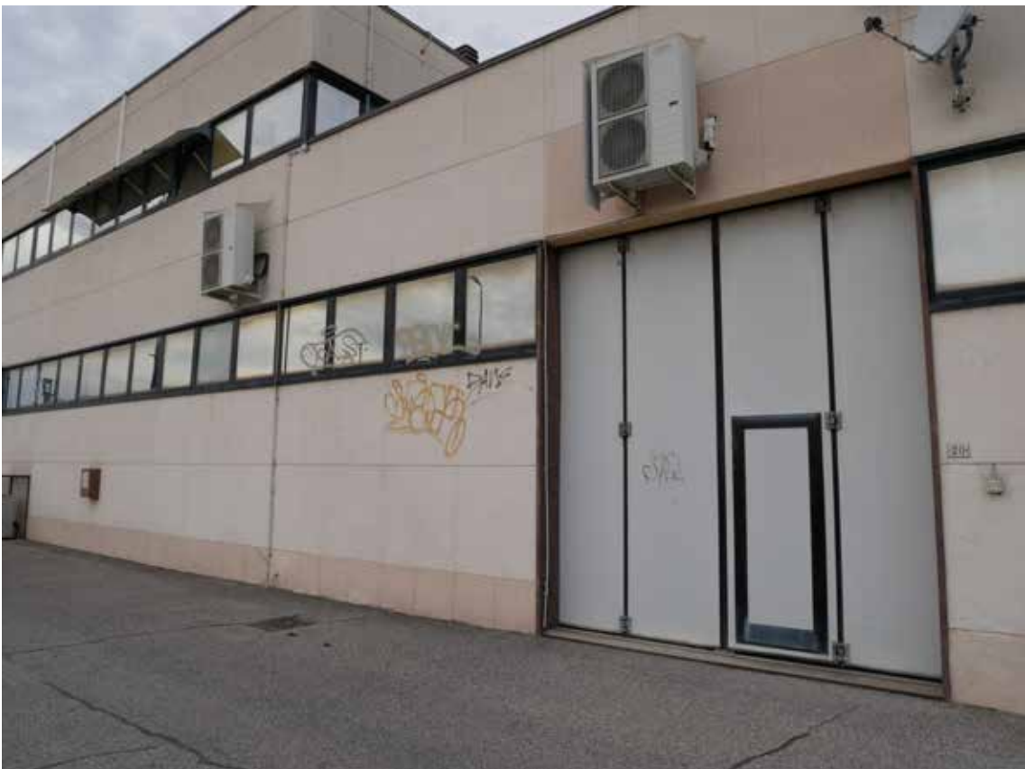
foto 04 - vista esterna negozio