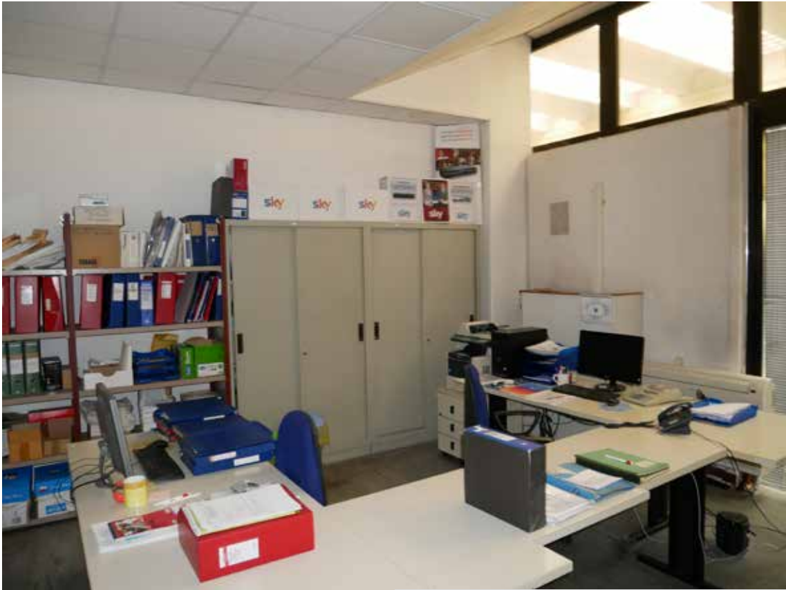
foto 17 - vista interna negozio