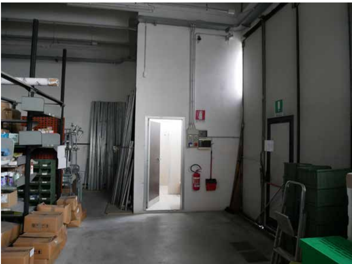
foto 12 - vista interna negozio