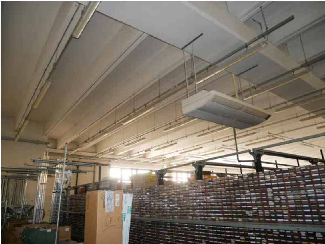
foto 09 - vista interna negozio