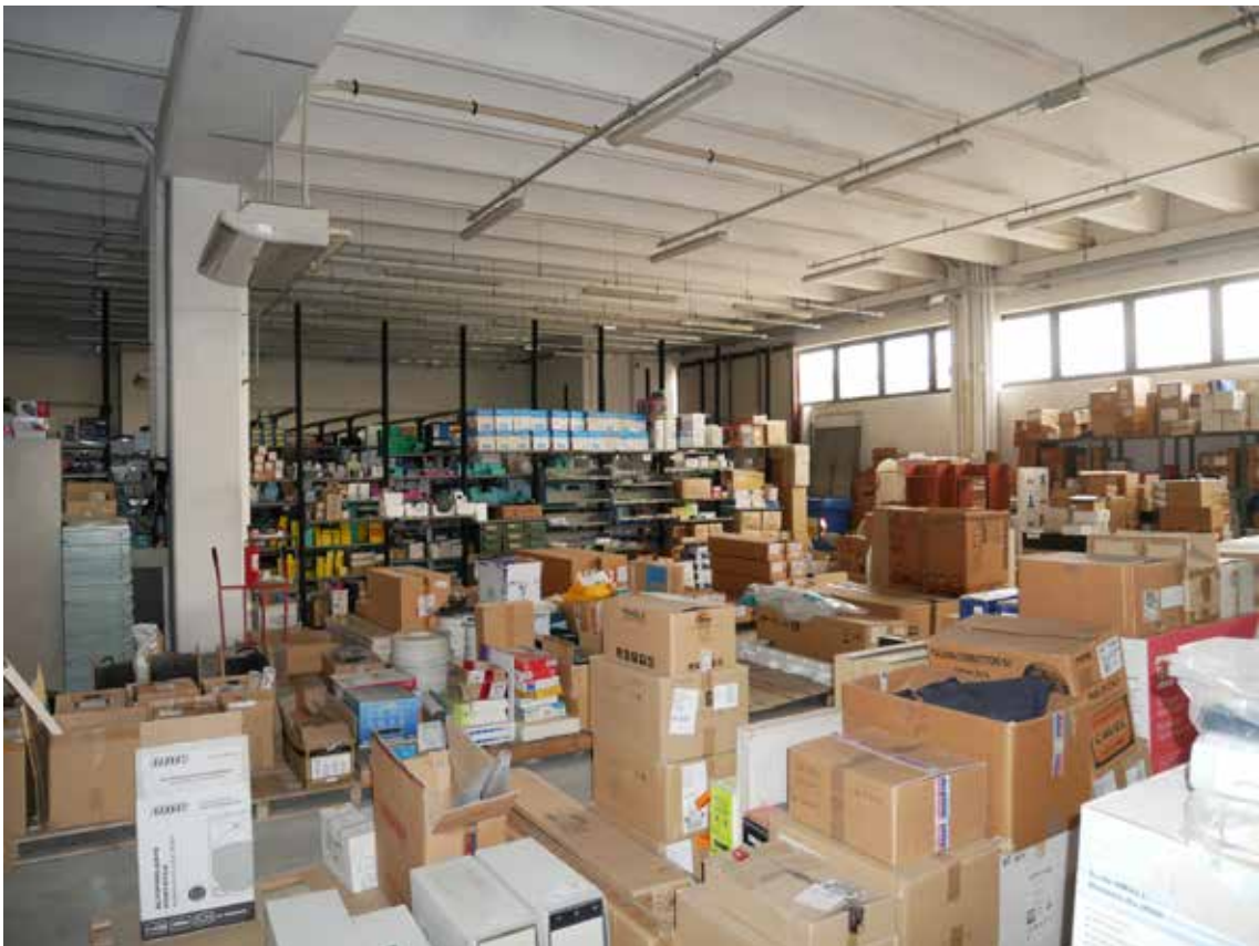
foto 05 - vista interna negozio