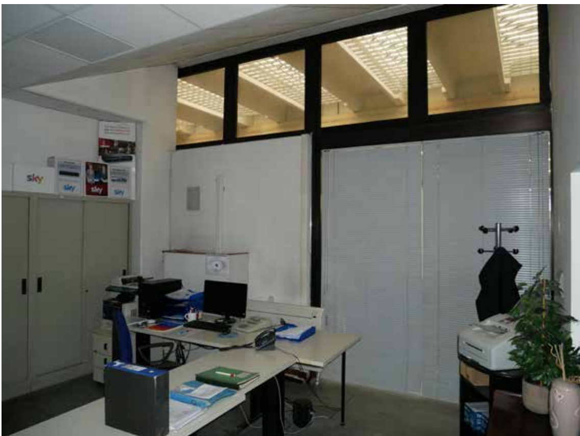
foto 16 - vista interna negozio