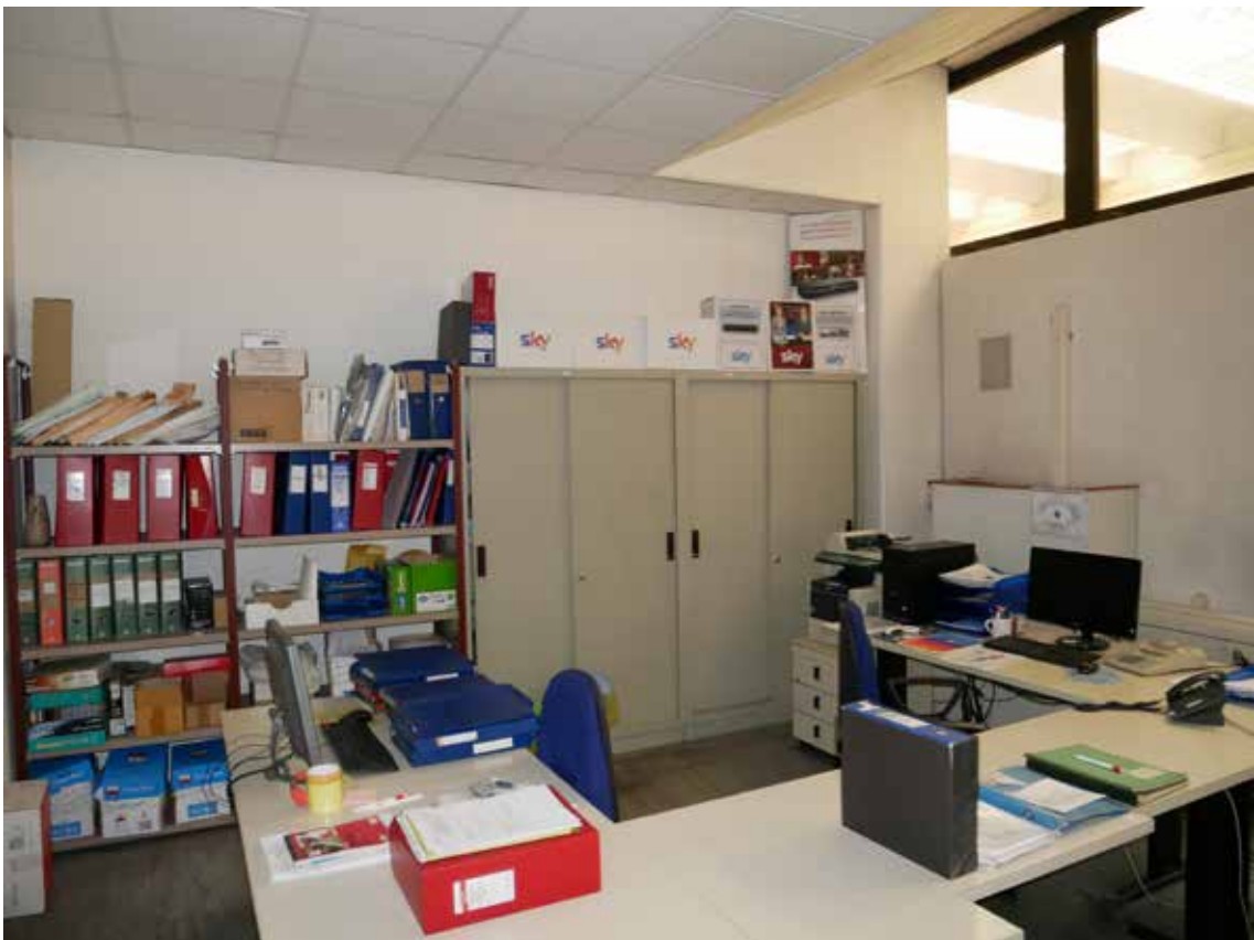
foto 18 - vista interna negozio