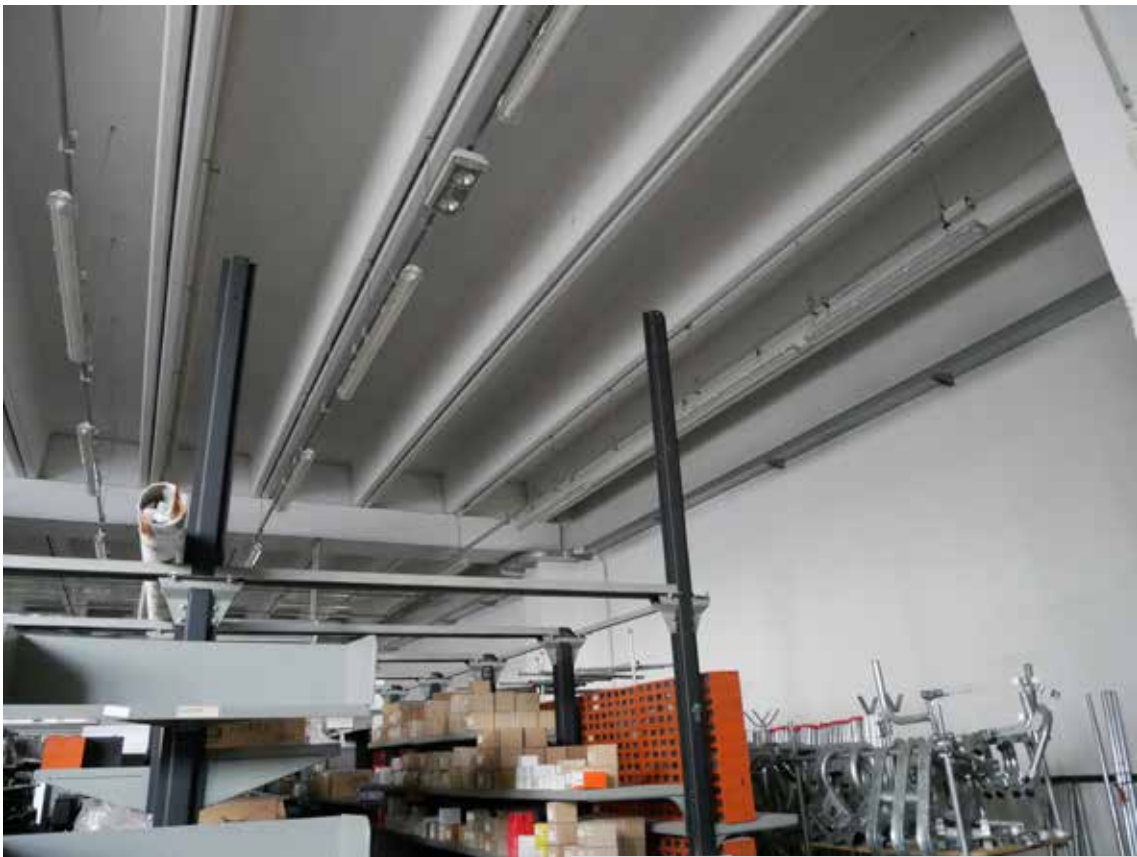
foto 15 - vista interna negozio