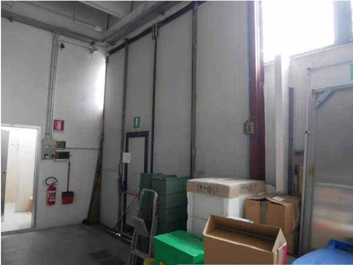
foto 13 - vista interna negozio