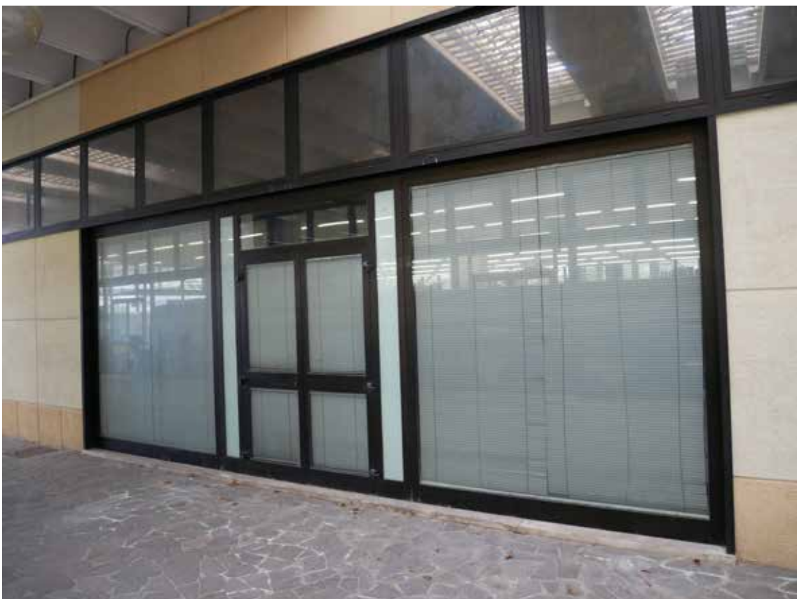
foto 02 - vista esterna negozio