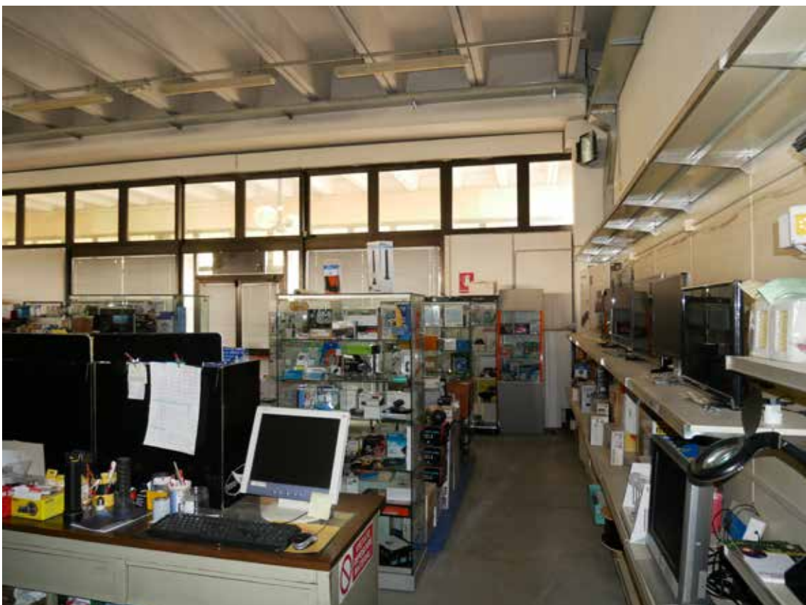
foto 10 - vista interna negozio