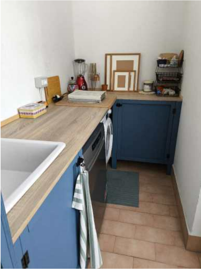
Veranda chiusa - Lavanderia