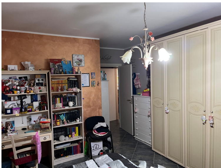
Foto 12 - Camera da letto singola -