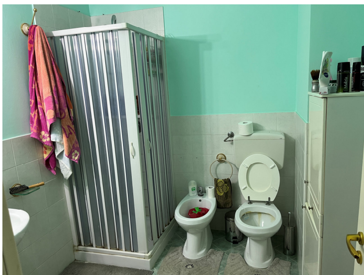
Foto 13 - WC doccia -