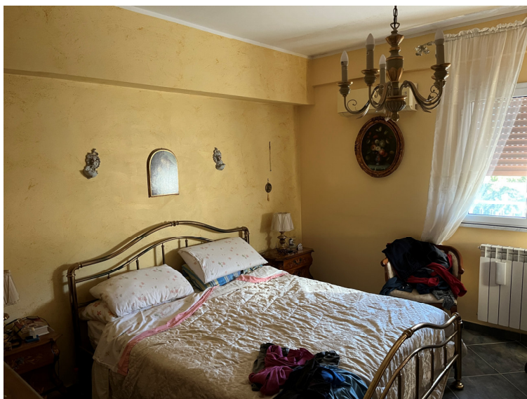
Foto 14 - Camera da letto doppia