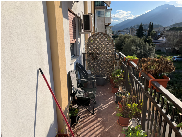
Foto 16 - balcone su cortile interno -