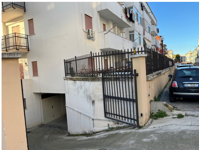
Foto 18 Ingresso carrabile scantinato