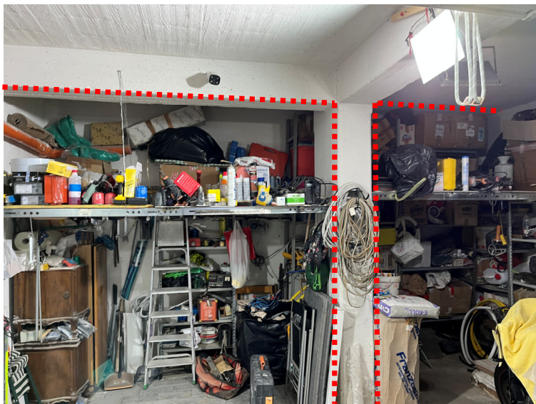
Foto 20 - box auto (assenza del setto murario che funge da intercapedine fondale)