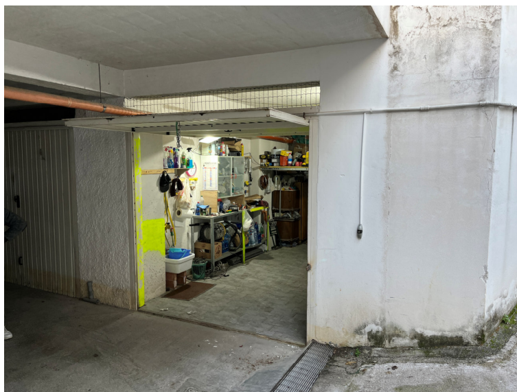
Foto 19 - box auto int. 1 -