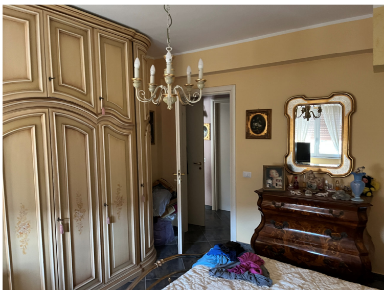
Foto 15 - Camera da letto doppia