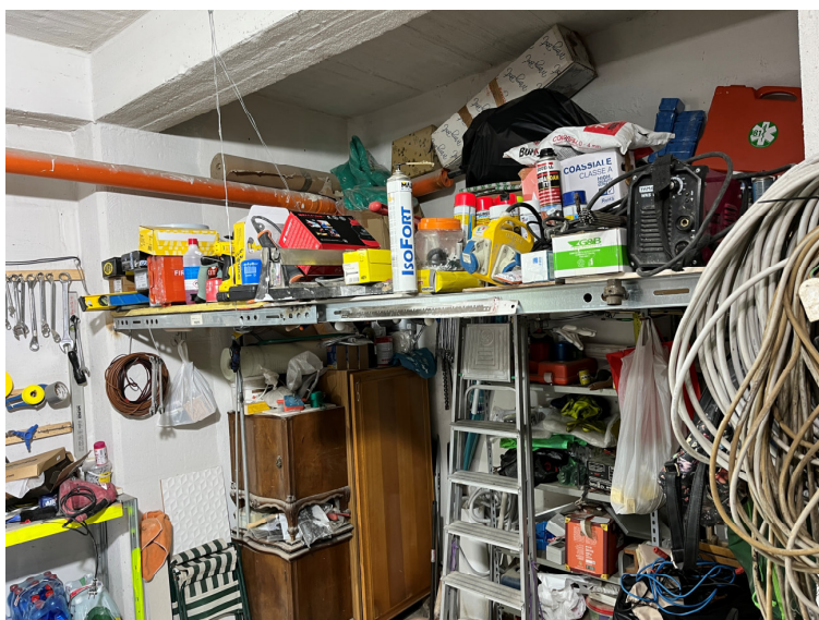
Foto 21 - vista prospettica interno box .-