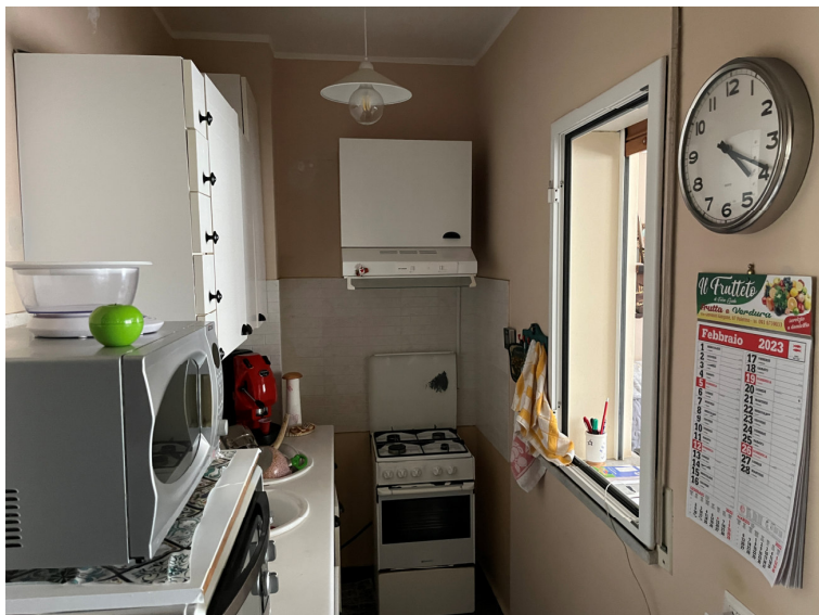
Foto 5 - Angolo cucina.-