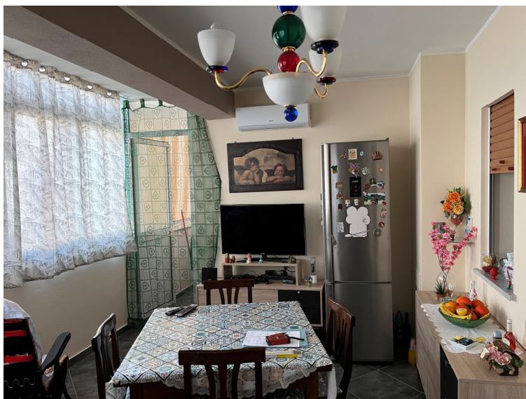
Foto 6 - Vista prospettica porzione di balcone annesso alla cucina chiuso a veranda -