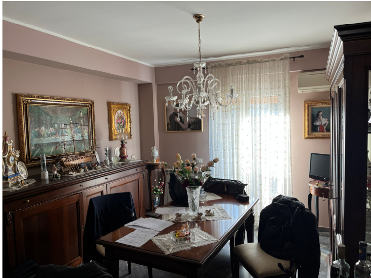
Foto 4 - Soggiorno -