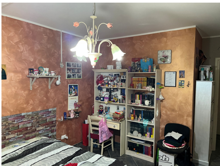
Foto 11 - Camera da letto singola -