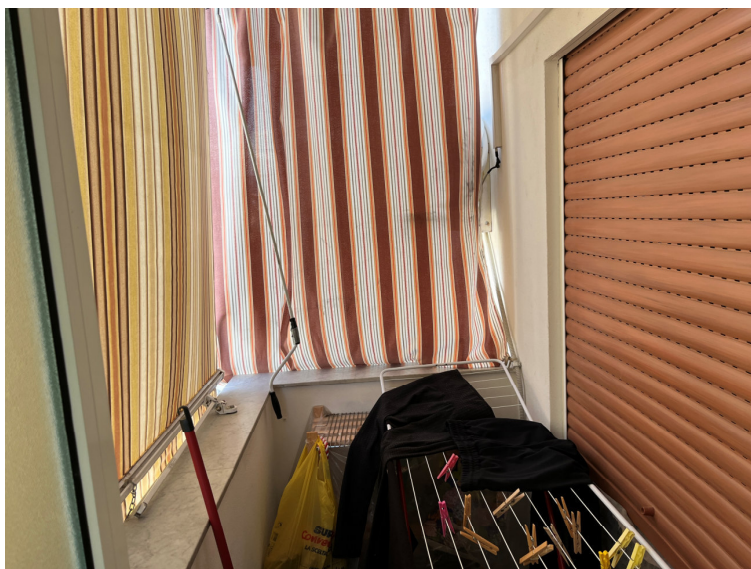
Foto 8 - porzione di balcone lato cucina - non chiuso a veranda -