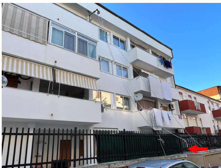
Foto 1 - Vista prospettica su via Domenico Macaluso n. 34 -