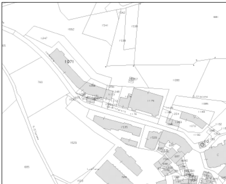
Estratto di mappa