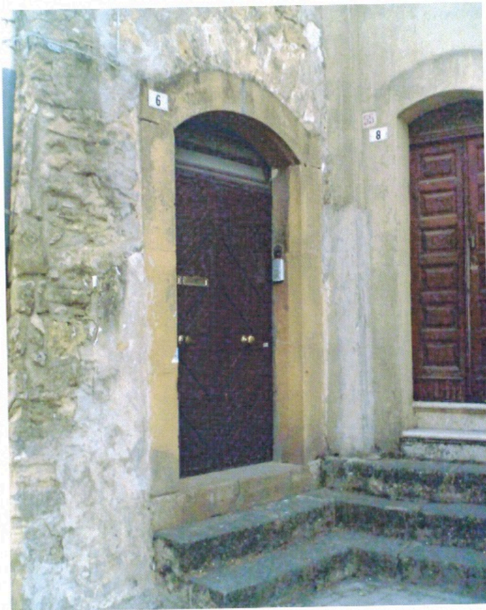
INGRESSO ALL'ABITAZIONE VIA DOTT. SALVATORE LA MALFA N. 6 (Foto n. 1)