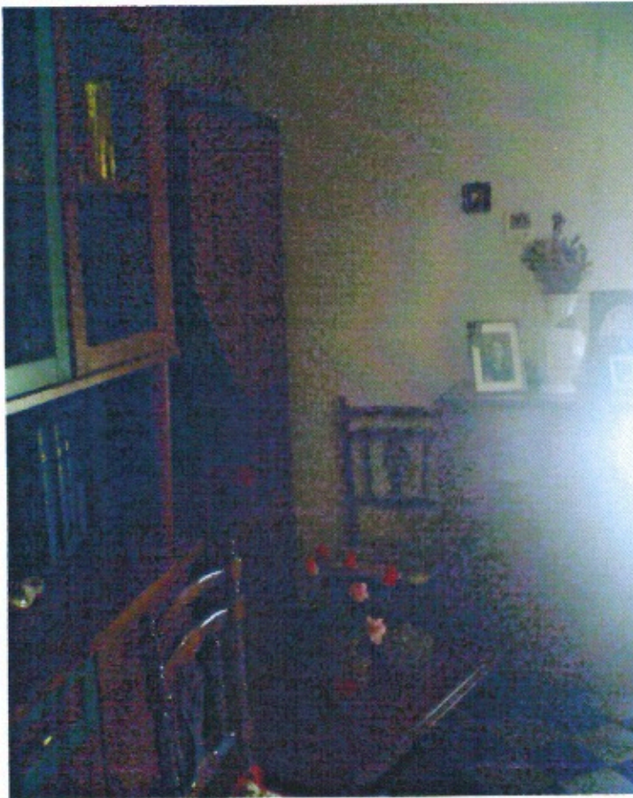
LOCALE SOGGIORNO PIANO PRIMO (foto n. 4)