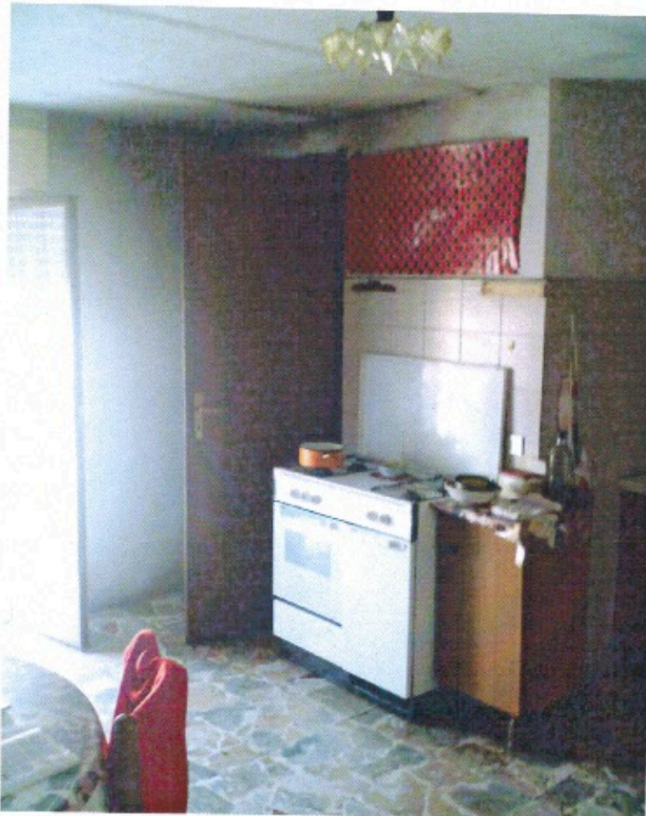
LOCALE CUCINA-PRANZO PIANO SECONDO (foto n. 8)