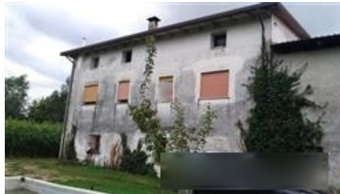
Vista generale da Nord-Ovest