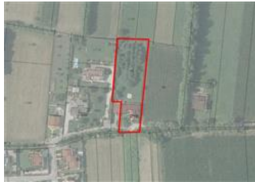
Sovrapposizione tra ortofoto ed estratto catastale