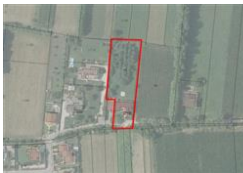
Sovrapposizione tra ortofoto ed estratto catastale

Il traffico nella zona è locale, i parcheggi sono sufficienti. Sono inoltre presenti i servizi di urbanizzazione primaria e secondaria.