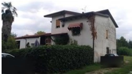
Vista generale da Sud-Est

L'intero edificio si sviluppa in parte su due piani fuori terra (locali agricoli) e in parte su quattro piani, di cui tre fuori terra e uno interrato (residenza). L'Immobilabile è stato realizzato a partire dal 1972.