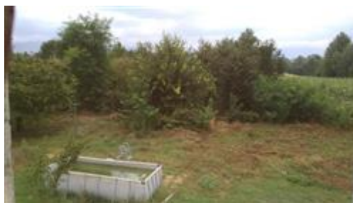
Vista generale da Sud

Il terreno confina a Nord con i mappali nn. 1137 e 87, a Est con il mappale n. 95, a Sud con i mappali n. 595 e 218 (interessato dalla presente procedura) e a Ovest con i mappali nn. 635, 1113 e 1112.