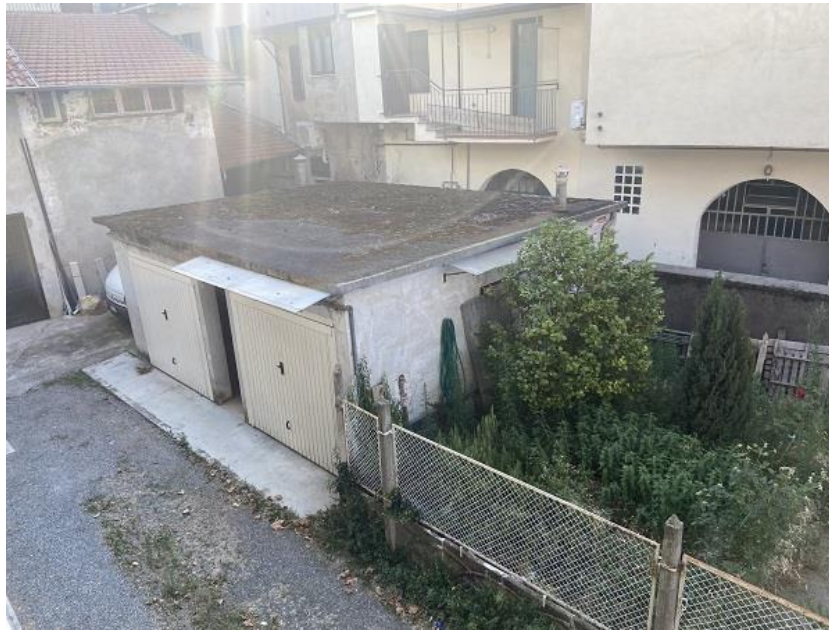
Foto 30: Autorimesse e relativo cortile di pertinenza sulla destra.