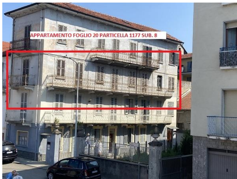
Foto 1: Prospetto sud/ovest principale sul cortile interno e su via Spianata Fiera n. 6.

N.C.E.U: Abitazione al foglio 20 particella 1177 subalterno 8 e n. 2 autorimesse al foglio 20 particella 965 subalterni 2 e 3.