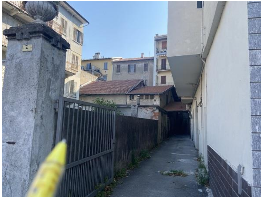
Foto 32: Passaggio retrostante le autorimesse e il cortile di pertinenza sulla sinistra.