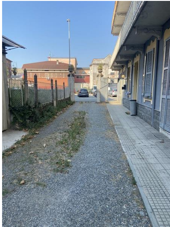
Foto 6: Cortile condominiale di accesso all'edificio ed alle autorimesse.