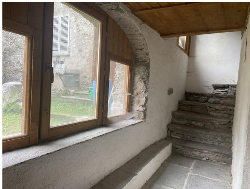
Foto 15: Prima parte di appartamento – Scala di accesso alla cantina con il portico che è stato chiuso.