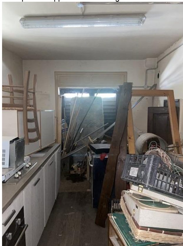
Foto 23: Seconda parte di appartamento – ripostiglio/camera che affaccia sul portico.