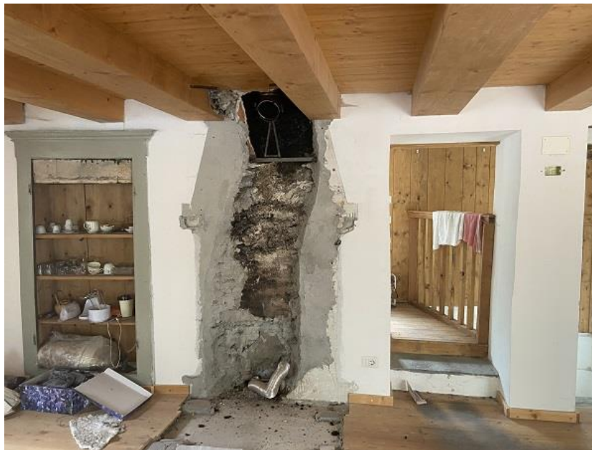
Foto 10: Prima parte di appartamento – Cucina / Pranzo con scasso per camino e accesso al disimpegno aperto del bagno.