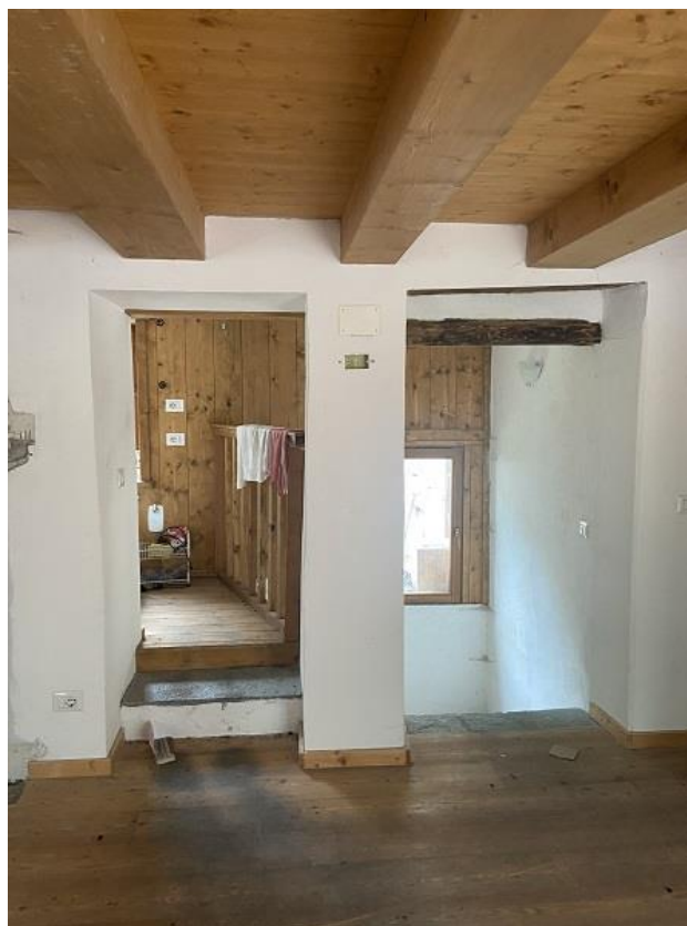
Foto 11: Prima parte di appartamento – Sulla sinistra accesso al bagno, sulla destra accesso alla cantina.