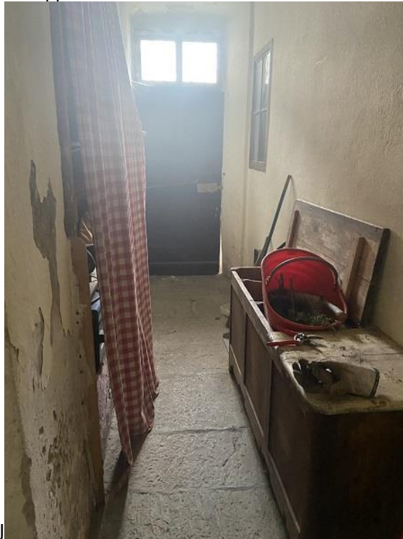
Foto 19: Corridoio comune che conduce al cortile comune e al cortile di proprietà.