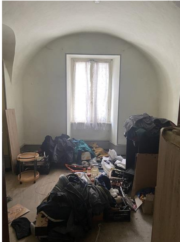
Foto 8: Prima parte di appartamento – Prima camera sulla sinistra.