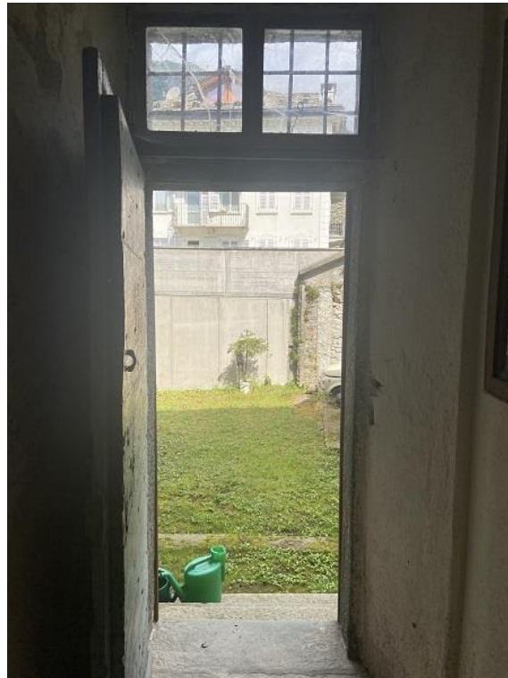
Foto 26: Porta di accesso dal corridoio comune al cortile comune.