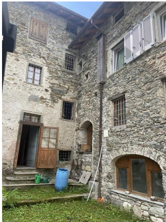
Foto 28: Cortile comune – in basso sulla destra il portico che è stato chiuso con un serramento.