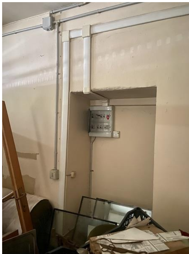
Foto 25: Seconda parte di appartamento – Quadro corrente dell'appartamento al primo piano.