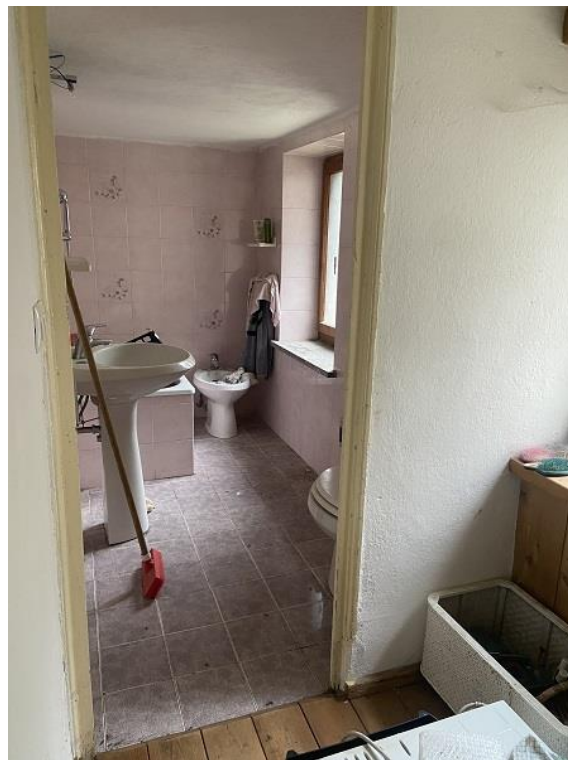
Foto 13: Prima parte di appartamento – Bagno di altezza interna pari a 1,85 m.