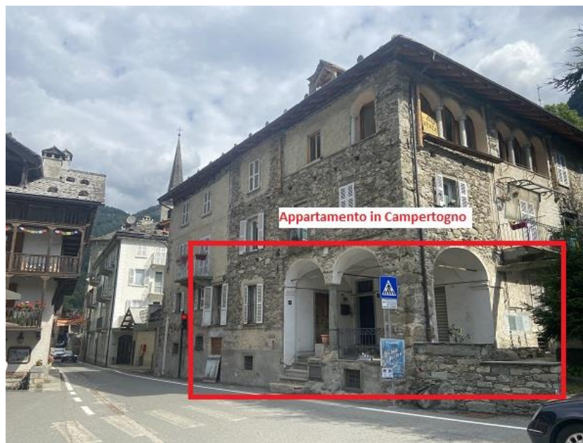
Foto 1: Prospetto sud/est principale su corso Umberto I la strada principale che passa da Campertogno (VC).

N.C.E.U: foglio 11 particella 627 subalterno 5.