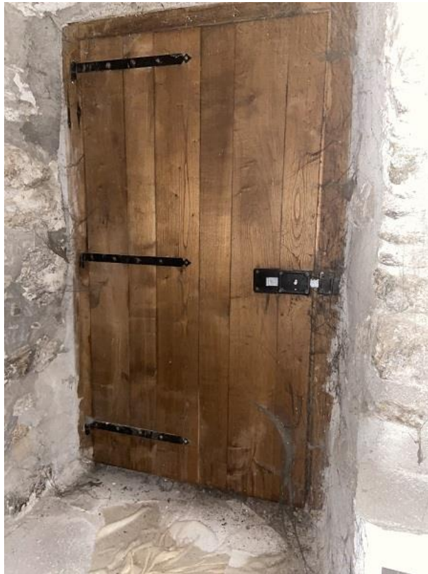
Foto 18: Prima parte di appartamento - Porta di accesso dalla cantina da corso Umberto I.