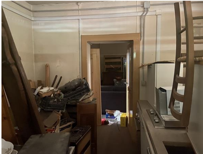
Foto 24: Seconda parte di appartamento – ripostiglio/camera che affaccia sul portico.