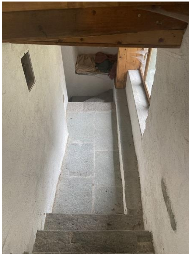
Foto 14: Prima parte di appartamento – Scala di accesso alla cantina con il portico che è stato chiuso.