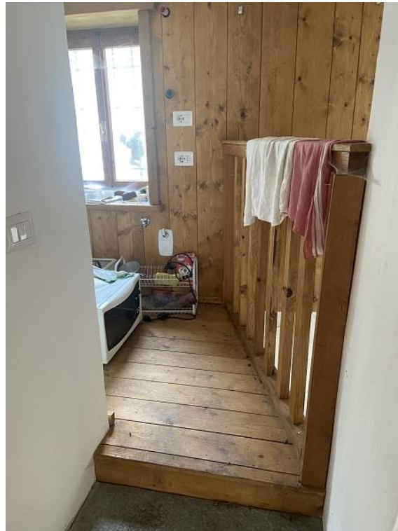
Foto 12: Prima parte di appartamento – Disimpegno aperto del bagno.