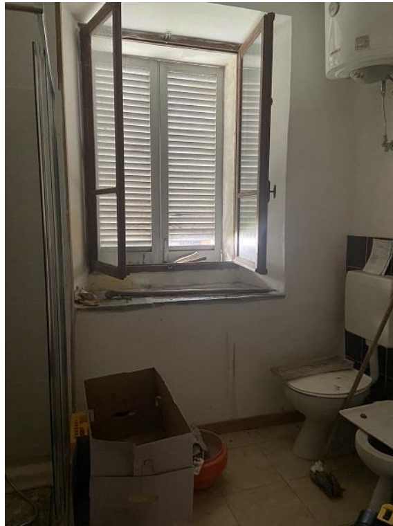
Foto 22: Seconda parte di appartamento – Bagno che affaccia sul cortile comune.