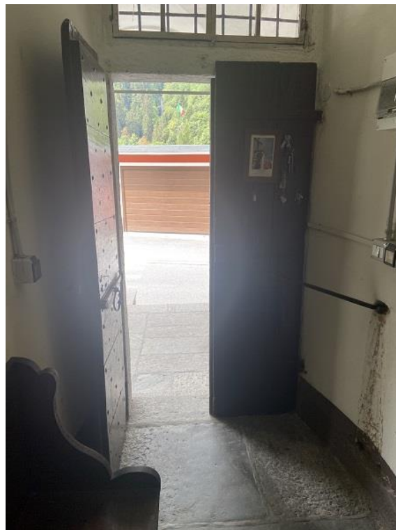
Foto 5: Porta di ingresso comune dal portico su strada vista dall'interno.