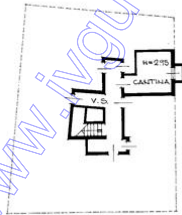
PIANTA PIANO SCANTINATO