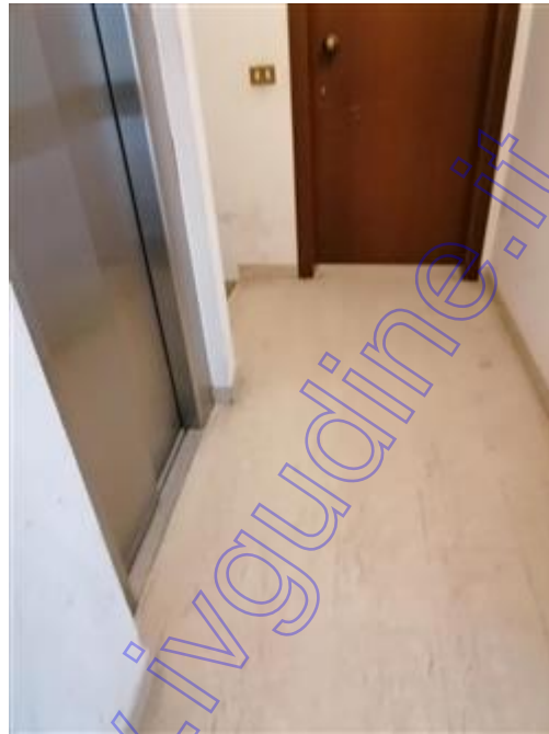
ingresso e ascensore