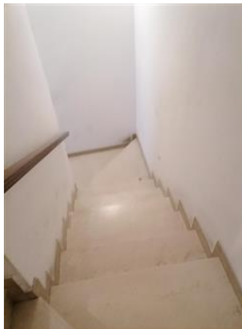
scale per accedere ai piani