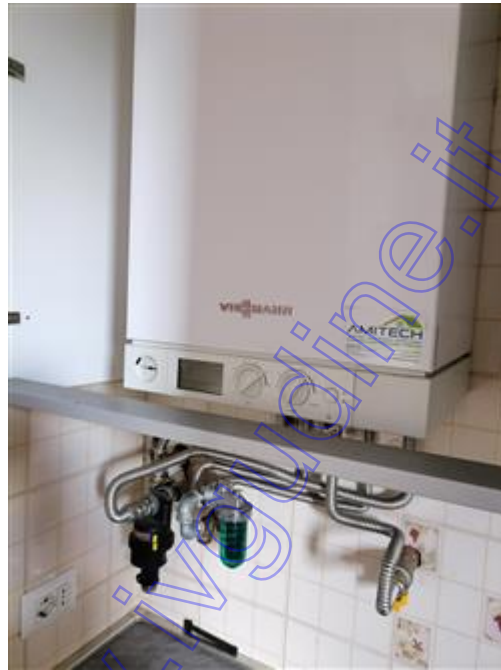
caldaia in cucina