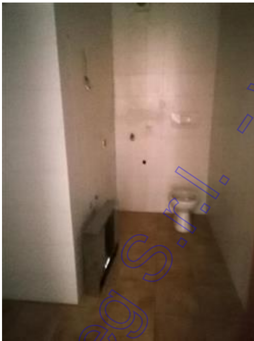
bagnetto di servizio