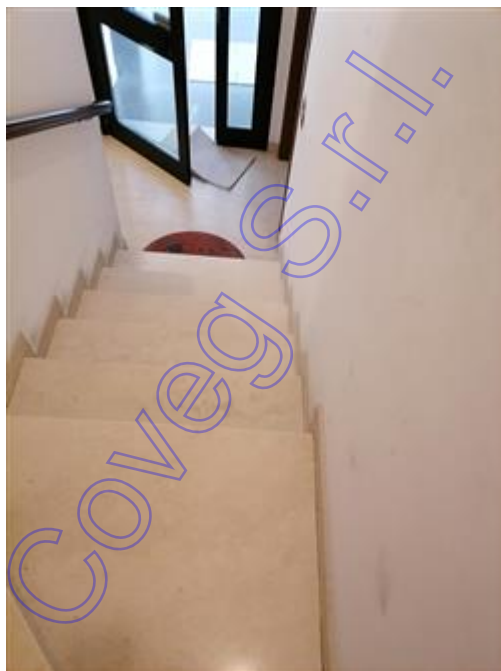
Ingresso condominio con portone in vetro e alluminio

L'intero edificio sviluppa 5 piani, 4 piani fuori terra, 1 piano interrato. Immobile costruito nel 1983 ristrutturato nel 1985.