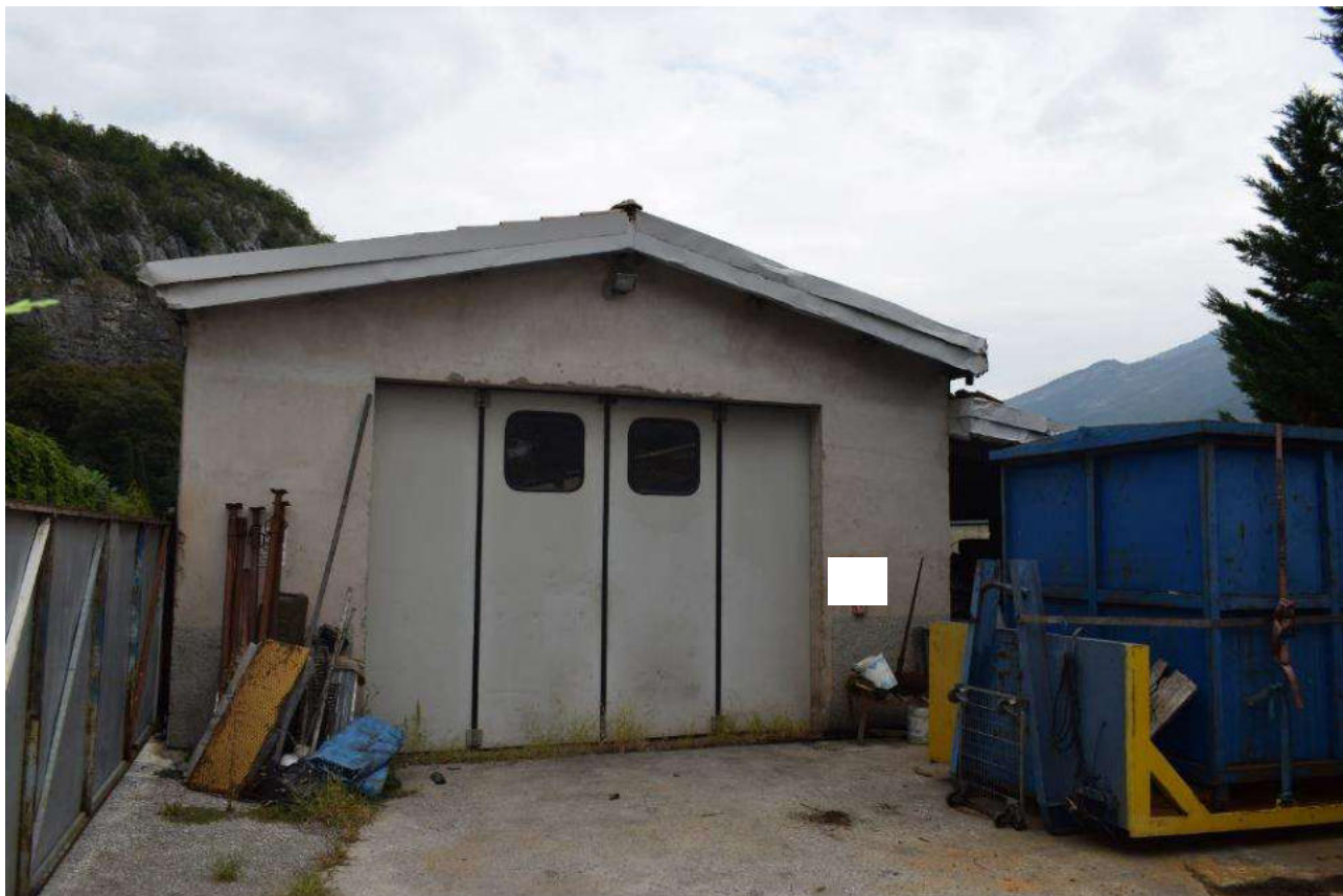
FRONTE SUD E PIAZZALE