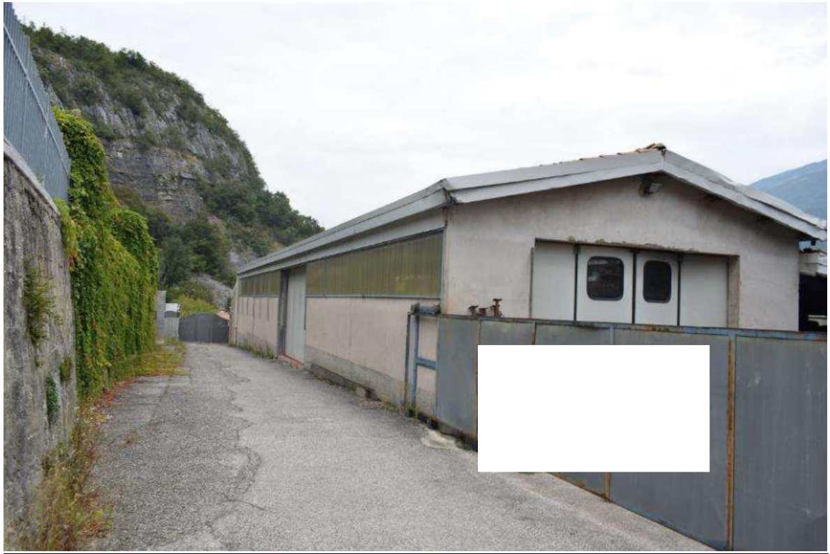
FRONTE SUD E OVEST