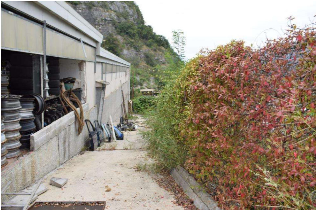
FRONTE EST – TETTOIA