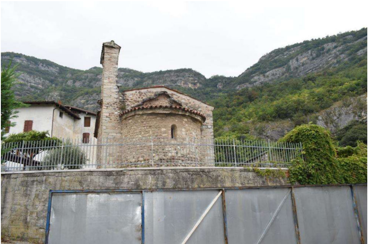
VISTA DEL CIRCONDARIO (CHIESA S. CECILIA)