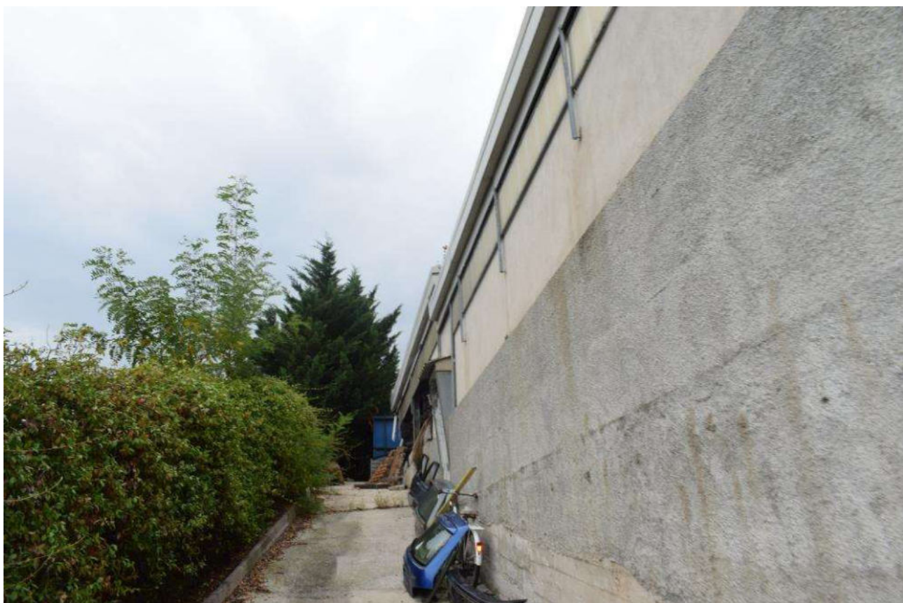
DETTAGLIO FRONTE EST