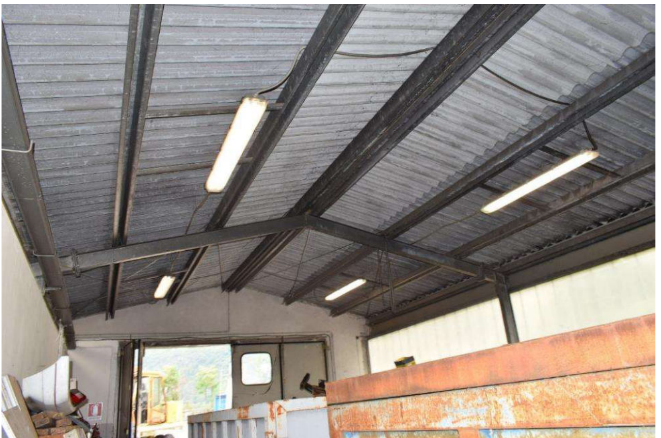
INTERNO CAPANNONE – TETTO