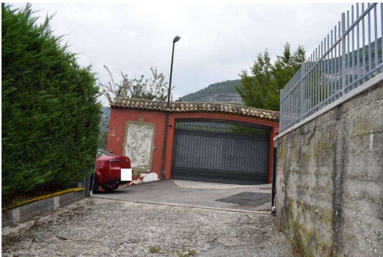
ZONA INGRESSO PROPRIETA' VISTA DA DENTRO