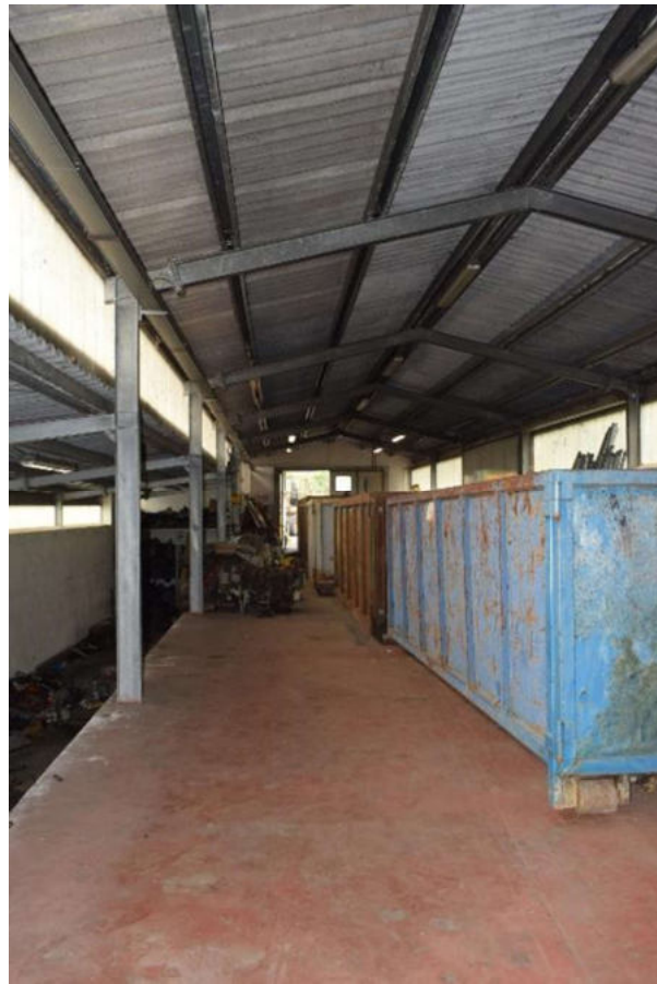
VISTA INTERNO CAPANNONE