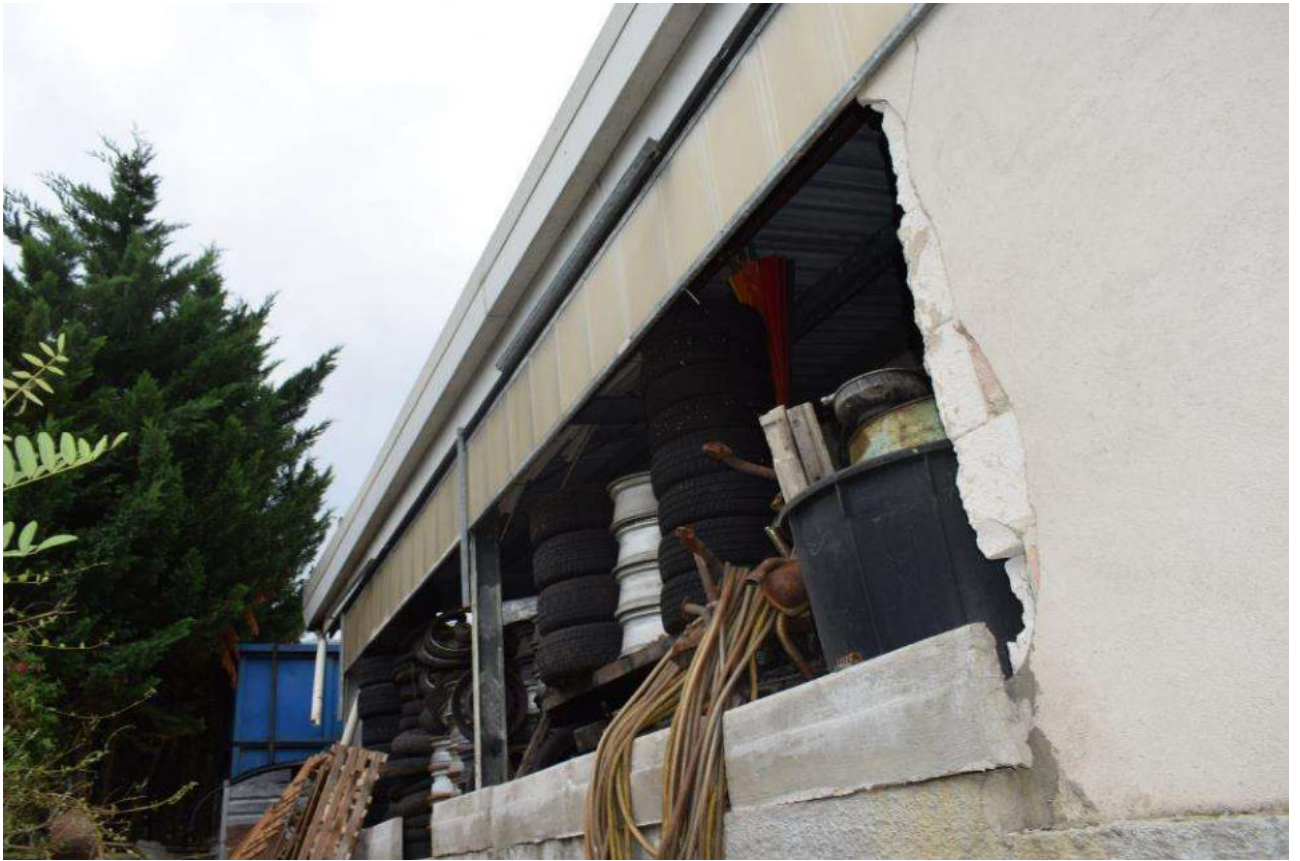
FRONTE EST – TETTOIA