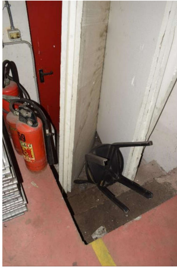
DETTAGLIO PORTA USCITA SU PIAZZALE OVEST