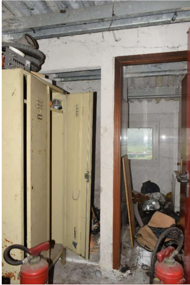
DETTAGLIO SERVIZI IGIENICI