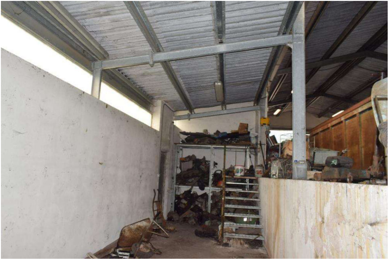
INTERNO CAPANNONE – PARTE “RIBASSATA”