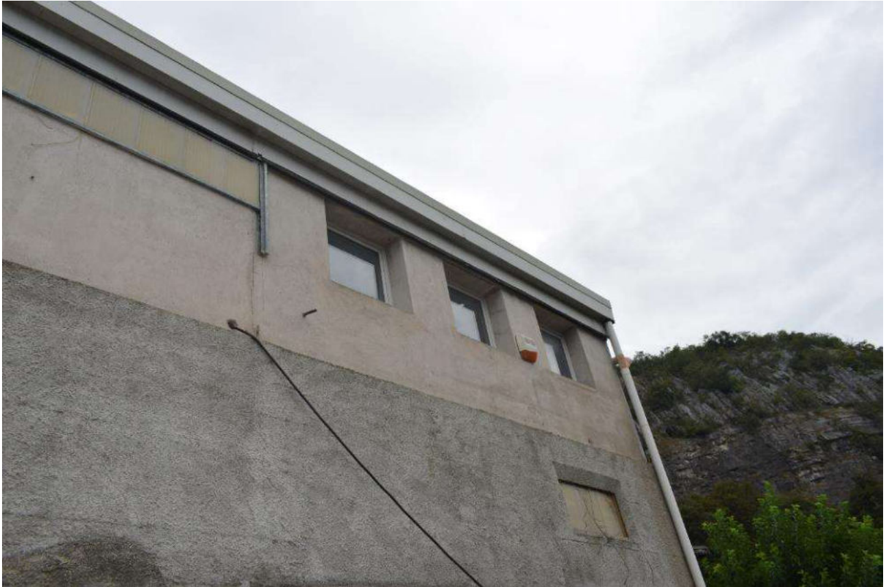
FRONTE EST – FINESTRE UFFICIO-WC