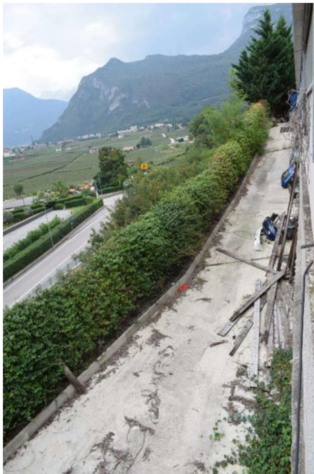
CORTILE EST VISTO DA FINESTRA UFFICIO