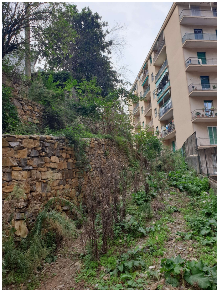
Foto 4 – 5 : Primo tratto del percorso per raggiungere l'immobile