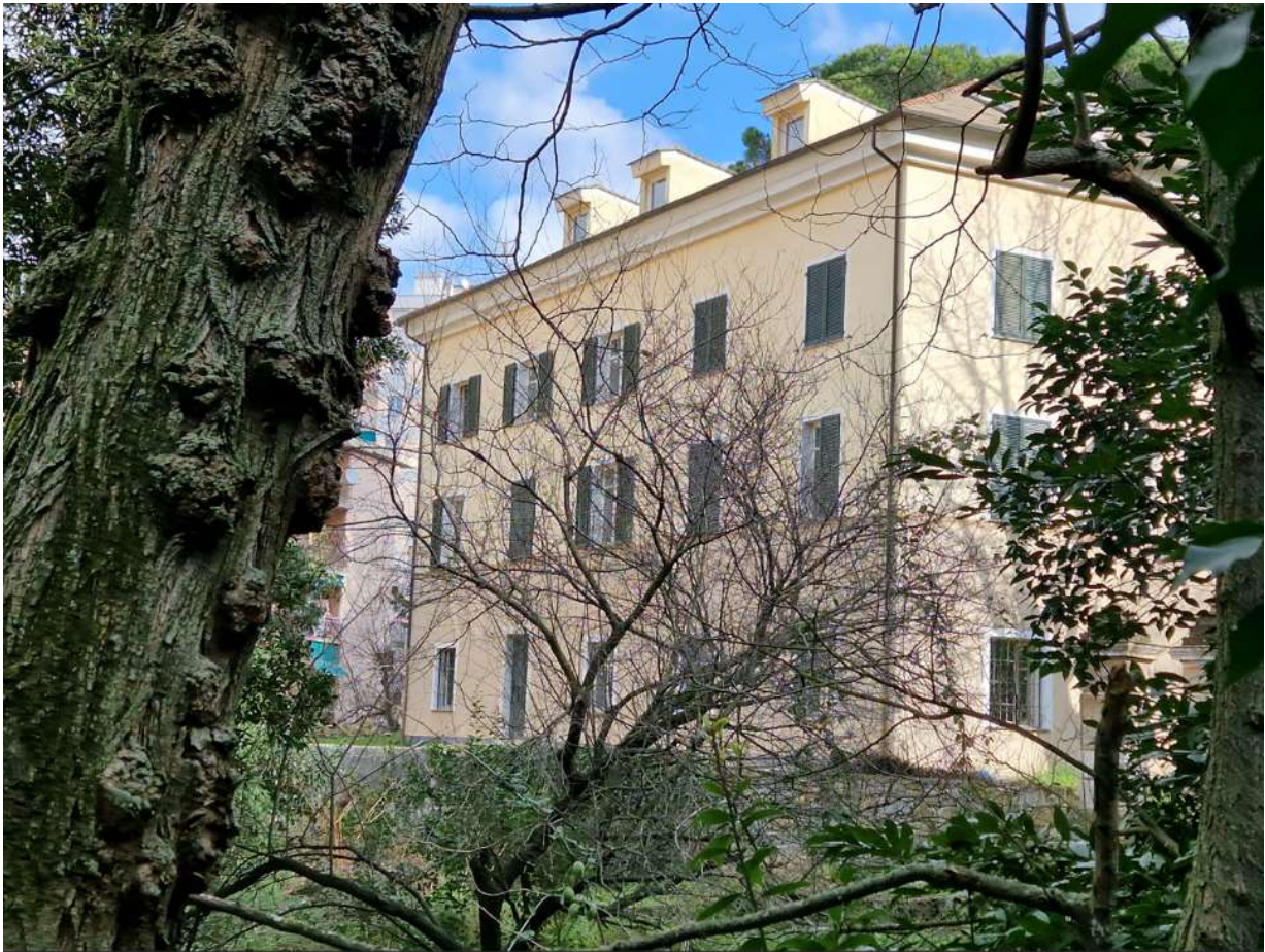
Foto 10: Fotografia scattata in data 10/02/2024 da "crosa" limitrofa