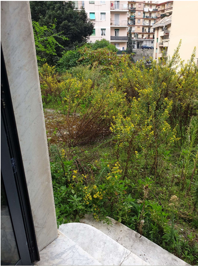
Foto 9: Area antistante prospetto principale immobile - dal portone