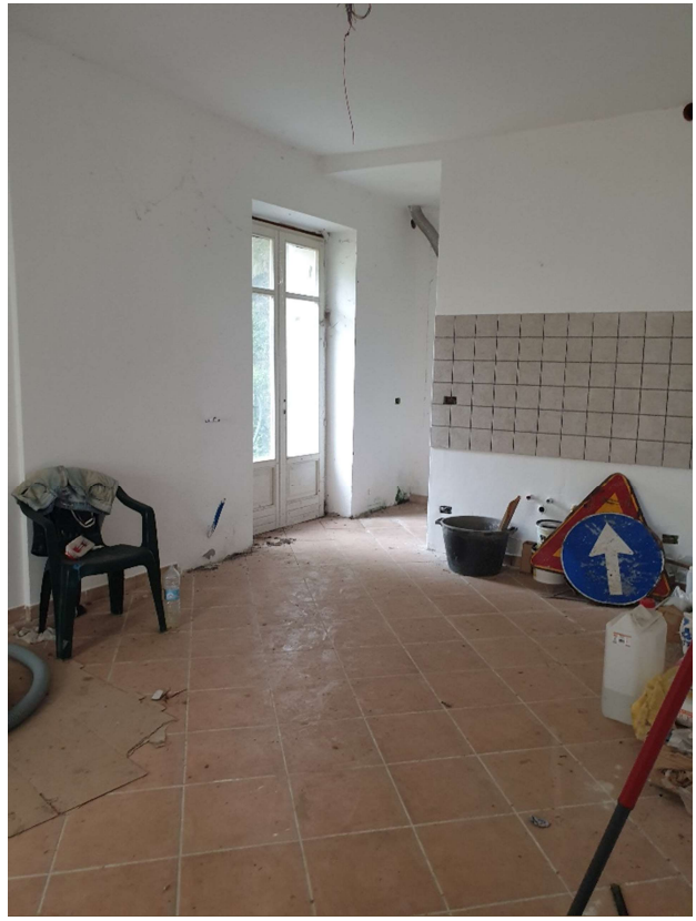
FOTO 7 - 8 - 9: Vano principale