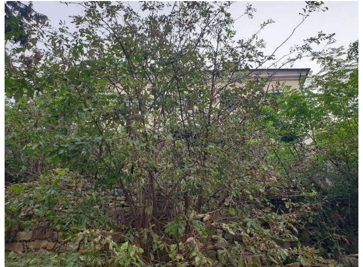
Foto 6 – 7: Secondo tratto del percorso per raggiungere l'immobile