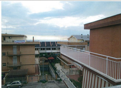
Foto n.18 Vista dalla terrazza prospiciente Via Svezia .

Appartamento in Comune di POMEZIA loc. TORVAIANICA Via Svezia n.207 Palazzina B Piano 3° Scheda n.9