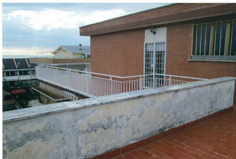
Foto n. 19 Vista della grande terrazza confinate su tre lati dell'abitazione.