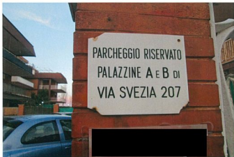
Foto n. 6 Condominio di Via Svezia 207 palazzine A e B. Targa condominiale.