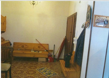
Foto n.9 Ingresso all'appartamento oggetto di esecuzione.

Appartamento in Comune di POMEZIA loc. TORVALANICA Via Svezia n.207 Palazzina B Piano 3° Scheda n.5