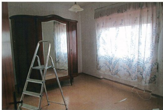
Foto n. 15 Camera.