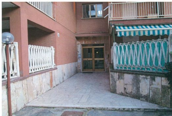
Foto n. 4 Ingresso alla palazzina "B". Condominio di Via Svezia 207 palazzine A e B.