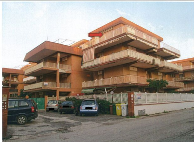
Foto n.5 Vista del piazzale destinato al parcheggio delle auto dei condomini delle due palazzine A e B. La freccia indica l'appartamento oggetto di esecuzione.

Appartamento in Comune di POMEZIA loc. TORVALANICA Via Svezia n.207 Palazzina B Piano 3° Scheda n.3