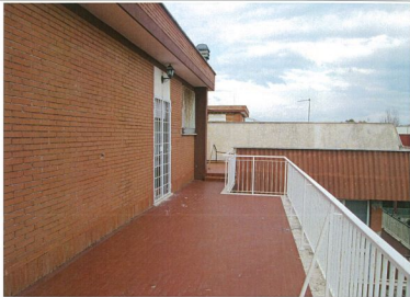
Foto n.20 Terrazza, lato destro dell'appartamento.

Appartamento in Comune di POMEZIA loc. TORVAIANICA Via Svezia n.207 Palazzina B Piano 3° Scheda n.10