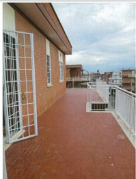
Foto n.21 Terrazza, fronte dell'appartamento.