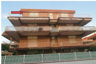
Foto n. 2 Prospetto principale del fabbricato. La freccia indica l'appartamento oggetto di esecuzione.