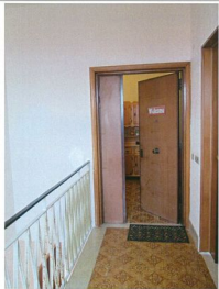
Foto n.10 Portoncino blindato dell'appartamento.