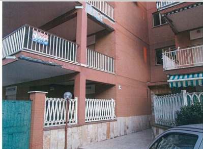
Foto n.7 Si evidenziano i lavori di ripristino dei manufatti in calcestruzzo armato ammalorati.

Appartamento in Comune di POMEZIA loc. TORVAIANICA Via Svezia n.207 Palazzina B Piano 3° Scheda n.4