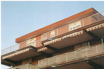
Foto n. 8 Lavori di ripristino frontalino balconi.