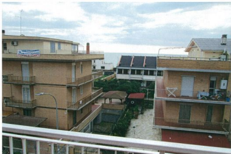
Foto n. 17 Vista mare dalla grande terrazza.