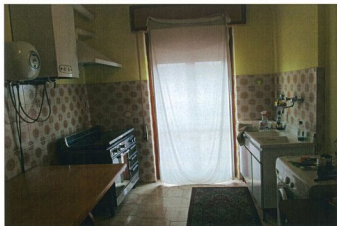
Foto n. 13 Cucina.