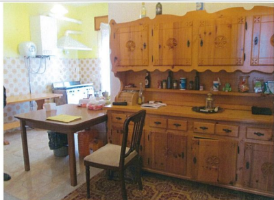
Foto n.12 Vista dell'ingresso-cucina dell'appartamento oggetto di esecuzione.

Appartamento in Comune di POMEZIA loc. TORVAIANICA Via Svezia n.207 Palazzina B Piano 3° Scheda n.6