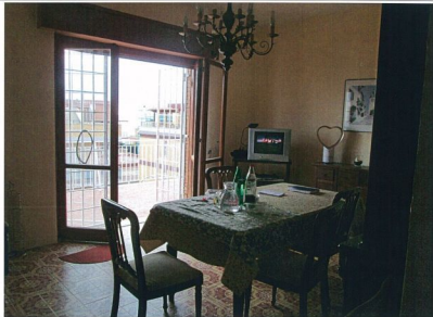
Foto n.14 Vista del soggiorno-pranzo.

Appartamento in Comune di POMEZIA loc. TORVALANICA Via Svezia n.207 Palazzina B Piano 3° Scheda n.7