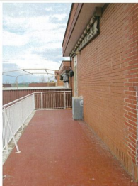
Foto n.22 Terrazza, lato sinistro dell'appartamento.