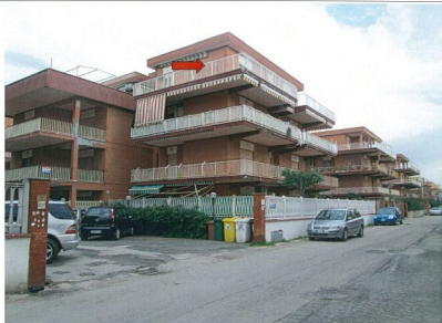
Foto n.1 Fabbricato in cui ricade l'appartamento oggetto di esecuzione. La freccia indica l'immobile.

Appartamento in Comune di POMEZIA loc. TORVALANICA Via Svezia n.207 Palazzina B Piano 3° Scheda n.1