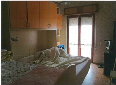
Foto n.16 Camera da letto.

Appartamento in Comune di POMEZIA loc. TORVAIANICA Via Svezia n.207 Palazzina B Piano 3° Scheda n.8