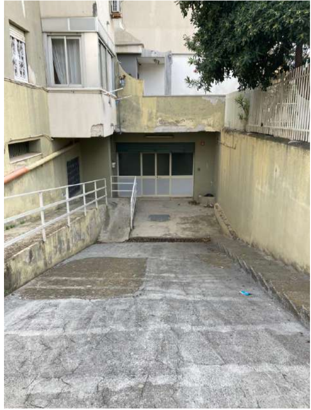
DISCENDERIA ED ACCESSO AD OVEST