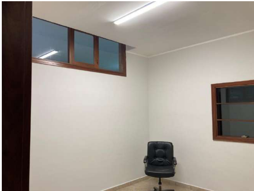
PRIMA STANZA ENTRANDO A DESTRA