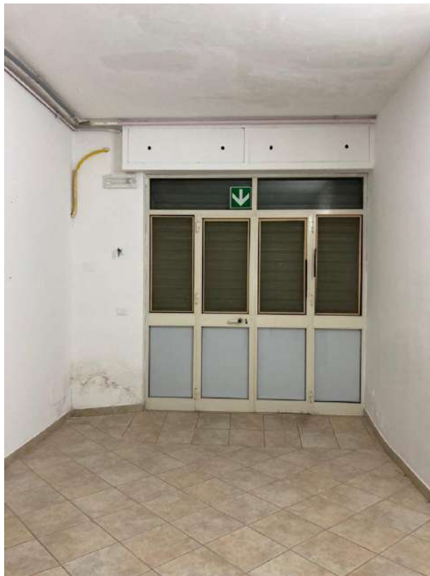
PORTA DI INGRESSO DA DISCENDERIA AD EST