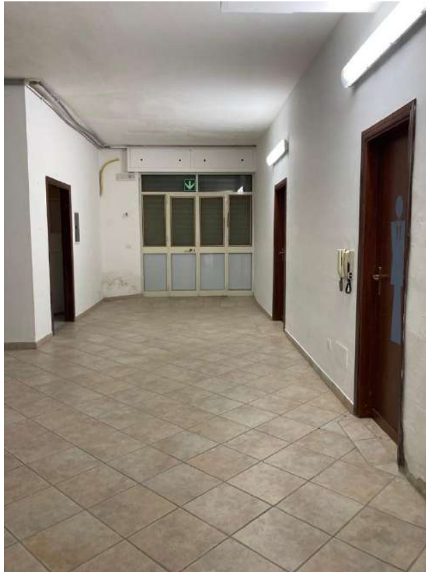
ACCESSO ZONA A3