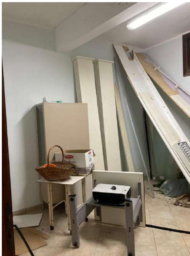
SECONDA STANZA ENTRANDO A DESTRA