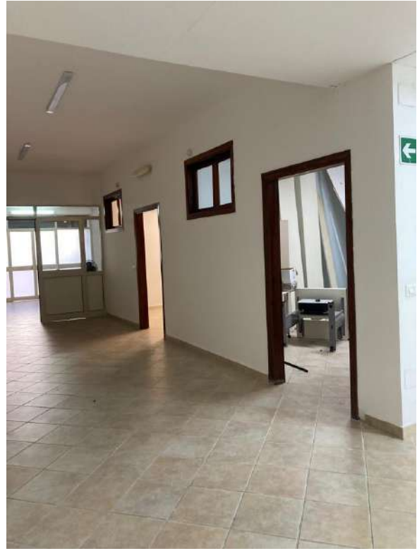
CORRIDOIO CHE IMMETTE NELLA ZONA B3 E INGRESSO STANZE