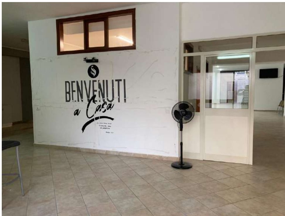
ACCESSO VERSO LA ZONA B4