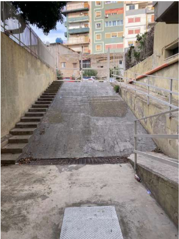
DISCENDERIA AD OVEST