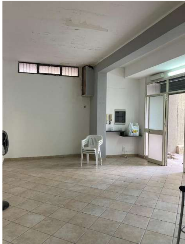
INGRESSO ALL'UNITA' IMMOBILIARE