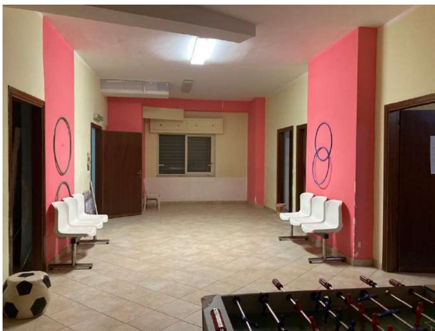
AMBIENTE UNICO CON APERTURA VERSO DISCENDERIA