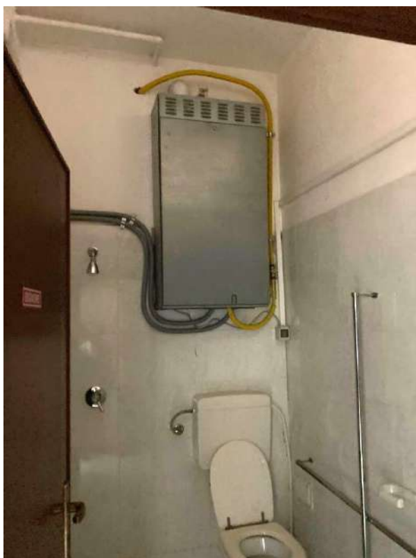
CALDAIA VERSO LA DISCENDERIA A EST