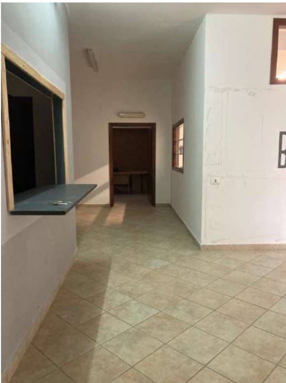
ACCESSO LOCALE UFFICIO