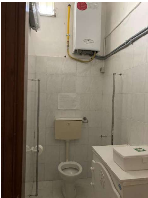
CALDAIA VERSO LA DISCENDERIA A OVEST