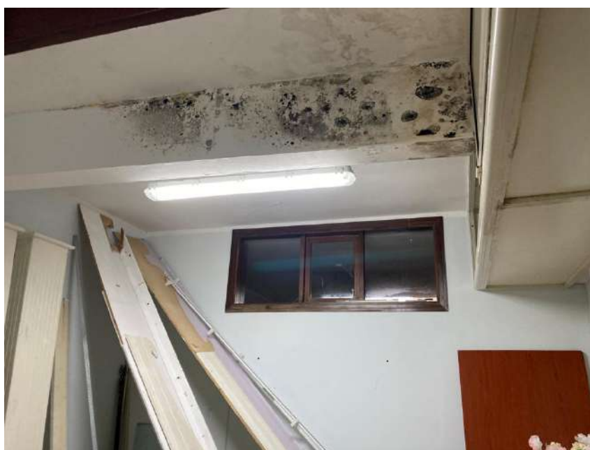
AREE INTERESSATE DA AMMALORAMENTO DELL'INTONACO PER PRESENZA CAVEDI