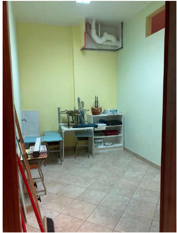
LOCALI ADIACENTI L'AMBIENTE UNICO PRINCIPALE