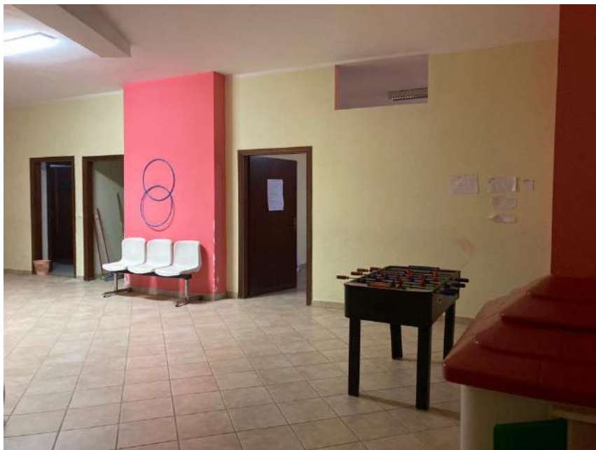
INGRESSO ALLA ZONA A4