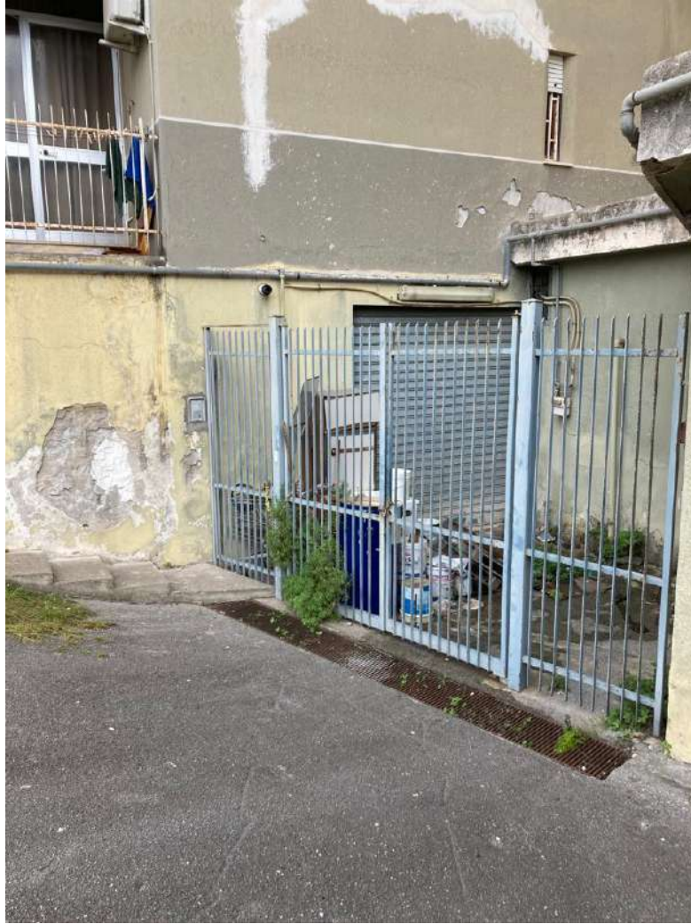
DISCENDERIA E CANCELLO DI ACCESSO A EST