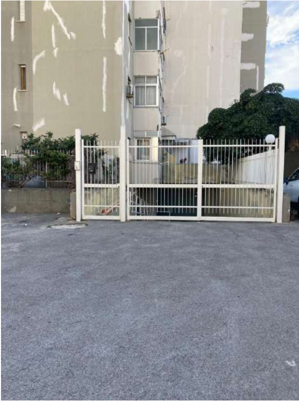
CANCELLO DI ACCESSO AD OVEST