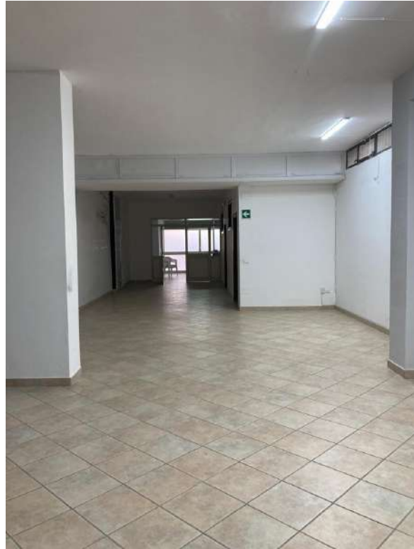
ACCESSO ZONA B3