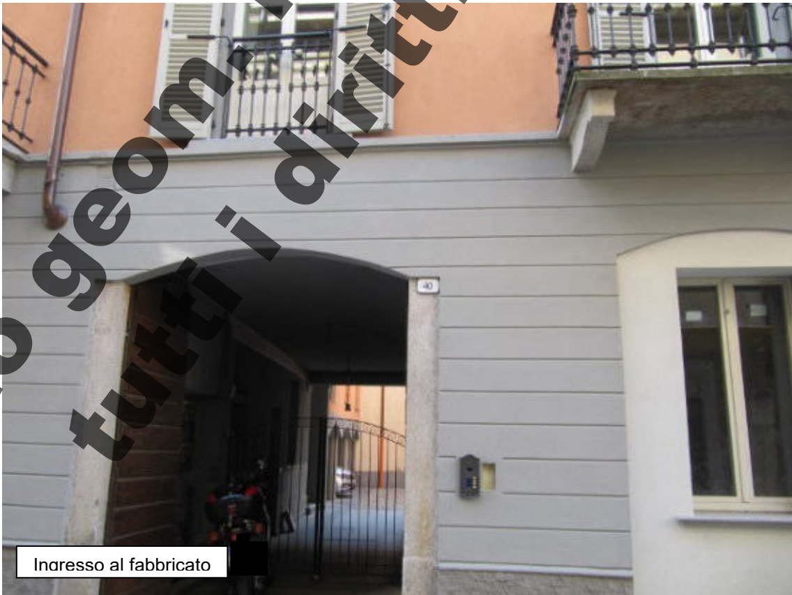
Ingresso al fabbricato