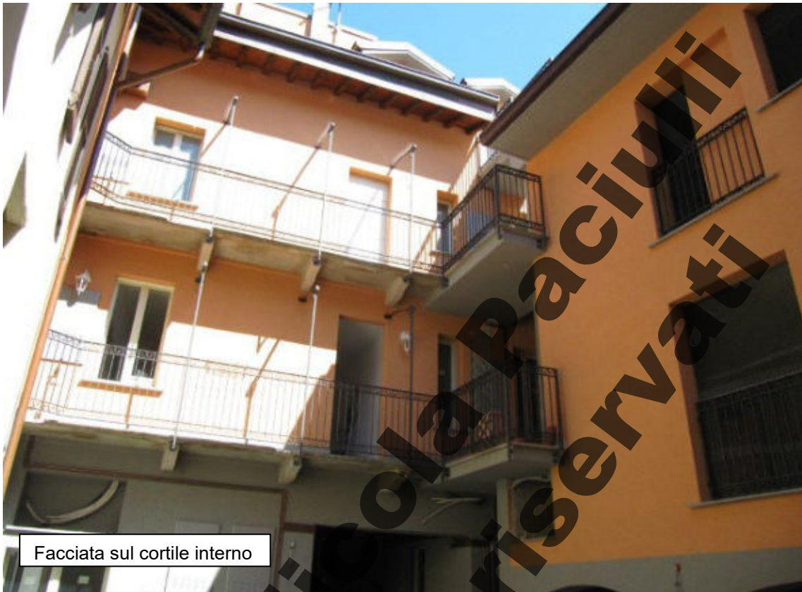
Facciata sul cortile interno