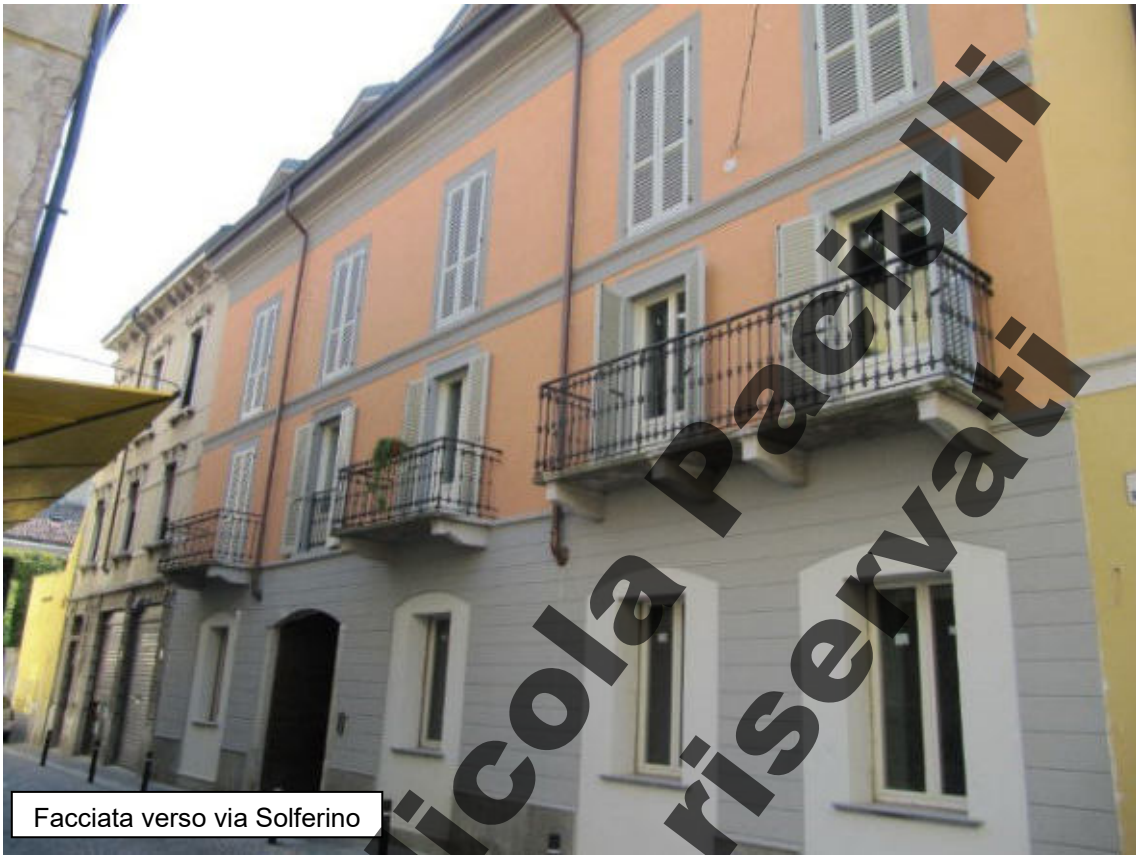
Facciata verso via Solferino