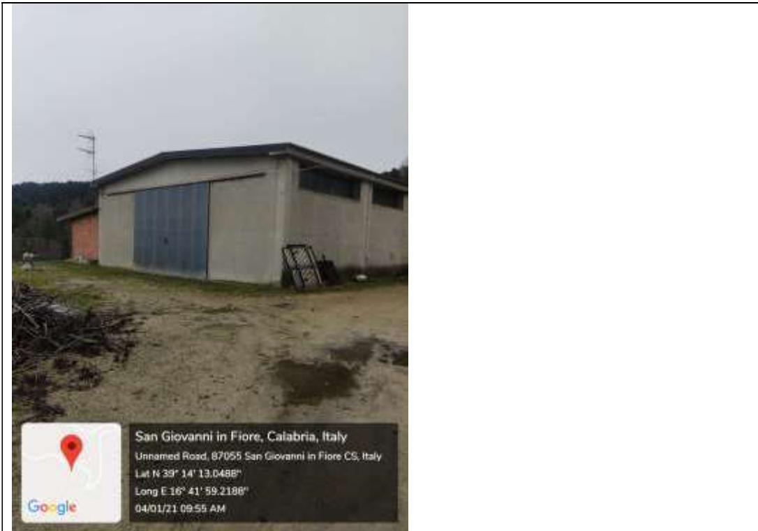
Figura 18 Capannone Industriale sub 3 Lato Sud-Ovest