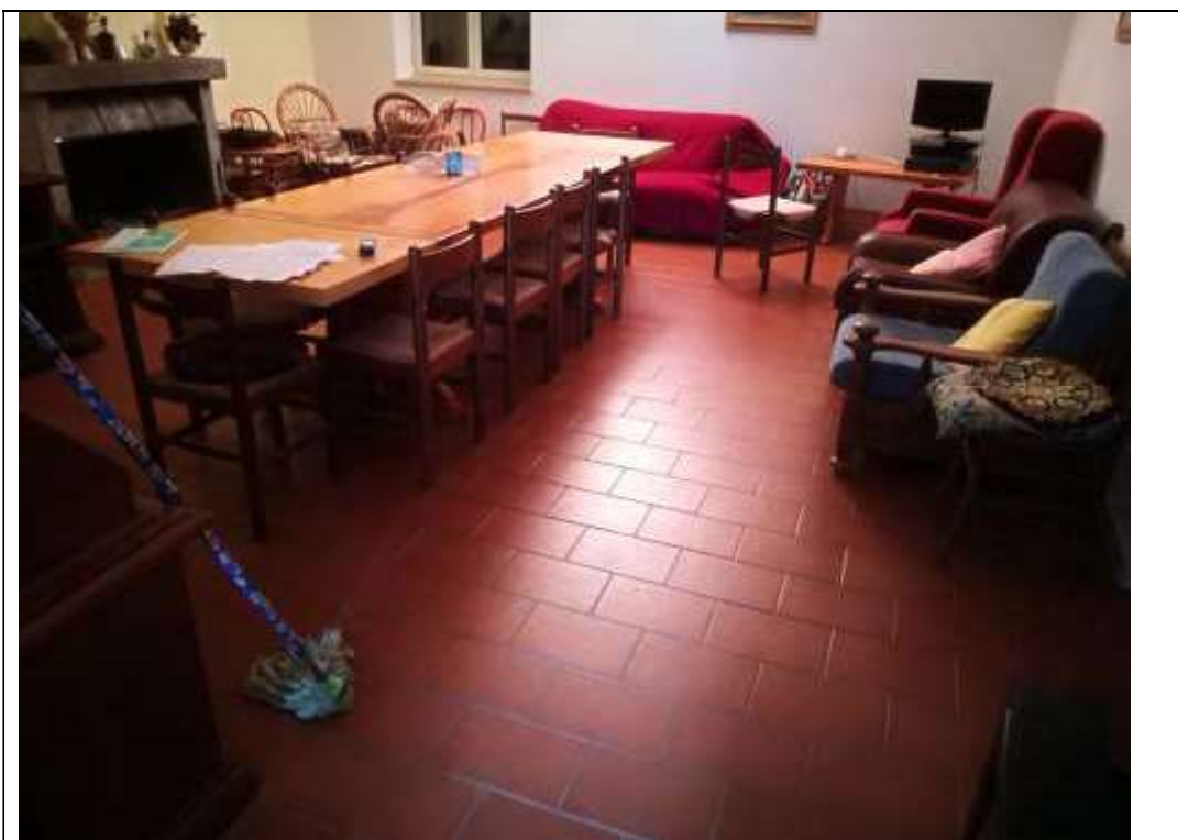
Figura 35 Piano primo sub 2– salone