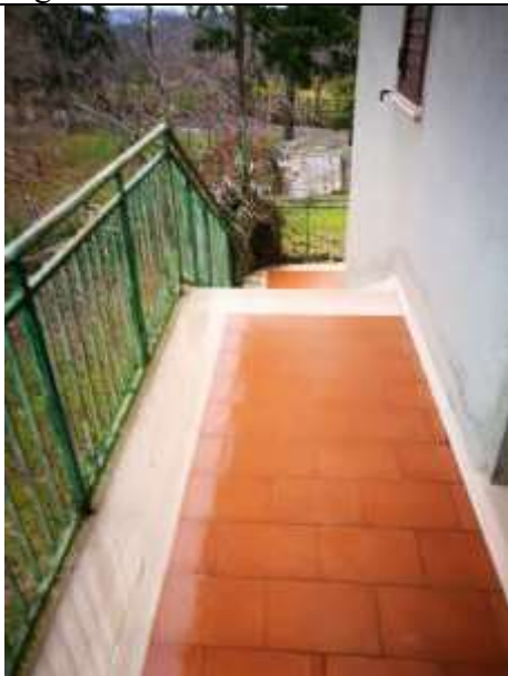
Figura 31 Piano primo sub 2 – scale di accesso