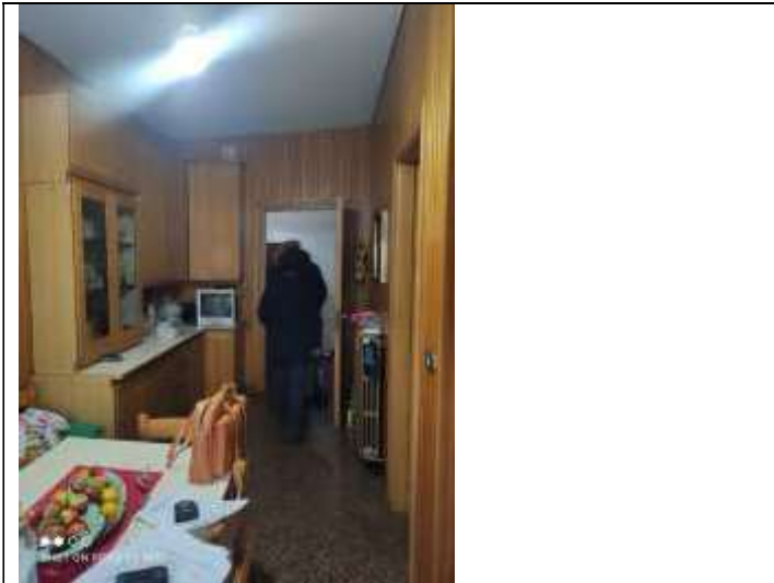
Figura 11 Cucina