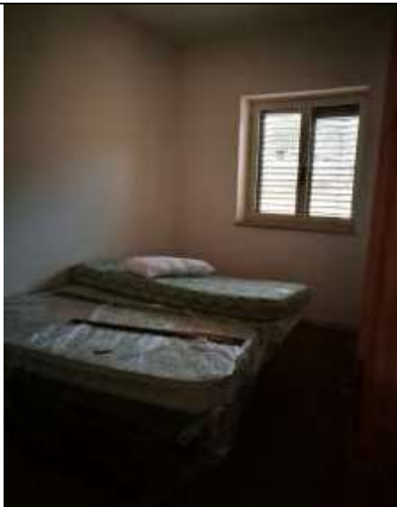
Figura 30 Piano terra sub 1 - letto