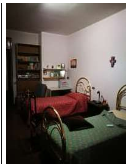
Figura 5 Camera da letto