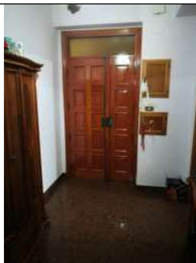
Figura 8 Ingresso