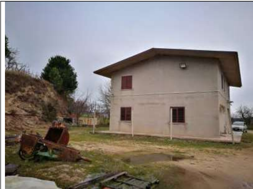
Figura 26 Fabbricato Facciata Sud Ovest