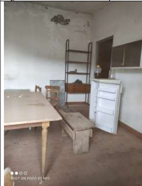
Figura 21 Edificio annesso al Capannone Industriale Lato Sud-Est