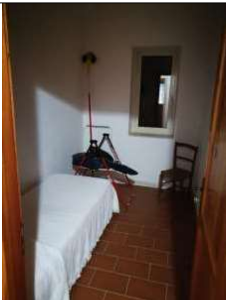
Figura 33 Piano primo sub 2– camera da letto