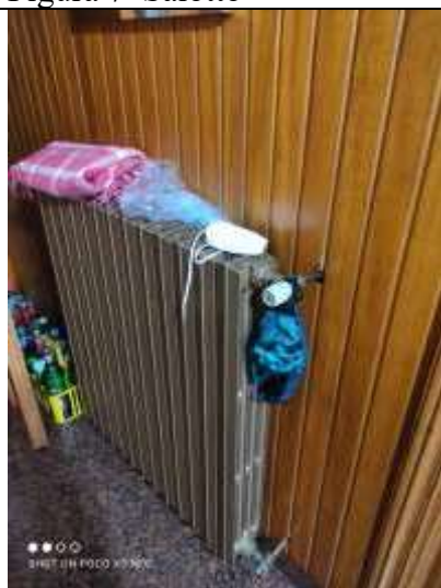
Figura 9 Dettaglio Termoconvettori