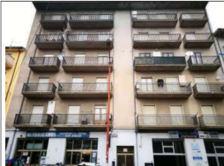
Figura 1 Vista frontale Palazzina Via panoramica 182