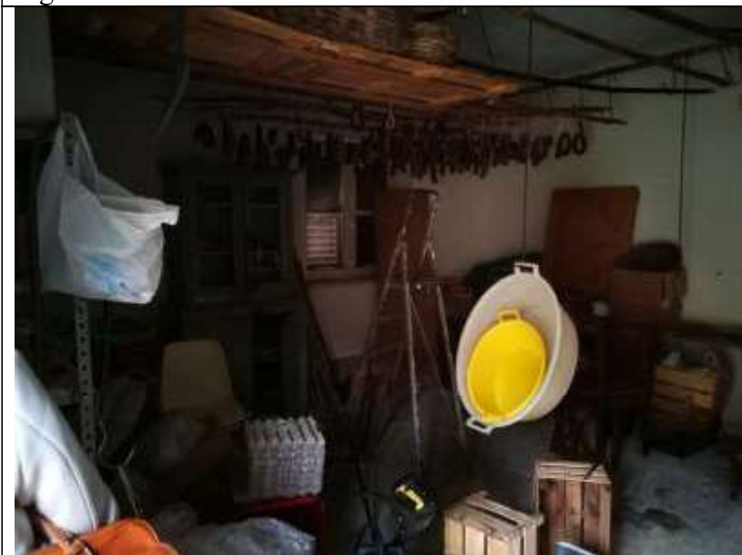
Figura 27 Piano terra sub 1 - deposito