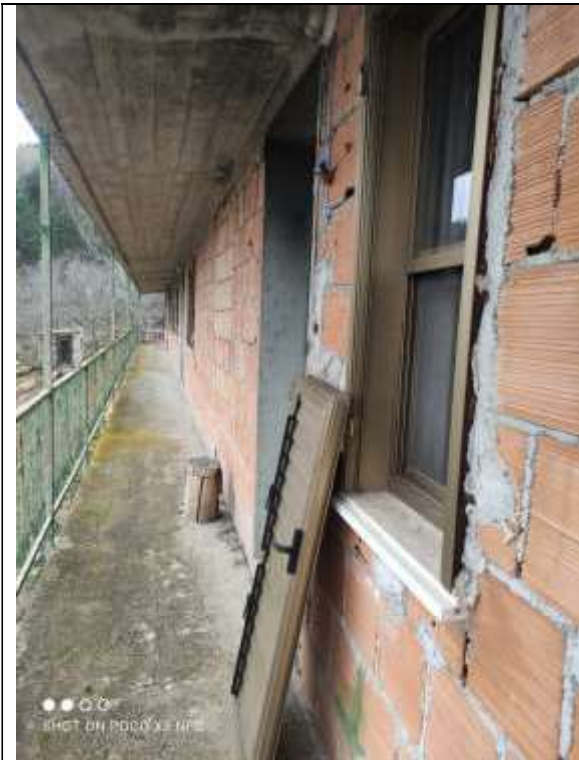
Figura 20 Edificio annesso al Capannone Industriale Lato Sud-Est