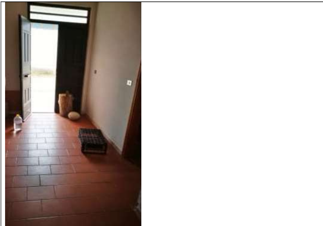
Figura 28 Piano terra sub 1 - ingresso