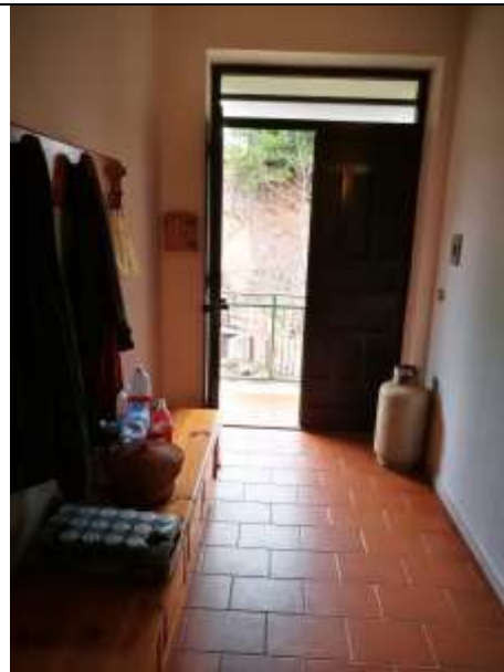
Figura 32 Piano primo sub 2 - ingresso