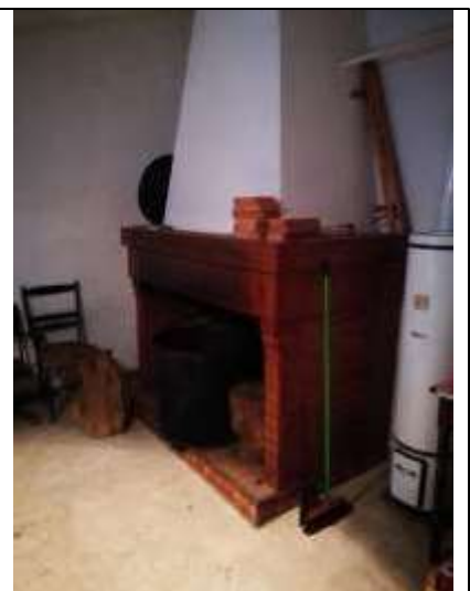
Figura 13 Dettaglio Caminetto soffitta