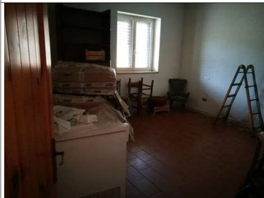
Figura 29 Piano terra sub 1 - letto