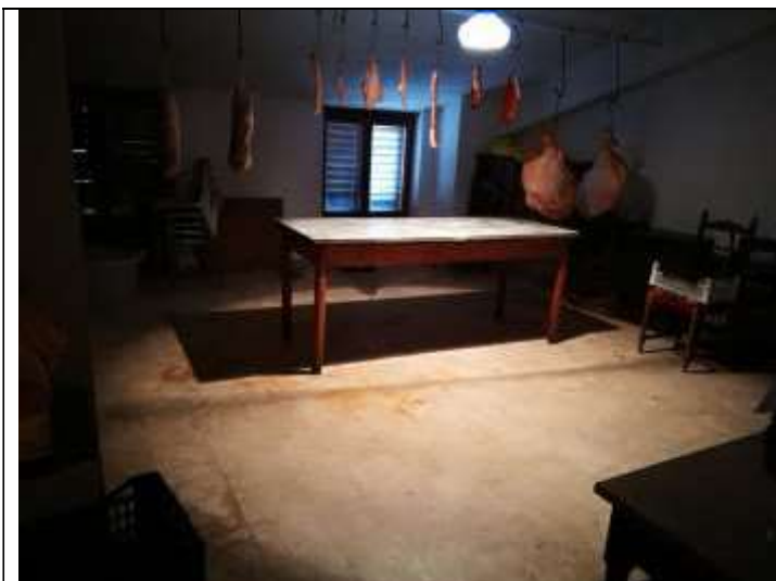
Figura 12 Soffitta