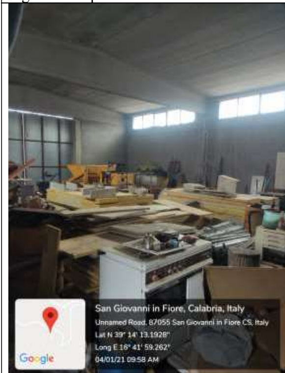
Figura 23 Capannone Industriale vista dell'interno