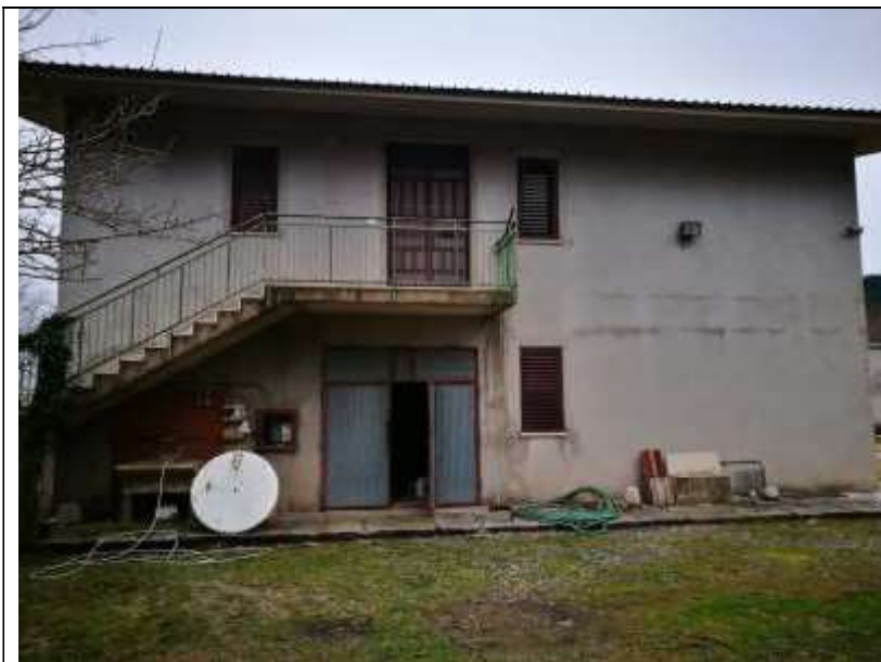
Figura 24 Fabbricato Facciata Nord Ovest