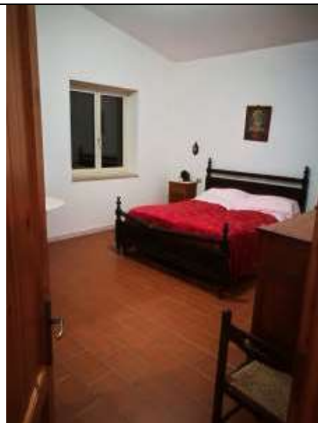
Figura 34 Piano primo sub 2 - camera da letto