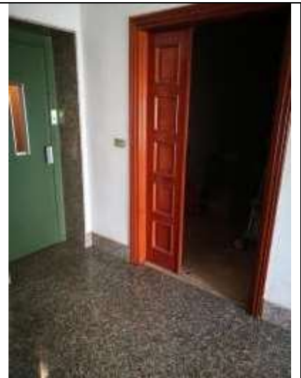
Figura 2 Ingresso appartamento