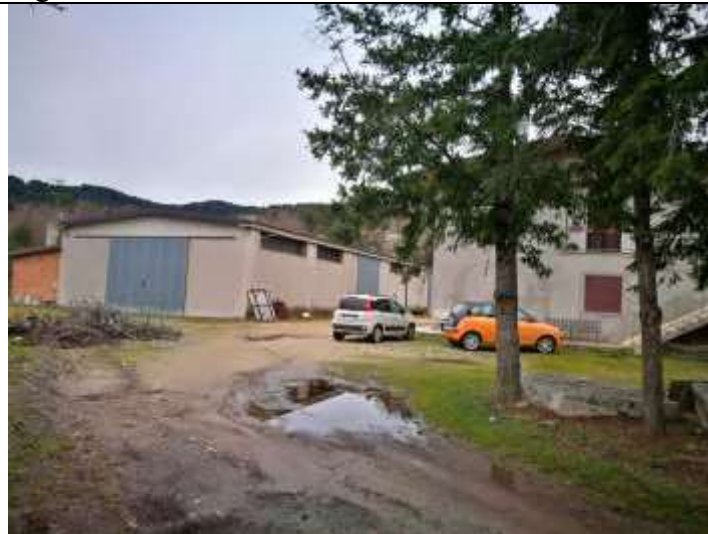
Figura 15 Capannone part 85 sub , 2 e 3