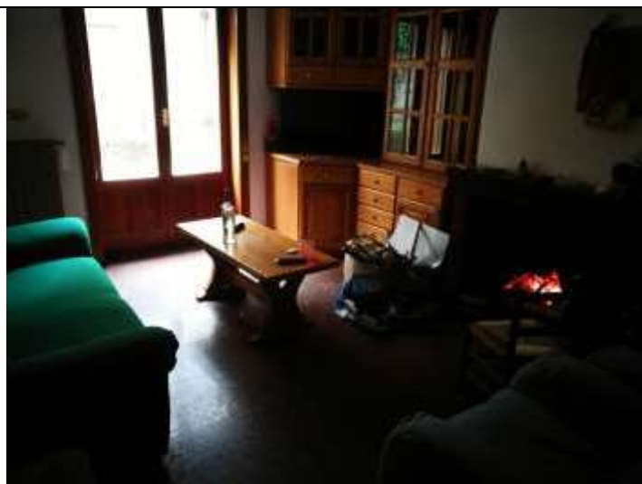
Figura 7 Salotto