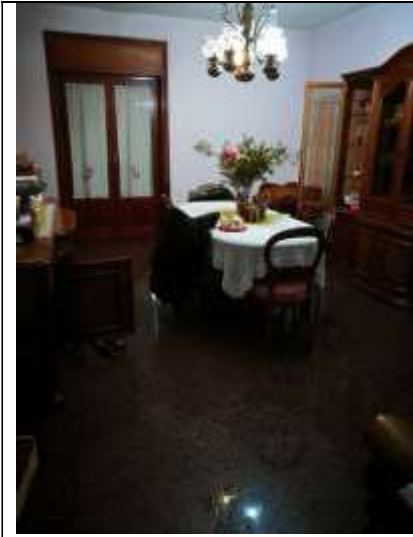
Figura 3 Sala pranzo