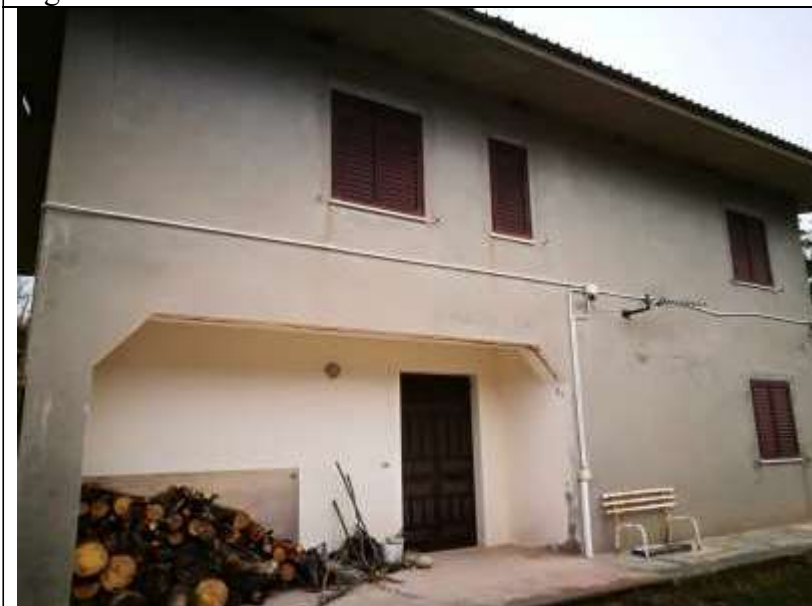
Figura 25 Fabbricato Facciata Nord Est