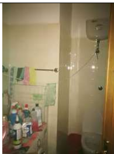
Figura 6 Bagno