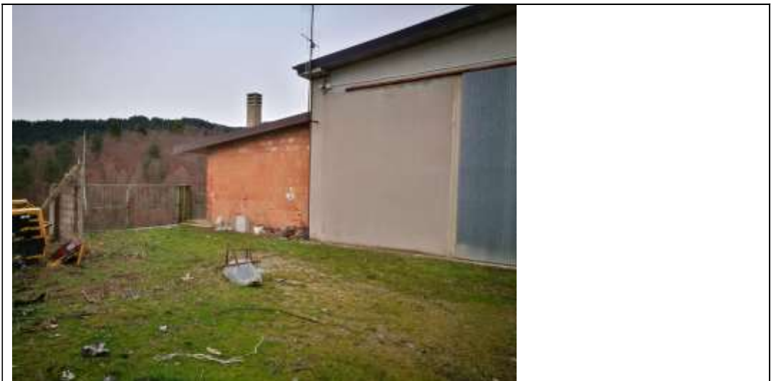
Figura 17 Capannone Industriale sub 3 Lato Sud-Ovest – visibile la costruzione annessa