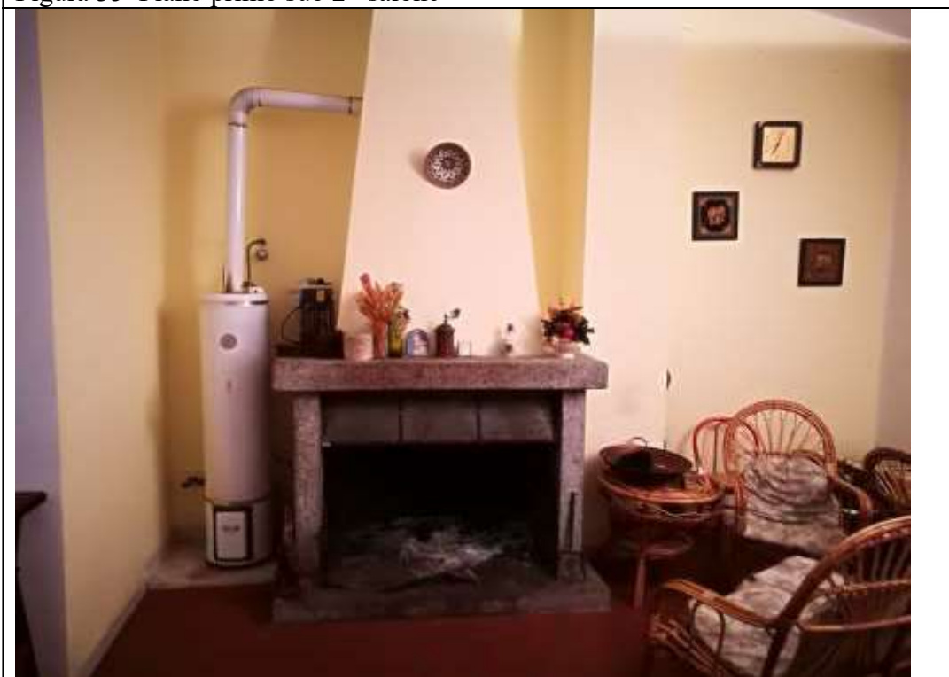
Piano primo sub 2– salone