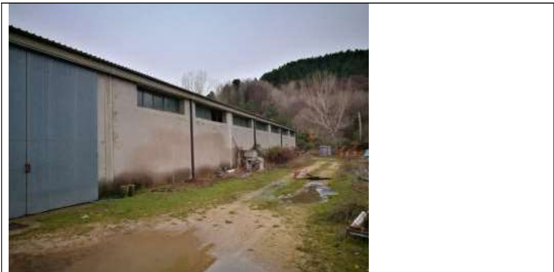
Figura 16 Capannone Industriale sub 3 Lato Nord-Ovest