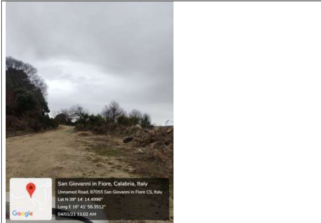
Figura 14 Strada di accesso al fondo