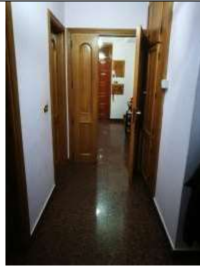
Figura 4 Corridoio