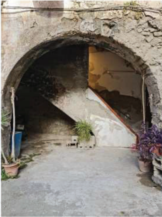
Veduta del varco d'accesso alla scala condominiale