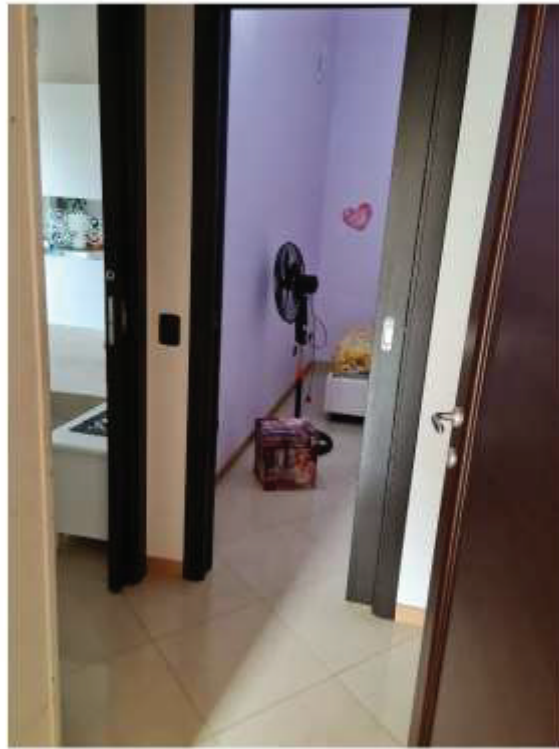
Veduta del disimpegno