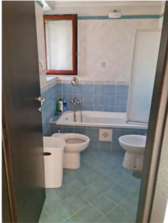
Veduta del bagno