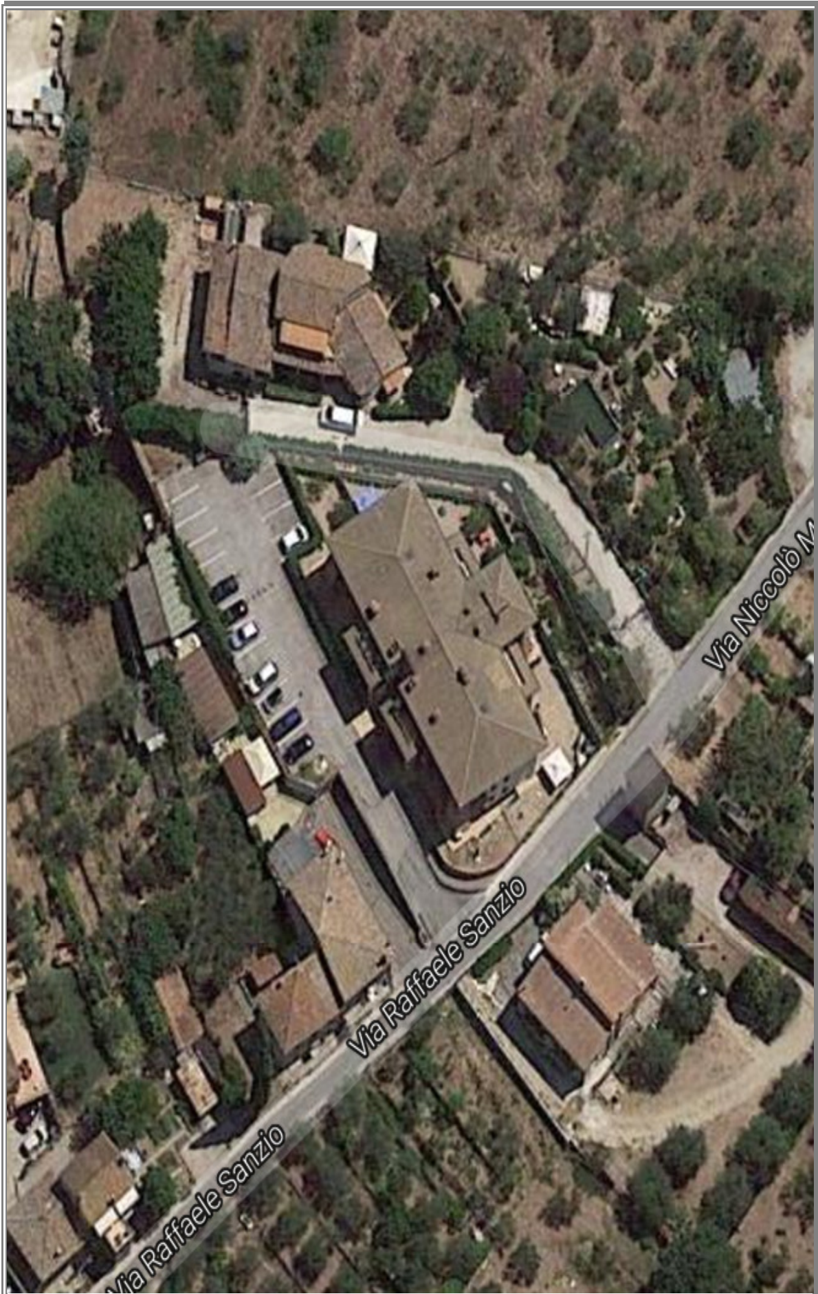
Ripresa aerea dell'intero fabbricato e dell'area condominiale circostante