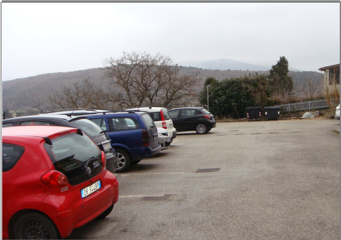
Foto n° 3 Area di scorrimento e sosta antistante l'ingresso principale