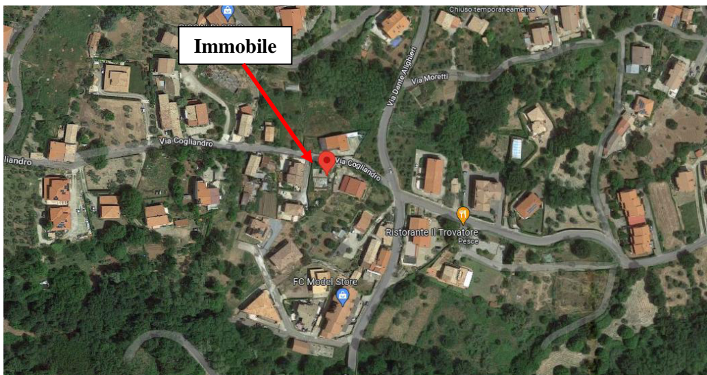
Immagine 4.1_1 – Ortofoto con indicazione di massima del bene in esame

Il bene in esame è ubicato nel Comune di Marano Principato (CS), l'immobile riportato al Catasto terreni del Comune di Marano Principato foglio 6 p.lle 1057 e 1149