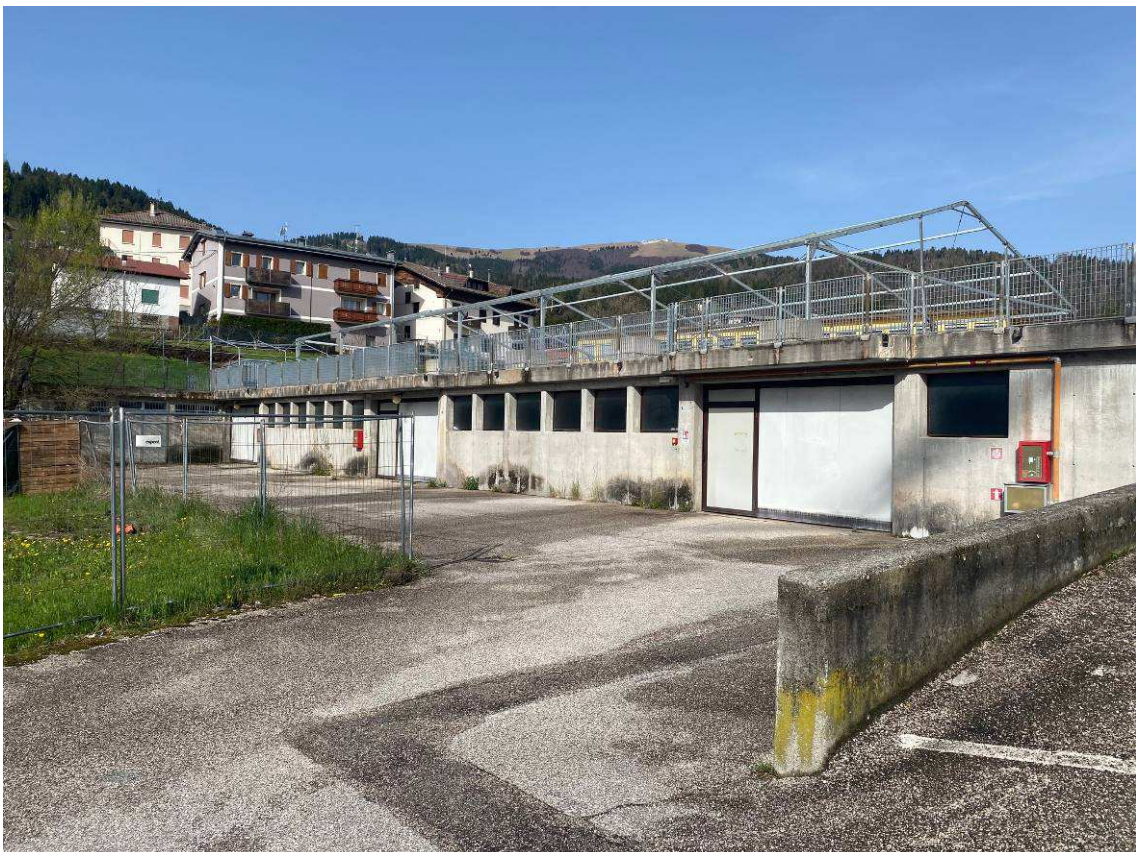
VISTA ESTERNA EDIFICIO POSTI AUTO COPERTI