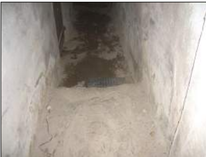
Vista corridoio comune di accesso alla cantina