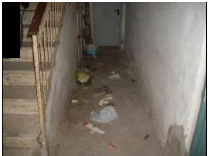
Vista corridoio comune di accesso alla cantina