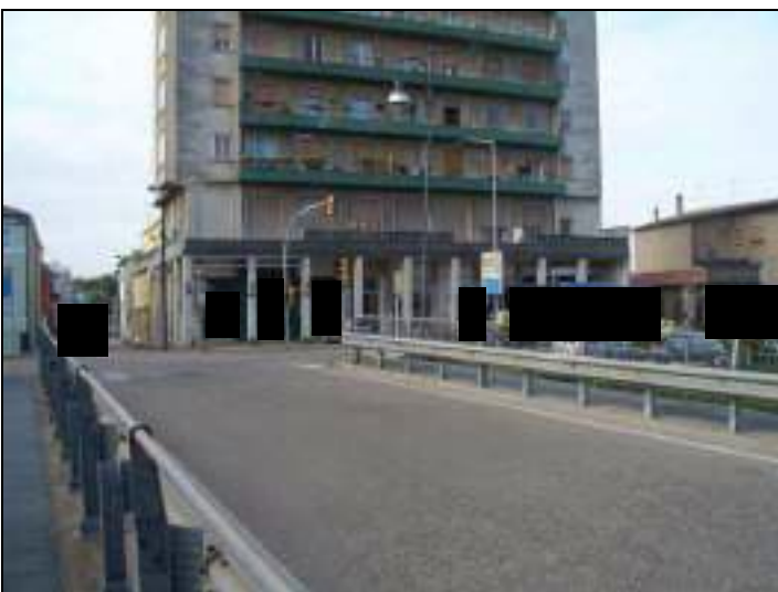
Vista esterna complesso condominiale