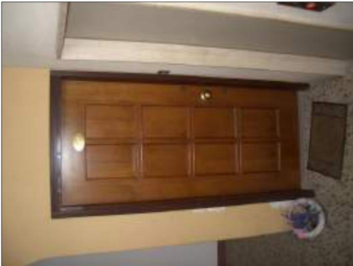
Vista accesso appartamento