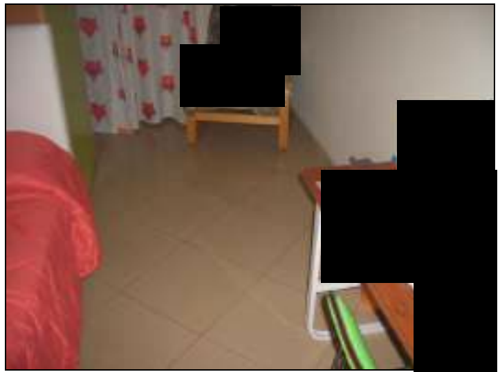
Vista interna appartamento