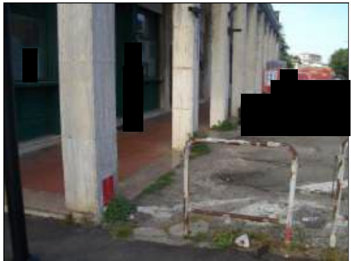
Vista esterna complesso condominiale