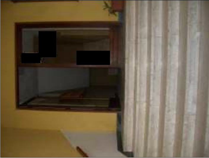
Vista accesso condominiale