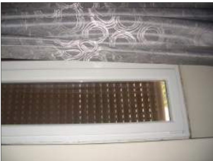
Vista interna appartamento