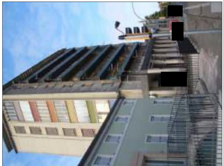
Vista esterna complesso condominiale