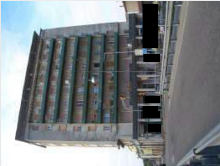
Vista esterna complesso condominiale