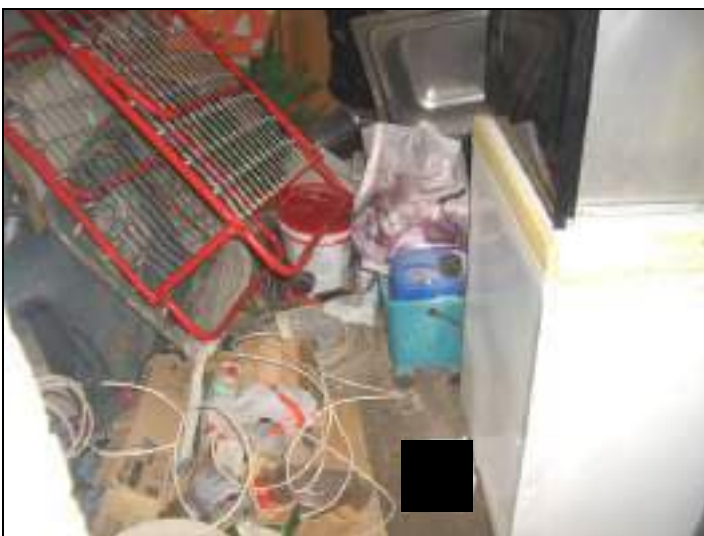
Vista interna cantina