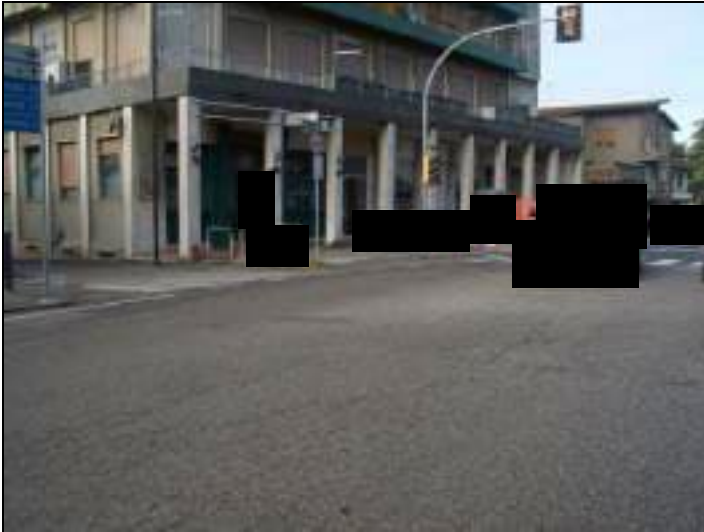
Vista esterna complesso condominiale