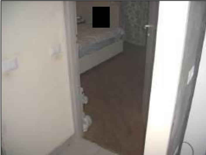
Vista interna appartamento