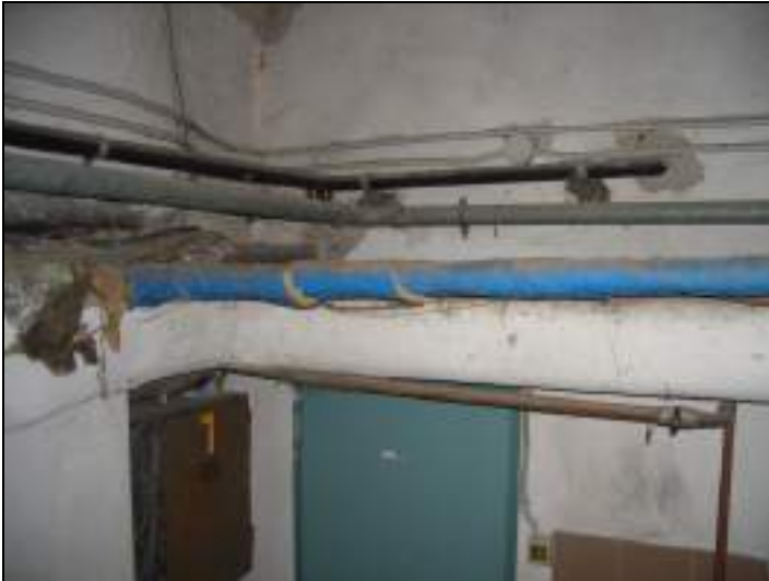
Vista parti comuni di accesso alla cantina