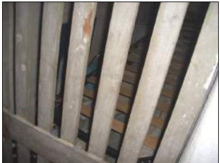
Vista accesso cantina