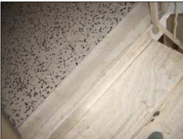
Vista scale condominiali