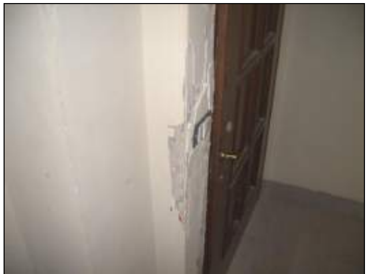
Vista interna appartamento