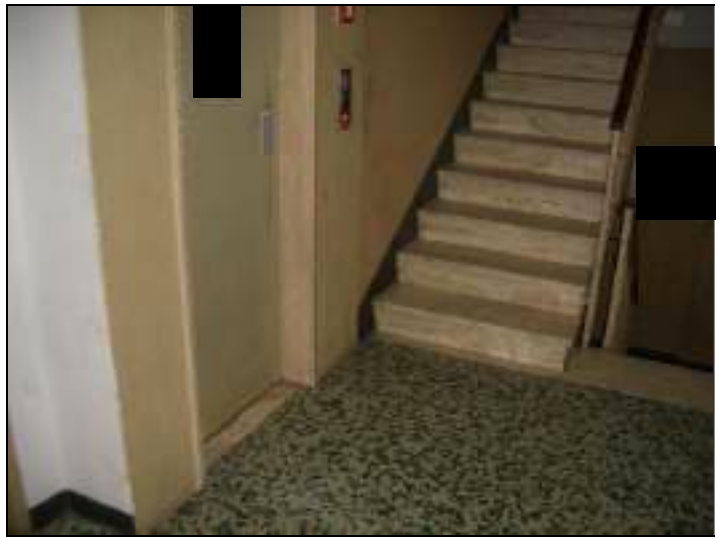
Vista atrio condominiale