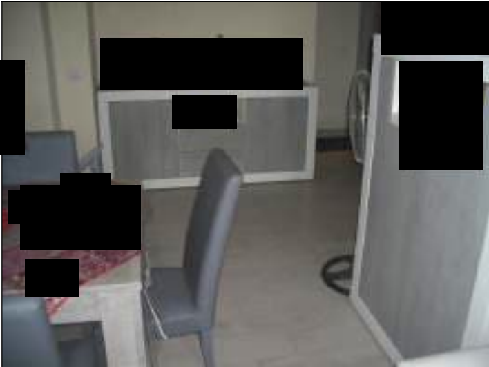
Vista interna appartamento