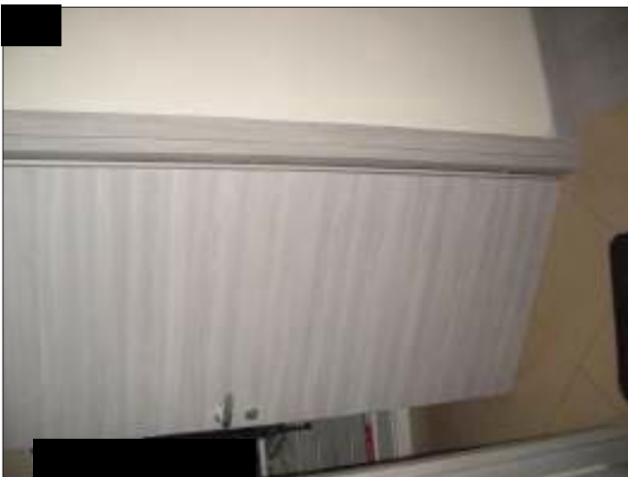
Vista interna appartamento