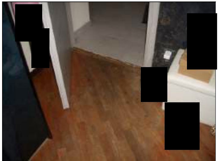
Vista interna appartamento