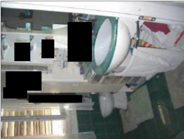
Vista interna appartamento