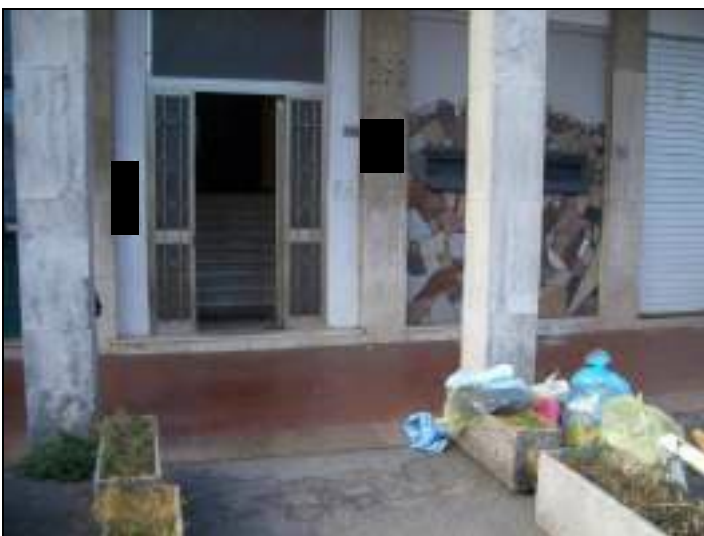
Vista esterna complesso condominiale