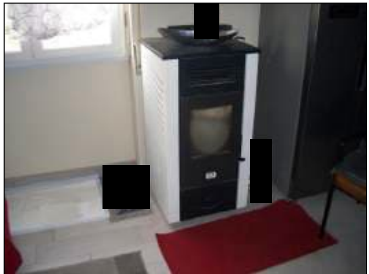
Vista interna appartamento