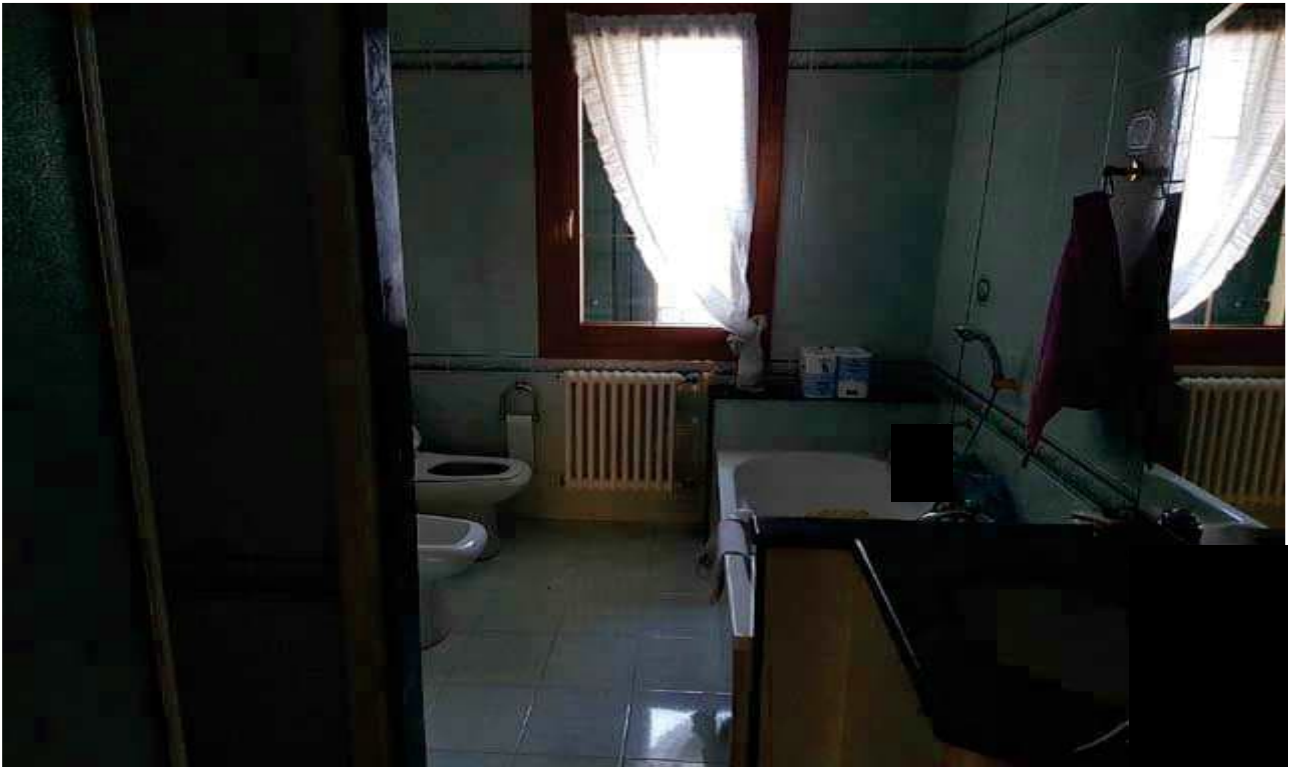
16- INTERNO PIANO PRIMO