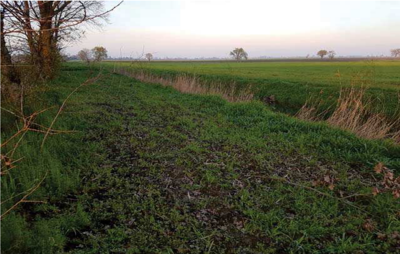
28 - CONFINE EST