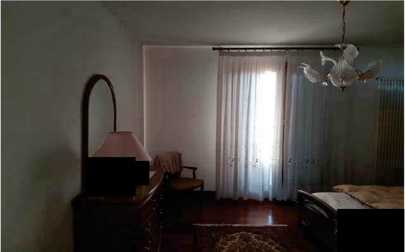
18- INTERNO PIANO PRIMO