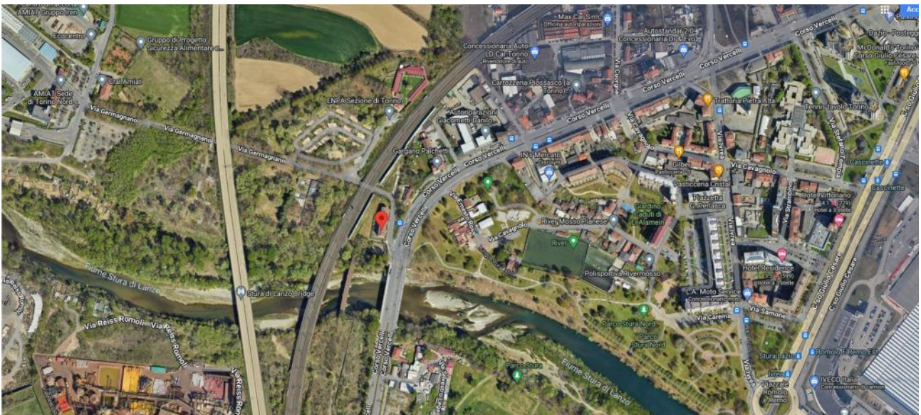
Estratto Satellitare Ravvicinato Via Germagnano n. 1