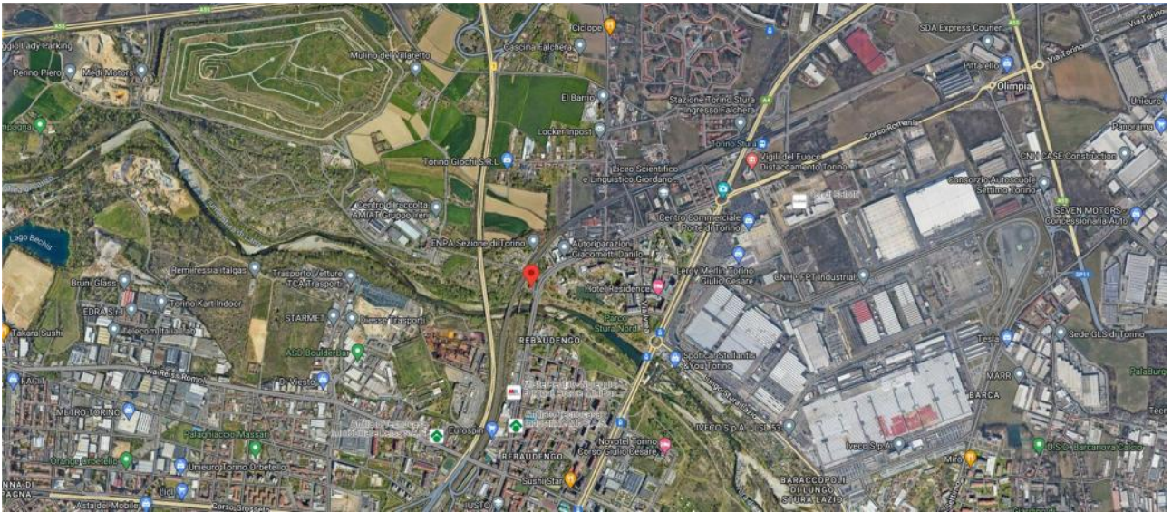
Estratto Satellitare Generale Via Germagnano n. 1