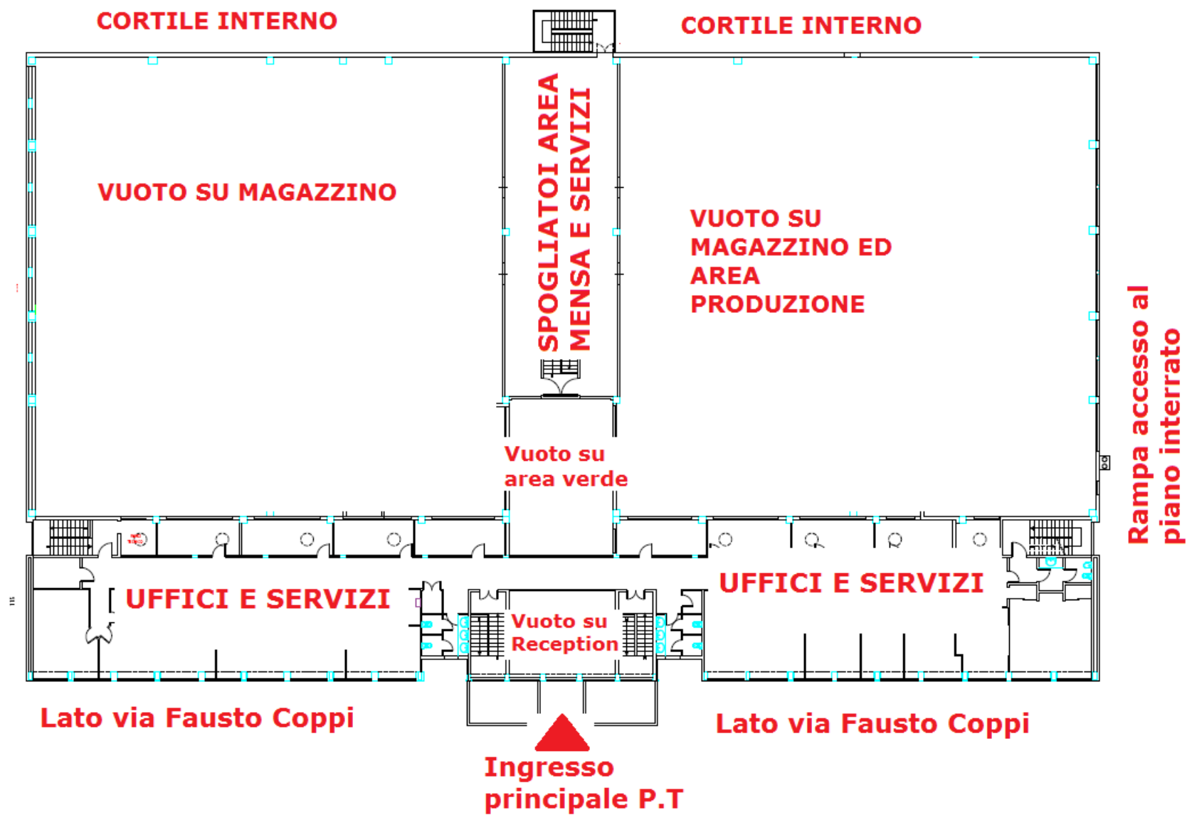
PIANTA PIANO SECONDO FUORI TERRA