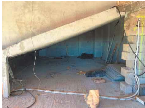
Figura 34. LOTTO UNICO: Immobile pignorato non accatastato ubicato in San Giovanni Rotondo alla Via E. Mandes n. 27 (interno sottotetto).