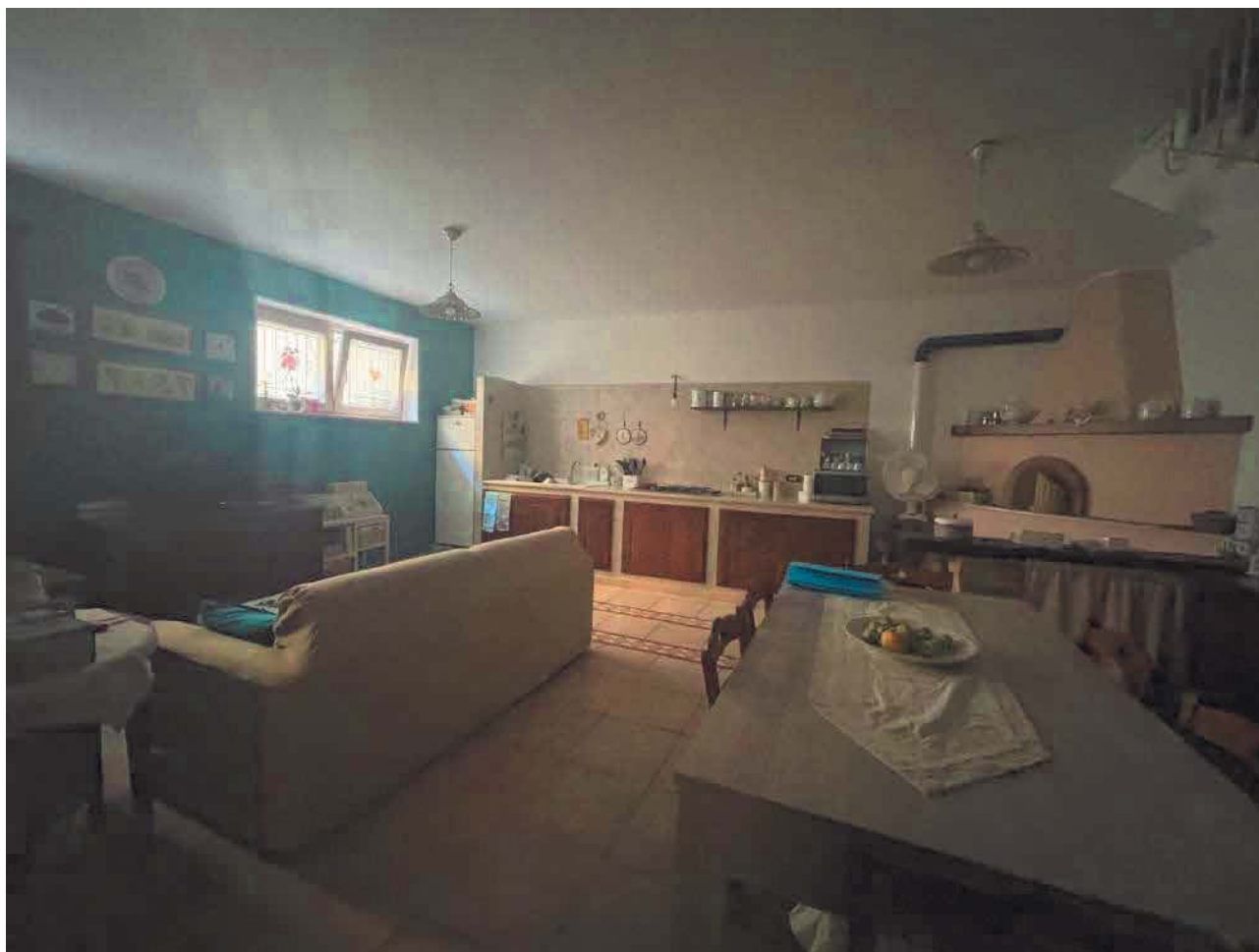
Figura 13. LOTTO UNICO: Immobile pignorato al F. 57, P.Ila 2660, Sub. 3 ubicato in San Giovanni Rotondo alla Via E. Mandes n. 25 (cucina).