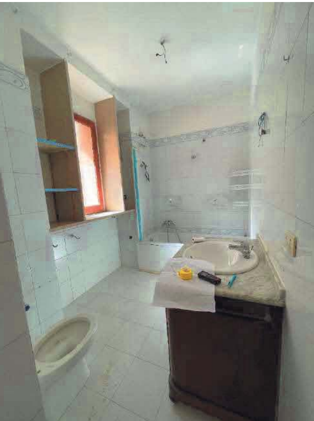
Figura 22. LOTTO UNICO: Immobile pignorato al F. 57, P.IIa 2660, Sub. 4 ubicato in San Giovanni Rotondo alla Via E. Mandes n. 27 (bagno).