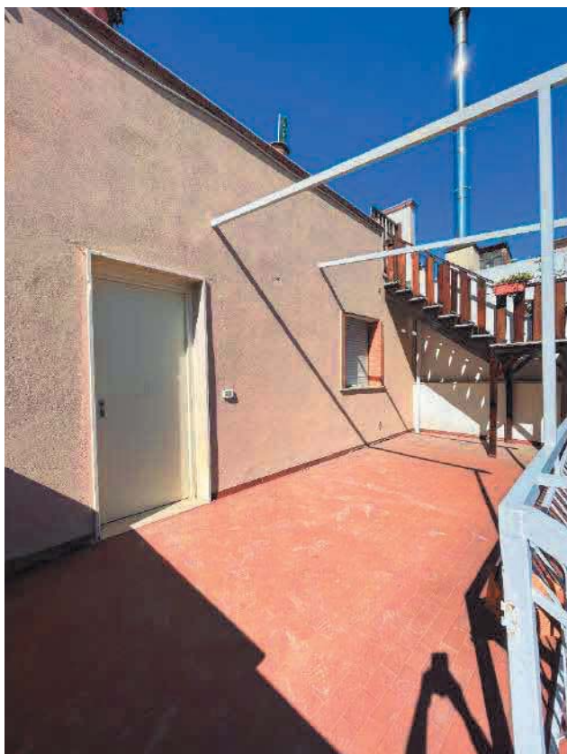
Figura 19. LOTTO UNICO: Immobile pignorato al F. 57, P.IIa 2660, Sub. 4 ubicato in San Giovanni Rotondo alla Via E. Mandes n. 27 (ingresso).