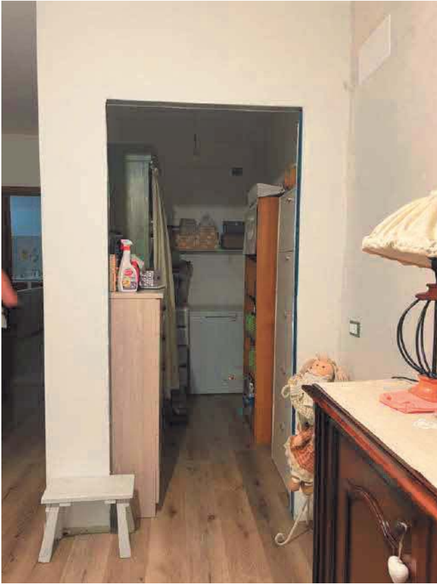
Figura 9. LOTTO UNICO: Immobile pignorato al F. 57, P.IIa 2660, Sub. 3 ubicato in San Giovanni Rotondo alla Via E. Mandes n. 25 (ripostiglio).