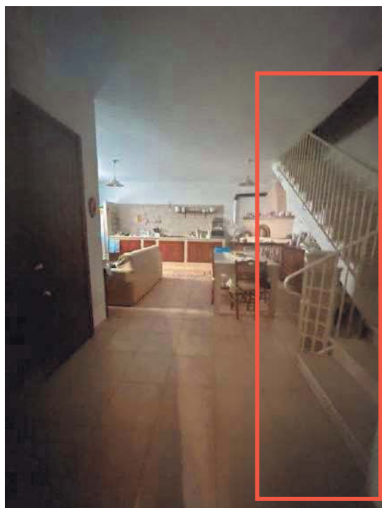
Figura 14. LOTTO UNICO: Immobile pignorato al F. 57, P.Ila 2660, Sub. 3 ubicato in San Giovanni Rotondo alla Via E. Mandes n. 25 (scala di accesso al ripostiglio posto al piano primo).