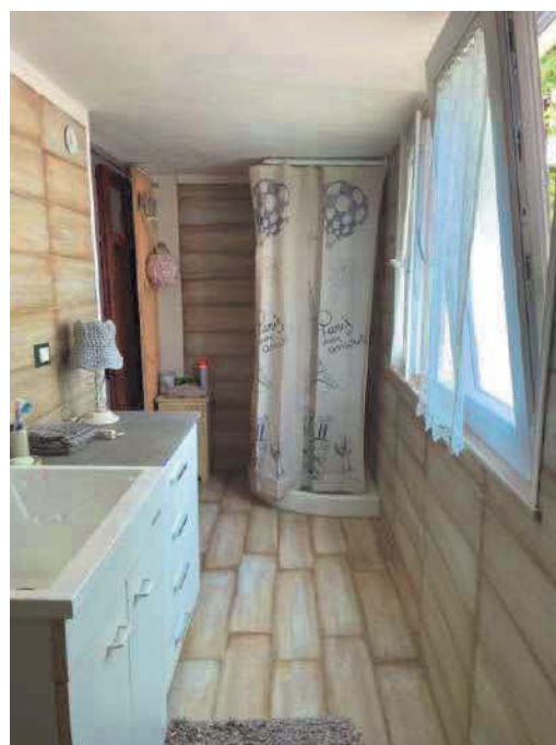
Figura 6. LOTTO UNICO: Immobile pignorato al F. 57, P.Ila 2660, Sub. 3 ubicato in San Giovanni Rotondo alla Via E. Mandes n. 25 (bagno – ampliamento).