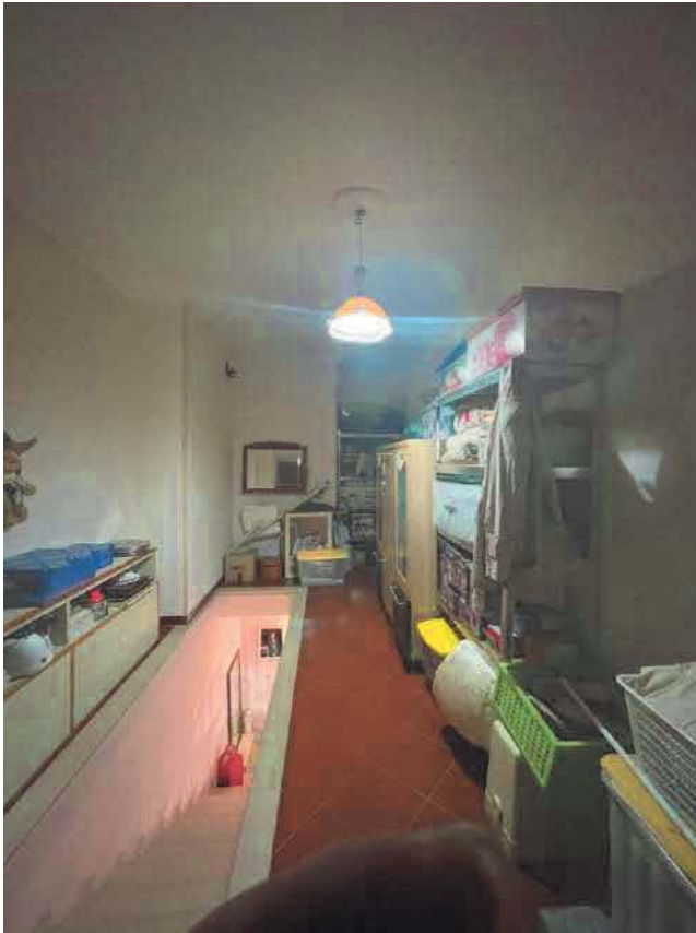
Figura 15. LOTTO UNICO: Immobile pignorato al F. 57, P.IIa 2660, Sub. 4 ubicato in San Giovanni Rotondo alla Via E. Mandes n. 25 (ripostiglio posto al piano primo individuato al sub. 4 ed accorpato al sub. 3).