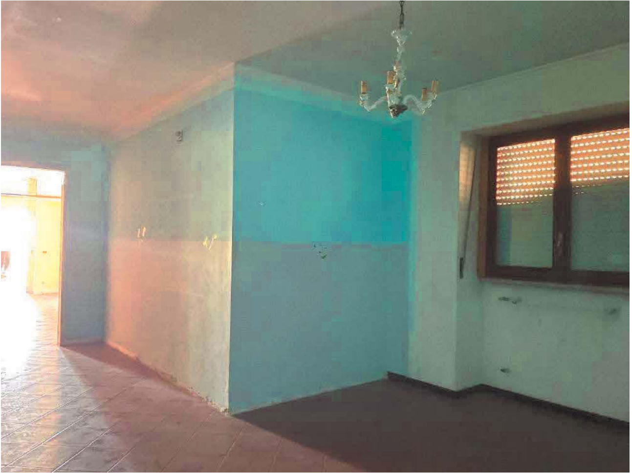
Figura 23. LOTTO UNICO: Immobile pignorato al F. 57, P.IIa 2660, Sub. 4 ubicato in San Giovanni Rotondo alla Via E. Mandes n. 27 (camera).