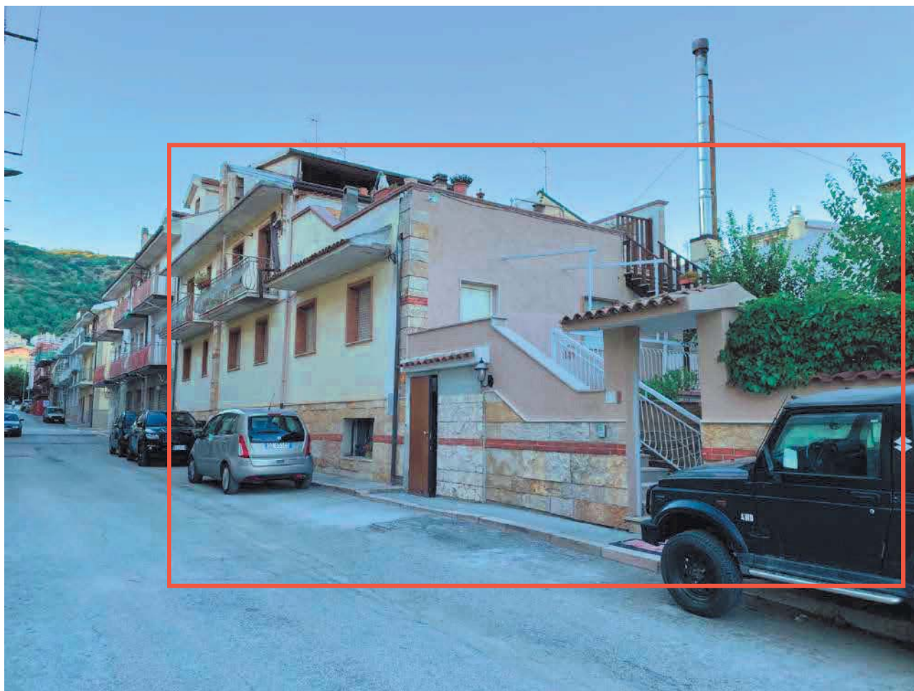
Figura 3. LOTTO UNICO: Fabbricato in cui si trovano gli immobili pignorati al F. 57, P.IIa 2660, Sub. 1-2-3-4-5 ubicati in San Giovanni Rotondo alla Via E. Mandes n. 25 e 27.