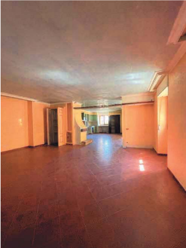
Figura 21. LOTTO UNICO: Immobile pignorato al F. 57, P.IIa 2660, Sub. 4 ubicato in San Giovanni Rotondo alla Via E. Mandes n. 27 (soggiorno e cucina).