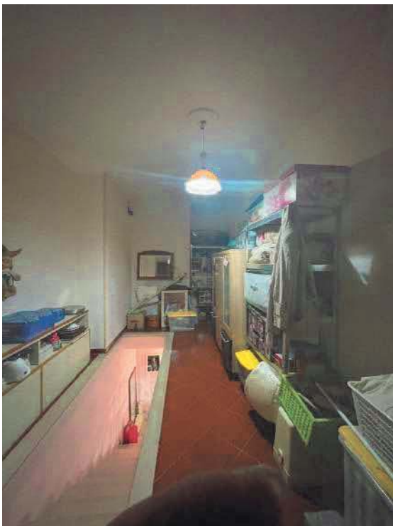
Figura 24. LOTTO UNICO: Immobile pignorato al F. 57, P.IIa 2660, Sub. 4 ubicato in San Giovanni Rotondo alla Via E. Mandes n. 27 (ripostiglio accorpato al sub. 3).