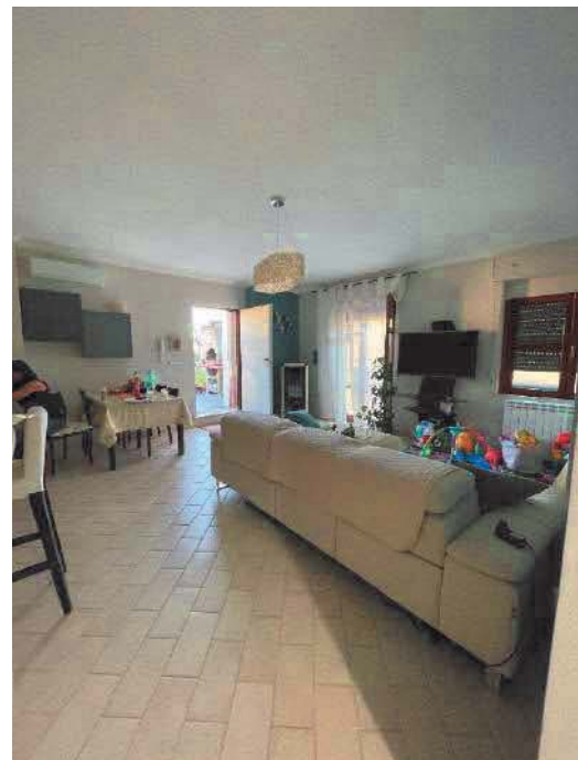
Figura 26. LOTTO UNICO: Immobile pignorato al F. 57, P.IIa 2660, Sub. 5 ubicato in San Giovanni Rotondo alla Via E. Mandes n. 27 (soggiorno/pranzo).