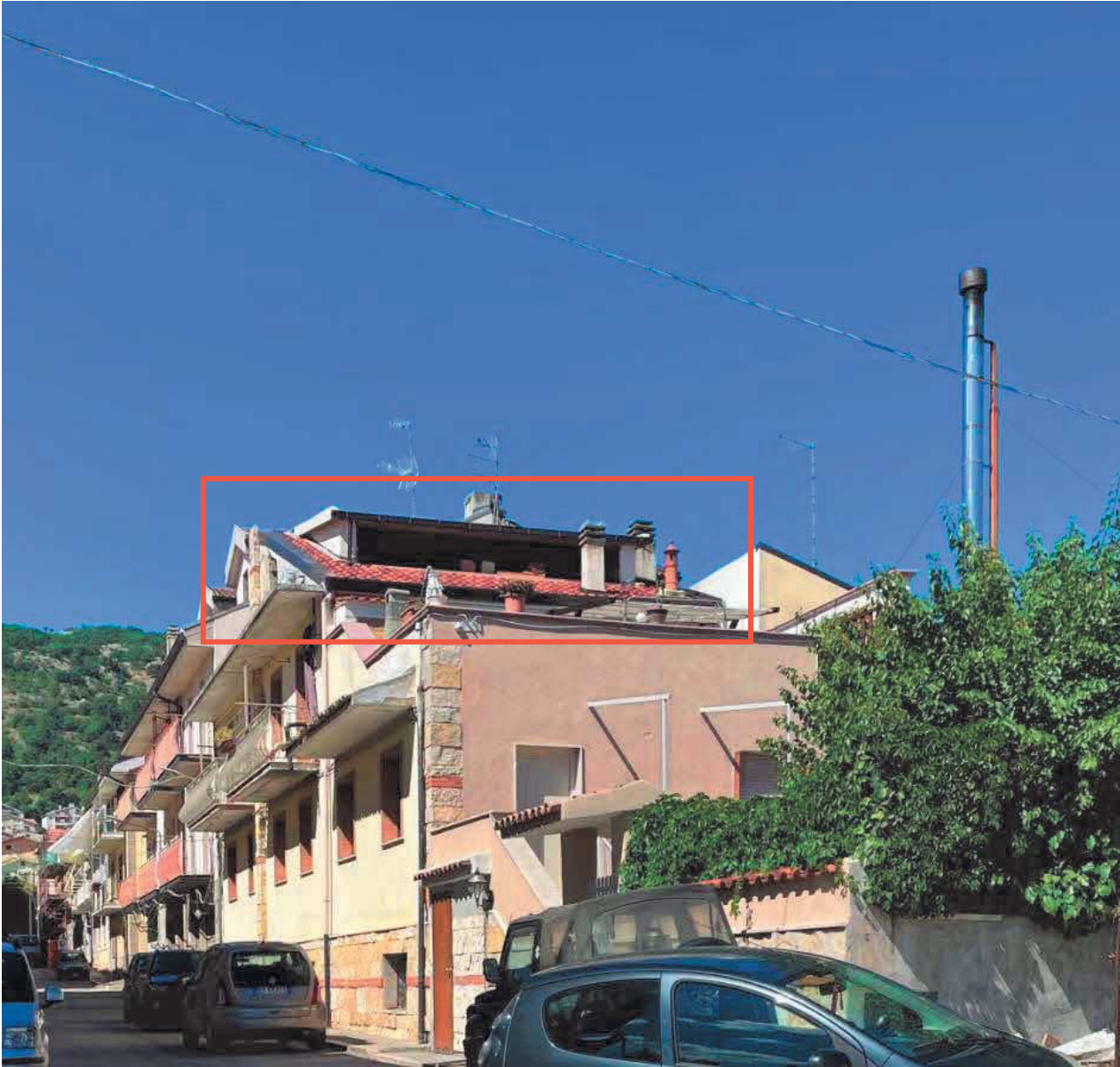
Figura 33. LOTTO UNICO: Immobile pignorato non accatastato ubicato in San Giovanni Rotondo alla Via E. Mandes n. 27 (sottotetto).