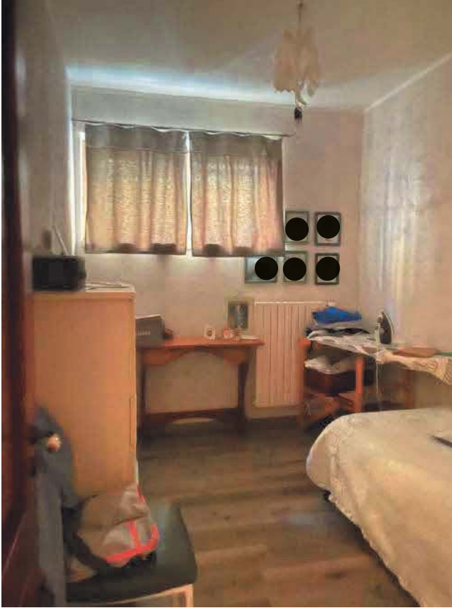
Figura 11. LOTTO UNICO: Immobile pignorato al F. 57, P.IIa 2660, Sub. 3 ubicato in San Giovanni Rotondo alla Via E. Mandes n. 25 (camera).