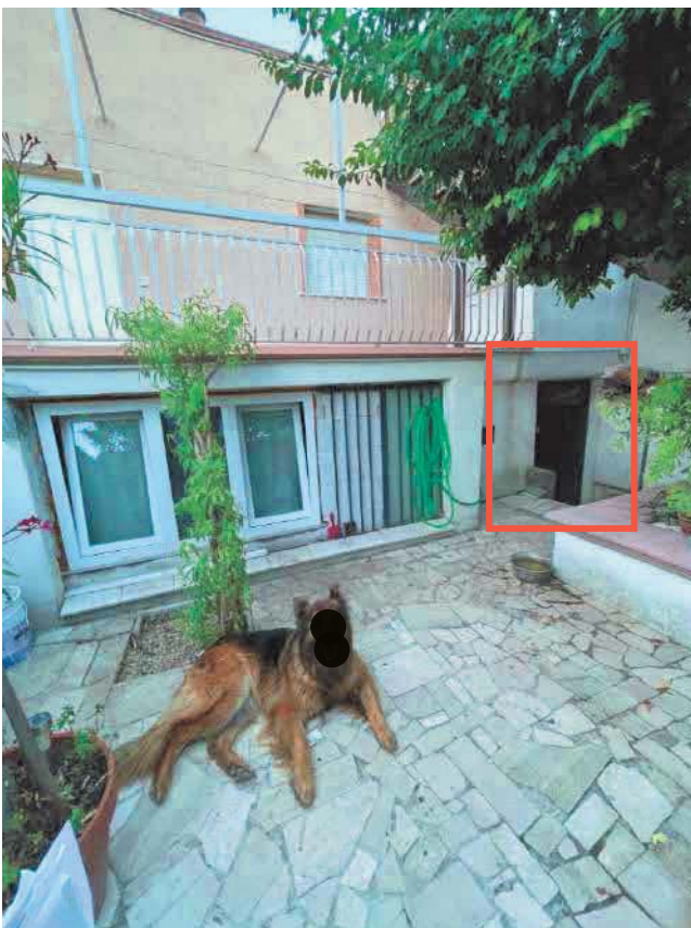
Figura 16. LOTTO UNICO: Immobile pignorato al F. 57, P.IIa 2660, Sub. 3 ubicato in San Giovanni Rotondo alla Via E. Mandes n. 27 (ingresso al vano tecnico mediante il B.C.N.C. individuato al sub. 1).