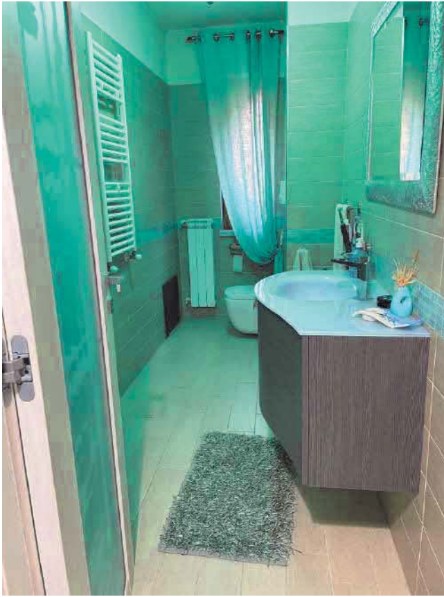
Figura 27. LOTTO UNICO: Immobile pignorato al F. 57, P.IIa 2660, Sub. 5 ubicato in San Giovanni Rotondo alla Via E. Mandes n. 27 (bagno).