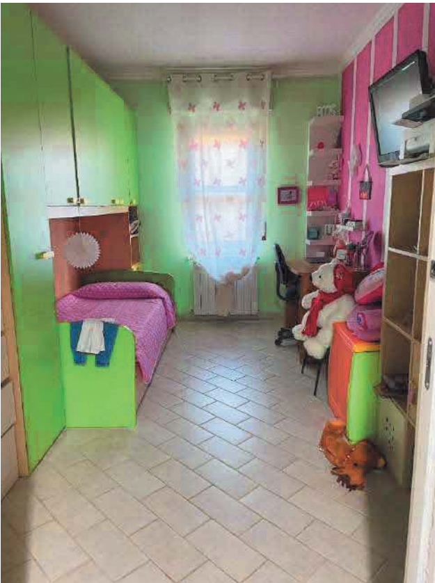
Figura 30. LOTTO UNICO: Immobile pignorato al F. 57, P.IIa 2660, Sub. 5 ubicato in San Giovanni Rotondo alla Via E. Mandes n. 27 (camera).