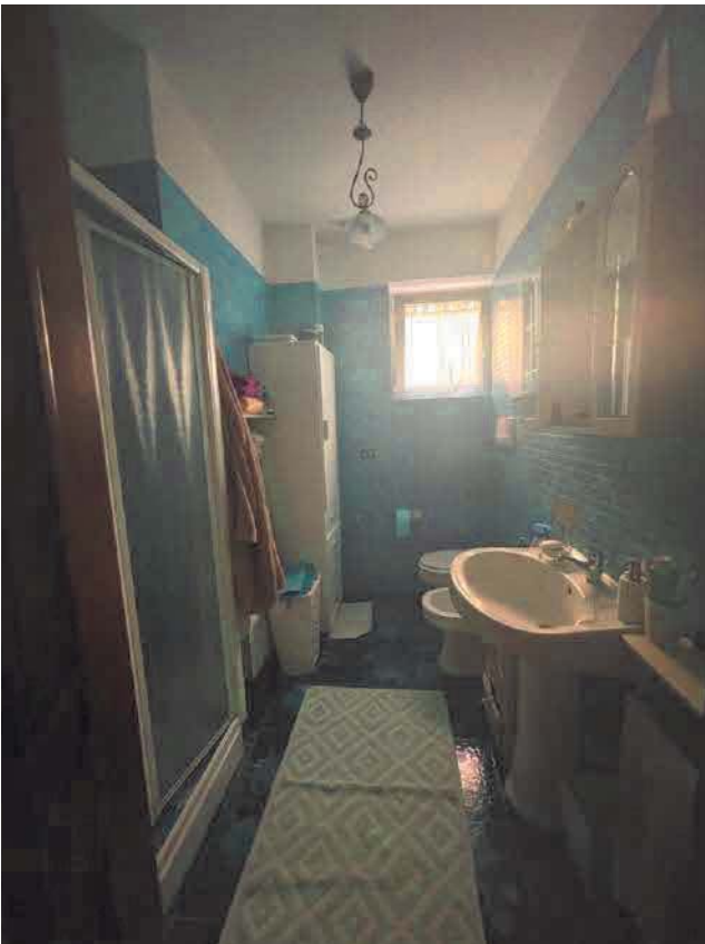
Figura 12. LOTTO UNICO: Immobile pignorato al F. 57, P.IIa 2660, Sub. 3 ubicato in San Giovanni Rotondo alla Via E. Mandes n. 25 (bagno).