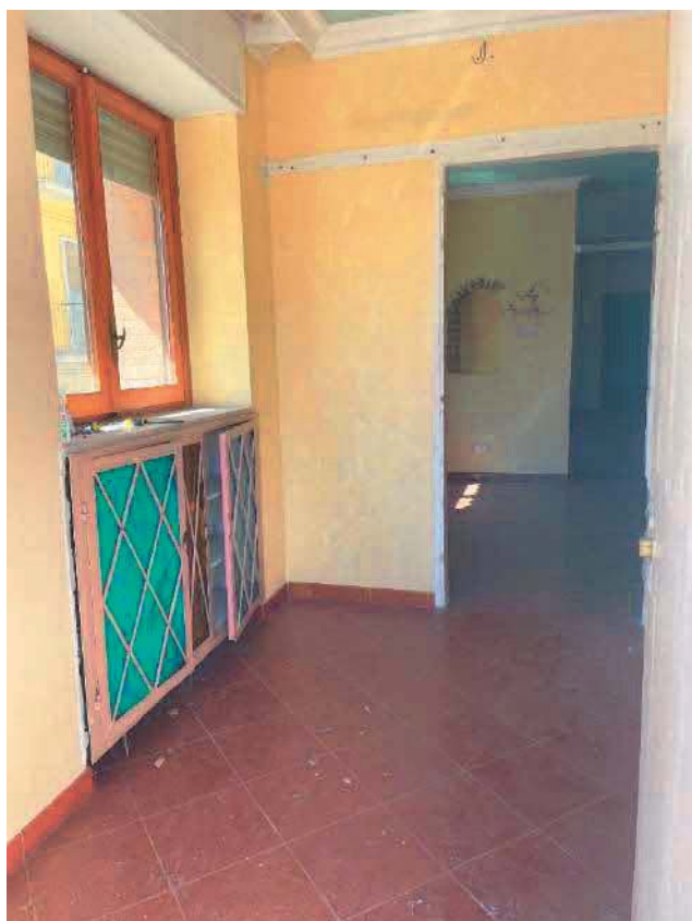
Figura 20. LOTTO UNICO: Immobile pignorato al F. 57, P.IIa 2660, Sub. 4 ubicato in San Giovanni Rotondo alla Via E. Mandes n. 27 (disimpegno).