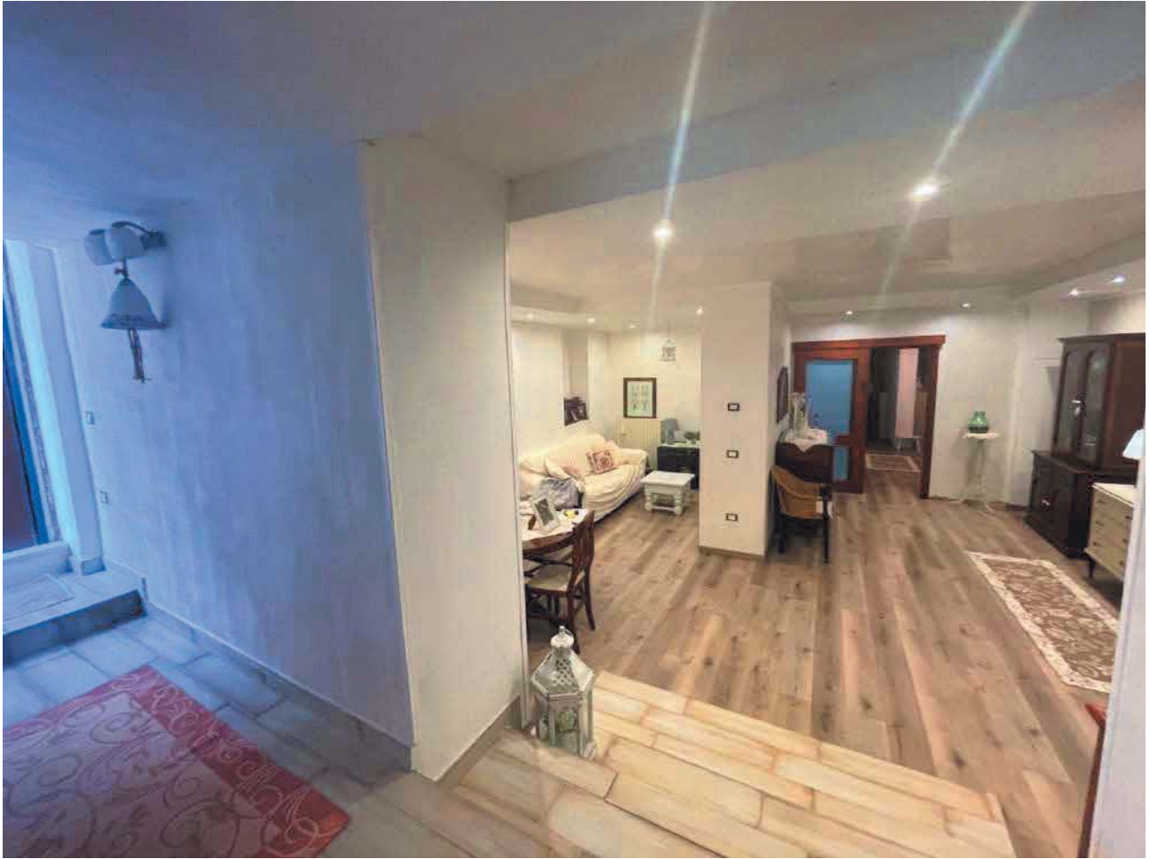
Figura 7. LOTTO UNICO: Immobile pignorato al F. 57, P.Ila 2660, Sub. 3 ubicato in San Giovanni Rotondo alla Via E. Mandes n. 25 (soggiorno).