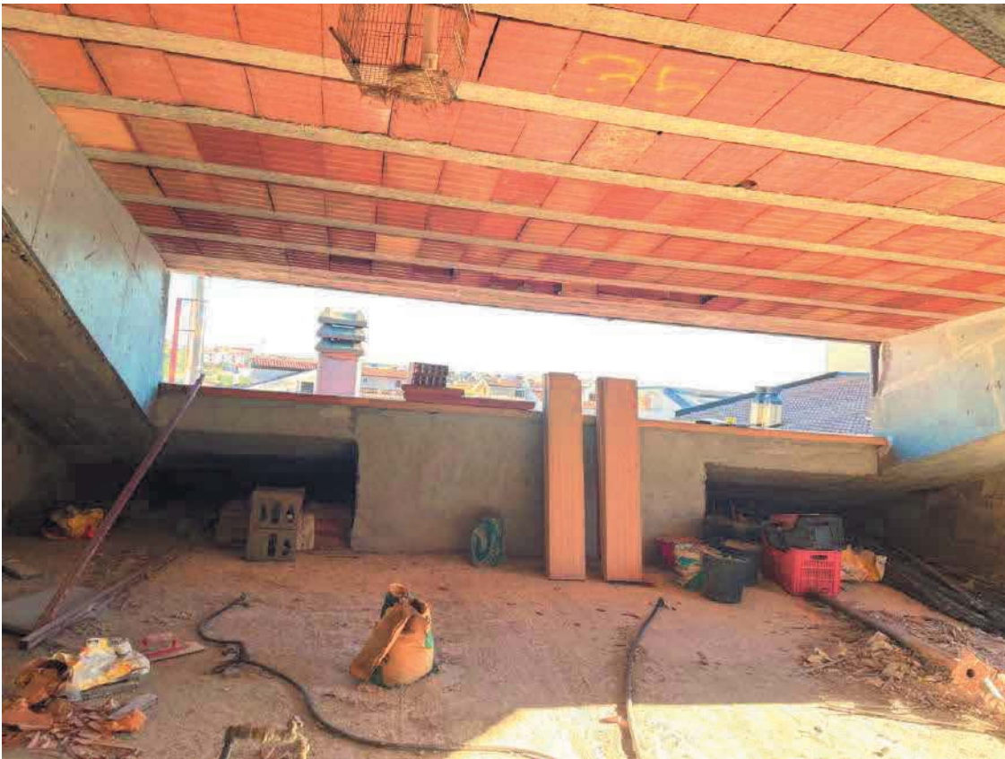
Figura 35. LOTTO UNICO: Immobile pignorato non accatastato ubicato in San Giovanni Rotondo alla Via E. Mandes n. 27 (interno sottotetto).