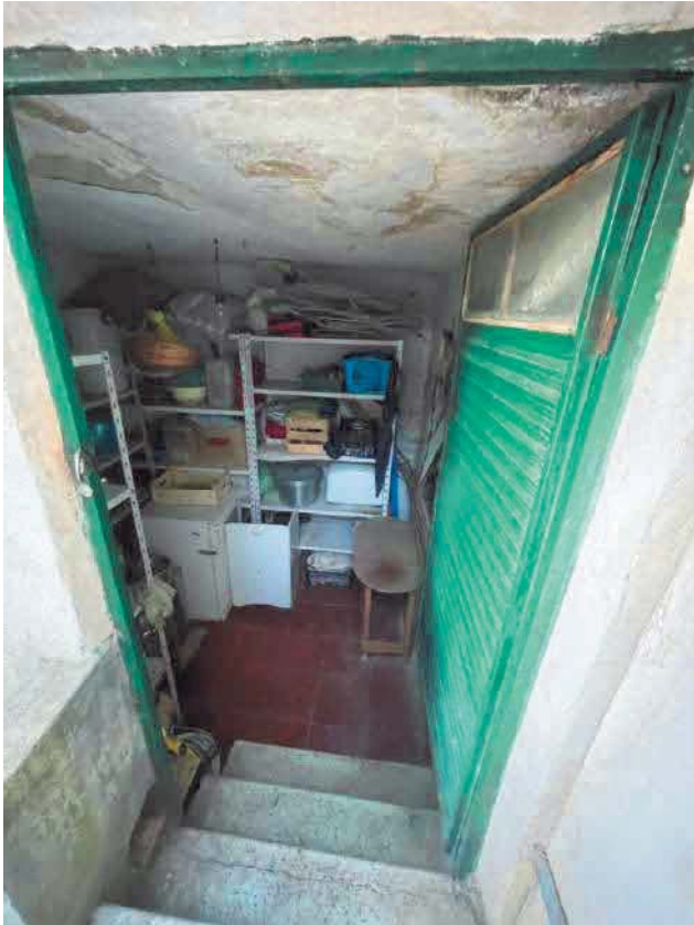
Figura 17. LOTTO UNICO: Immobile pignorato al F. 57, P.IIa 2660, Sub. 3 ubicato in San Giovanni Rotondo alla Via E. Mandes n. 27 (vano tecnico).