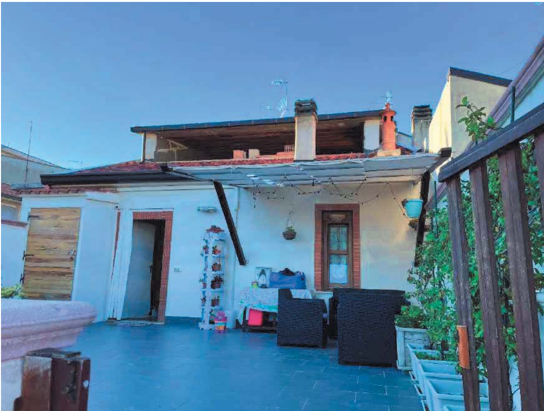
Figura 32. LOTTO UNICO: Immobile pignorato al F. 57, P.IIa 2660, Sub. 5 ubicato in San Giovanni Rotondo alla Via E. Mandes n. 27 (terrazza).