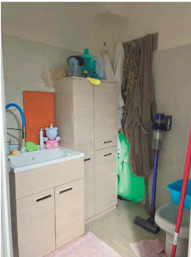
Figura 28. LOTTO UNICO: Immobile pignorato al F. 57, P.IIa 2660, Sub. 5 ubicato in San Giovanni Rotondo alla Via E. Mandes n. 27 (bagno di servizio).