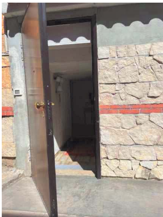
Figura 4. LOTTO UNICO: Immobile pignorato al F. 57, P.IIa 2660, Sub. 3 ubicato in San Giovanni Rotondo alla Via E. Mandes n. 25 (portoncino d'ingresso).