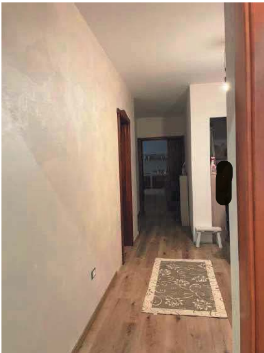
Figura 8. LOTTO UNICO: Immobile pignorato al F. 57, P.Ila 2660, Sub. 3 ubicato in San Giovanni Rotondo alla Via E. Mandes n. 25 (disimpegno).