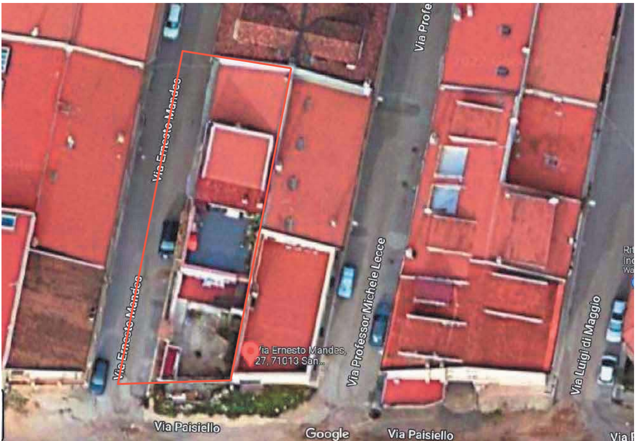
Figura 2. LOTTO UNICO: Ortofoto degli immobili pignorati al F. 57, P.IIa 2660, Sub. 1-2-3-4-5 ubicati in San Giovanni Rotondo alla Via E. Mandes n. 25 e 27.