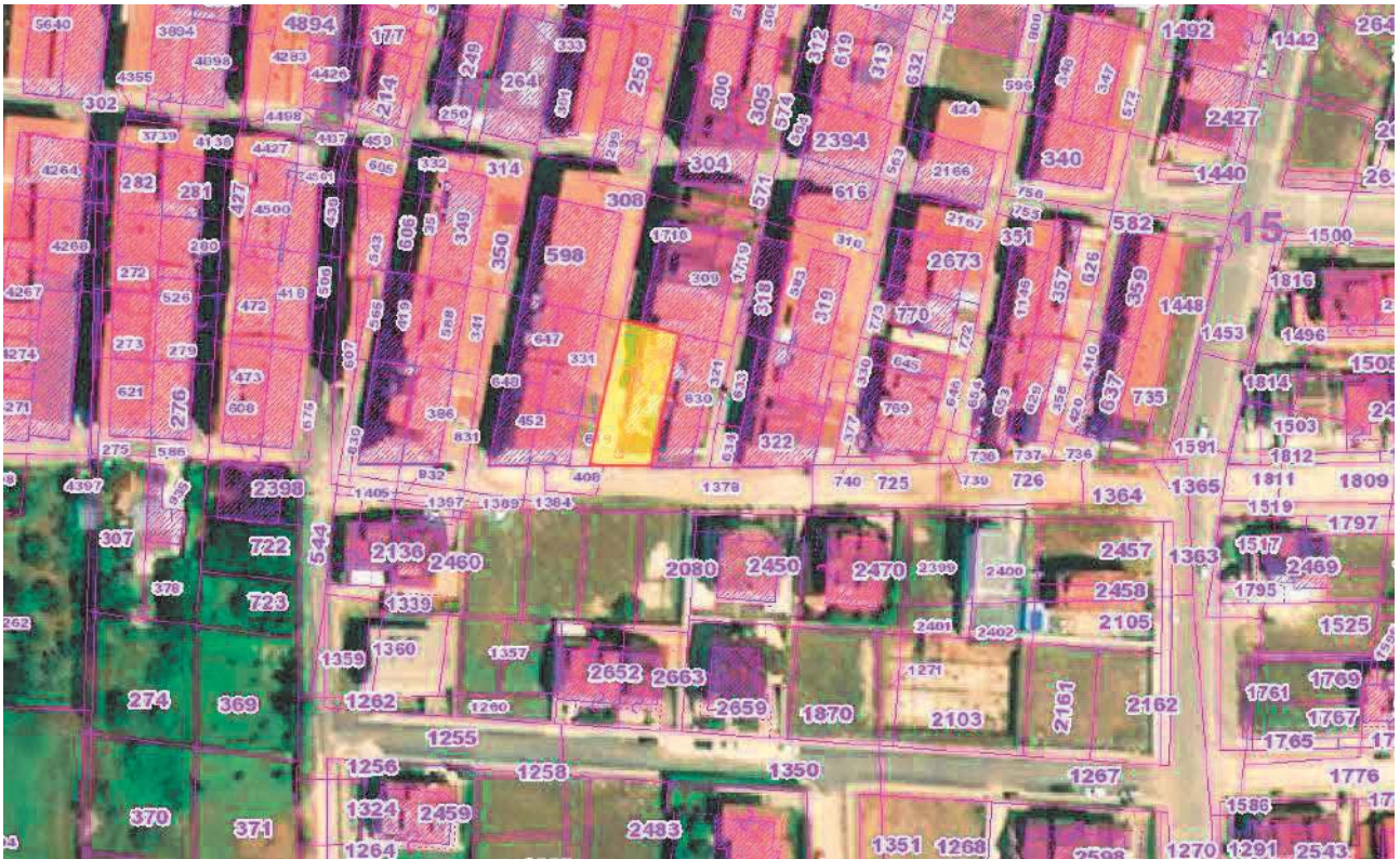
Figura 1. LOTTO UNICO: Ortofoto catastale degli immobili pignorati al F. 57, P.IIa 2660, Sub. 1-2-3-4-5 ubicati in San Giovanni Rotondo alla Via E. Mandes n. 25 e 27.