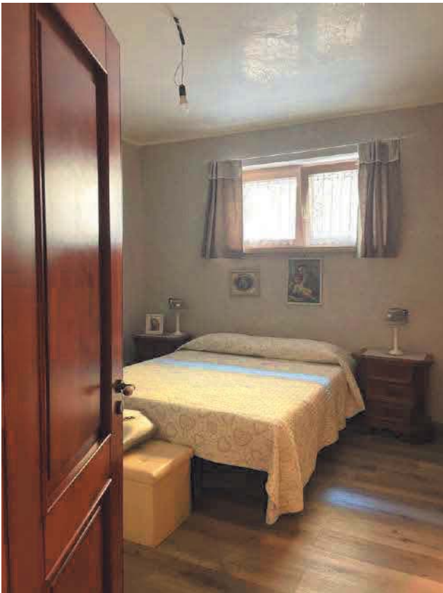
Figura 10. LOTTO UNICO: Immobile pignorato al F. 57, P.IIa 2660, Sub. 3 ubicato in San Giovanni Rotondo alla Via E. Mandes n. 25 (camera).