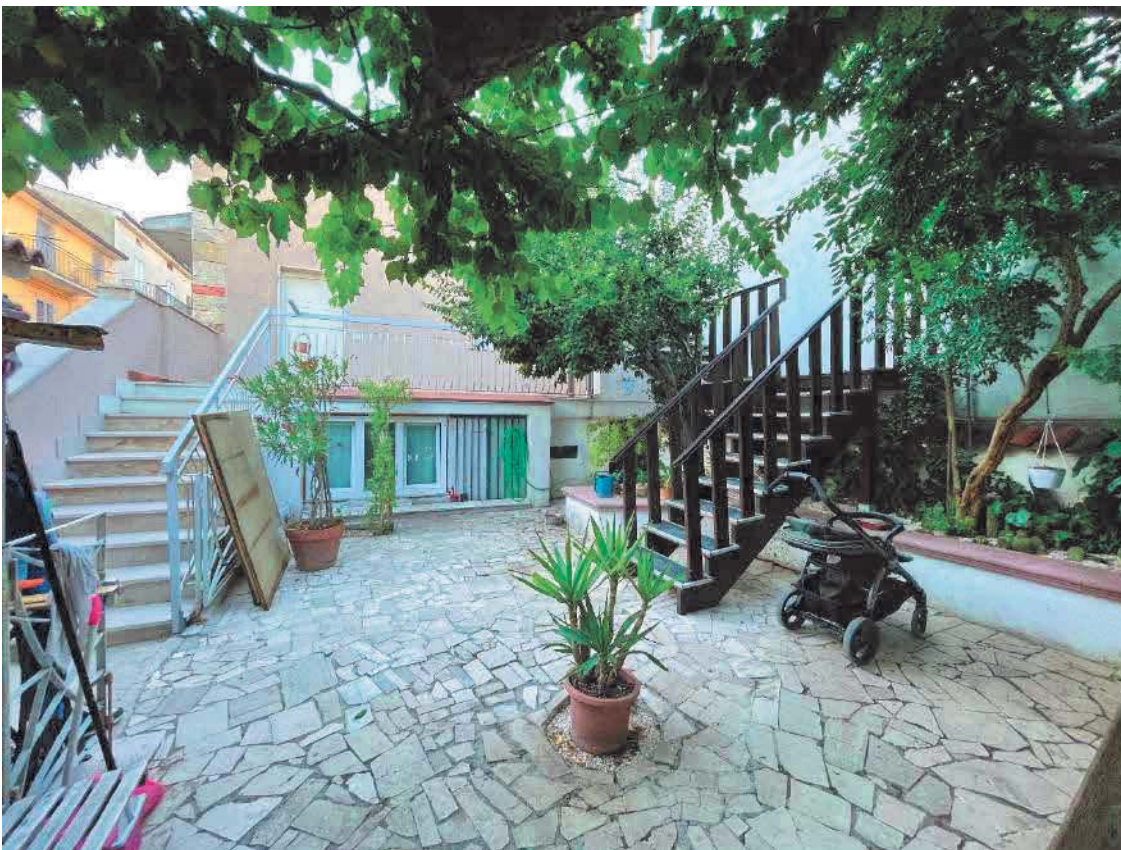
Figura 36. LOTTO UNICO: Immobile pignorato al F. 57, P.IIa 2660, Sub. 1 ubicato in San Giovanni Rotondo alla Via E. Mandes n. 27 (corte di accesso agli immobili - bene comune non censibile).