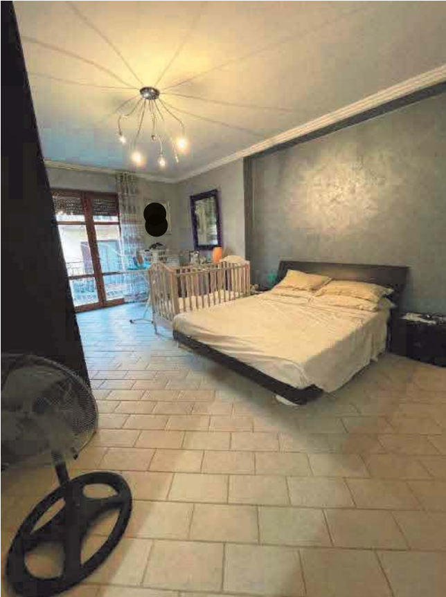
Figura 31. LOTTO UNICO: Immobile pignorato al F. 57, P.IIa 2660, Sub. 5 ubicato in San Giovanni Rotondo alla Via E. Mandes n. 27 (camera).