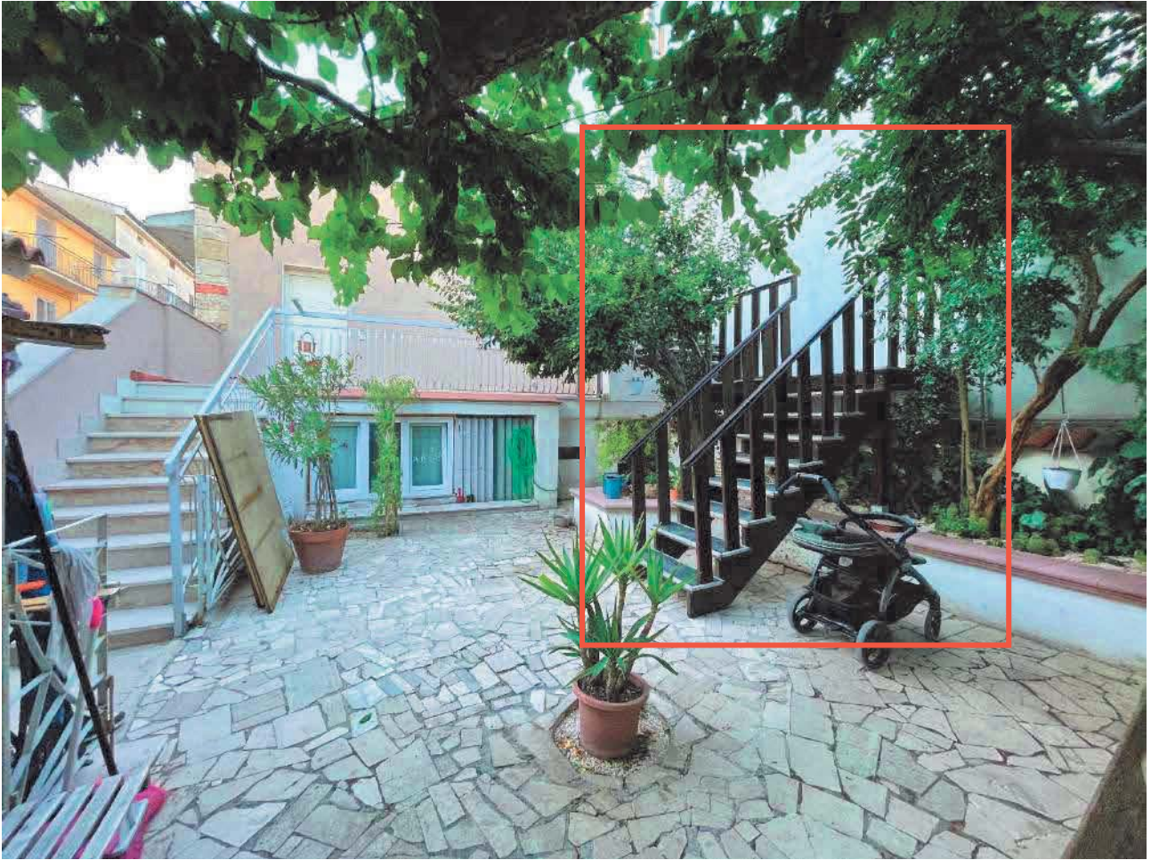
Figura 25. LOTTO UNICO: Immobile pignorato al F. 57, P.IIa 2660, Sub. 5 ubicato in San Giovanni Rotondo alla Via E. Mandes n. 27 (accesso dal bene comune non censibile censito al sub. 1).