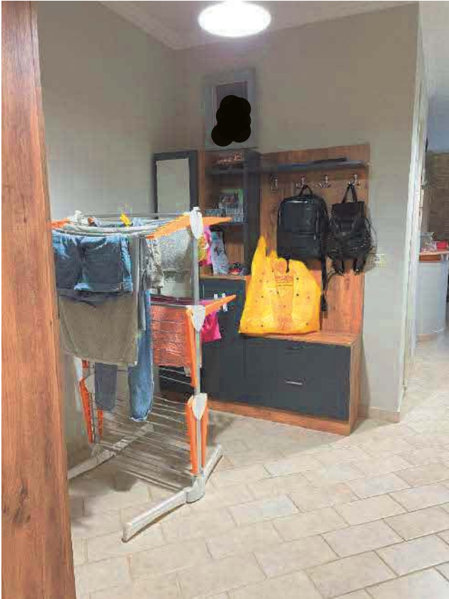
Figura 29. LOTTO UNICO: Immobile pignorato al F. 57, P.IIa 2660, Sub. 5 ubicato in San Giovanni Rotondo alla Via E. Mandes n. 27 (disimpegno).