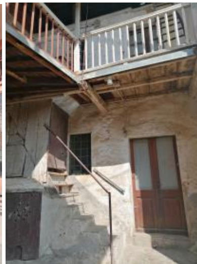
VISTA ABITAZIONE DALLA CORTE COMUNE (PORZIONE RUSTICA ELAVATA A DUE PIANI F.T.)