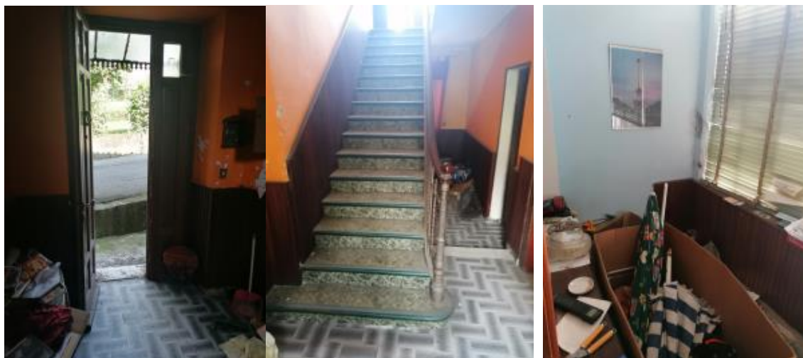
VISTA INGRESSO - VANO SCALE - VERANDA AL P.T.