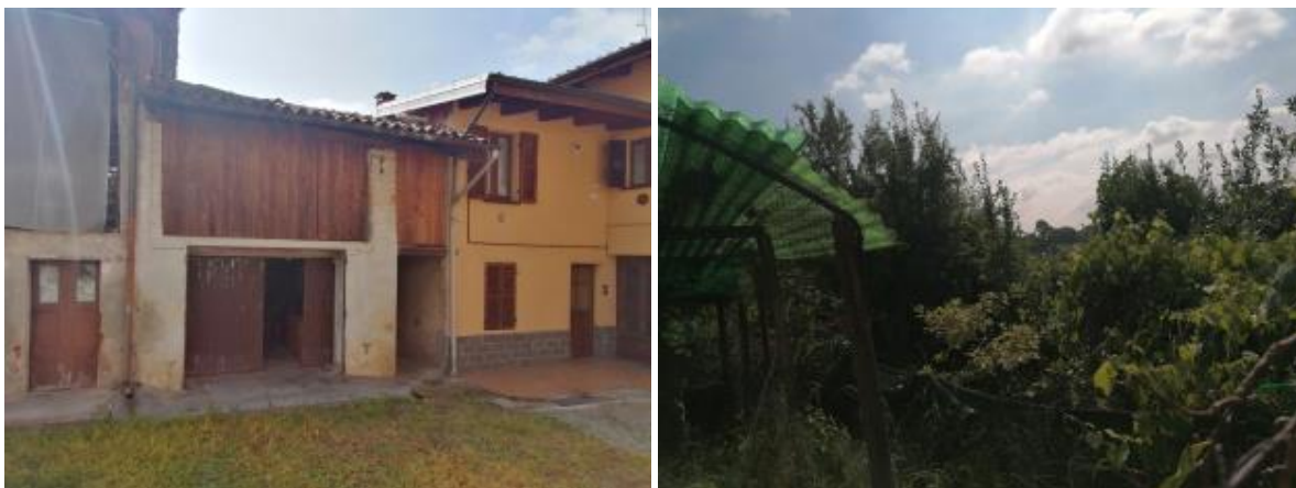
VISTA FABBRICATO ACCESSORIO DALLA CORTE (PART. 351, FG.6) E TERRENO (PART.356, FG.6)