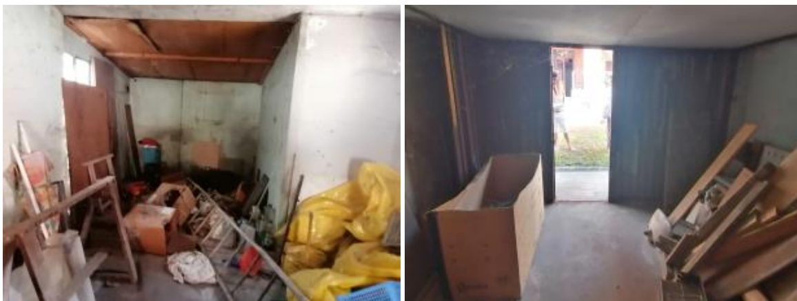
VISTA AUTORIMESSA E ZONA RIPOSTIGLIO, LAVATIOIO (FABBRICATO ACCESSORIO AL P.T.)