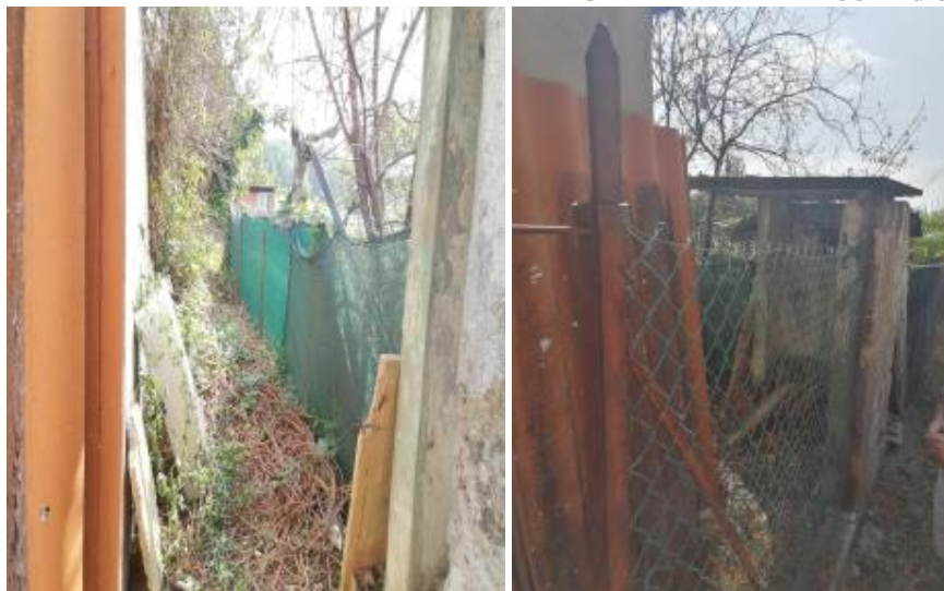
VISTE INTERNE ED ESTERNE DEL FABBRICATO ACCESSORIO E DELLE AREE ESCLUSIVE RECINTATE