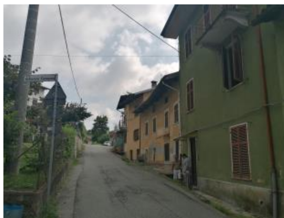
VISTA CONTESTO CIRCOSTANTE SULLA VIA PUBBLICA