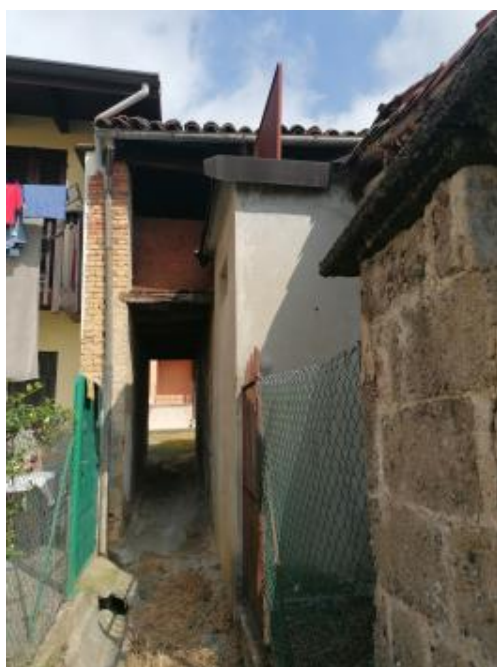
VISTA DAL MAPPALE 351 FG.6