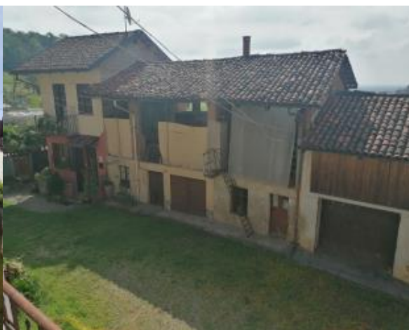
VISTA CONTESTO CORTE COMUNE (PART. 336 FG.6)