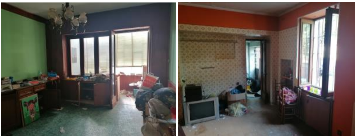
VISTA SOGGIORNO - CUCINA AL P.T.