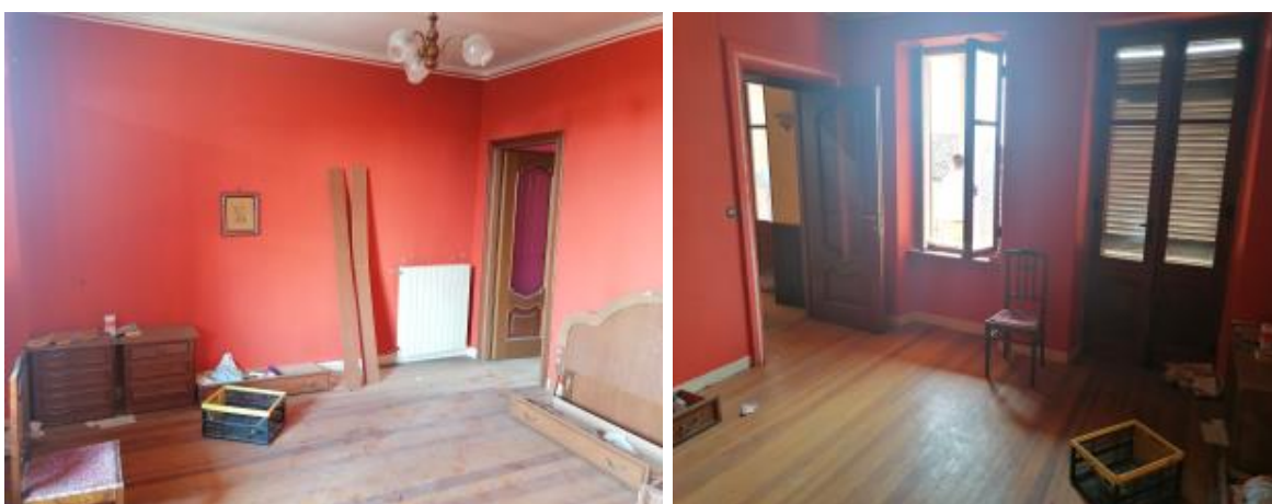
VISTA CAMERE AL P.1.