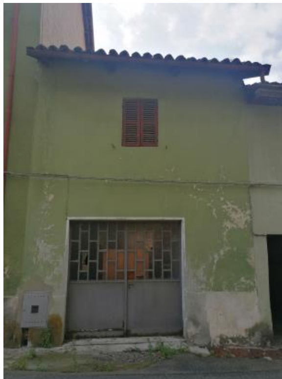
VISTA ABITAZIONE DALLA VIA PUBBLICA (PARTE ELEVATA A TRE P.FT. E PARTE A DUE P.FT)