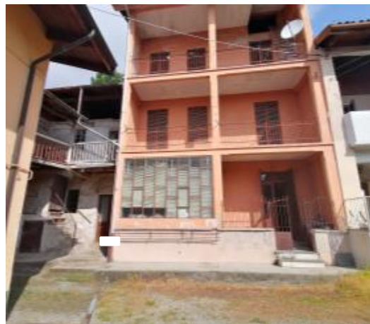
VISTA ABITAZIONE DALLA CORTE COMUNE (PORZIONE CIVILE ELAVATA A TRE PIANI F.T.)