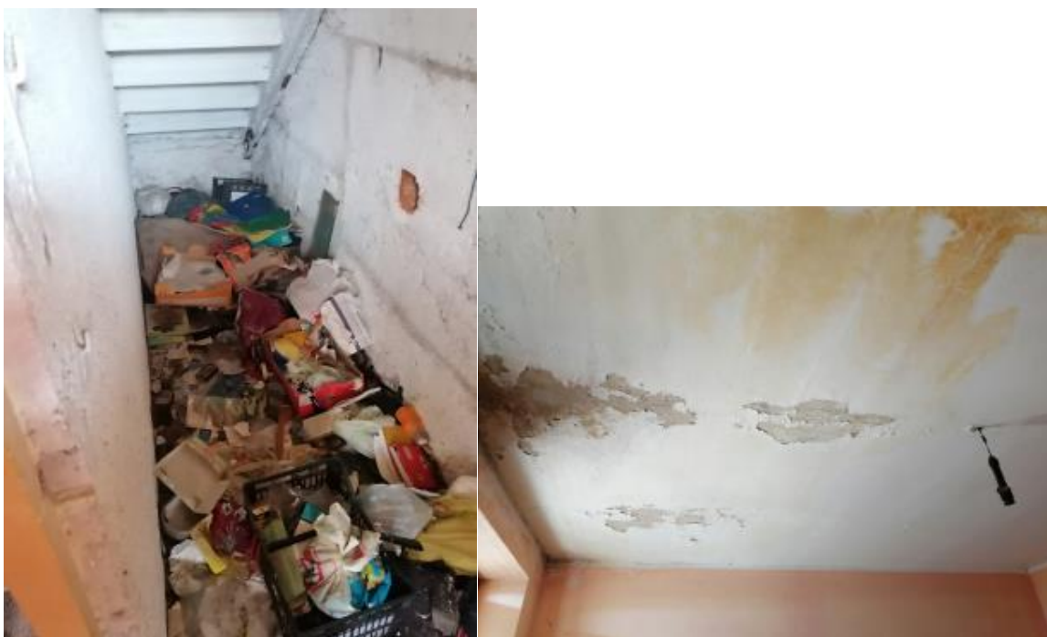
VISTA CAMERE E STATO DI DEGRADO AL PIANO SECONDO