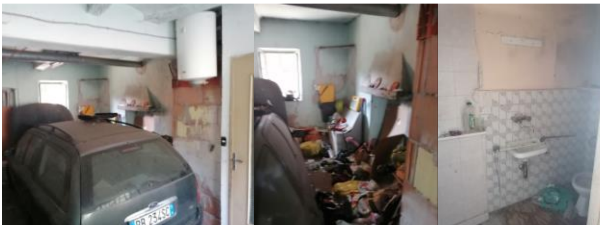
VISTA RIPOSTIGLIO E SERVIZIO IGIENICO AL P.T.