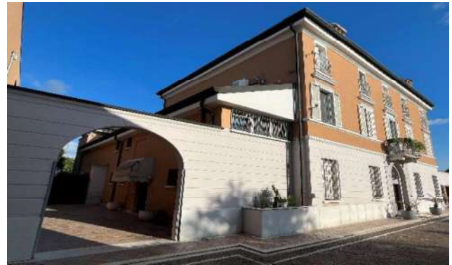
2 Fronte e fianco con ingresso