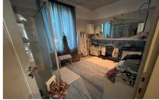
10 Bagno 1