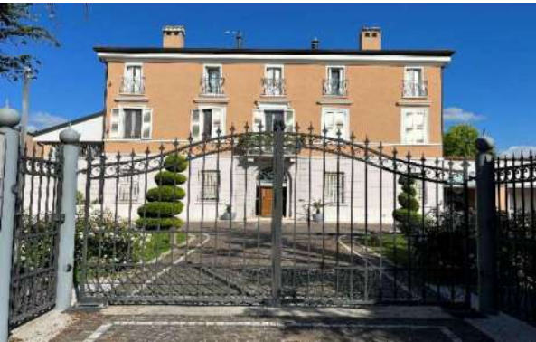
1 Fronte via Mazzini