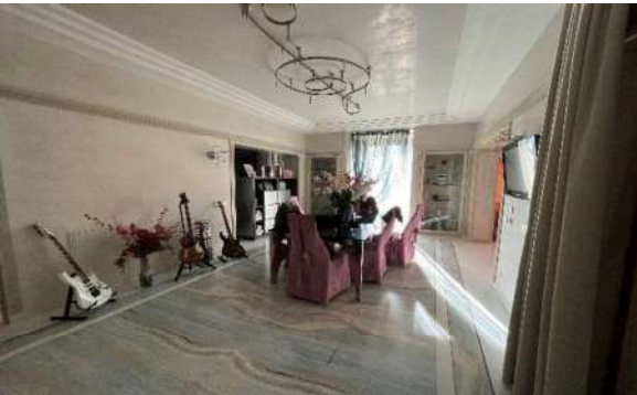
5 Zona giorno-pranzo