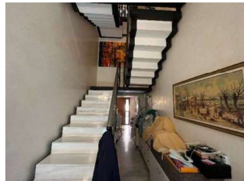
4 Vano scala