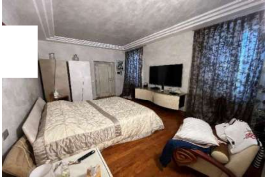
9 Letto nord