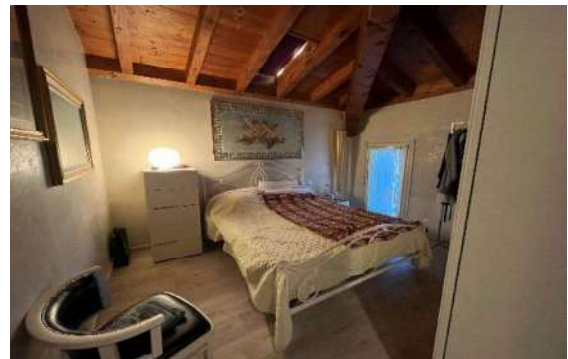
14 Letto sottotetto