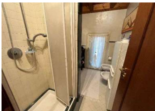
15 Bagno 3 sottotetto