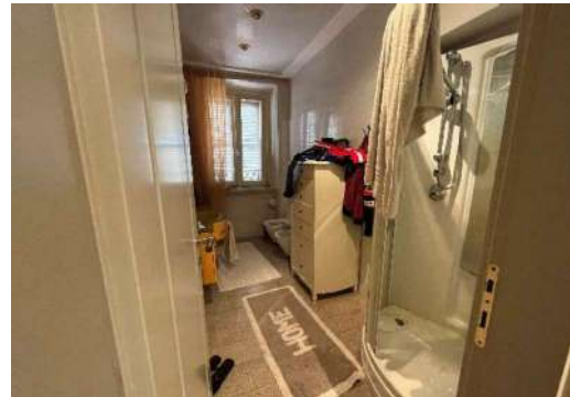
12 Bagno 2