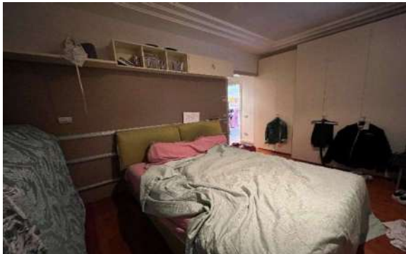
11 Letto sud