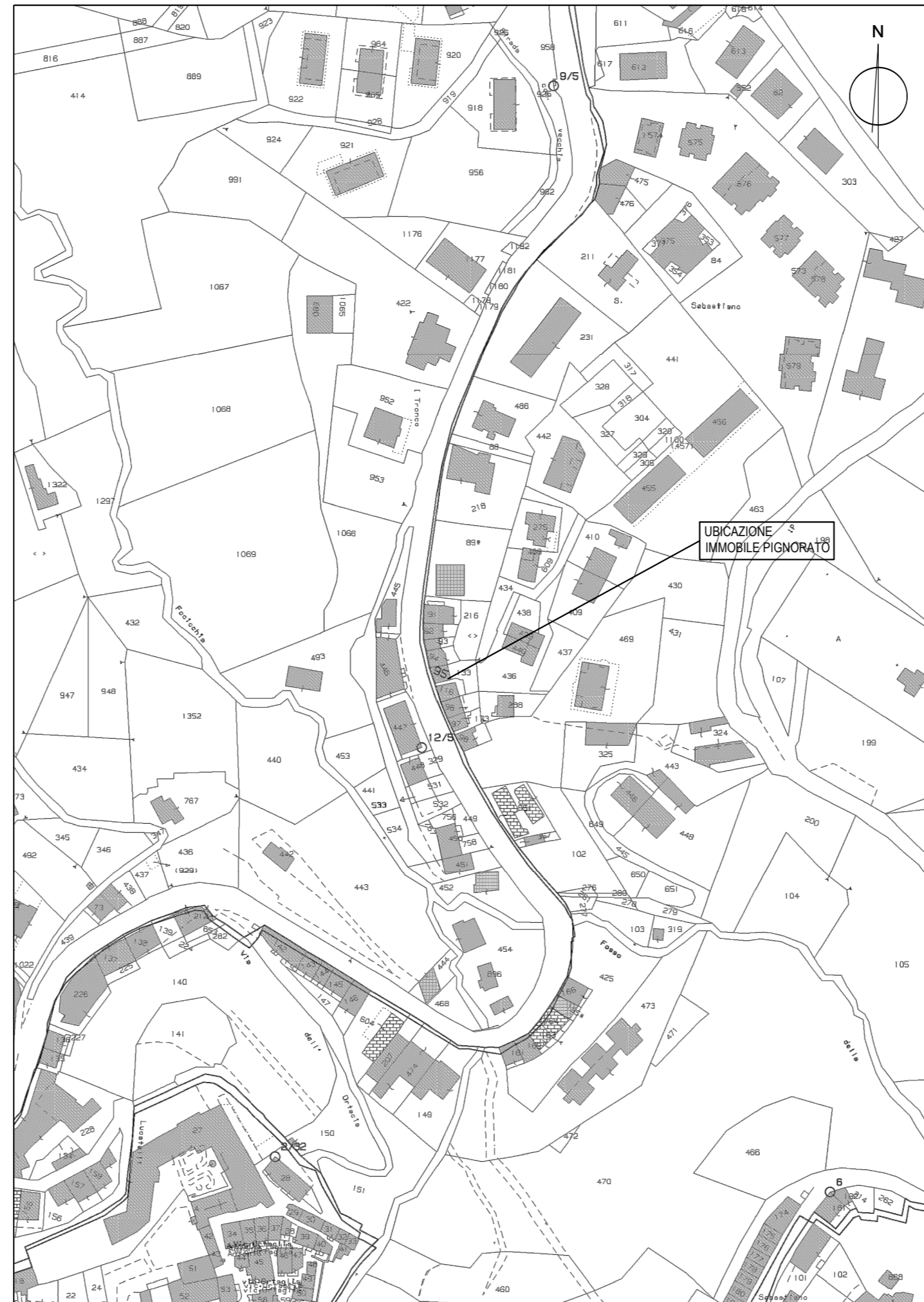
STRALCIO CATASTALE CATASTO TERRENI Fg. 6 part. 95 - scala 1:2000