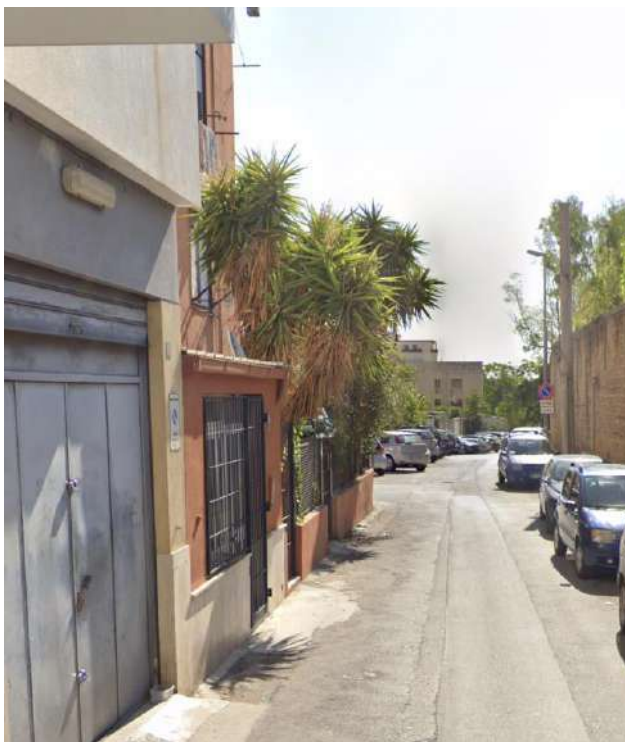
INGRESSO DA VIA ALTARELLO 17/D