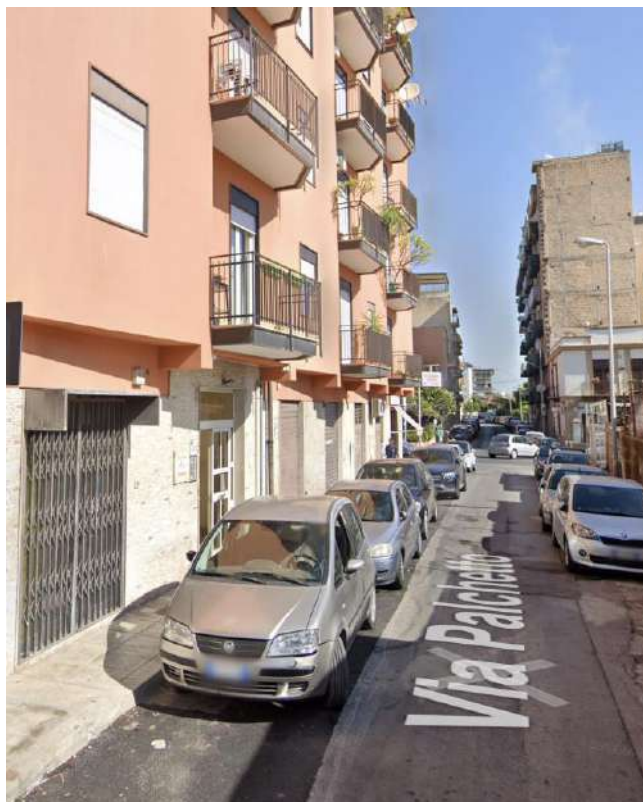
INGRESSO CONDOMINIALE DA VIA PALCHETTO