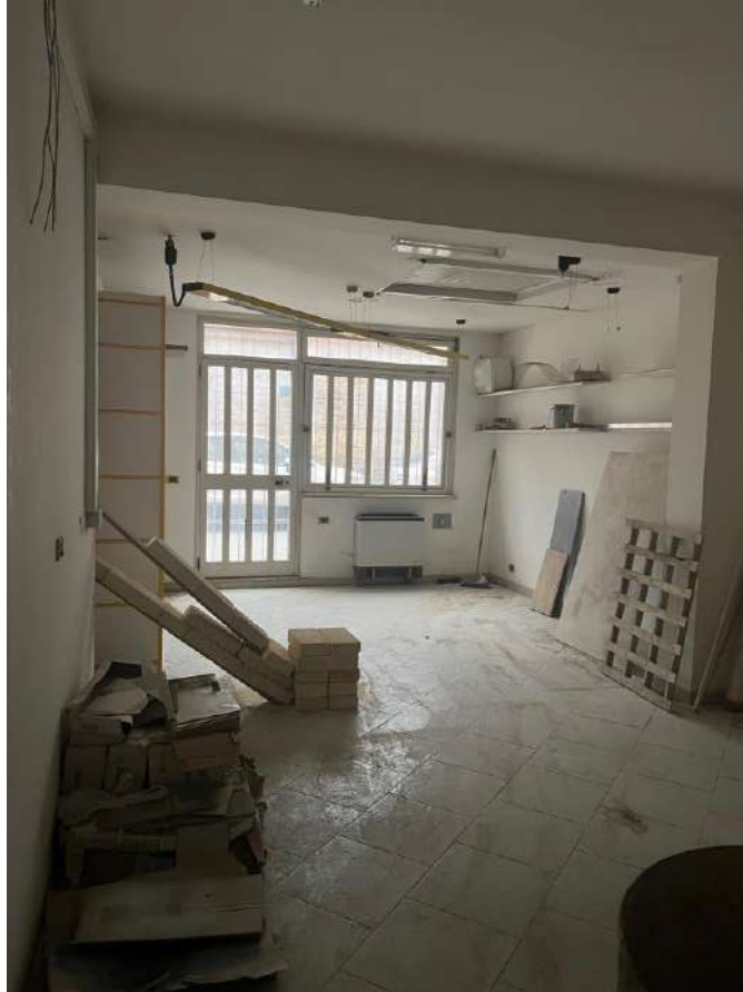
UFFICIO 1- INGRESSO SU VIA ALTARELLO