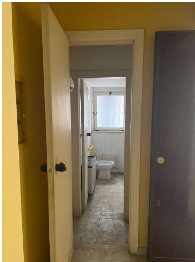
W.C. CON ANTI W.C.