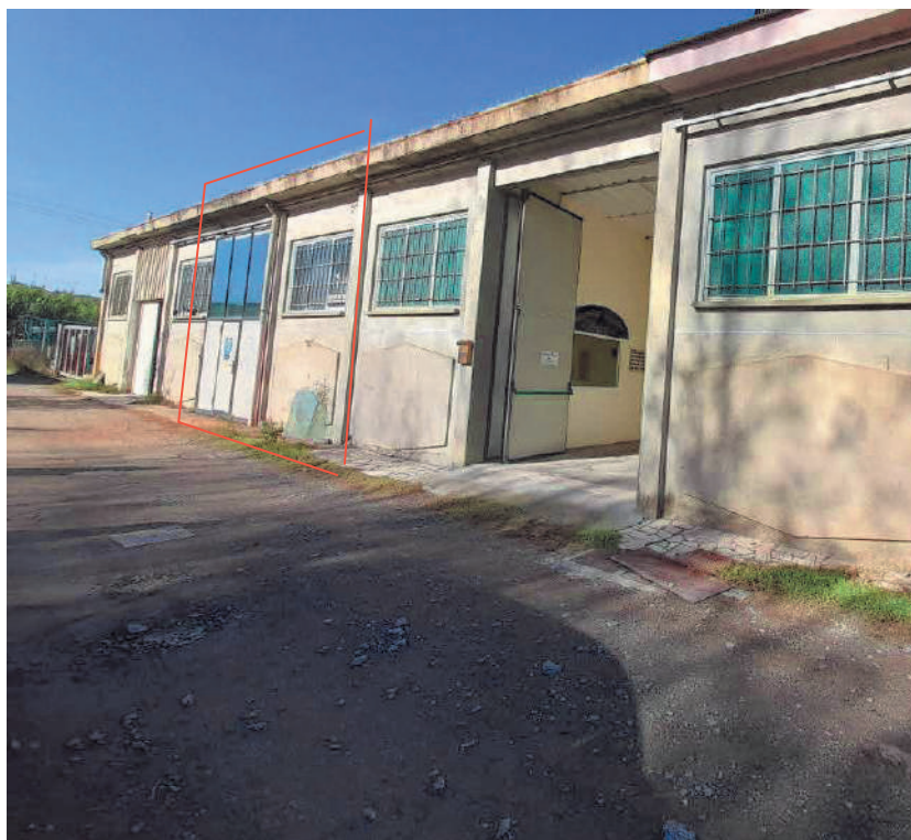
Prospetto sud-accesso al laboratorio artigianale