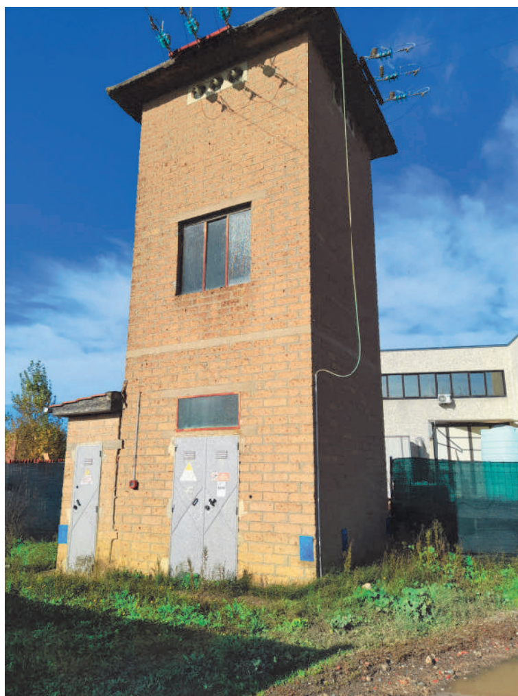
Cabina elettrica B.C.N.C.