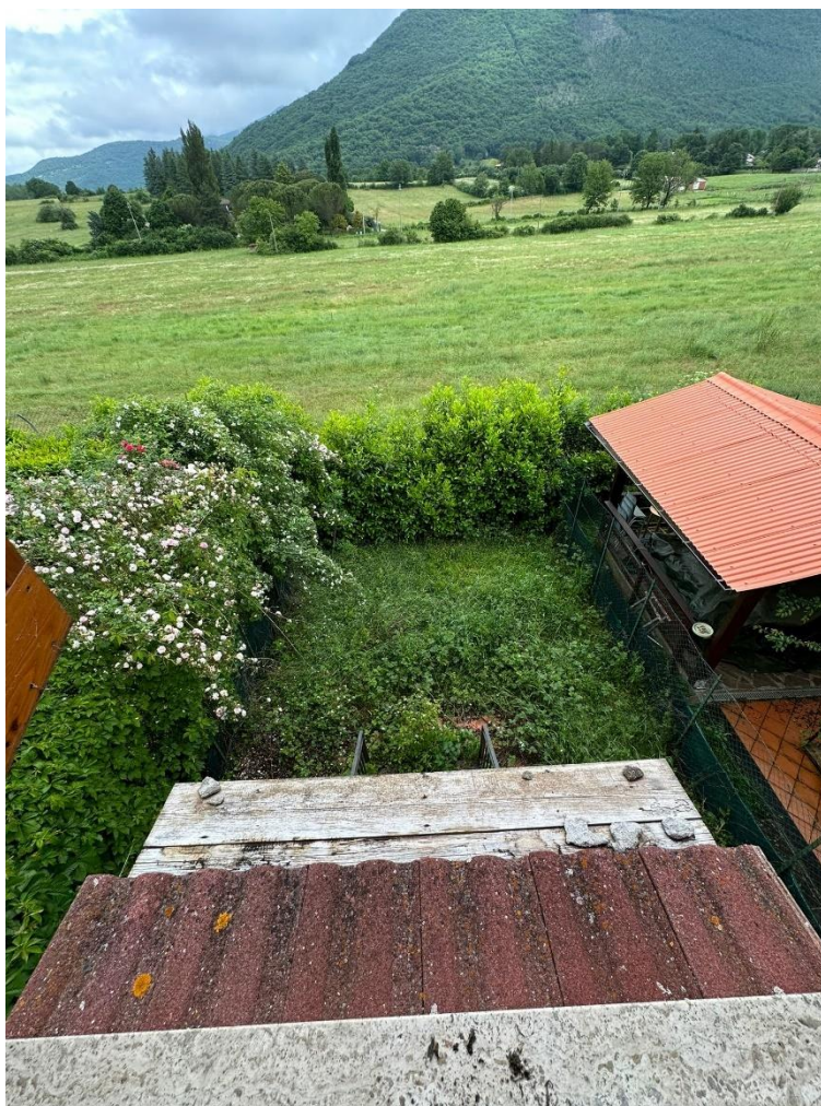
Foto n.12 – Vista corte esclusiva (sub.5) dal ripostiglio posto al piano primo