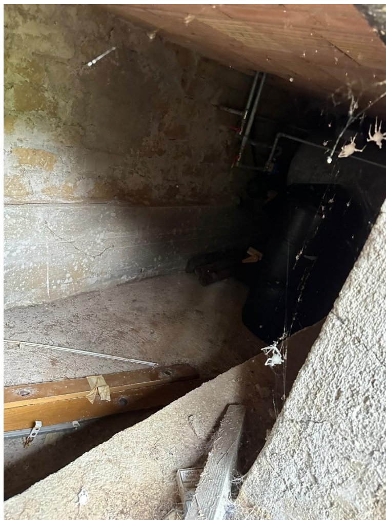
Foto n.17 – Vista del locale di deposito del piano seminterrato dall'ingresso posto sulla corte esclusiva (sub.5)