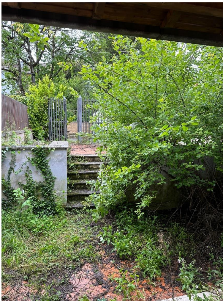
Foto n.4 – Vista della corte esclusiva (sub.4) dall'ingresso dell'immobile