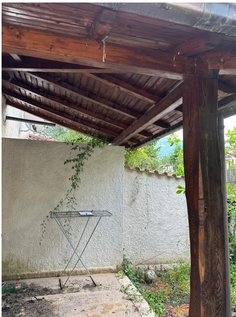
Foto n.3 – Vista laterale del portico posto nella corte esclusiva (sub.4)