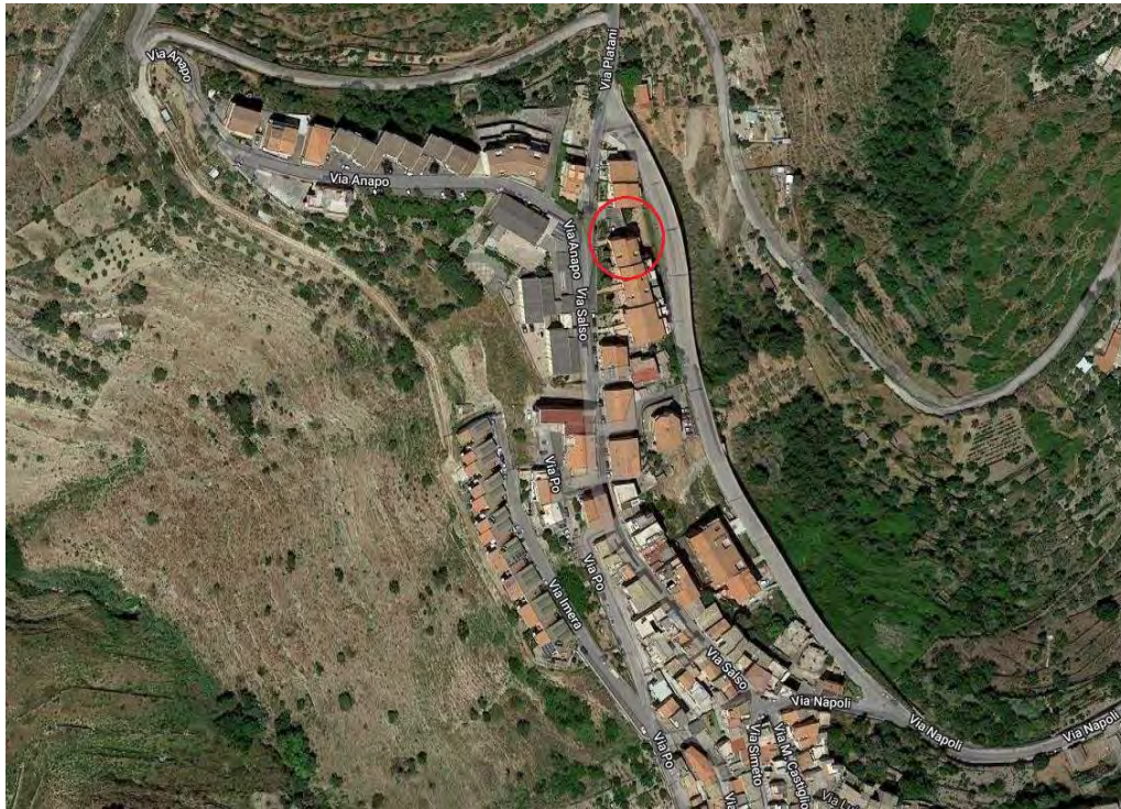
Foto aerea della zona in cui ricade il fabbricato a cui appartiene il deposito (cerchio rosso)

Geograficamente l'edificio in esame è individuato dalle seguenti coordinate: Latitudine = 14,738384; Longitudine = 37,627401.