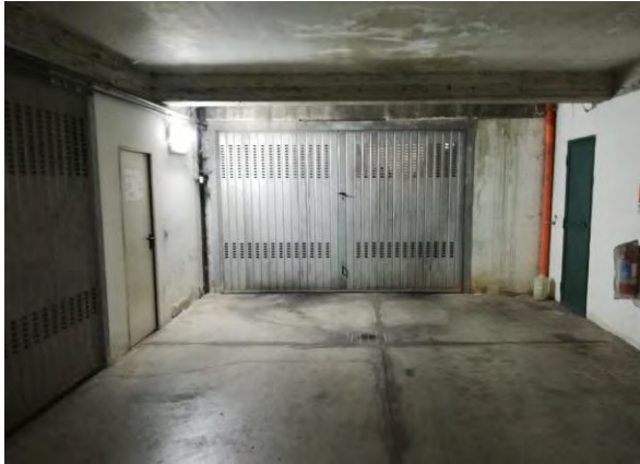
Esterno locale di deposito

Il bene immobile, individuato nella presente relazione come lotto di vendita n. 2, è un locale di deposito ubicato al terzo piano interrato di un edificio sito a Centuripe in via Platani n. 10.