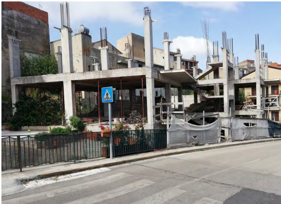
Edificio in corso di costruzione oggetto di pignoramento

Il cespite immobiliare, individuato nella presente relazione come lotto di vendita n. 1, è un edificio in corso di costruzione con annesso terreno, ubicato a Centuripe lungo la strada comunale di collegamento tra la via Napoli e la via Platani.