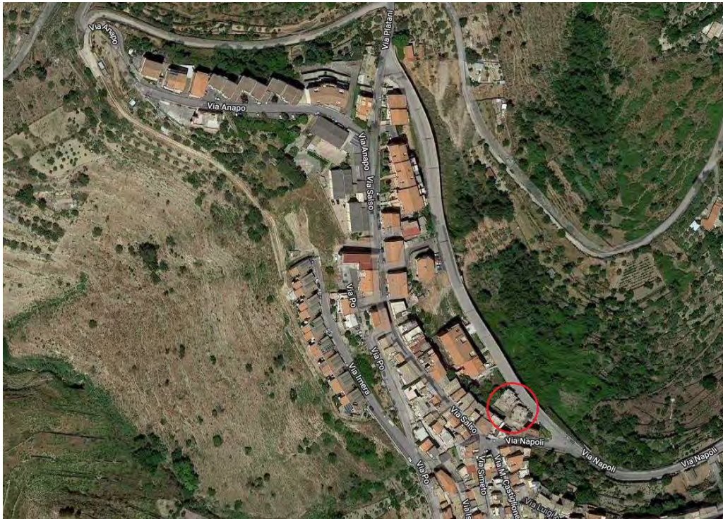
Foto aerea della zona in cui ricade il complesso immobiliare pignorato (cerchio in rosso)

Geograficamente l'edificio in esame è individuato dalle seguenti coordinate: Latitudine = 14,739364; Longitudine = 37,625689.