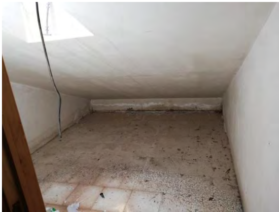
Interno locale di sgombero (sub. 14)

I beni immobili, individuati nella presente relazione come lotto di vendita n. 4, sono due locali di sgombero ubicati nel piano sottotetto di un edificio sito a Centuripe in via Pistoia n. 20.