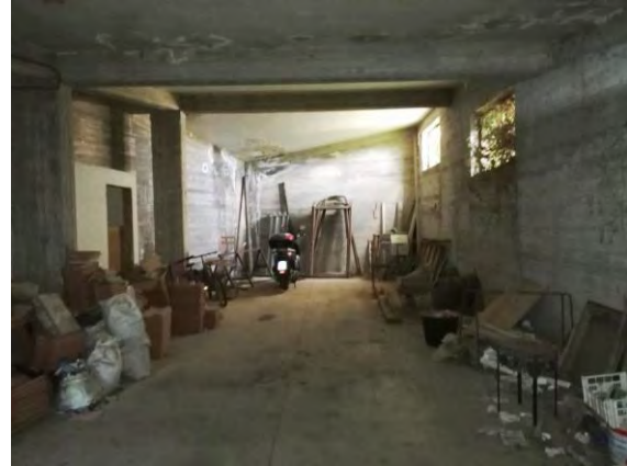
Interno locale di deposito

L'edificio è nel suo complesso disposto su sette livelli, di cui tre piani interrati (destinati a box auto o a locali di deposito), tre piani fuori terra (destinati a tre alloggi per ciascun piano) ed un piano mansardato (anch'esso destinato ad altri tre alloggi).