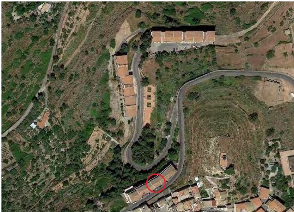
Foto aerea della zona in cui ricade il fabbricato a cui appartengono i locali pignorati

Geograficamente l'edificio in esame è individuato dalle seguenti coordinate: Latitudine = 14,742586; Longitudine = 37,626263.