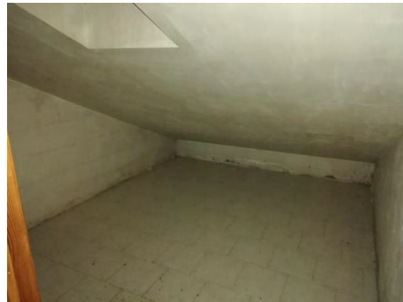
Interno locale di sgombero (sub. 13)

L'edificio è nel suo complesso disposto su sei livelli, di cui due piani seminterrati (destinati a box auto), tre piani fuori terra (destinati a quattro alloggi per ogni piano) ed un piano sottotetto (destinato in parte a locali di sgombero e in parte ad altri due appartamenti).