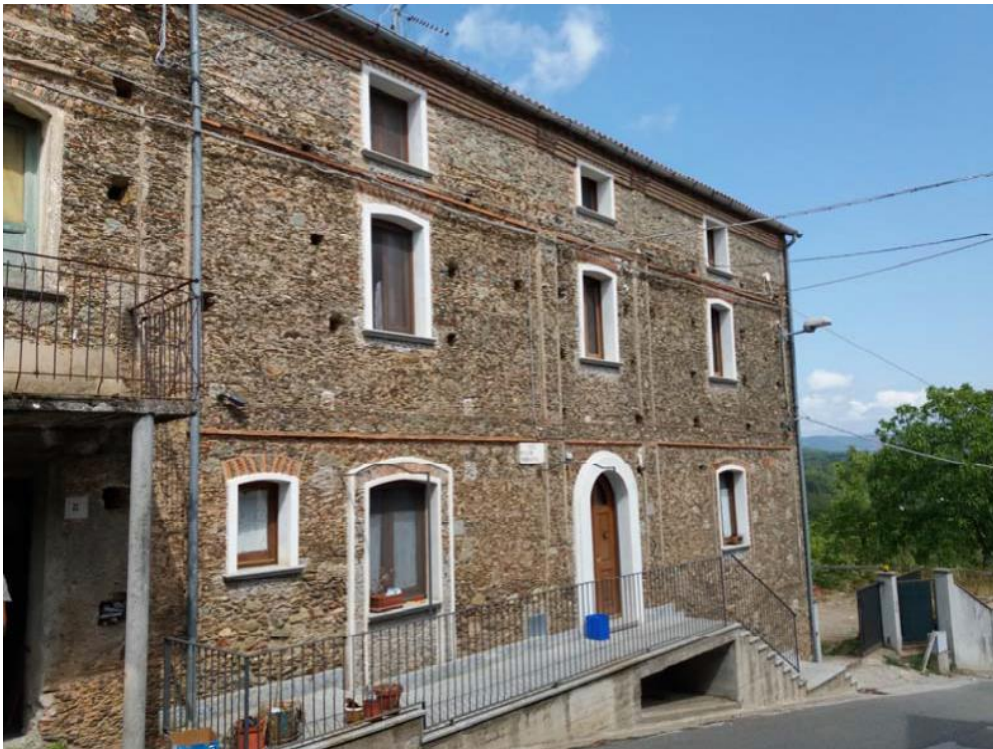
Foto n. 1: Accesso all'unità immobiliare n. 1 del fabbricato in muratura costituito di tre piani fuori terra censito in catasto fabbricati dalla particella 31 del foglio di mappa 27 del comune di Decollatura.