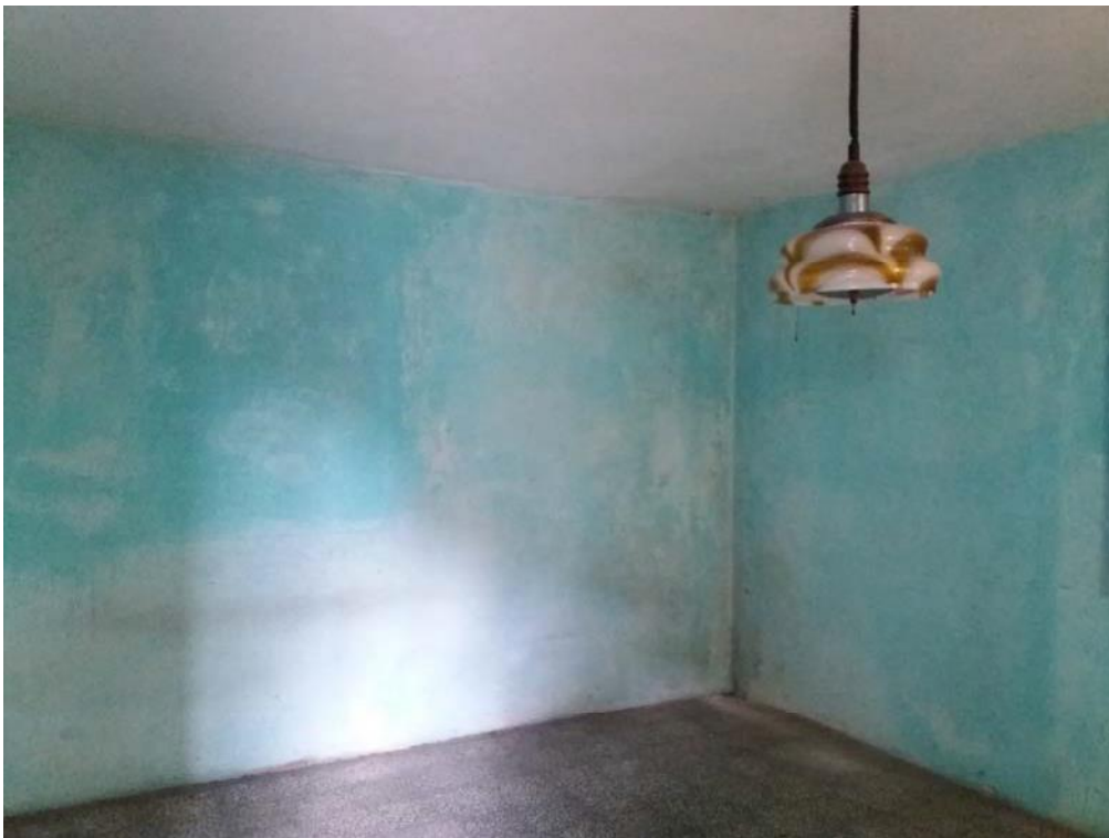
Foto n. 33: Vano, indicato con il simbolo S2, ubicato al piano primo dell'unità 2 del fabbricato in muratura.