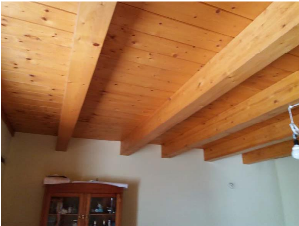
Foto n. 7: Intradosso del solaio in legno del soggiorno (indicato con la lettera S) ubicato al piano terra dell'unità immobiliare n. 1 del fabbricato in muratura.