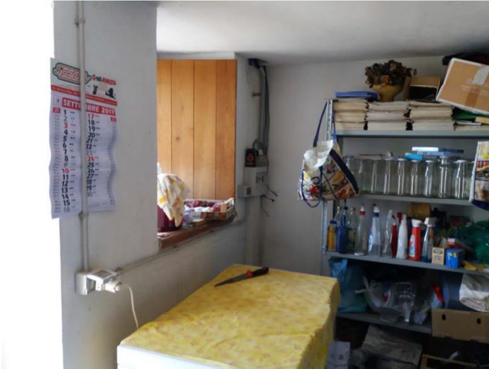
Foto n. 38: Pertinenza accessoria non direttamente collegata all'unità immobiliare principale, ubicata al piano seminterrato dell'immobile oggetto di pignoramento.