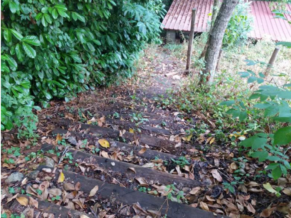
Foto n. 48: Scala che consente di raggiungere il manufatto con struttura in acciaio, adibito a deposito ed insistente sulla particella 515 del foglio di mappa 26 del comune di Decollatura .