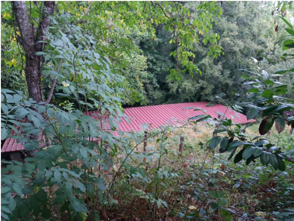
Foto n. 47: Manufatto con struttura in acciaio, adibito a deposito ed insistente sulla particella 515 del foglio di mappa 26 del comune di Decollatura .