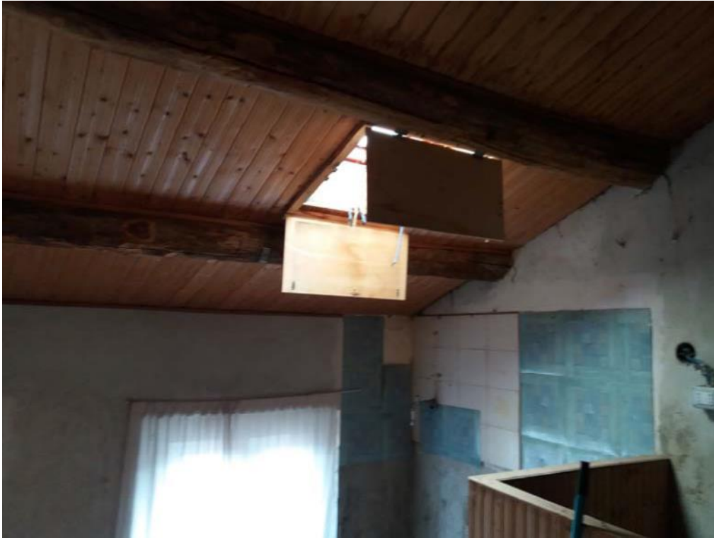
Foto n. 36: Stanza, indicata con il simbolo S3, ubicato al piano secondo dell'unità 2 del fabbricato in muratura.