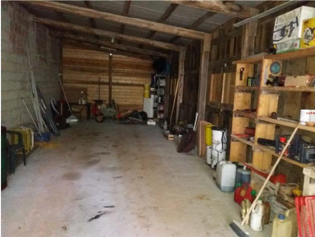
Foto n. 52: Manufatto con struttura portante in legno (adibito a deposito) insistente sulla particella 515 del foglio di mappa 26 del comune di Decollatura.