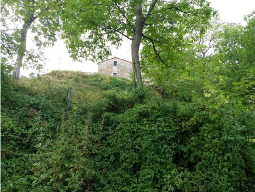
Foto n. 50: Porzione di terreno censito dalla particella 515 del foglio di mappa 26 del comune di Decollatura .