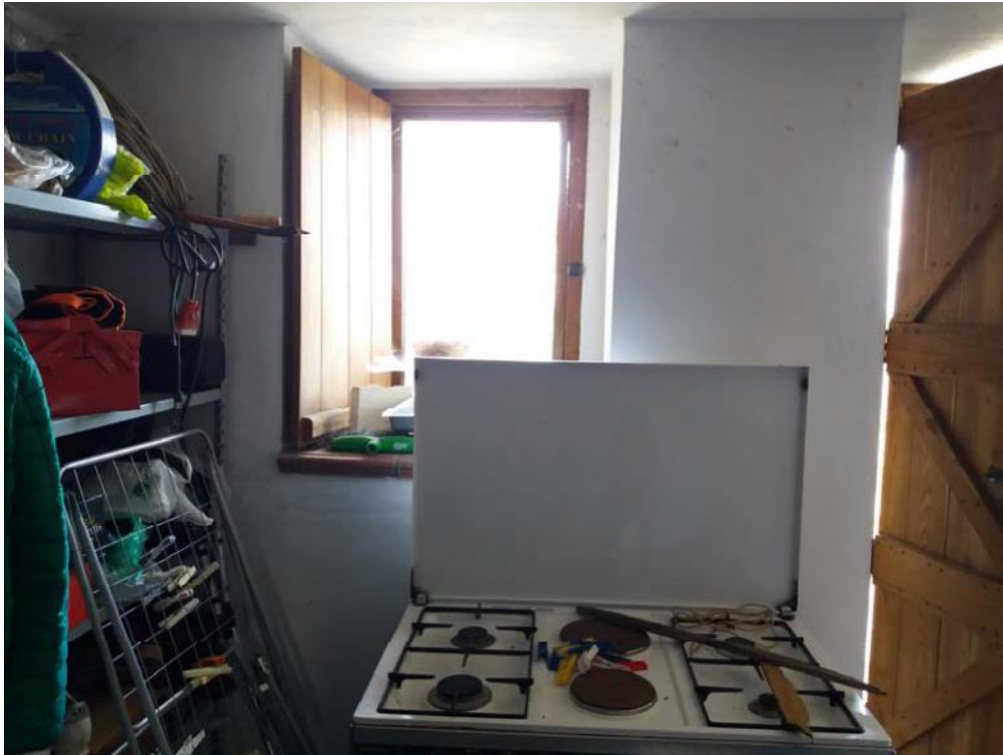
Foto n. 39: Pertinenza accessoria non direttamente collegata all'unità immobiliare principale, ubicata al piano seminterrato dell'immobile oggetto di pignoramento.