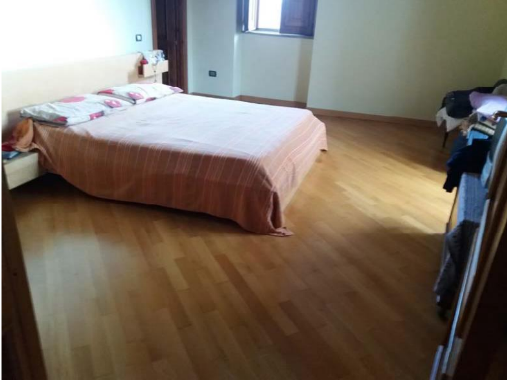
Foto n. 12: Stanza da letto (indicata con il simbolo L1 ) ubicato al primo piano dell'unità immobiliare n. 1 del fabbricato in muratura.