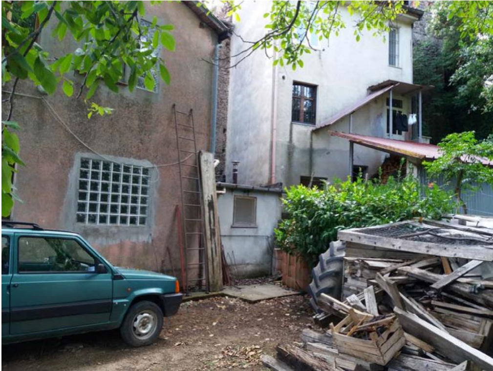
Foto n. 40: Corpo di fabbrica derivante dall'ampliamento dell'immobile censito in catasto dalla particella 32 del foglio di mappa 27 del comune di Decollatura , stralciato dalla procedura esecutiva per cui è causa a seguito dell'udienza del 25 ottobre 2017.