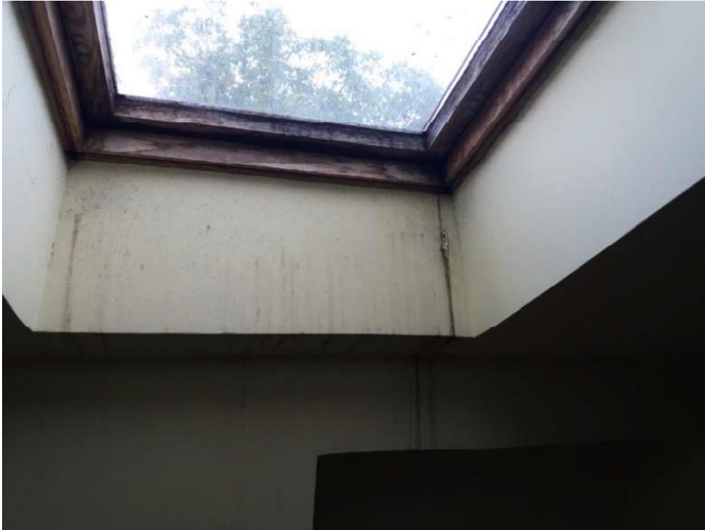
Foto n. 24: Infiltrazioni di acqua meteorica riscontrate in corrispondenza dell'oblò ubicato nel vano indicato con il simbolo S4 del secondo piano dell'unità 1 del fabbricato in muratura.