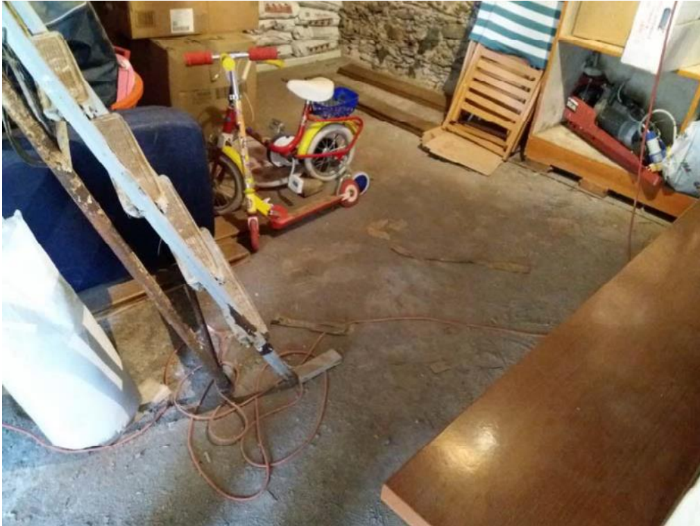
Foto n. 30: Pavimento del deposito, indicato con il simbolo S1 , ubicato al piano terra dell'unità 2 del fabbricato in muratura.