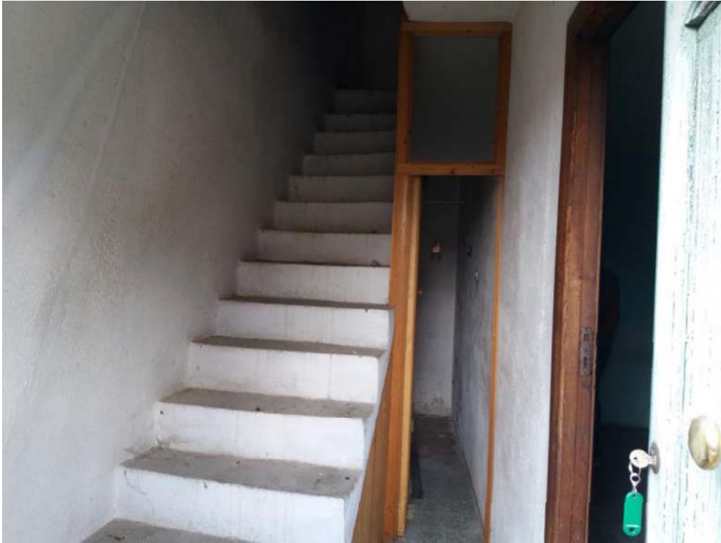
Foto n. 32: Vano scala che collega verticalmente il piano primo al piano secondo dell'unità 2 del fabbricato in muratura.