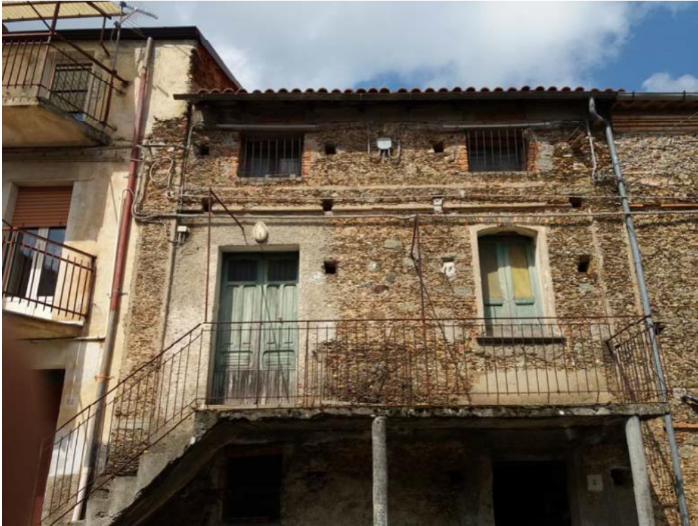
Foto n. 2: Accesso all'unità immobiliare n. 2 del fabbricato in muratura costituito di tre piani fuori terra e censito in catasto fabbricati dalla particella 31, foglio di mappa 27 del comune di Decollatura.