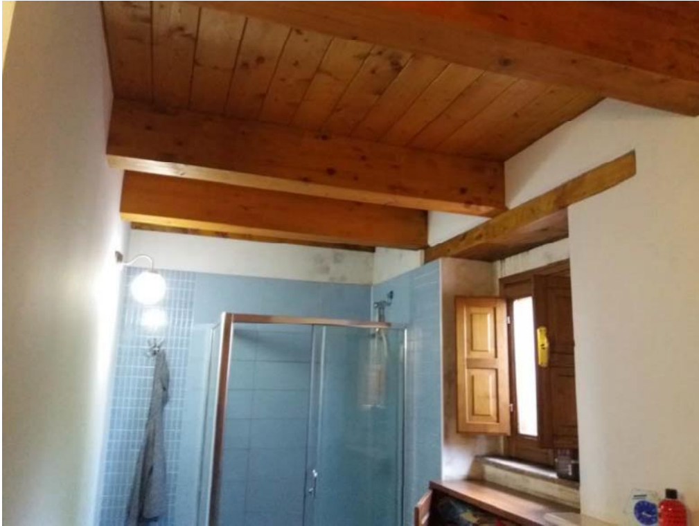
Foto n. 18: Bagno (indicato con il simbolo WC2 ) ubicato al piano primo dell'unità 1 del fabbricato in muratura.