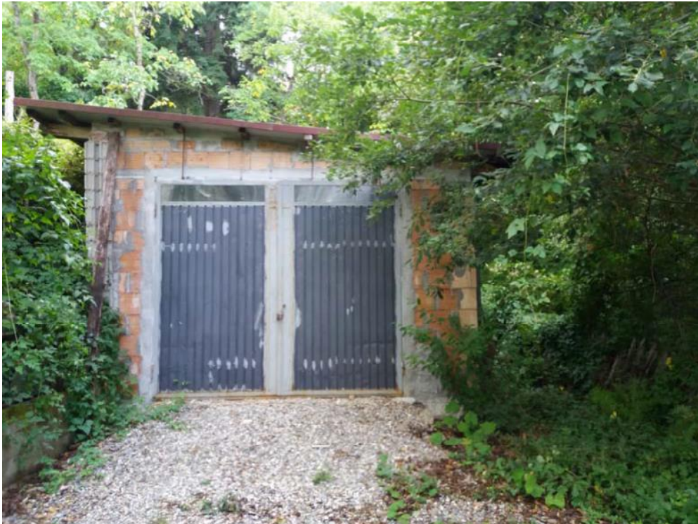
Foto n. 49: Prospetto Nord-Est del manufatto con struttura in acciaio, adibito a deposito ed insistente sulla particella 515 del foglio di mappa 26 del comune di Decollatura .