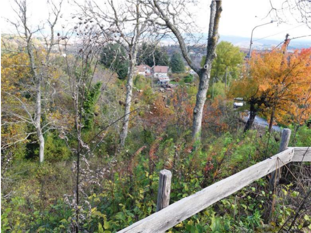
Foto n. 54: Terreno censito dalla particella 123 del foglio di mappa 26 del comune di Decollatura .