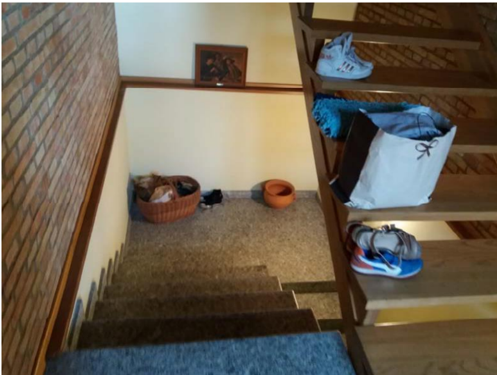
Foto n. 11: Vano scala che consente il collegamento verticale tra i tre piani dell'unità immobiliare n. 1.