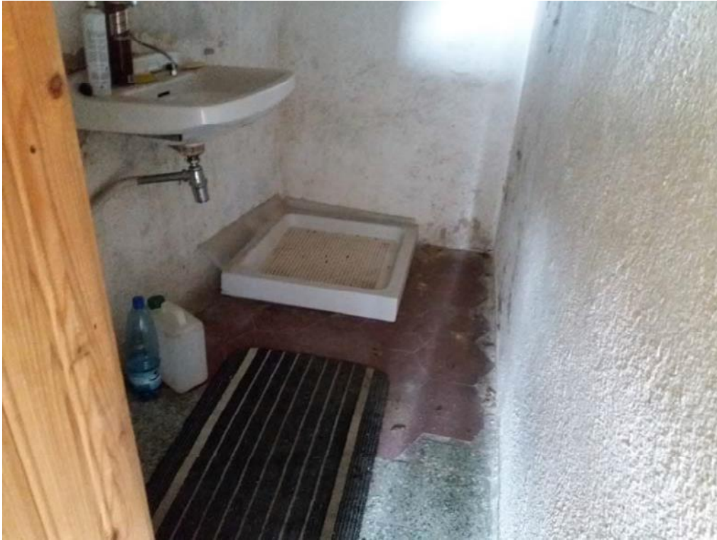
Foto n. 34: Bagno, indicato con il simbolo WC3 , ubicato al piano primo dell'unità 2 del fabbricato in muratura.