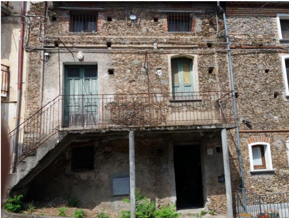
Foto n. 3: Accesso al piano terra dell'unità immobiliare n. 2 del fabbricato in muratura costituito di tre piani fuori terra e censito in catasto fabbricati dalla particella 31, foglio di mappa 27 del comune di Decollatura.