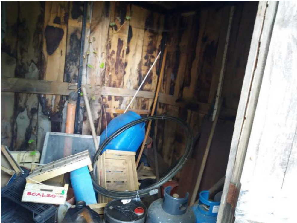
Foto n. 53: Manufatto con struttura portante in legno (adibito a deposito) insistente sulla particella 515 del foglio di mappa 26 del comune di Decollatura.