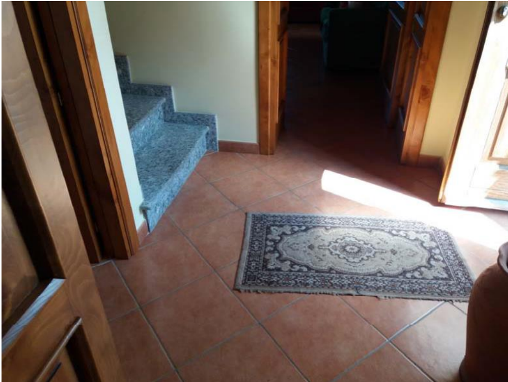
Foto n. 9: Ingresso (indicato con la lettera I) ubicato al piano terra dell'unità immobiliare n. 1 del fabbricato in muratura.