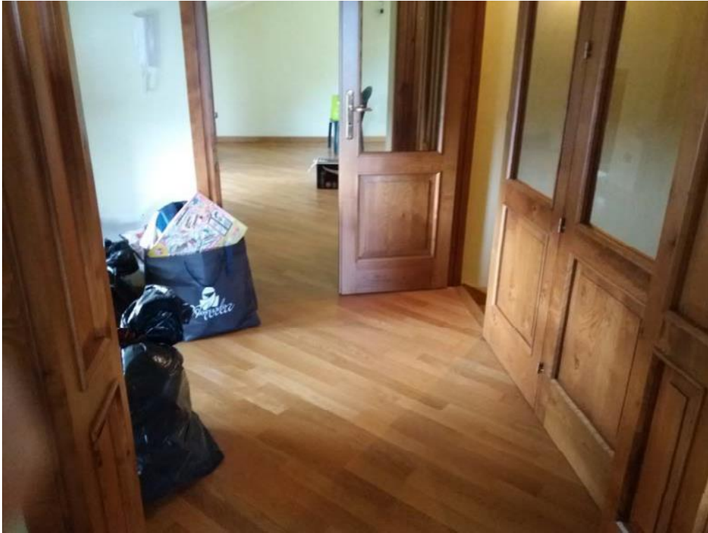
Foto n. 26: Disimpegno indicato con il simbolo Dis del secondo piano dell'unità 1 del fabbricato in muratura.