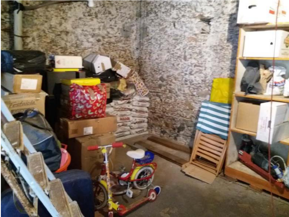
Foto n. 28: Deposito, indicato con il simbolo S1 , ubicato al piano terra dell'unità 2 del fabbricato in muratura.