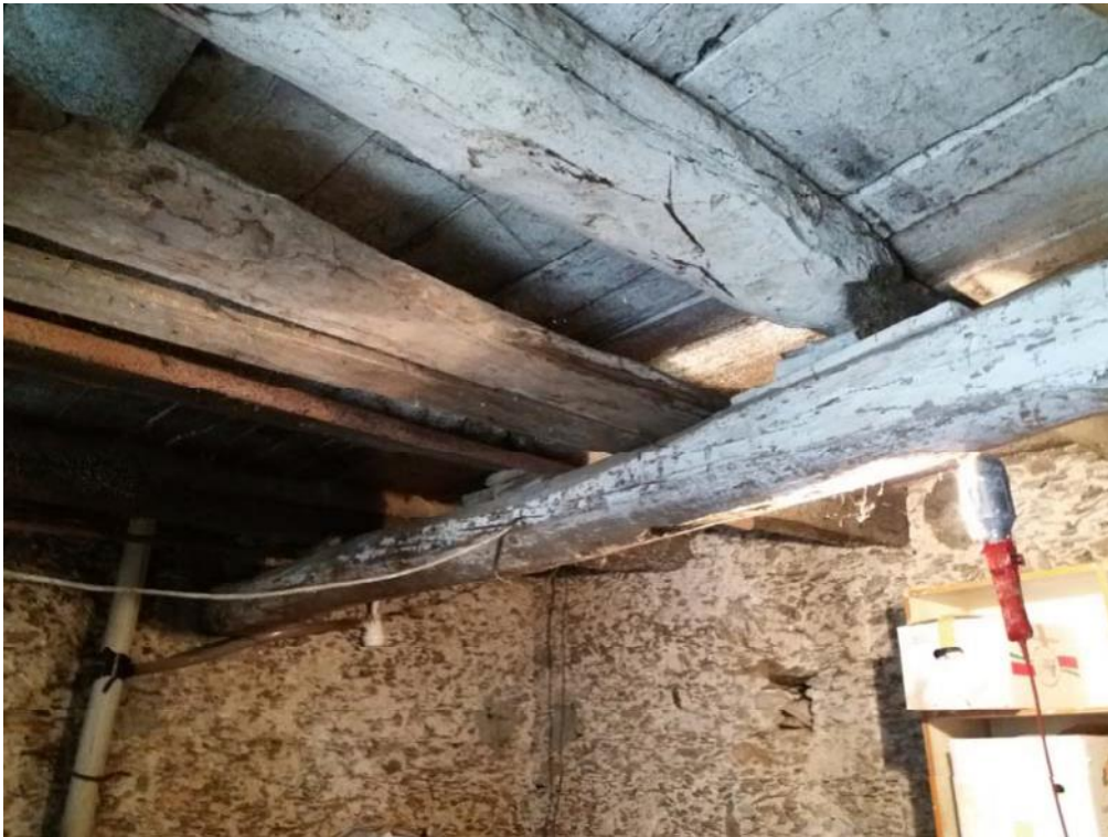
Foto n. 29: Solaio in legno del deposito, indicato con il simbolo S1 , ubicato al piano terra dell'unità 2 del fabbricato in muratura.