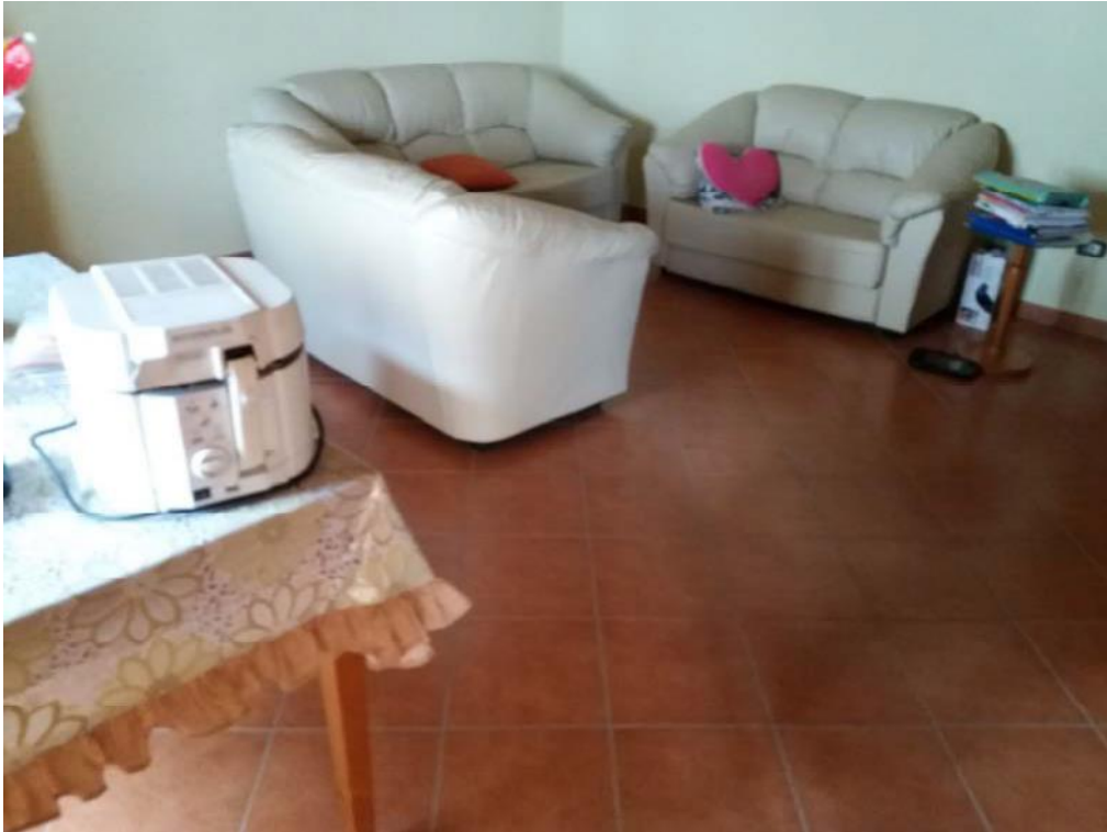
Foto n. 6: Soggiorno (indicato con la lettera S) ubicato al piano terra dell'unità immobiliare n. 1 del fabbricato in muratura.