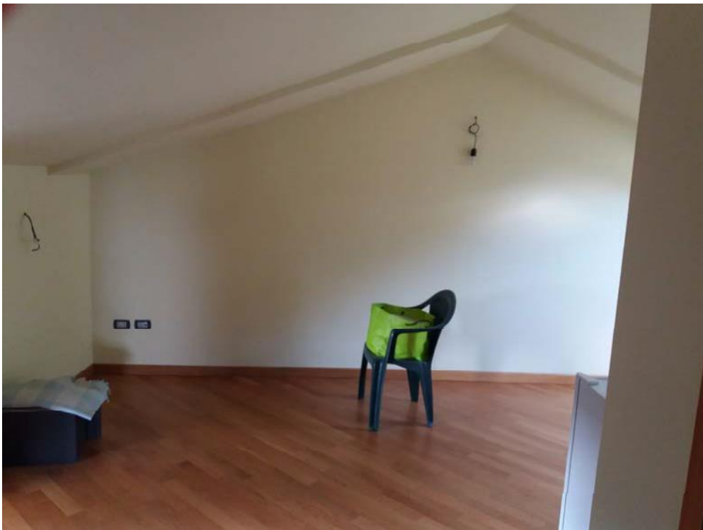
Foto n. 25: Vano indicato con il simbolo S4 del secondo piano dell'unità 1 del fabbricato in muratura.