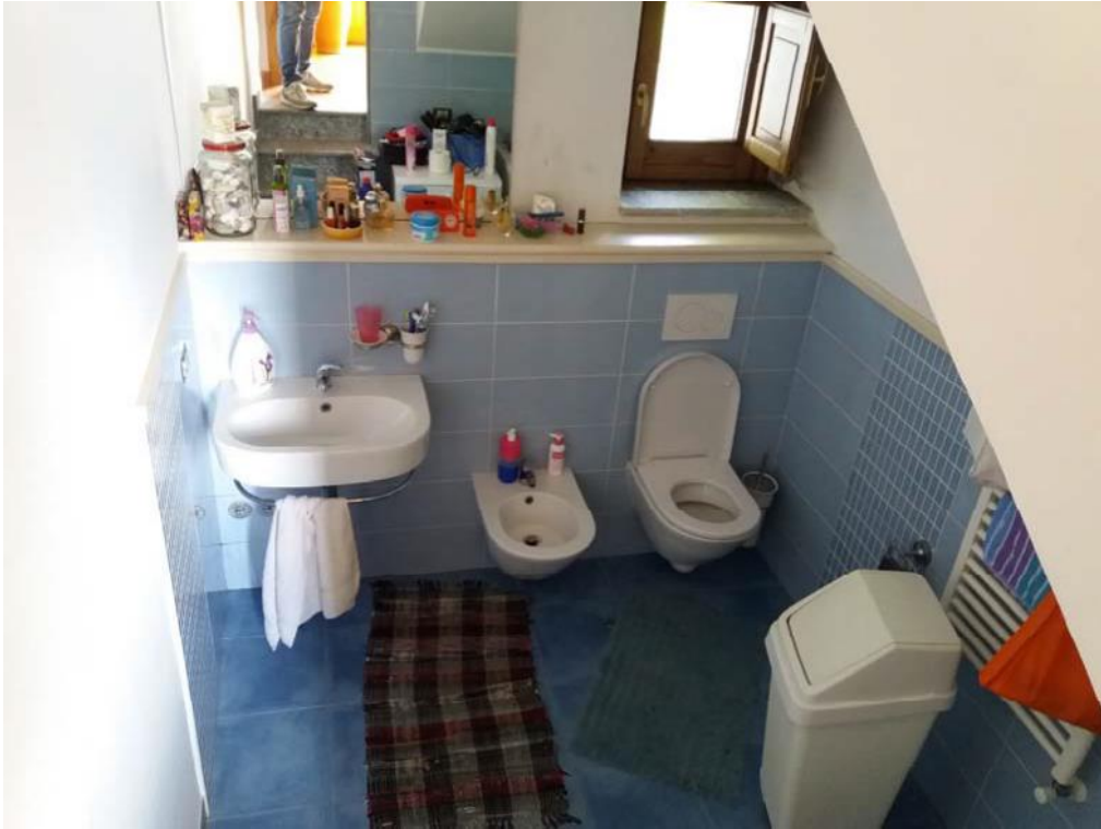
Foto n. 10: Bagno (indicato con il simbolo WC1) ubicato al piano terra dell'unità immobiliare n. 1 del fabbricato in muratura.