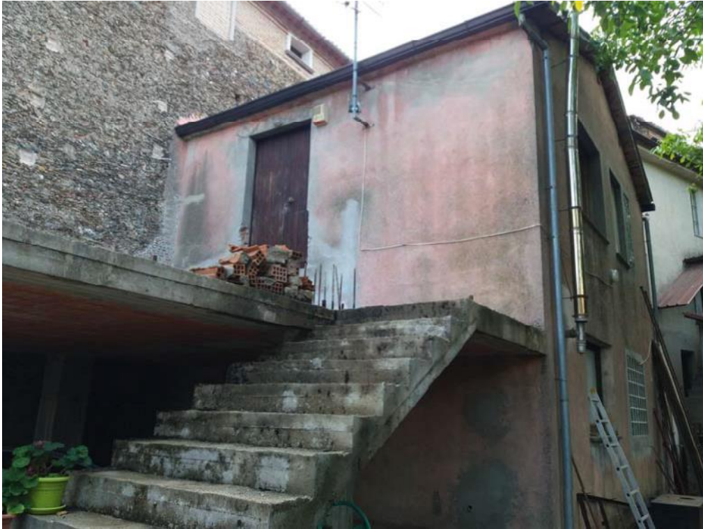
Foto n. 44: Manufatto rustico in c.a. (stralciato dalla stima, in accordo con quanto indicato nel corso dell'udienza del 25 ottobre 2017) che consente l'accesso al primo piano del corpo di fabbrica derivante dall'ampliamento dell'immobile censito in catasto dalla particella 32 del foglio di mappa 27 del comune di Decollatura.