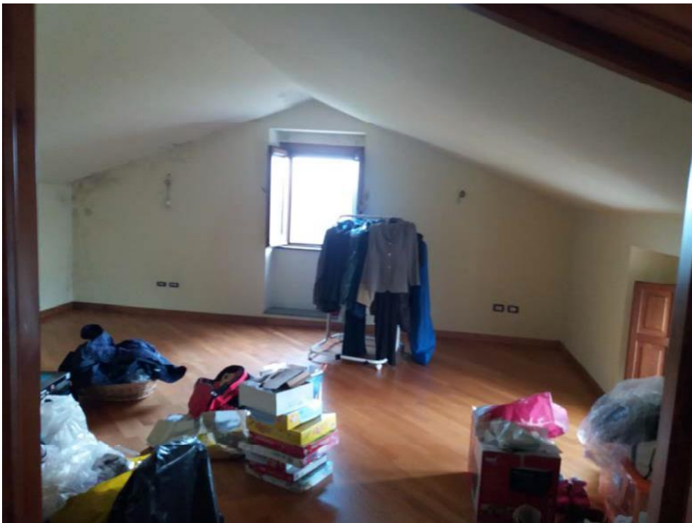
Foto n. 21: Vano (indicato con il simbolo S5) ubicato al secondo piano dell'unità 1 del fabbricato in muratura; si nota della condensa sulle pareti perimetrali.