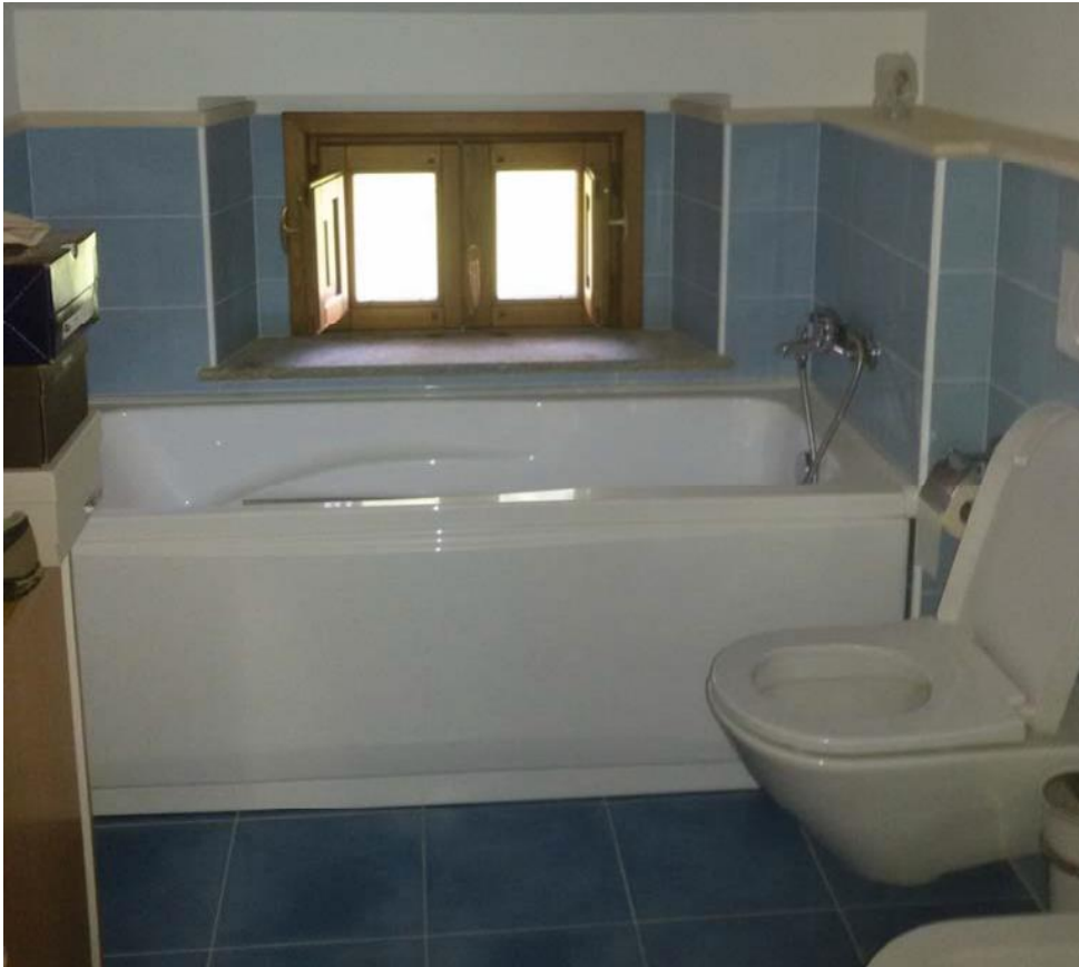
Foto n. 27: Bagno, indicato con il simbolo WC4 , del secondo piano dell'unità 1 del fabbricato in muratura.