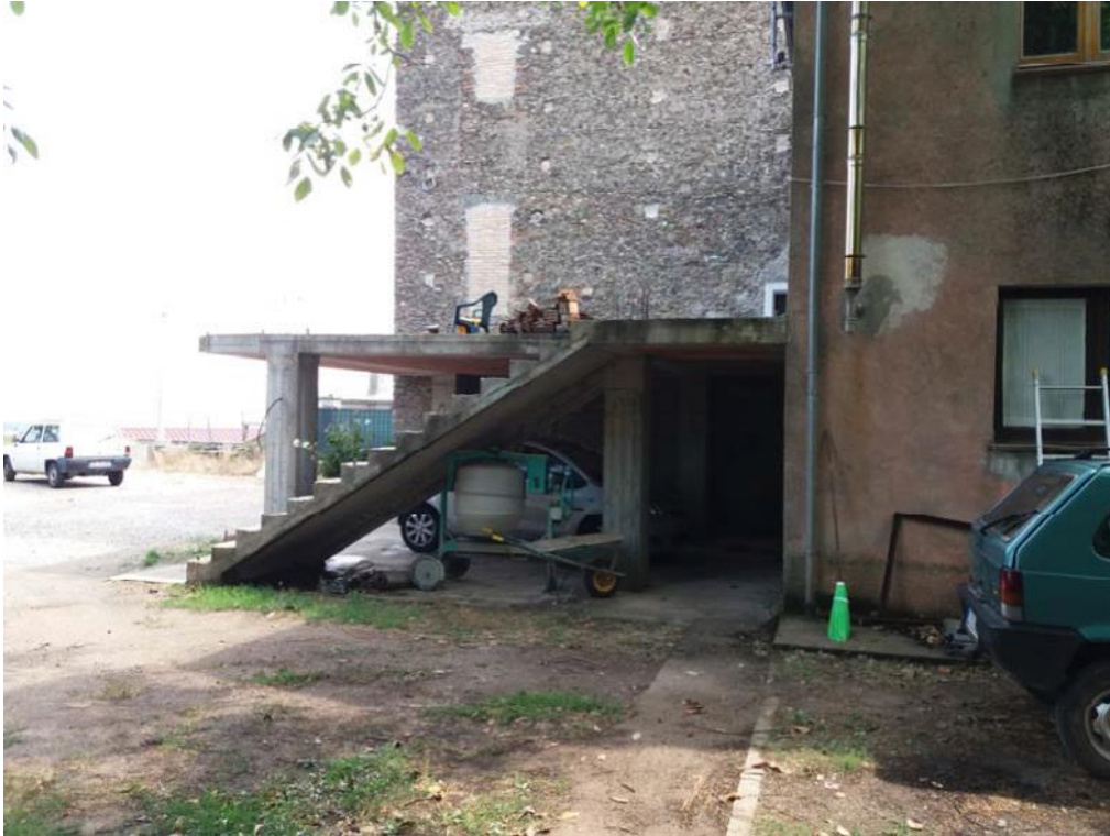
Foto n. 42: Manufatto rustico in c.a. (stralciato dalla stima, in accordo con quanto indicato nel corso dell'udienza del 25 ottobre 2017) che consente l'accesso al primo piano del corpo di fabbrica derivante dall'ampliamento dell'immobile censito in catasto dalla particella 32 del foglio di mappa 27 del comune di Decollatura.