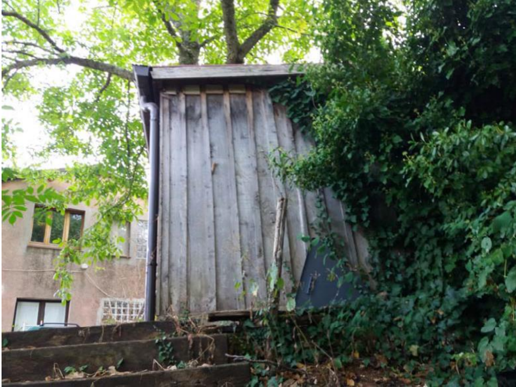
Foto n. 46: Piccolo manufatto con struttura portante in legno insistente sulla particella 515 del foglio di mappa 26 del comune di Decollatura (pignorata), ubicata in prospicenza al prospetto Nord-Ovest del fabbricato in muratura censito dalla particella 31 del foglio di mappa 27 del comune di Decollatura.