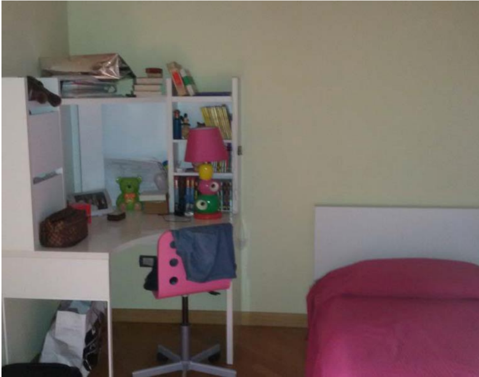
Foto n. 16: Stanza da letto (indicata con il simbolo L2 ) ubicata al piano primo dell'unità 1 del fabbricato in muratura.