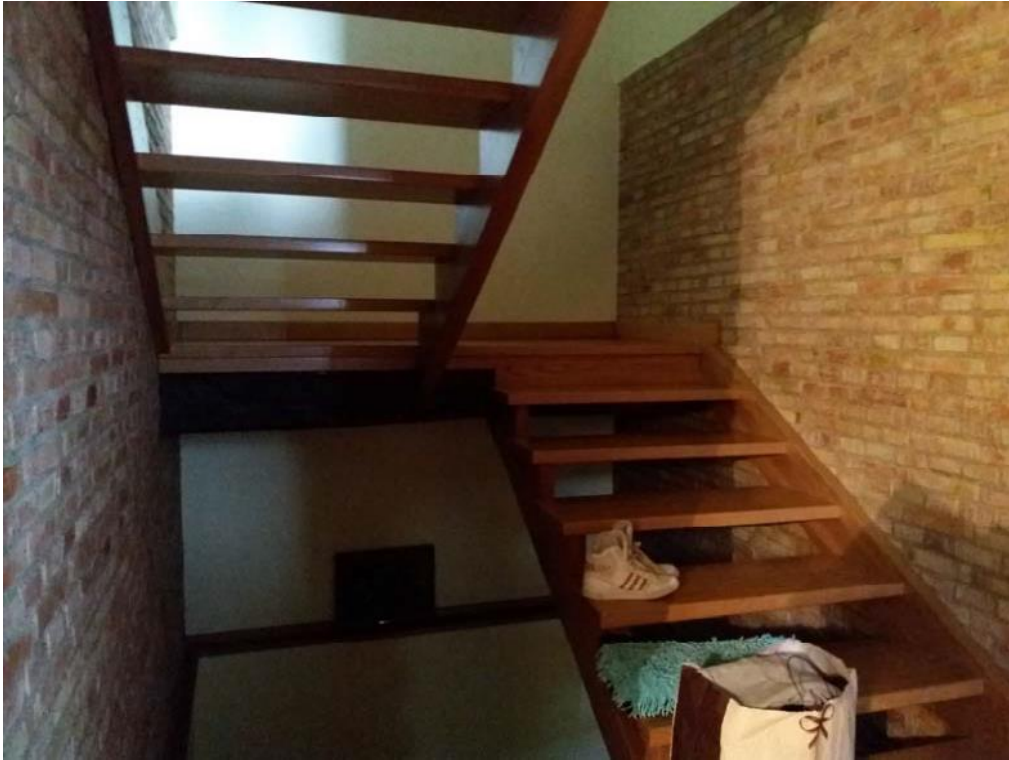
Foto n. 20: Rampe di scale che consentono il collegamento verticale diretto tra il primo piano ed il secondo piano dell'unità 1 del fabbricato in muratura.