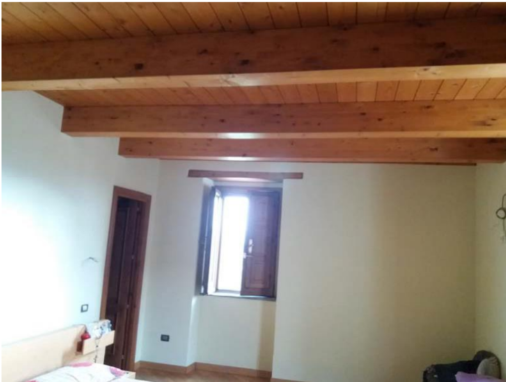
Foto n. 13: Stanza da letto (indicata con il simbolo L1 ) ubicato al primo piano dell'unità immobiliare n. 1 del fabbricato in muratura.