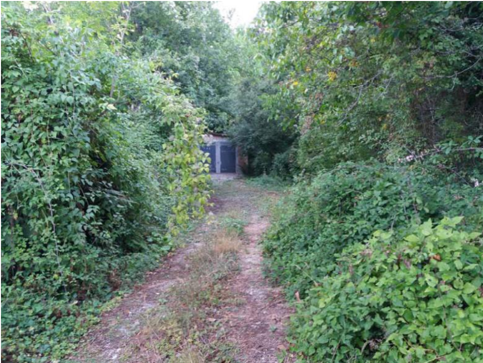
Foto n. 51: Strada di accesso al manufatto con struttura portante in acciaio (adibito a deposito) insistente sulla particella 515 del foglio di mappa 26 del comune di Decollatura .