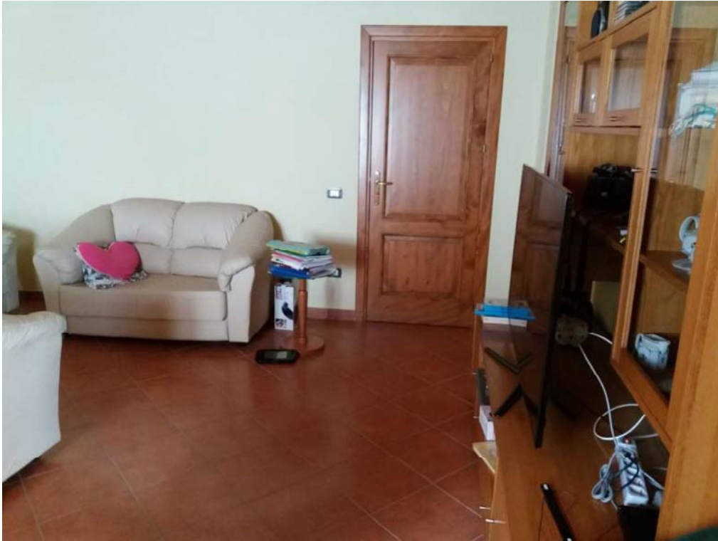
Foto n. 8: Soggiorno (indicato con la lettera S) ubicato al piano terra dell'unità immobiliare n. 1 del fabbricato in muratura.