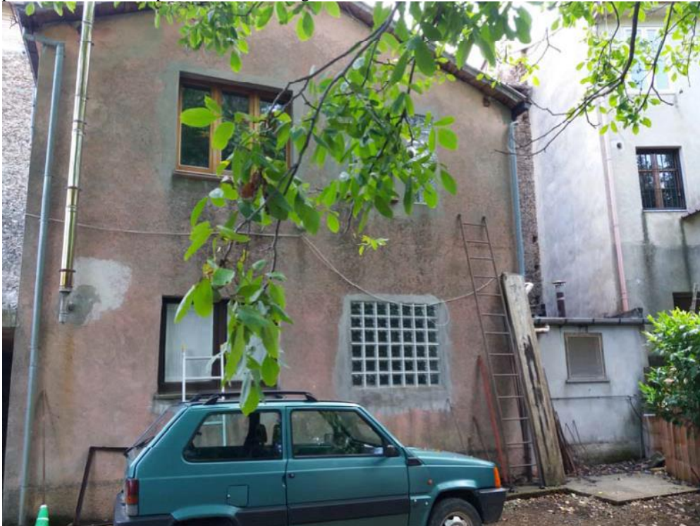
Foto n. 41: Corpo di fabbrica derivante dall'ampliamento dell'immobile censito in catasto dalla particella 32 del foglio di mappa 27 del comune di Decollatura , stralciato dalla procedura esecutiva per cui è causa a seguito dell'udienza del 25 ottobre 2017. Tale fabbricato è accessibile esclusivamente dalla particella di terreno 515 del foglio di mappa 26 del comune di Decollatura (oggetto di pignoramento).