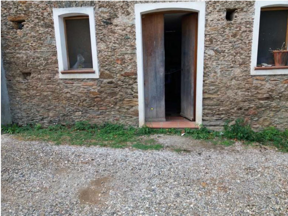
Foto n. 37: Pertinenza accessoria non direttamente collegata all'unità immobiliare principale, ubicata al piano seminterrato dell'immobile oggetto di pignoramento.