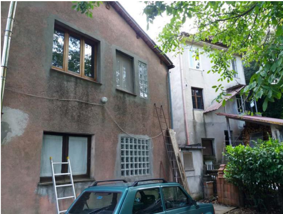
Foto n. 45: Corpo di fabbrica derivante dall'ampliamento dell'immobile censito in catasto dalla particella 32 del foglio di mappa 27 del comune di Decollatura, stralciato dalla procedura esecutiva per cui è causa a seguito dell'udienza del 25 ottobre 2017.