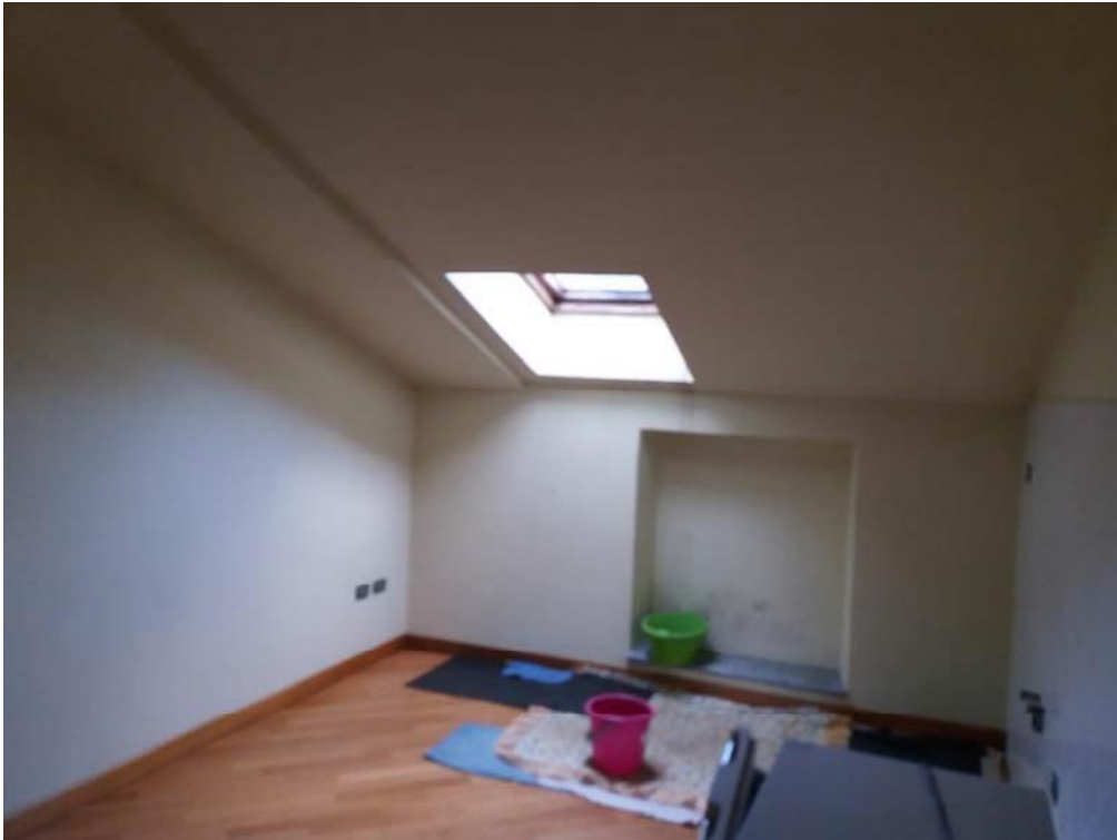
Foto n. 23: Vano (indicato con il simbolo S4) ubicato al secondo piano dell'unità 1 del fabbricato in muratura.