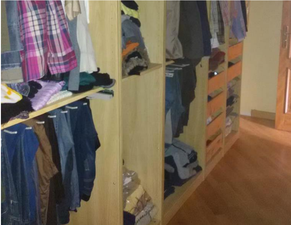
Foto n. 14: Cabina armadio (indicata con il simbolo Cab ) ubicata al primo piano dell'unità 1 del fabbricato in muratura.