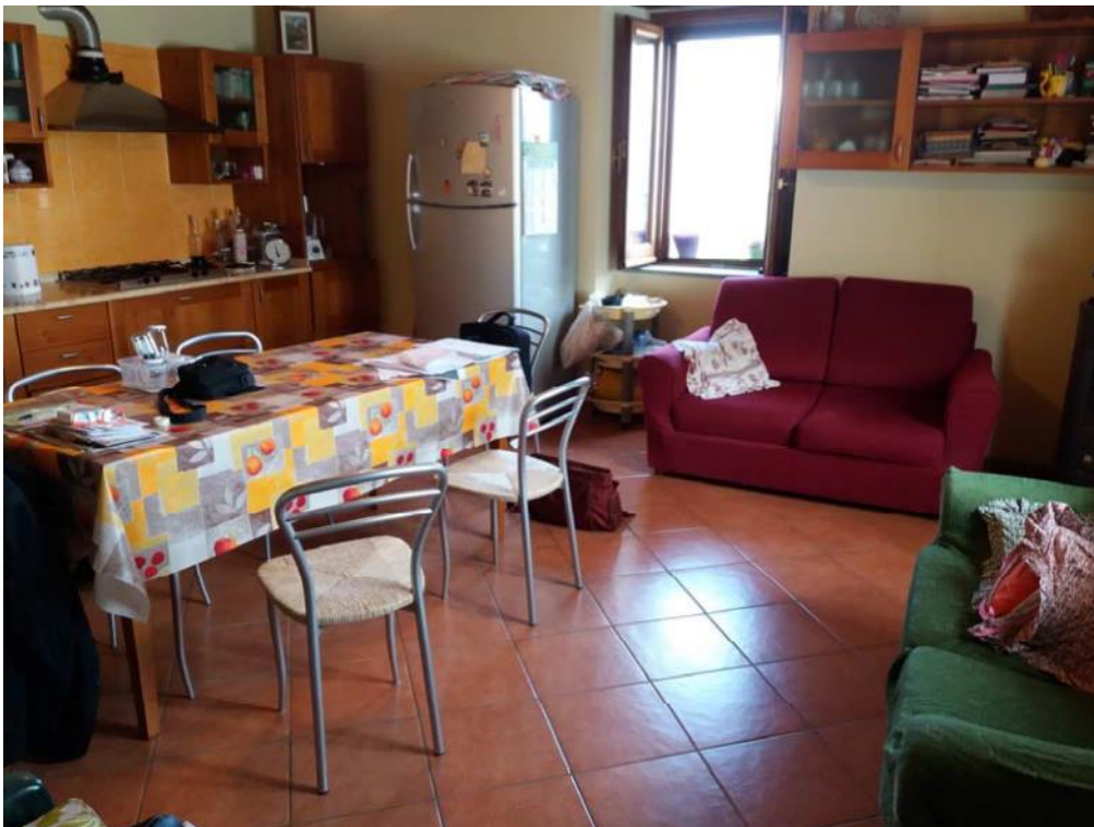
Foto n. 5: Cucina (indicata con la lettera K ) ubicata al piano terra dell'unità immobiliare n. 1 del fabbricato in muratura.