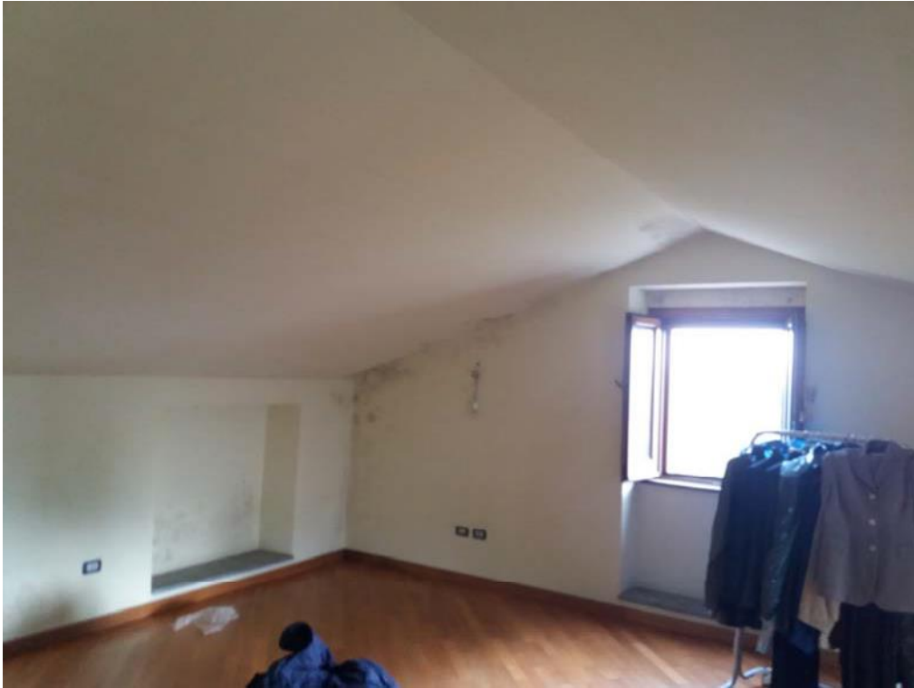
Foto n. 22: Vano (indicato con il simbolo S5) ubicato al secondo piano dell'unità 1 del fabbricato in muratura; si nota della condensa sulle pareti perimetrali.