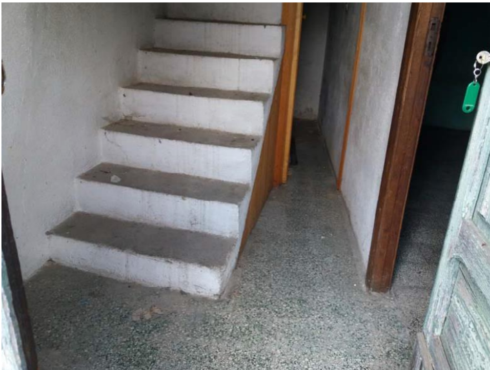
Foto n. 31: Ingresso, indicato con il simbolo I2 , ubicato al piano primo dell'unità 2 del fabbricato in muratura.