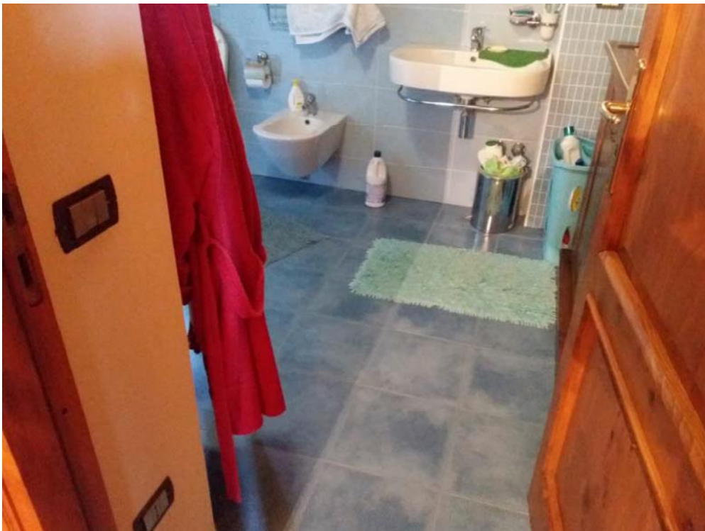
Foto n. 17: Bagno (indicato con il simbolo WC2 ) ubicato al piano primo dell'unità 1 del fabbricato in muratura.