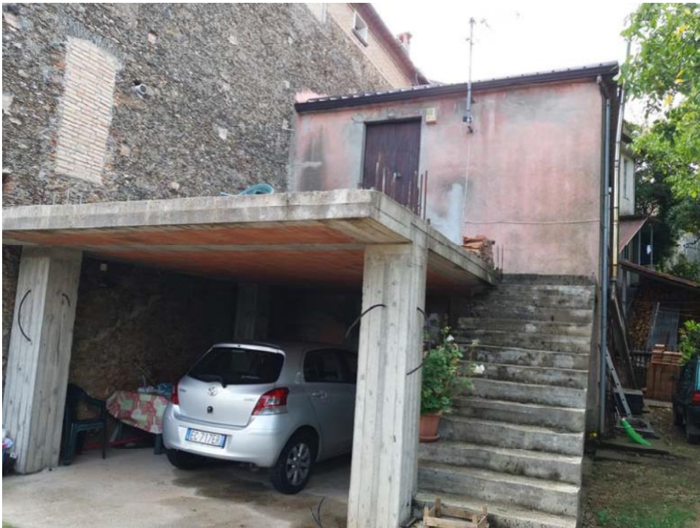
Foto n. 43: Manufatto rustico in c.a. (stralciato dalla stima, in accordo con quanto indicato nel corso dell'udienza del 25 ottobre 2017) che consente l'accesso al primo piano del corpo di fabbrica derivante dall'ampliamento dell'immobile censito in catasto dalla particella 32 del foglio di mappa 27 del comune di Decollatura.