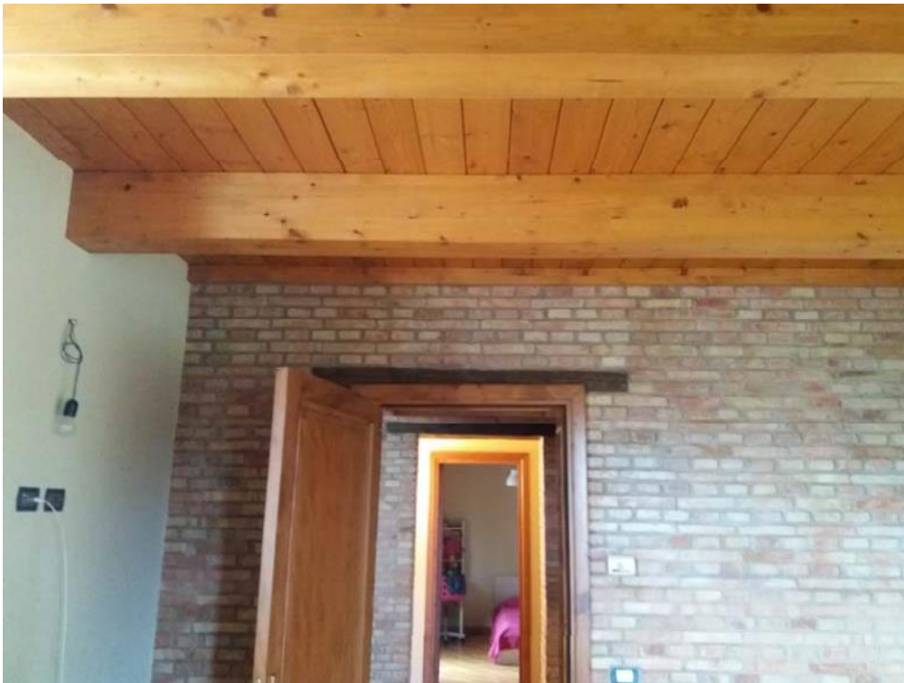
Foto n. 15: Intradosso solaio in legno stanza da letto (indicata con il simbolo L1 ) ubicata al primo piano dell'unità 1 del fabbricato in muratura.