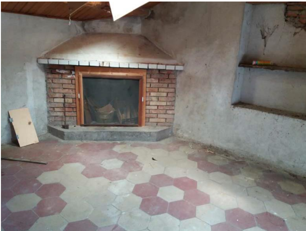
Foto n. 35: Caminetto ubicato nella stanza, indicata con il simbolo S3 , ubicato al piano secondo dell'unità 2 del fabbricato in muratura.