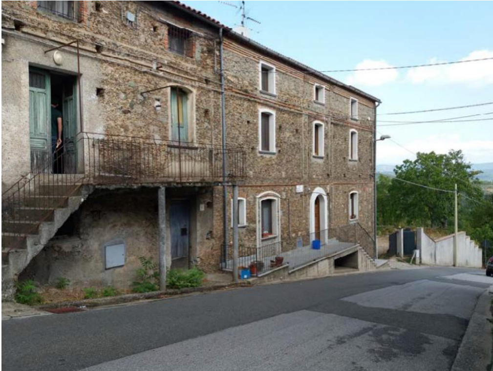
Foto n. 4: Fabbricato in muratura costituito di tre piani fuori terra e censito in catasto fabbricati dalla particella 31, foglio di mappa 27 del comune di Decollatura.