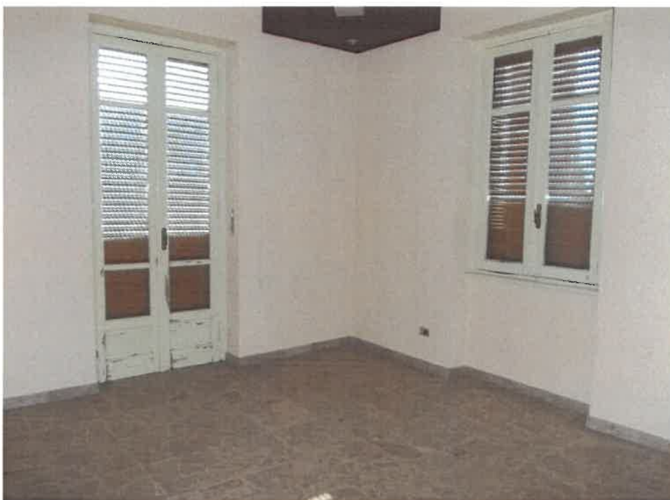
Foto 16 Camera alloggio sub.7