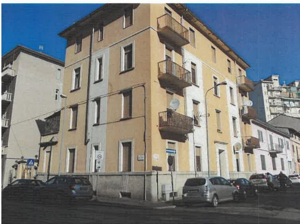
Foto 2 Prospetto fabbricato da Via D'Angennes-Via Maggioli