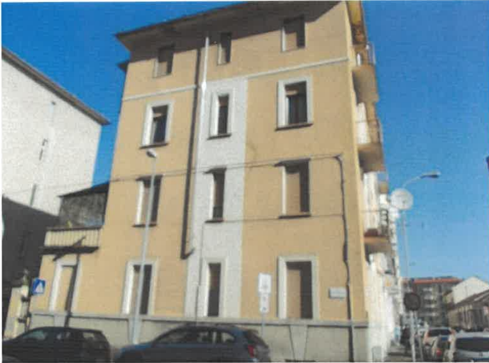
Foto 3 Prospetto fabbricato da Via Maggioli