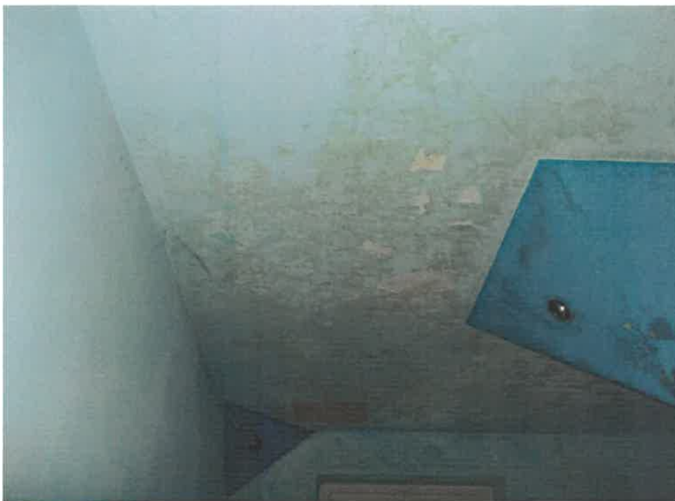
Foto 12 Particolare infiltrazione soletta cucina alloggio sub.7