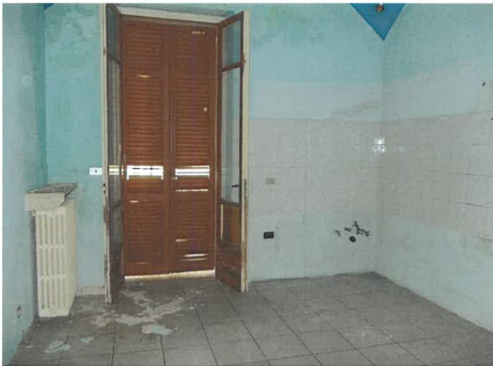
Foto 10 Cucina alloggio sub.7