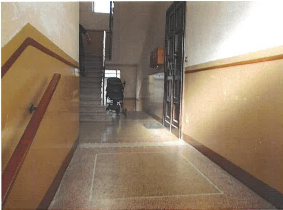
Foto 6 Androne ingresso Via D'Angennes n.15