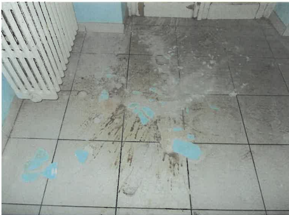
Foto 13 Particolare infiltrazione soletta cucina su pavimento alloggio sub.7