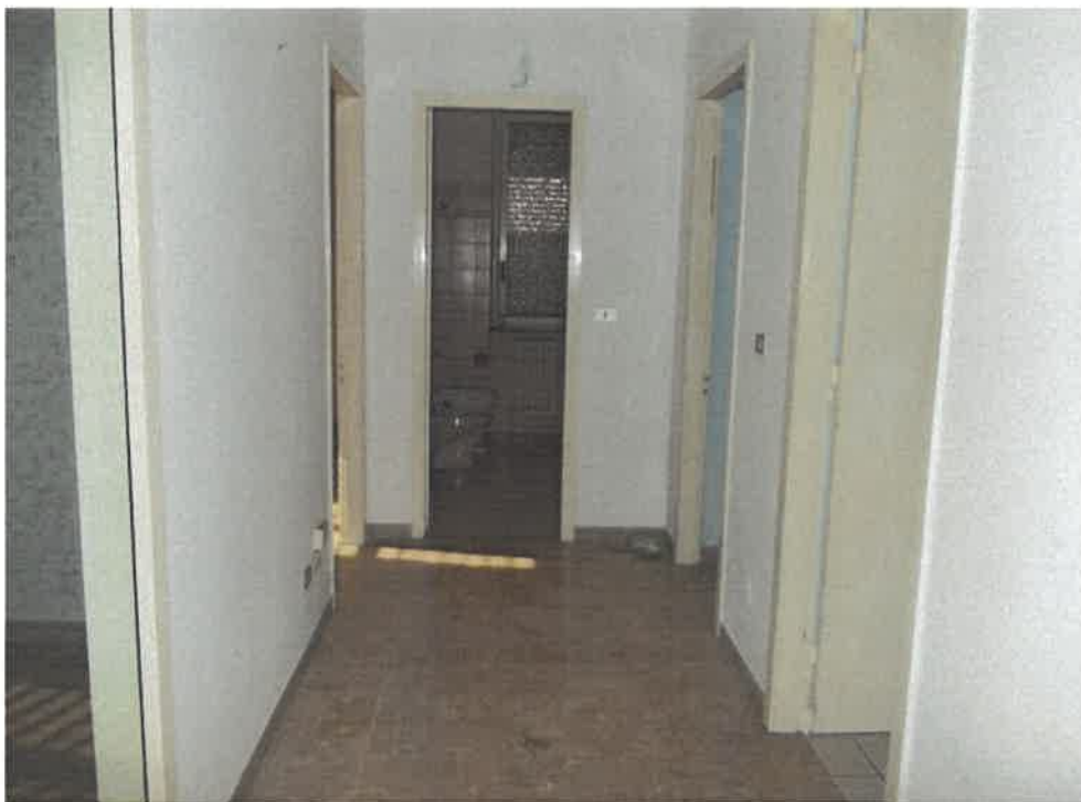
Foto 8 Corridoio alloggio sub.7