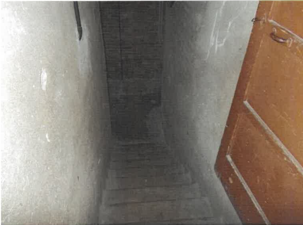
Foto 17 Scala accesso piano cantine S1