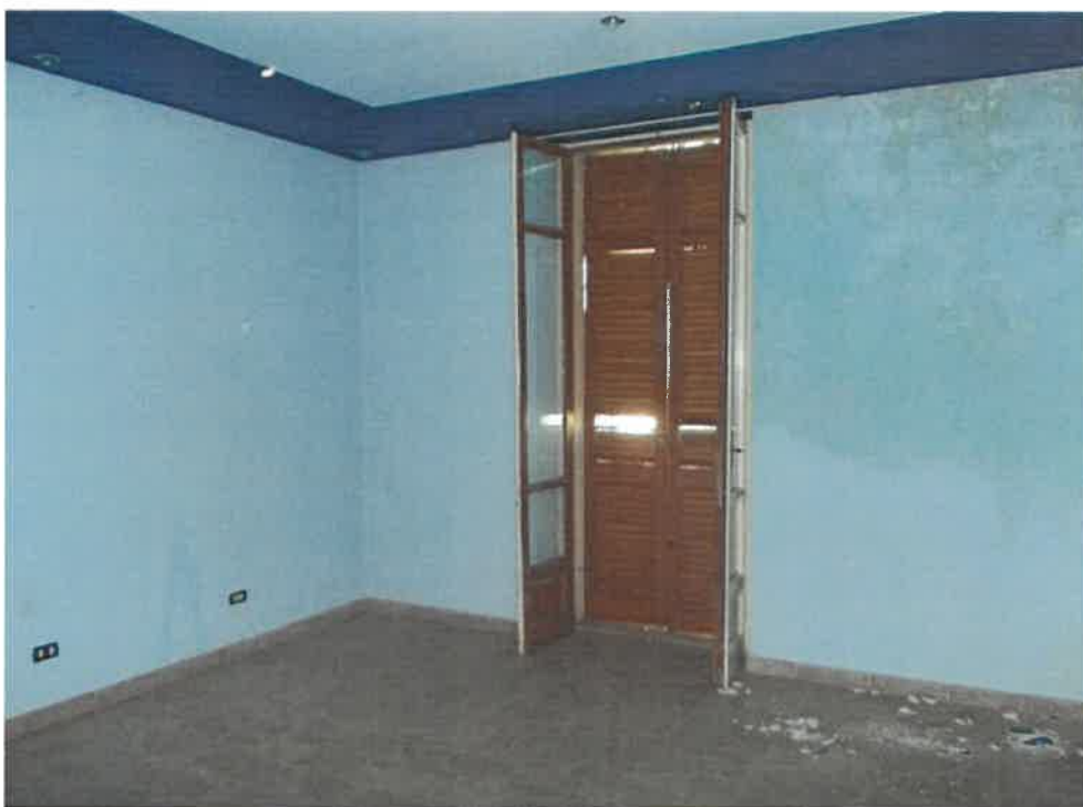
Foto 14 Camera con finestra chiusa alloggio sub.7