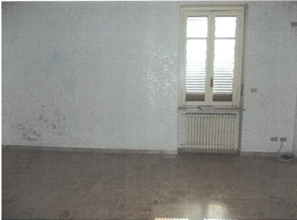
Foto 9 Sala alloggio sub.7