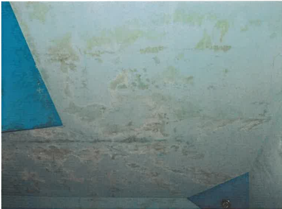
Foto 11 Particolare infiltrazione soletta cucina alloggio sub.7