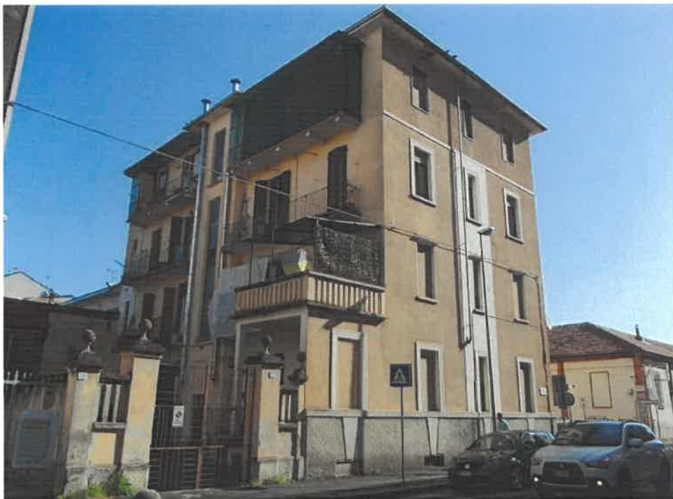
Foto 4 Prospetto fabbricato da Via Maggioli