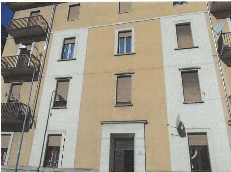
Foto 1 Prospetto fabbricato da Via D'Angennes civ. n.15