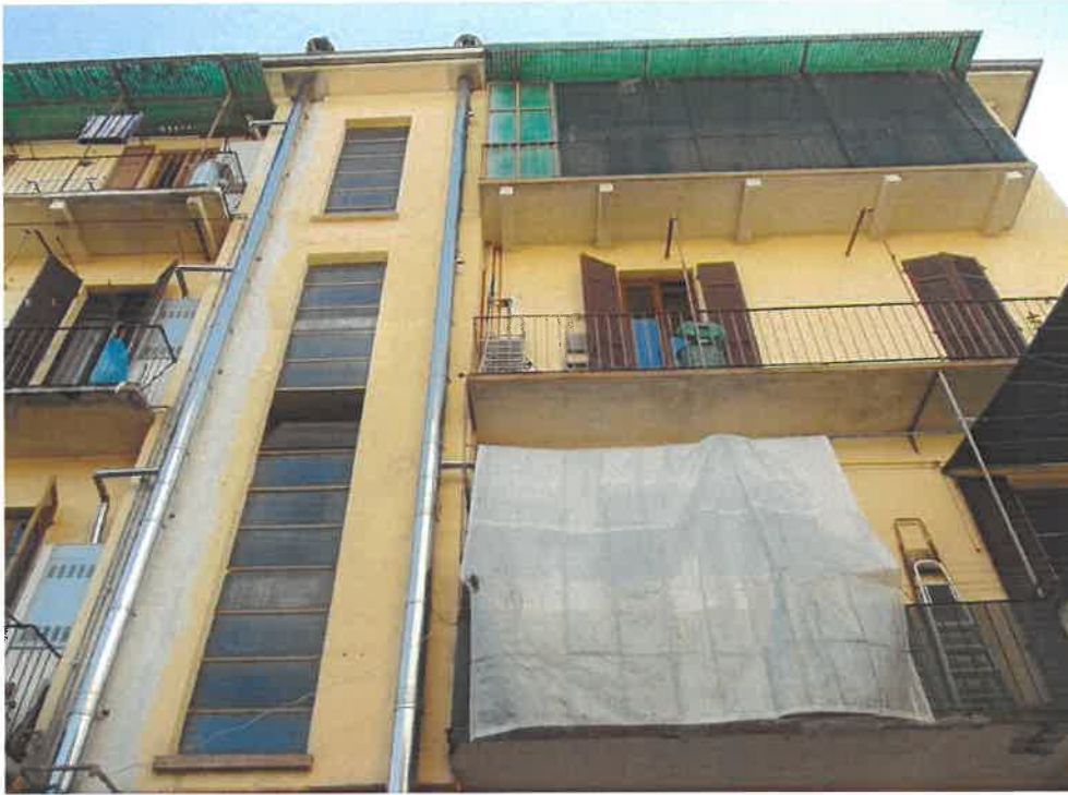
Foto 5 Prospetto fabbricato da cortile interno