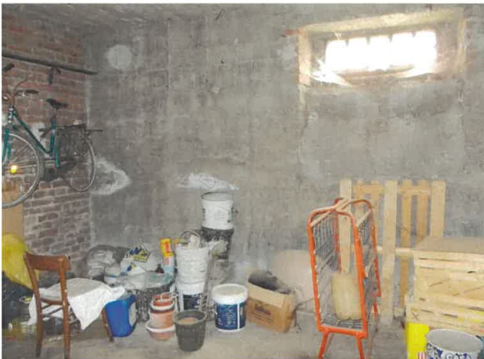
Foto 18 Cantina sub.7 piano S1