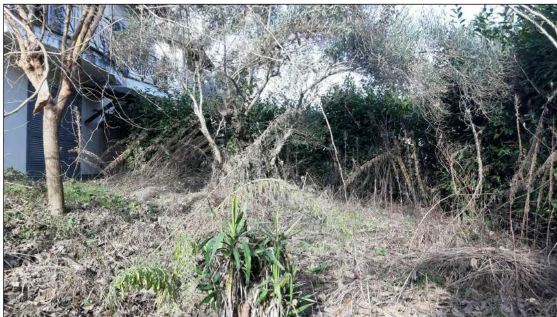
foto 5 - dettaglio con evidente stato di abbandono del giardino pertinenziale.