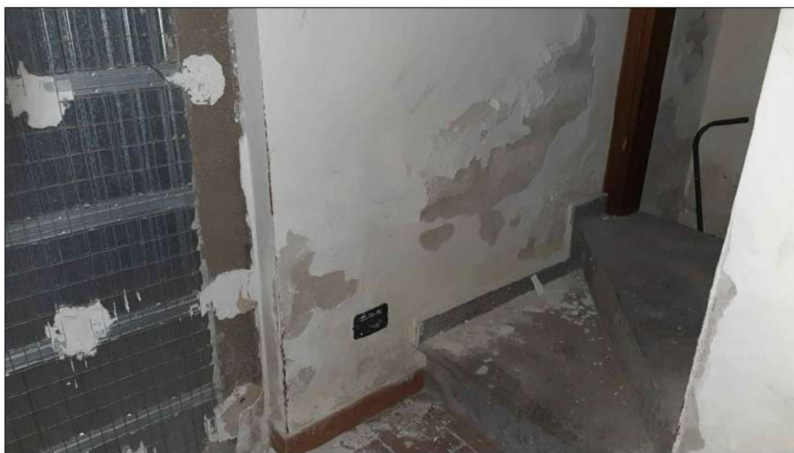
foto 18 - come sopra in prossimità della scala di collegamento al piano terra.