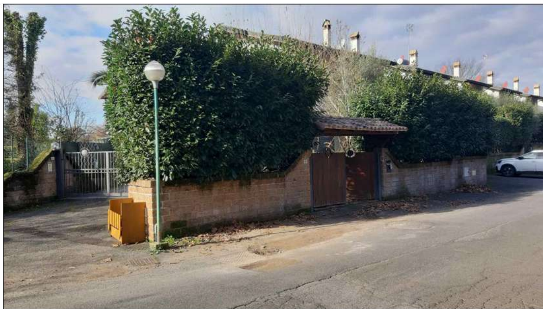
foto 1 - vista esterna dell'ingresso da Viale Giuseppe Verdi.