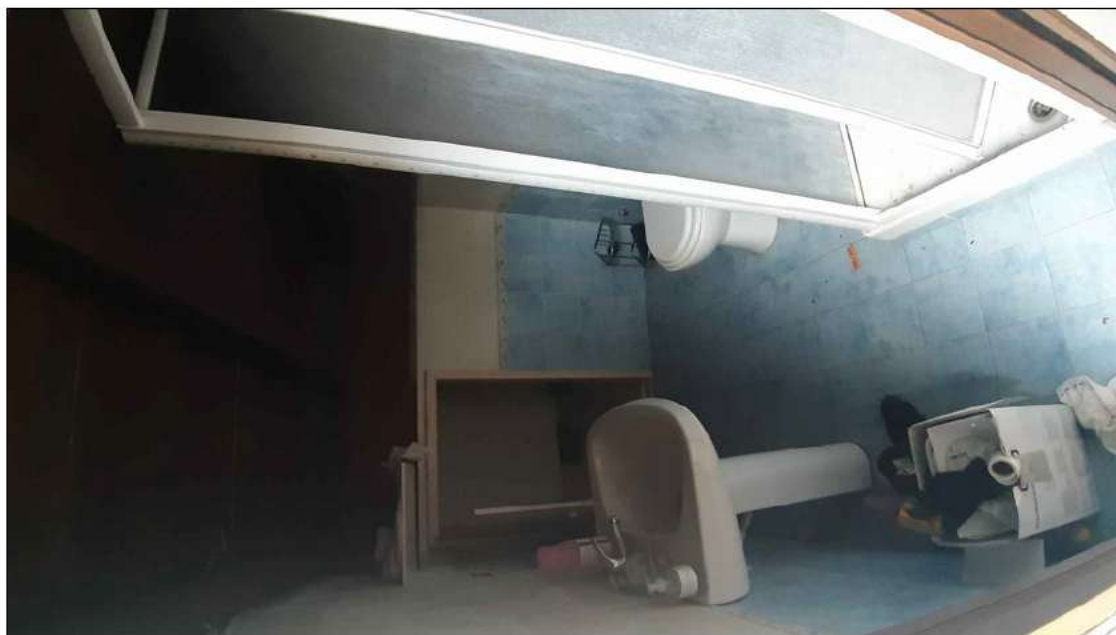
foto 29 - vista del piccolo bagno posto al piano secondo.