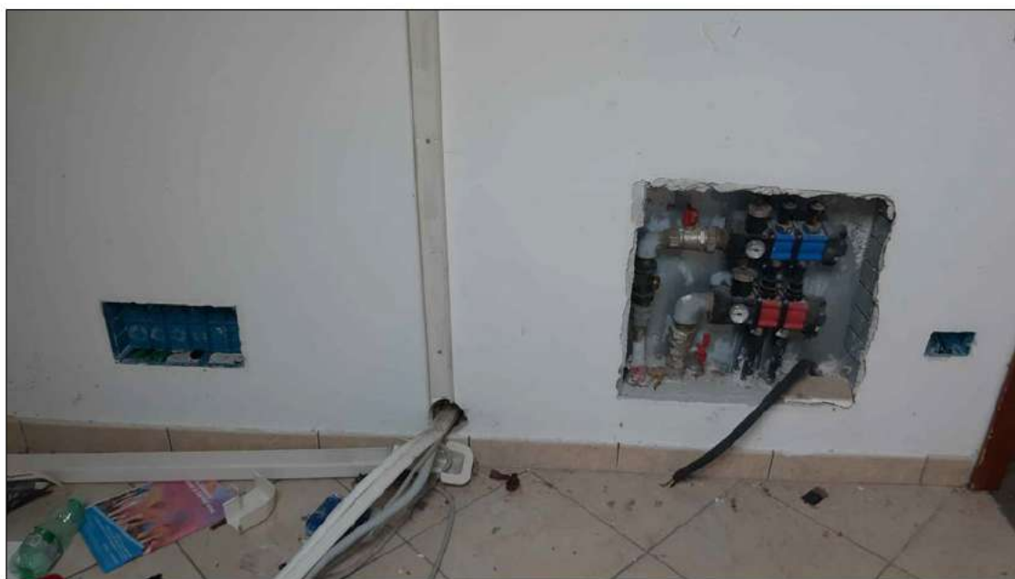
foto 30 - particolare che evidenzia lo stato attuale degli impianti al piano secondo.