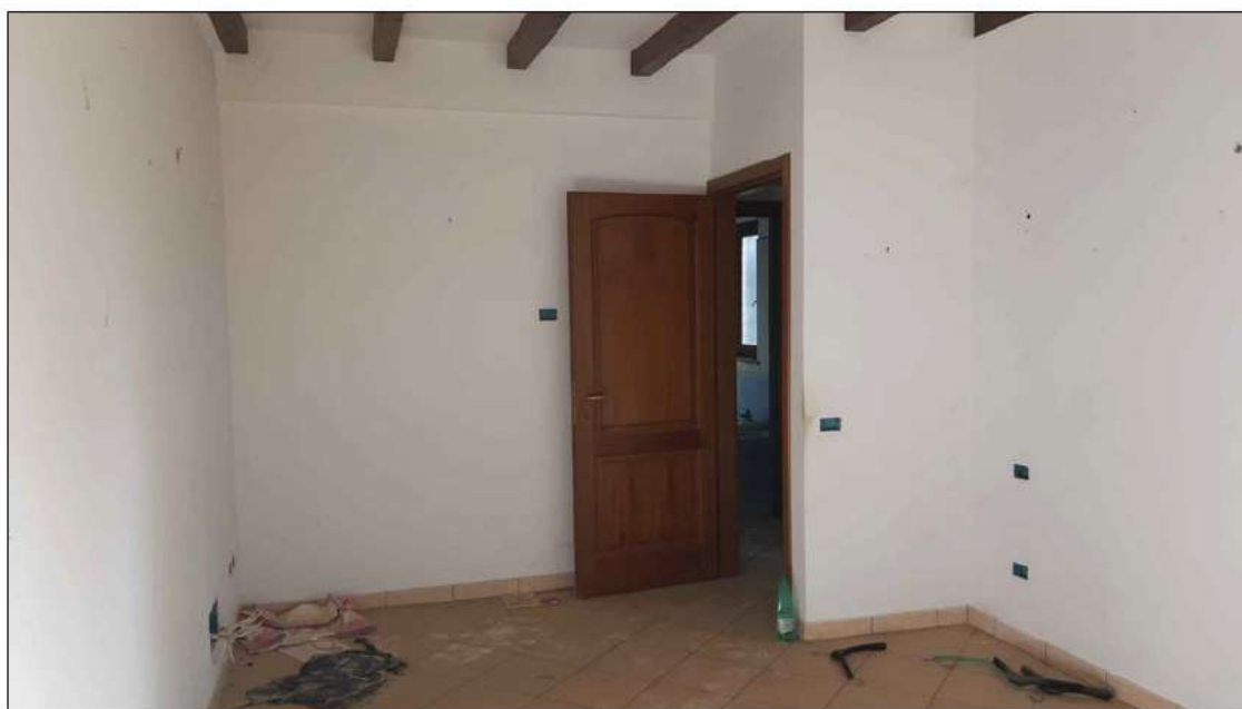
foto 24 - vista interna della camera n.2 posta al piano primo.