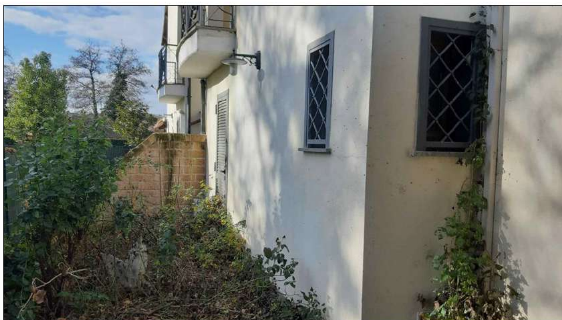
foto 6 - vista del locale tecnico con accesso dal giardino pertinenziale.