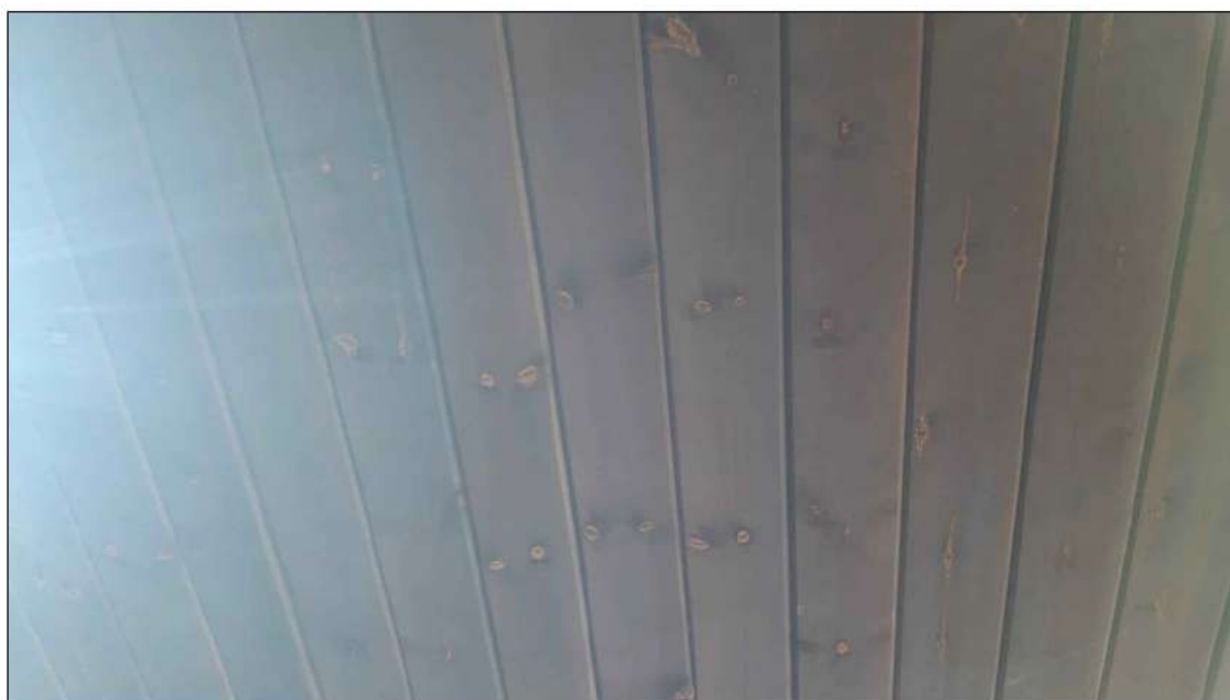
foto 8 - particolare degli elementi in legno della tettoia con evidente presenza di tarli.