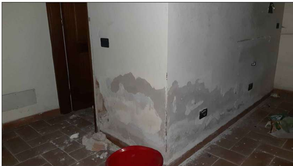
foto 17 - particolare che evidenzia gli importanti problemi di umidità da risalita nei locali posti nel seminterrato.