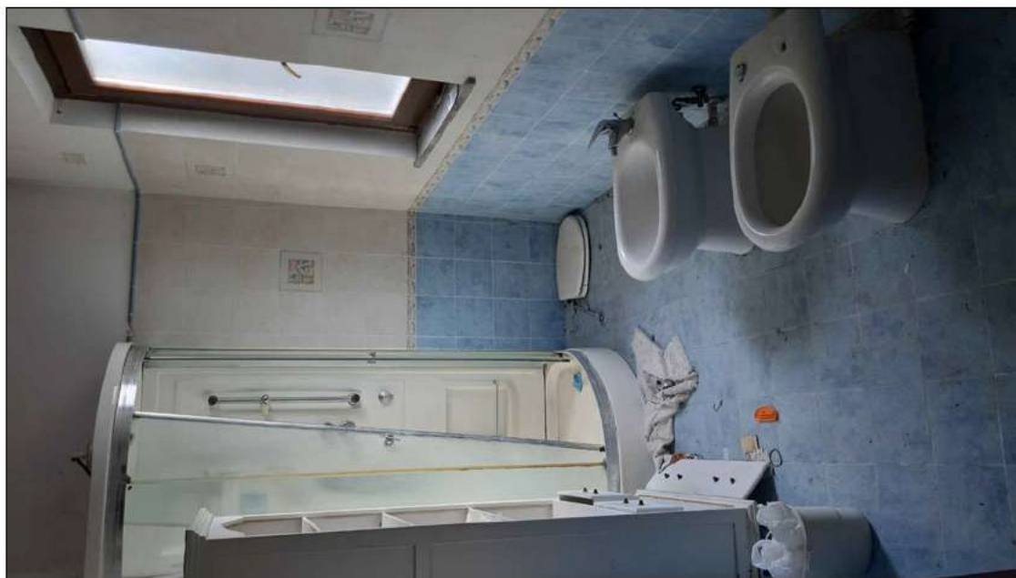
foto 23 - vista del bagno al piano primo.