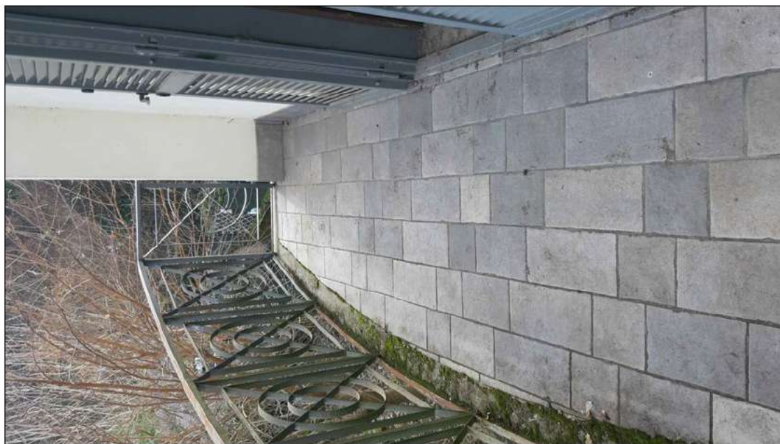
foto 21 - particolare del balcone posto al primo piano accessibile dalla camera da letto n.1.