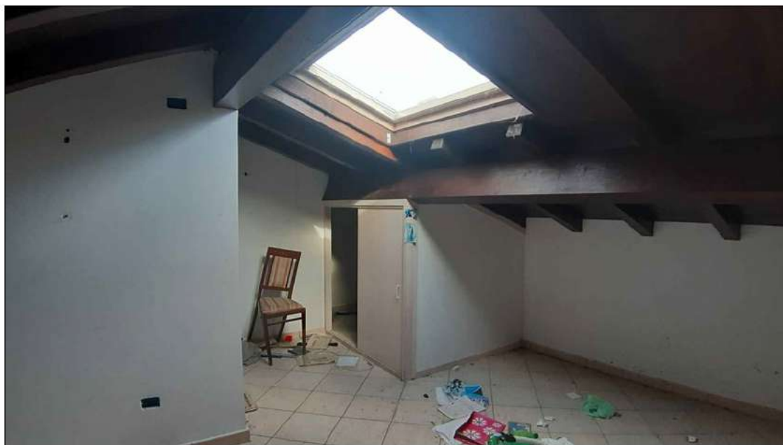
foto 27 - vista del locale sottotetto posto al piano secondo / soffitta.