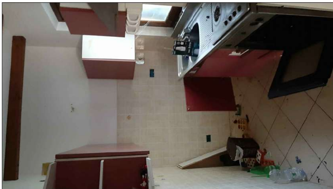
foto 11 - particolare della cucina al piano terra.