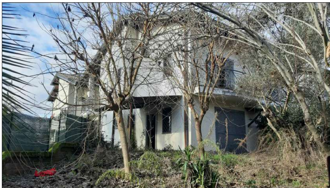
foto 3 - vista interna all'ingresso del giardino pertinenziale dell'abitazione.