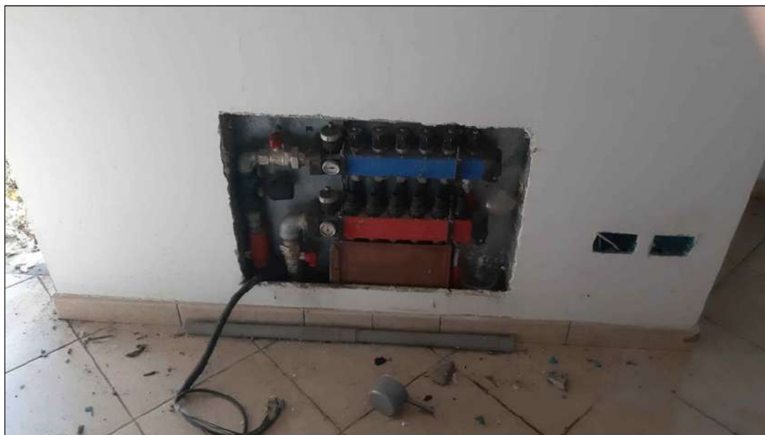
foto 13 - particolare della centralina di derivazione del riscaldamento in parte vandalizzata.