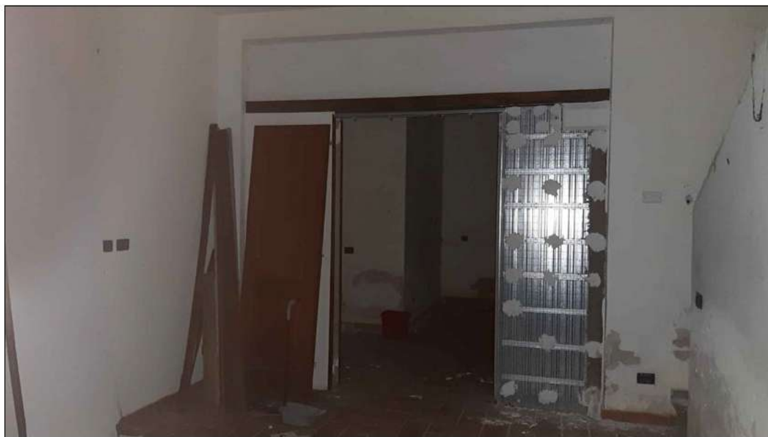
foto 15 - vista interna del locale posto nel piano seminterrato.