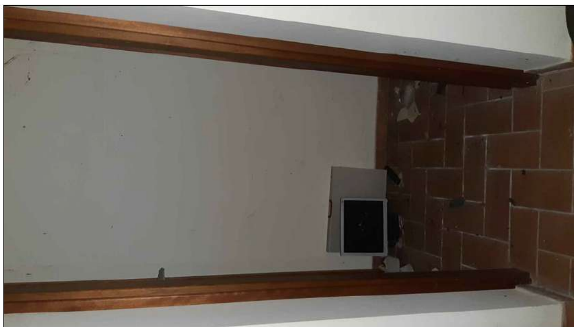
foto 19 - vista del piccolo ripostiglio al piano seminterrato.