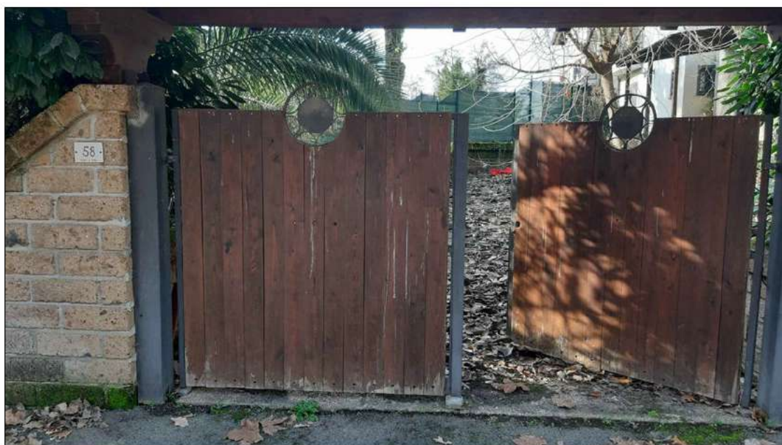
foto 2 - particolare del cancello d'ingresso carrabile all'immobile in profilati metallici e legno.