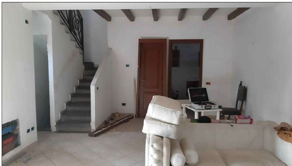
foto 9 - vista interna del soggiorno posto al piano terra.