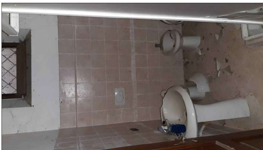
foto 20 - bagno presente nel piano seminterrato vandalizzato.