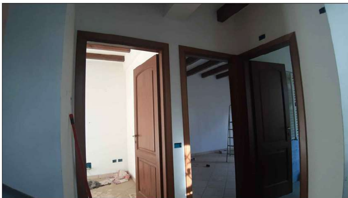
foto 25 - particolare del disimpegno al primo piano.