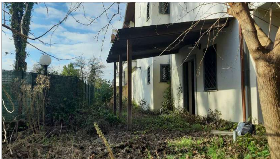
foto 7 - vista della tettoia in legno posta nel giardino.