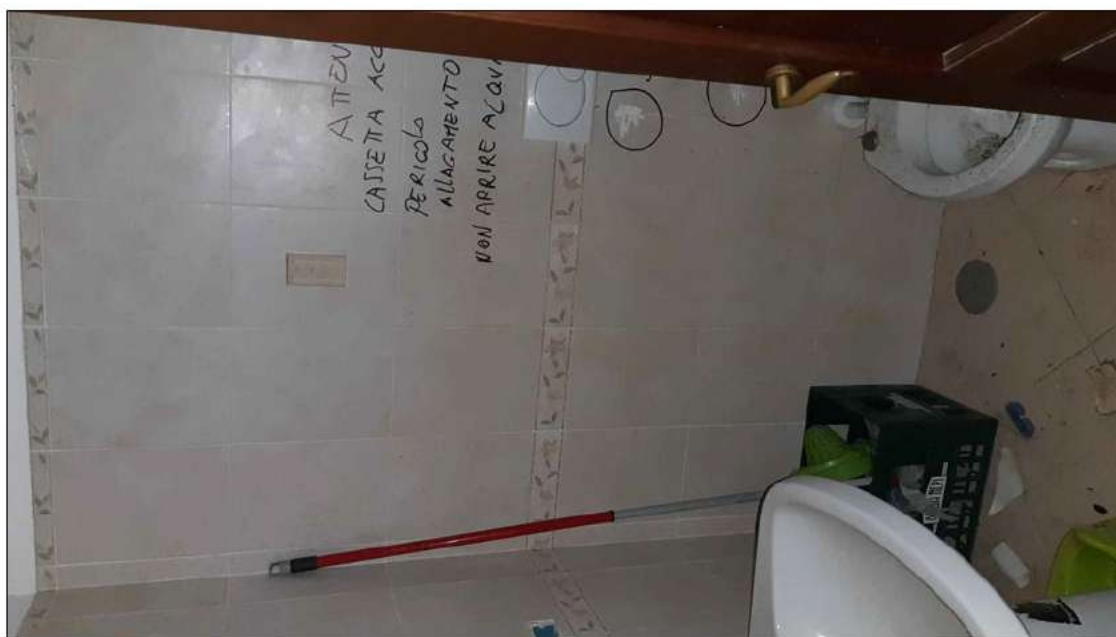
foto 12 - vista del bagno al piano terra.