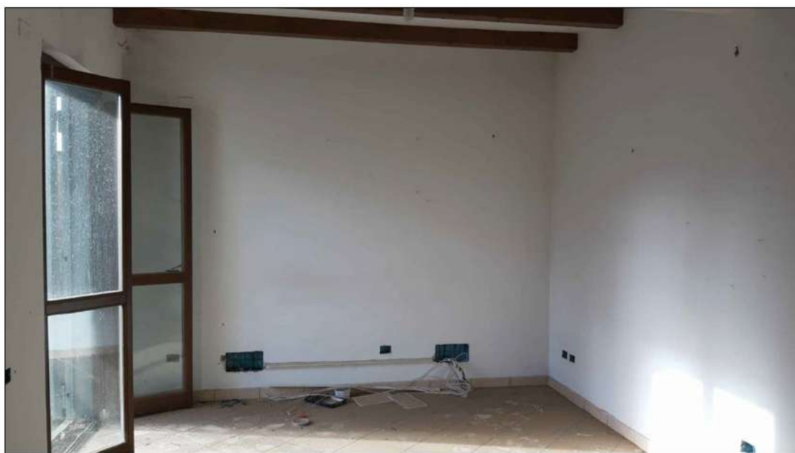
foto 22 - vista della camera da letto n.1 posta al piano primo.