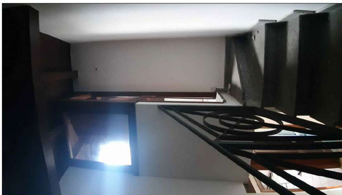
foto 26 - dettaglio della scala che raggiunge il piano secondo.