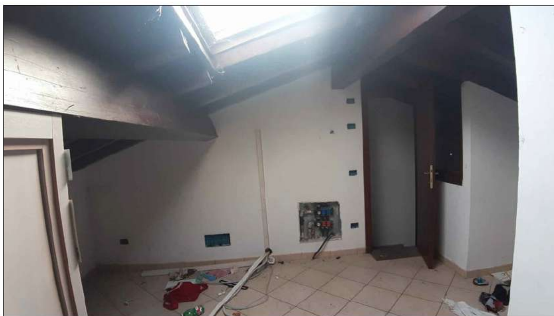
foto 28 - altra vista del secondo piano.