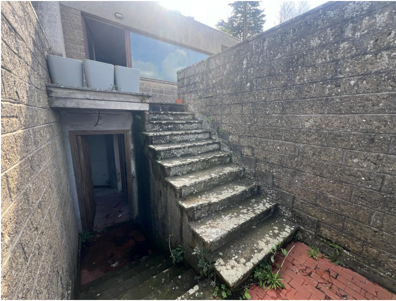
Monolocale in ristrutturazione privo dei requisiti igienico sanitari per la destinazione residenza, piano intermedio tra piano seminterrato e terra: