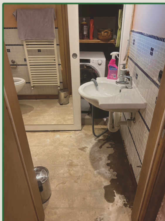
Situazione sottofondo pavimento bagno al piano seminterrato in data 02/08/2024 e confronto dopo breve precipitazione in data 07/08/2024.