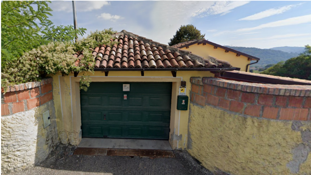
Ingresso box auto Strada Comunale