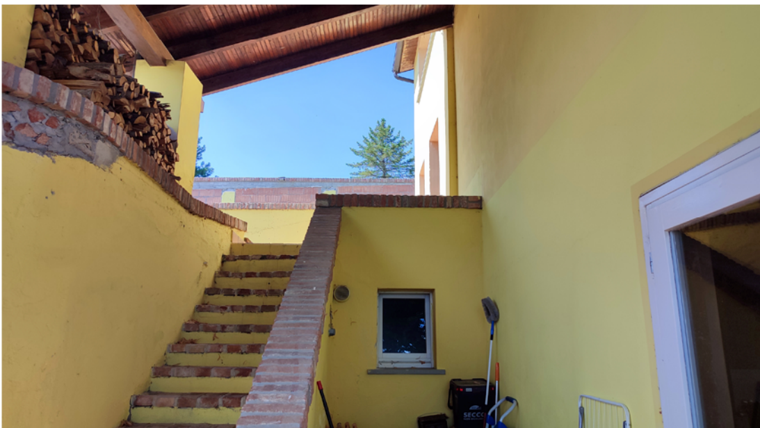
Accesso esterno al piano seminterrato - finestrella servizio igienico sotto scala/ingresso