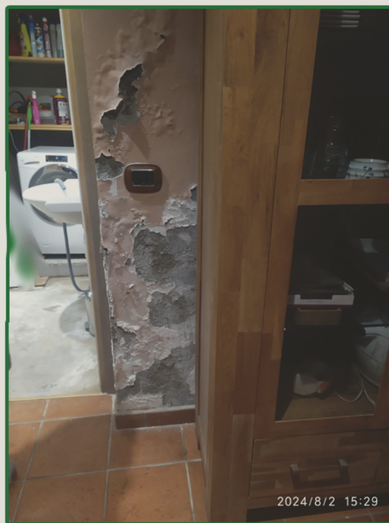
Muro e pavimento cantinetta a piano seminterrato - danni da infiltrazioni muro a confine con il bagno