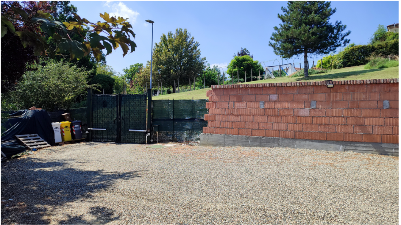
Cortile e accesso carraio su strada comunale della Maggiore