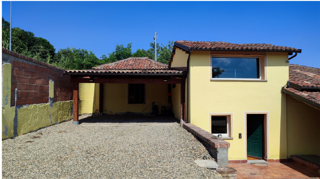
Abitazione ingresso principale