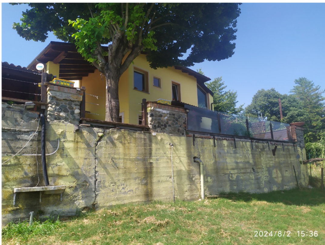
vista abitazione da primo terrazzamento e muro di sostegno