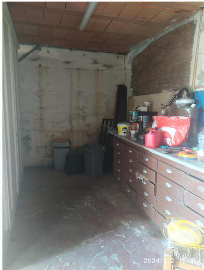
interno deposito attrezzi