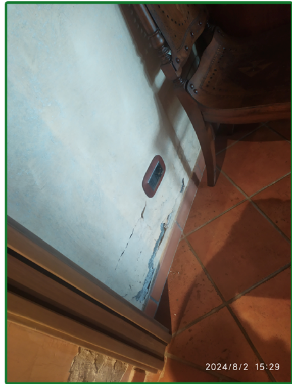
Danni da infiltrazioni - piano seminterrato