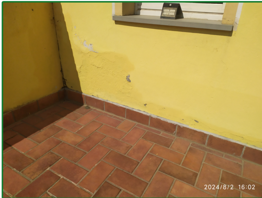
Muro esterno - ingresso principale all'abitazione - piano rialzato