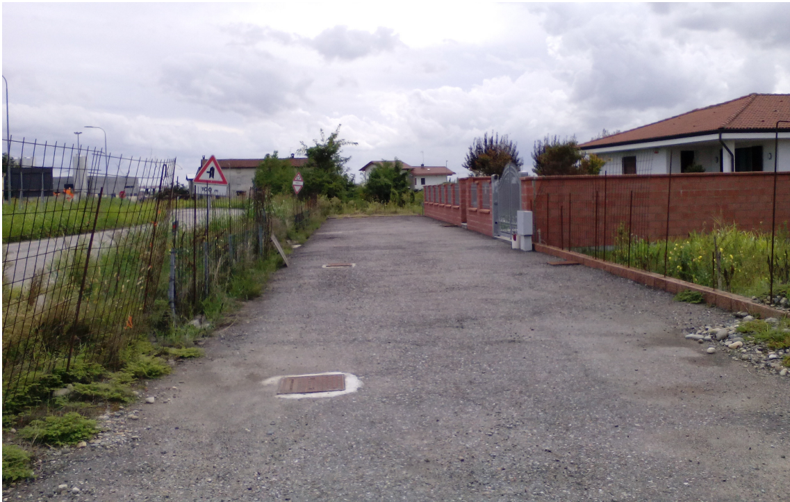
Fotografia delle Particelle 393 e 396, tramite lavori edili e impiantistici è stata creata una strada a servizio di questi terreni.