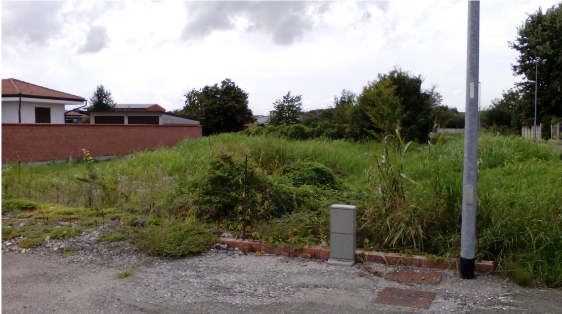
Fotografia delle Particelle 387 e 391 riprese dalla strada di recente realizzazione. Trattasi di terreno pianeggiante e di forma regolare.