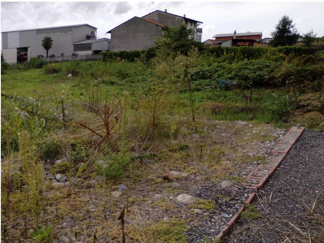
Foto delle Particelle 394 e 389. I terreni non sono utilizzati da diversi anni.