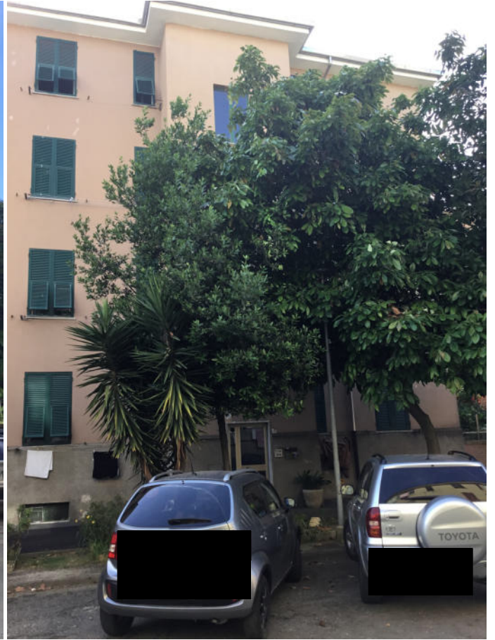
Foto n° 4 e 5– Dettaglio prospetto Est del fabbricato – Ingresso civico n. 5