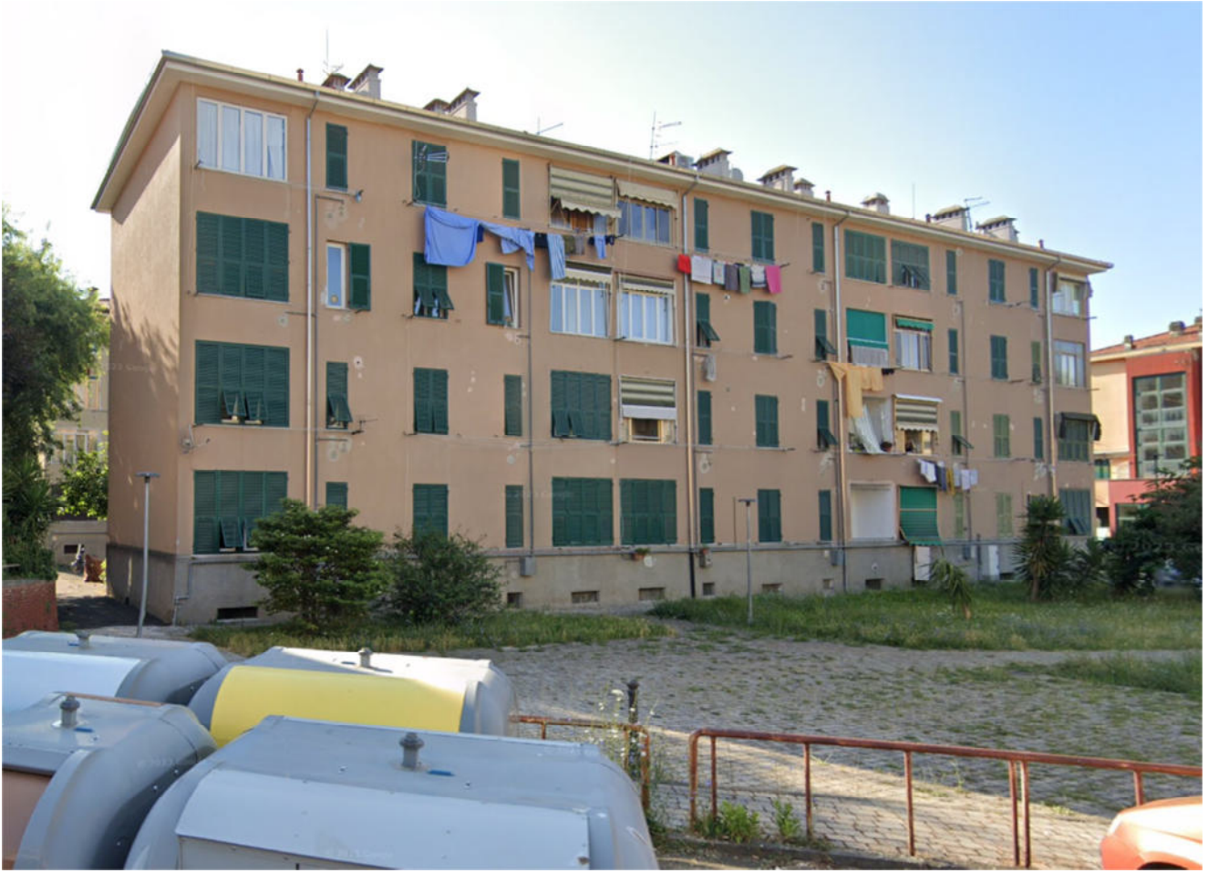
Foto n° 3 – Prospetto Ovest del fabbricato distinto dal mappale 439 del fg. 22