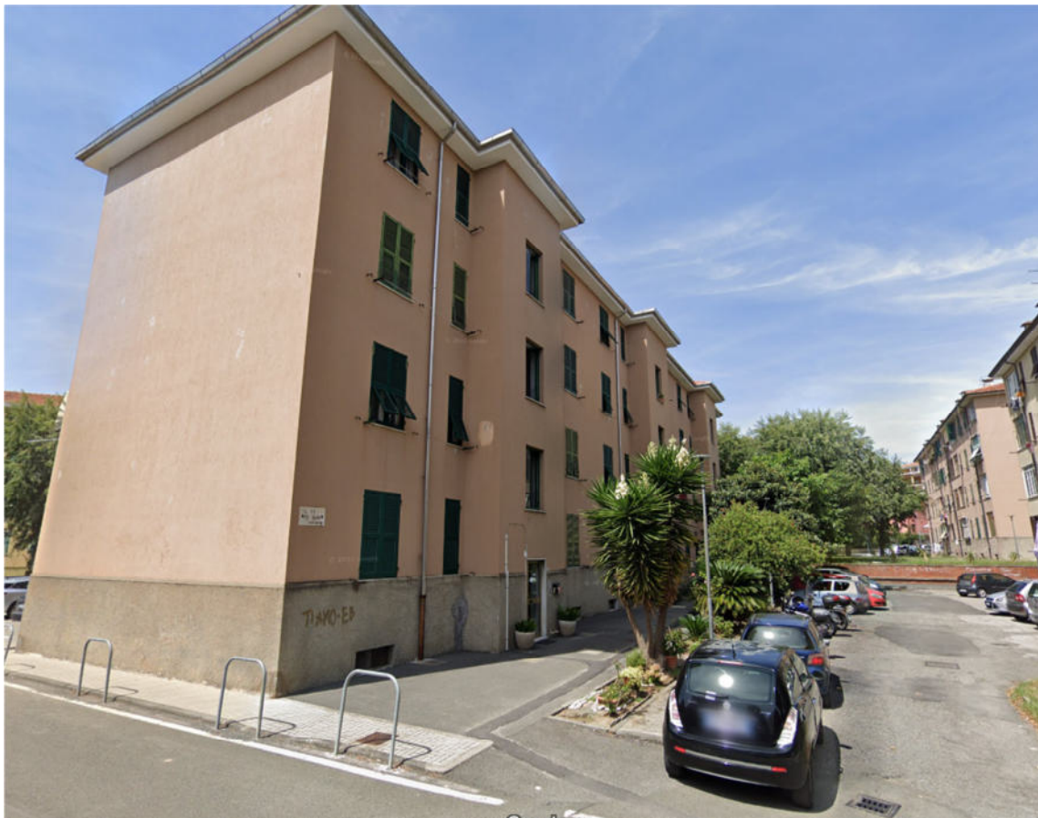
Foto n° 2 – Prospetto Est del fabbricato distinto dal mappale 439 del fg. 22