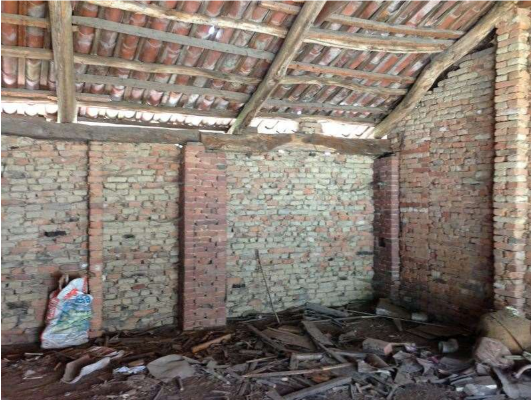
Foto n°13: SOTTOTETTO A NUDO TETTO LOTTO 4 e LOTTO 5 FABBRICATO CENSITO AL NCT FG.2 MAPP.LI NN. 373 E 310 NCEU FG. 2 MAPPALI N.373 SUB.1-SUB.2-SUB.3-SUB.4 - FOTO FABBRICATO- VISTA DALL'ESTERNO