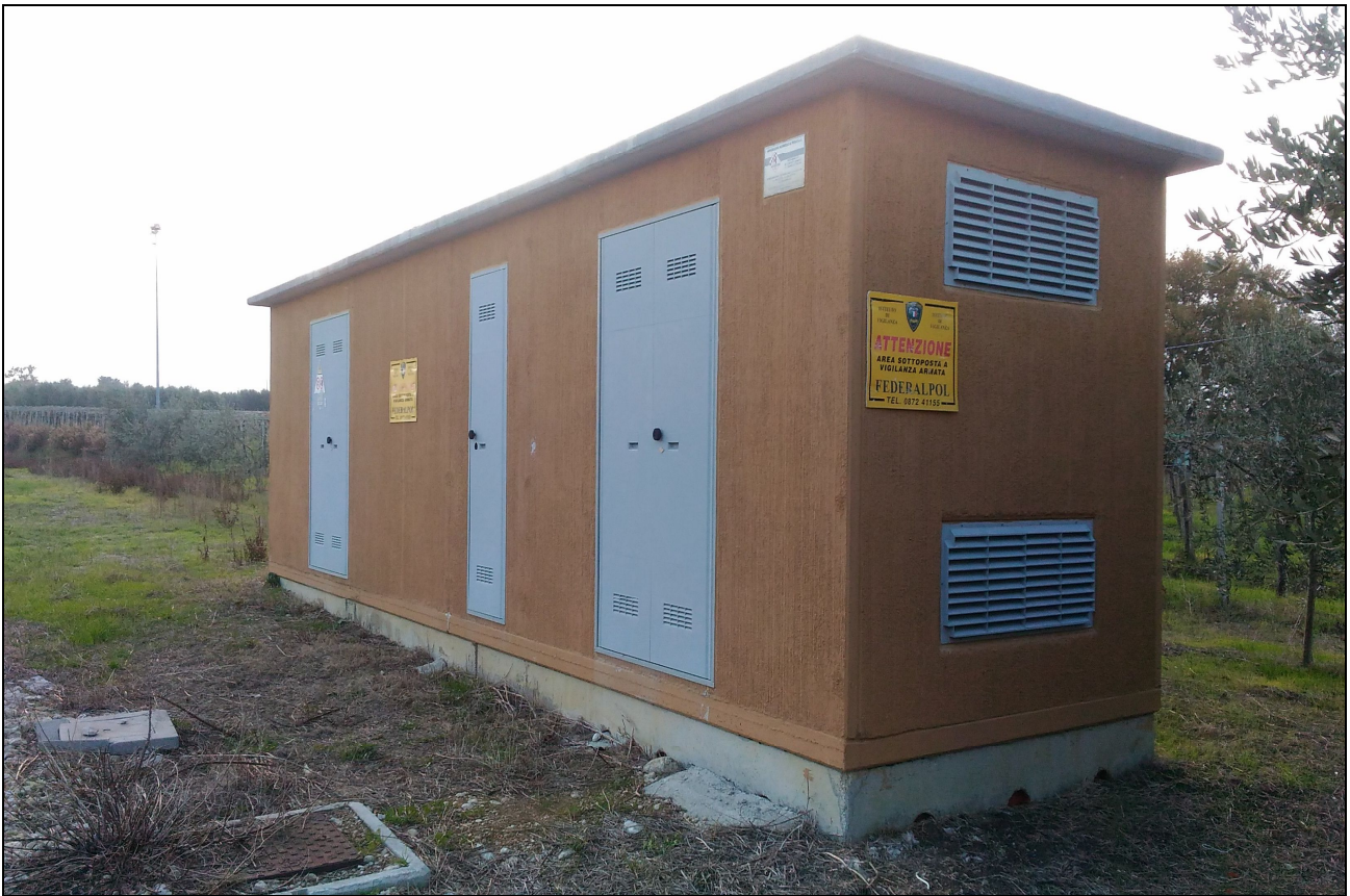
Vista esterna – Manufatto adibito all'alloggiamento dei servizi tecnici dell'impianto FV