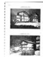
Fotografie ante intervento da cui si nota l'andamento degradante del terreno