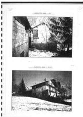
Fotografie ante intervento da cui si nota l'andamento degradante del terreno